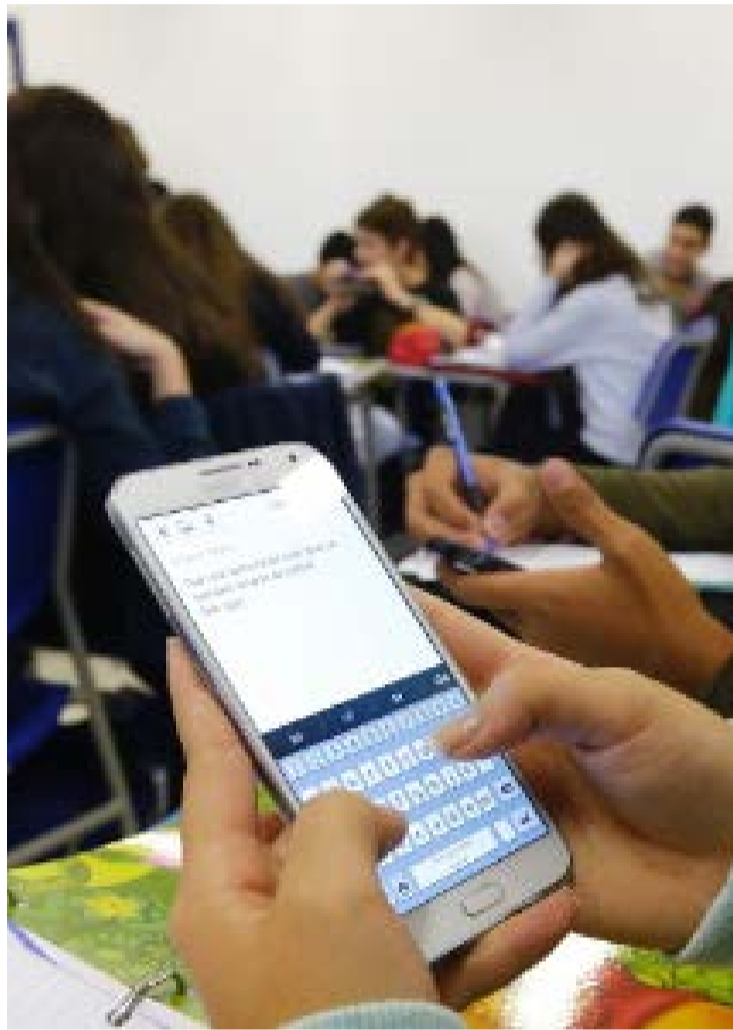
Apesar dos resultados positivos, 39% dos gestores relatam dificuldades para obter o cumprimento das novas regras

Apesar dos resultados, 39% dos gestores relatam dificuldades para obter o cumprimento das novas regras e oferecer locais adequados para guardar os celulares. Outros 31% apontam problemas para fiscalizar o uso dos aparelhos durante aulas e inter-