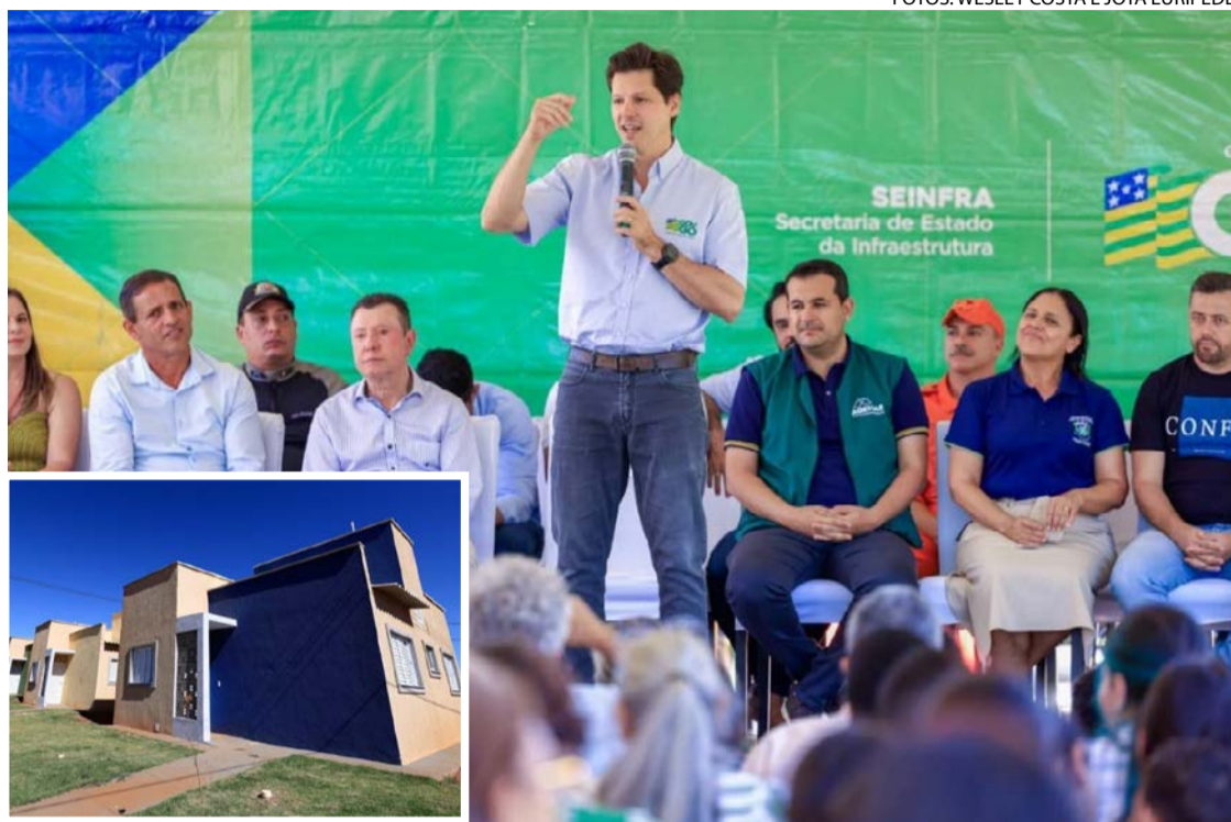
Governador Daniel Vilela, ontem, 30, durante entrega de moradias (em detalhe) para residentes em Santa Rita do Novo Destino: "A casa própria representa segurança, estabilidade e dignidade"