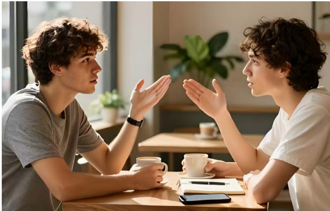
Etiqueta contemporânea ensina convivência e desenvolve empatia

Apesar de navegar no ambiente digital e até falar outro idioma, adolescentes chegam à vida adulta sem saber cumprimentar