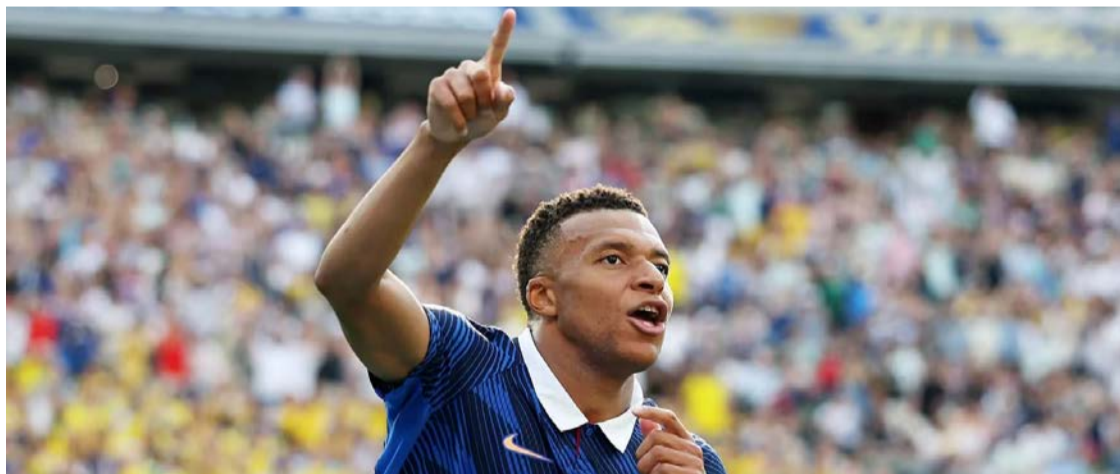
França vence Suécia por 3 a 0 com dois gols de Mbappé