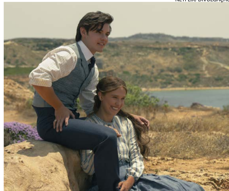
Henry Cavill e Helena Bonham Carter atuam na película