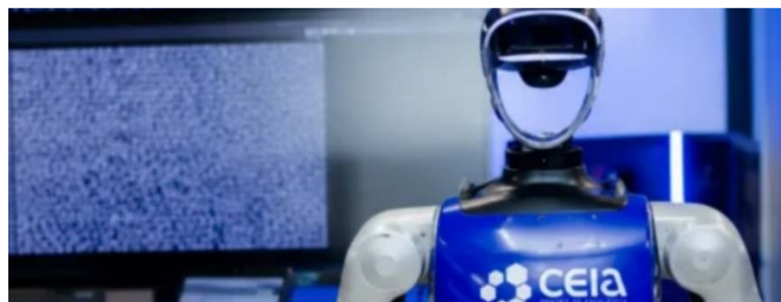
Capital de Goiás está no Top 5 da América Latina em iniciativas de IA, segundo AITOUR Intelligence