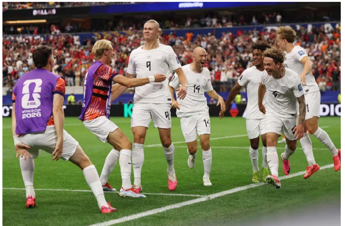
Gol decisivo saiu aos 41 minutos do segundo tempo com o artilheiro Erling Haaland

A partida apresentou alto nível técnico e lances de grande qualidade. Antonio Nusa abriu o placar aos 38 minutos do primeiro tempo, após receber passe de Martin Ødegaard, superar a marcação e