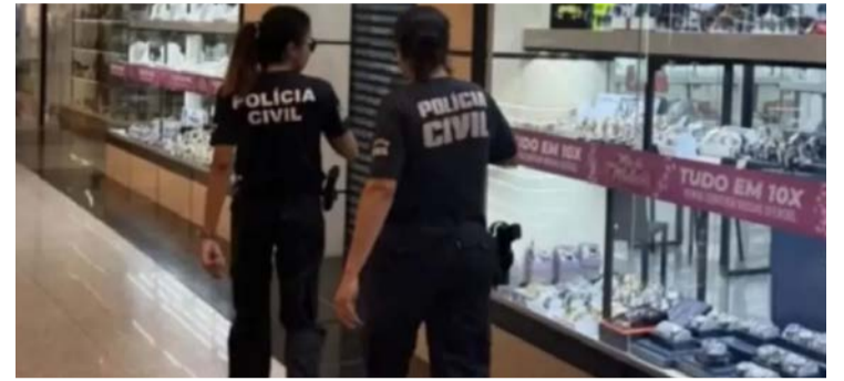
Prejuízo estimado chega a R$ 500 mil, segundo investigações

Polícia requisitou imagens das câmeras de segurança e apura como ocorreu o roubo