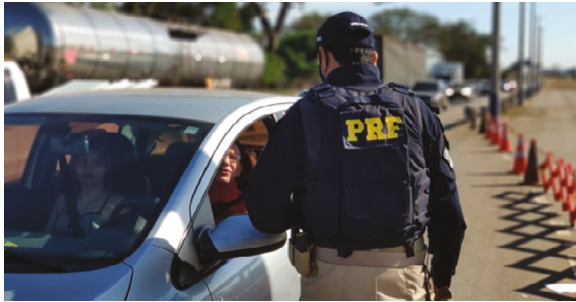
Veículos foram flagrados trafegando a velocidades alarmantes, como 177 km/h e 178 km/h na BR-153

Durante a Operação Natal, veículos foram flagrados trafegando a velocidades alarmantes, como 177 km/h, 168 km/h e 178 km/h na BR-153. Outro foco das fiscalizações foi a ultrapassagem indevida, infração que pode resultar em multa de até R$ 2.934,70, suspensão da habilitação e acidentes graves, como colisões frontais. De janeiro a novembro deste ano, a PRF registrou 272.955 infrações desse tipo em todo o país, causando 1.557 acidentes, 2.287 feridos e