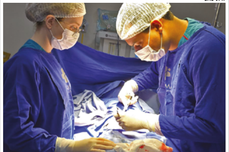
Foco da organização social está em pós-graduações, residências, cursos técnicos e profissionalizantes, com base em inovação