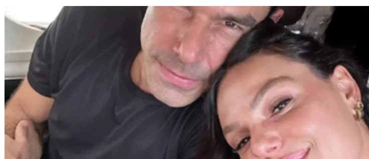
Isis Valverde e Marcus Buaiz: resta a cerimônia religiosa

"Estou cuidando de tudo. Quero que seja perfeito e exatamente como sonhei", disse Isis em recente entrevista ao F5.