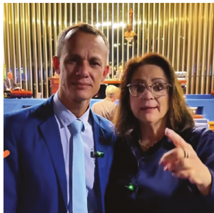
Reamilton do Autismo esteve com vários senadores, em Brasília, entre eles Damares Alves que revelou que a matéria "saiu muito boa"

O vereador disse ainda à senadora que o novo foco de seu trabalho em Anápolis é a implantação da Residência Assistida. Trata-se de um projeto que garante que o autista tenha um local para morar, além de participar de atividades, fazer terapias e ser cuidado por especialistas no TEA.