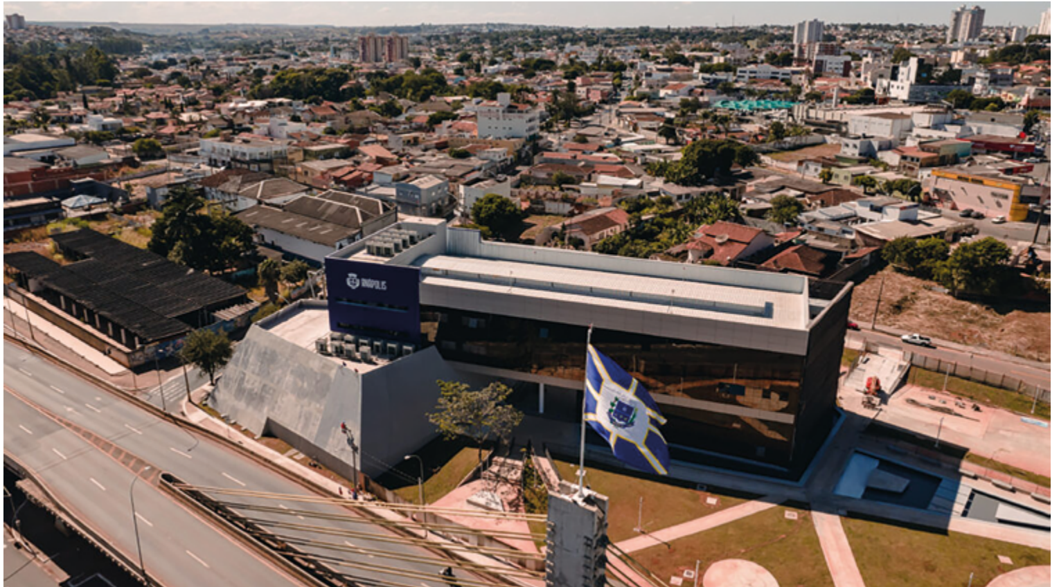
Naturalmente, resultado das urnas em 2024 influenciou na conduta das agremiações, e deixa para trás diferenças vividas na campanha eleitoral

Do outro lado, devem compor a oposição classificada como "responsável" à nova administração PDT, PP, PRTB, PCdoB, PSOL, PV e Rede. Republicanos, PT e União Brasil vivem uma dicotomia. No Republicanos, enquanto a vere-