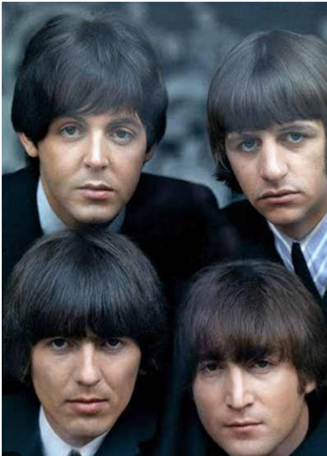
Beatles hoje toca menos no streaming do que John Lennon e Paul McCartney individualmente

O acordo contratual dos Beatles, de direito empresarial e civil, documento assinado pelos quatro, organizou a divisão de direitos autorais e financeiros entre eles. Logo, ao mesmo tempo mostrava a ingenuidade do quarteto e - após os anos - a amargura. Primeiro, mesmo sendo originada de uma empreitada de John, a banda teve seu valor dividido entre os quatro - jamais um contrato desta envergadura seria assinado no mundo pop. É evidente que John, Paul e George tiveram maiores gastos de energia que Ringo - e ele sabia disso. Mas o contrato reconheceu os quatro como 'donos'. Também revelava esta amargura: os quatro não desejavam mais escrever músicas para os Beatles - que, por ironia, passaria a ter menos importância comercial do que dois dos músicos. Senão, vejamos: dados de hoje no Spotify: Beatles tem 32,9 milhões de ouvintes mensais. Pois bem, John tem 41,8 milhões (mês de Natal, lembremos do seu hit) e Paul tem 43,2 milhões. George (9,2 mi) e Ringo (629,9 mil) bem menos. Buscavam a liberdade da carreira solo. E Paul e Lennon conseguiram.