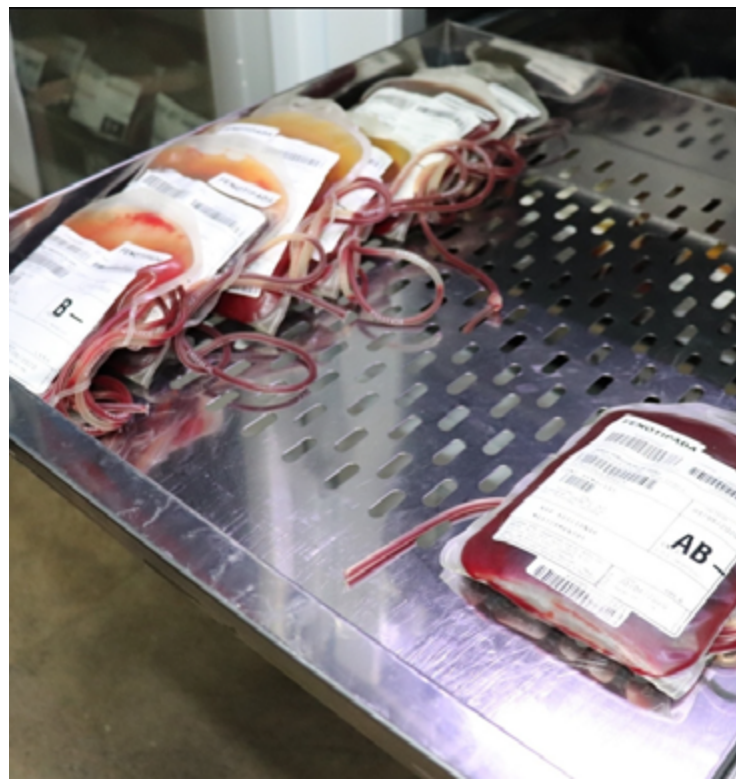
Rede Hemo faz campanha preventiva para garantir estoques no fim de ano: uma única doação é capaz de salvar até quatro vidas

Pessoas candidatas à doação de sangue com diagnóstico ou suspeita de covid-19 e que apresentaram doença sintomática podem efetuar a doação 10 dias após a completa recuperação. Os voluntários a doação que tiverem diagnóstico positivo, mas que permaneceram sem sintomas, podem doar após 10 dias da data de coleta do exame. As pessoas que tiveram contato com um caso confirmado de covid-19 durante o período de transmissibilidade podem doar sangue sete dias após o último contato.