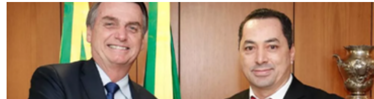
Jair Bolsonaro e Ughton Batista: aliados políticos