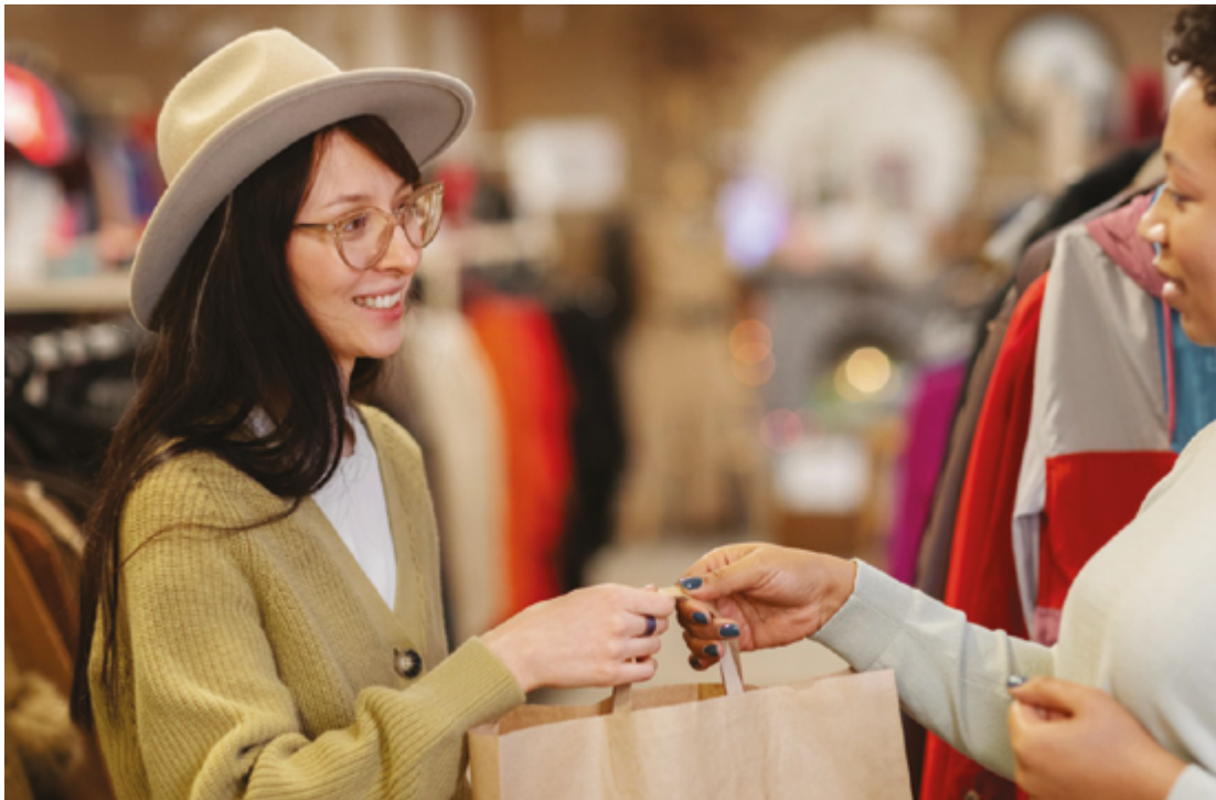
Lojas são obrigadas a trocar apenas produtos com defeitos de fabricação, garantindo que o valor original