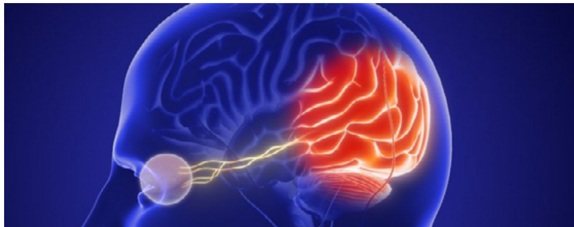
Tecnologias emergentes do Neuralink Blindsight e do Gennaris Bionic Eye se destacam nas novas descobertas

Blindsight, desenvolvido pela Neuralink de Elon Musk, representa um avanço revolucionário na restauração da visão. Este dispositivo experimental é um implante cerebral que se conecta diretamente ao