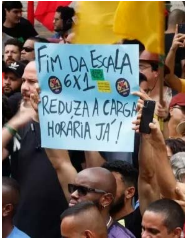
Debate sobre a jornada de trabalho tem despertado interesse significativo entre os eleitores

Já entre os bolsonaristas, o apoio é mais dividido. Nesse segmento, 44% se disseram favoráveis ao