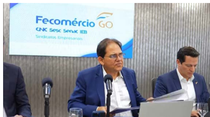
Marcelo Baiocchi destaca novas metas após reeleição