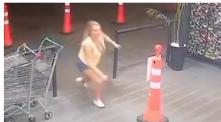
Invasão ocorreu após ela ser impedida de usar o banheiro