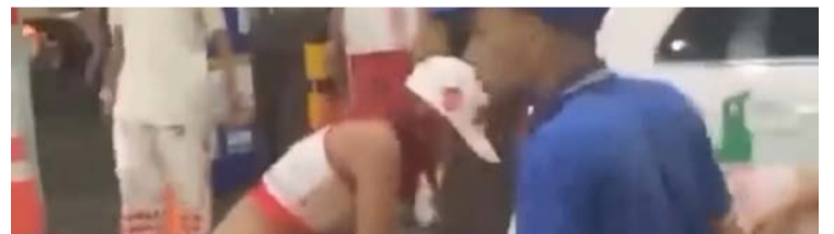
Houve tumulto e troca de agressões durante a confusão