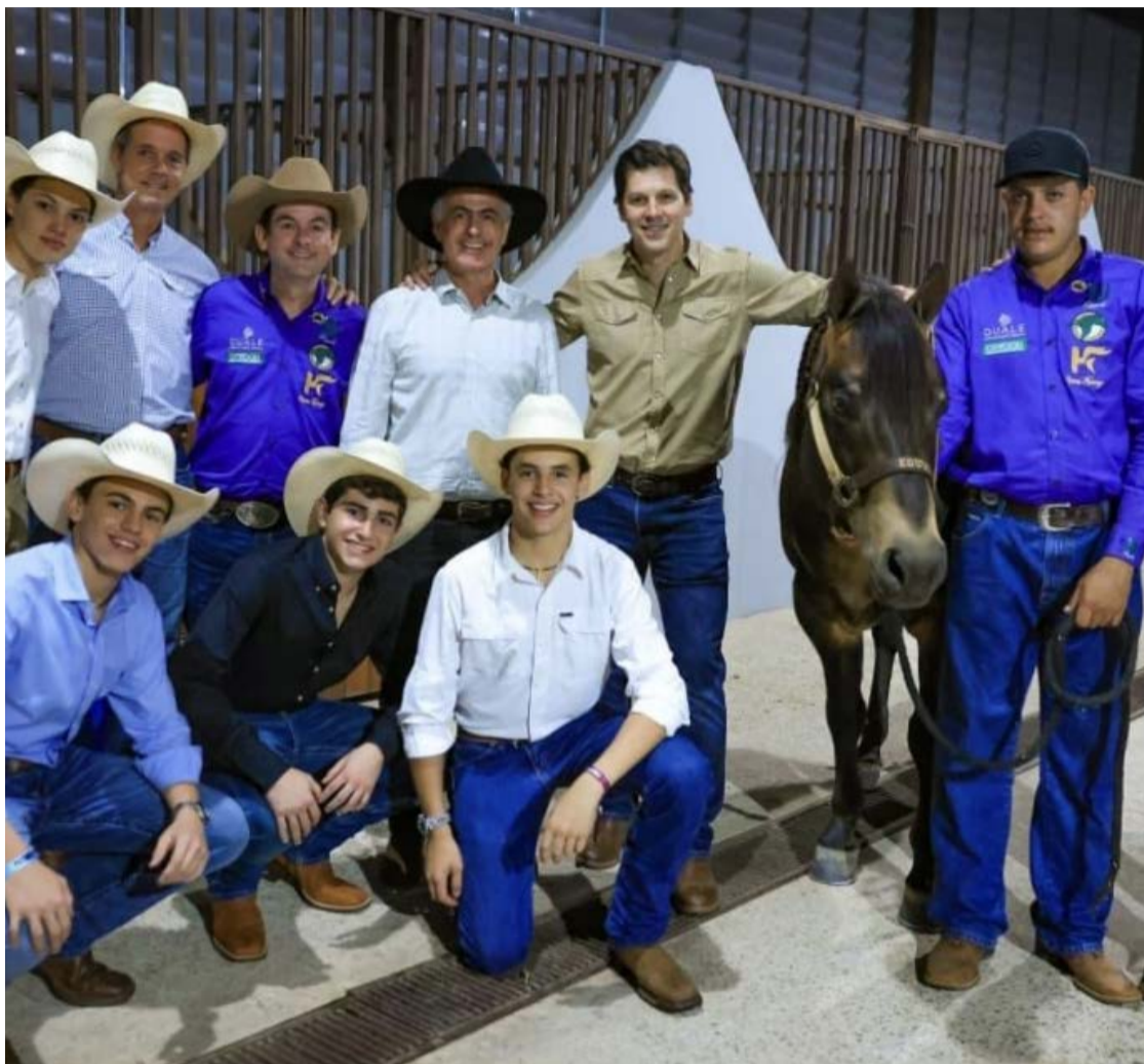
Governador Daniel Vilela participou do Leilão JBL Ranch, em Nazário: recursos para Cora e OVG

Na abertura do evento, o cantor Gustavo Lima também contribuiu com a causa ao doar uma fêmea da raça Friesian, do Haras Embaixador, leiloadada por mais de R$ 1,1 milhão, com renda revertida integralmente ao Cora, hospital público referência no tratamento do câncer infantil.