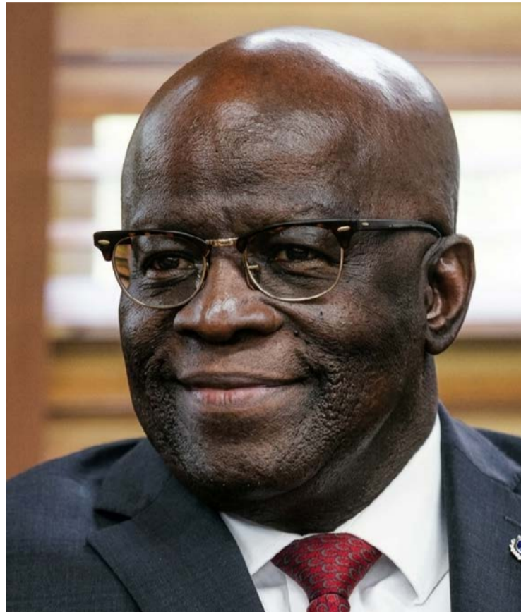
Joaquim Barbosa é pré-candidato à Presidência da República

Ex-ministro do STF foi o relator da polêmica ação que condenou acusados de participar do Mensalão