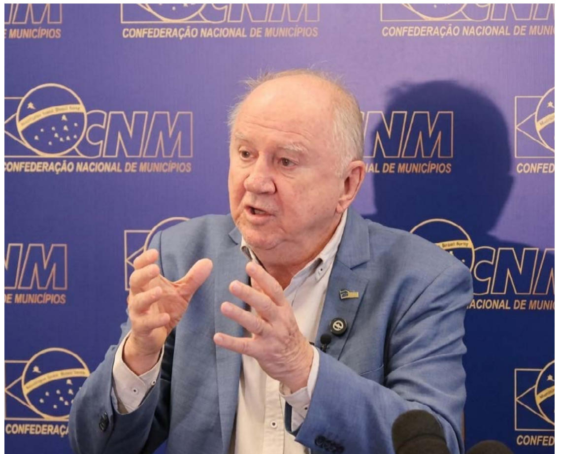
Paulo Ziulkoski, presidente da CNM: prioridades da Marcha dos Prefeitos em 2026

Entre os projetos apontados como mais preocupantes estão a aposentadoria especial para agentes comunitários de saúde e agentes de combate a endemias, a criação ou ampliação de pisos salariais para categorias do funcionalismo, o pagamento de adicional de insalubridade para profissionais da educação, a redução da jornada semanal para 36 horas e medidas ligadas à educação especial. A CNM sustenta que o avanço dessas propostas comprometeria