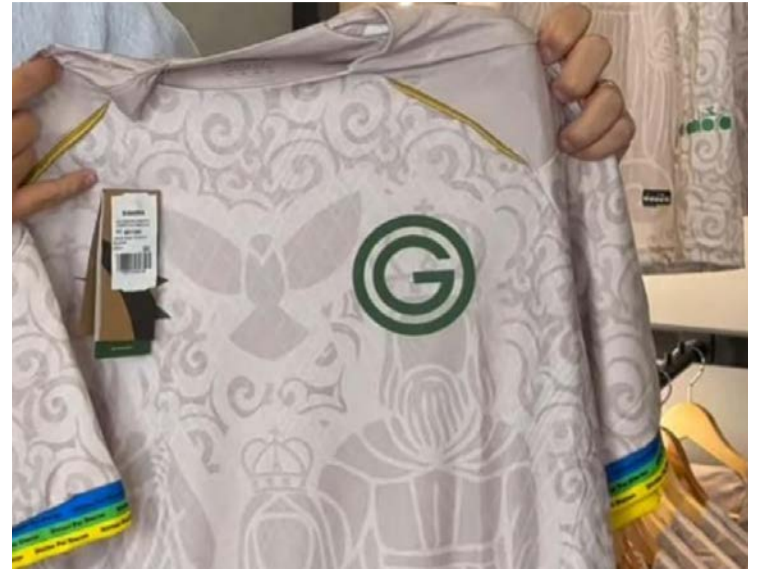
Peça é toda na cor bege claro e tem detalhes nas mangas