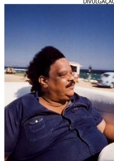
Tim inaugurou linguagem com disco lançado em 1970

Toni Tornado, em diferentes trechos, teve sua grandeza artística reconhecida. É ponto alto do longa-metragem, que se encerrou com a canção antirracista “Olhos Coloridos”, de Sandra de Sá.