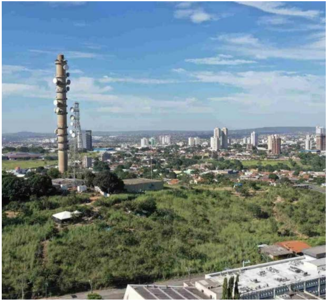
Interessados no projeto precisam realizar cadastro prévio: investimento de R$ 15,6 milhões

Conforme as regras divulgadas, as propostas precisarão ser encaminhadas exclusivamente pelo sistema eletrônico oficial, com descrição dos serviços e valores apresentados até o horário estipulado para abertura da disputa.