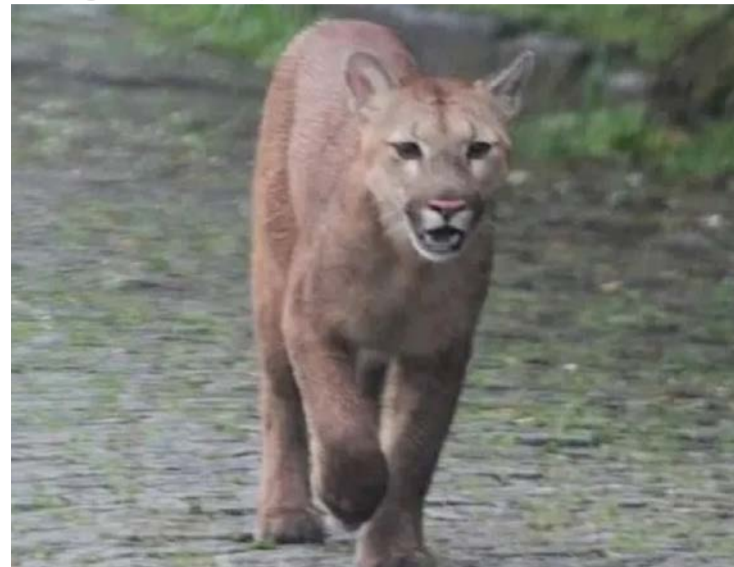
Quadro da criança é estável e não há previsão de alta

Criança de 8 anos que foi atacada por uma onça-parda em um santuário em Alto Paraíso de Goiás, na região da Chapada dos Veadeiros