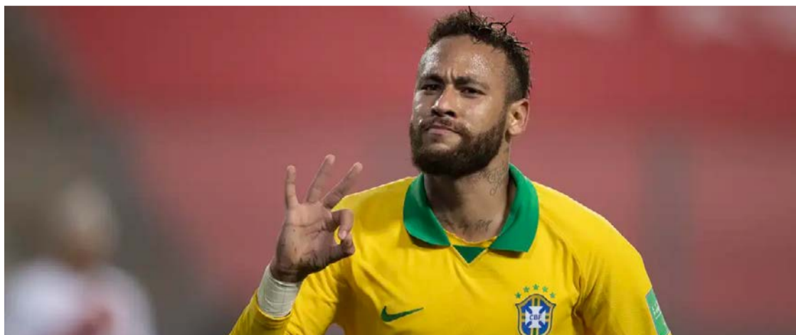
Neymar entrou em campo pela última vez pela seleção brasileira em 17 de outubro de 2023

Antes da Copa do Mundo de 2026, o Brasil realizará dois amistosos preparatórios. O primeiro será contra o Panamá, no dia 31 de maio, no Maracanã, às 18h30 (horário de Brasília), marcando a despedida da