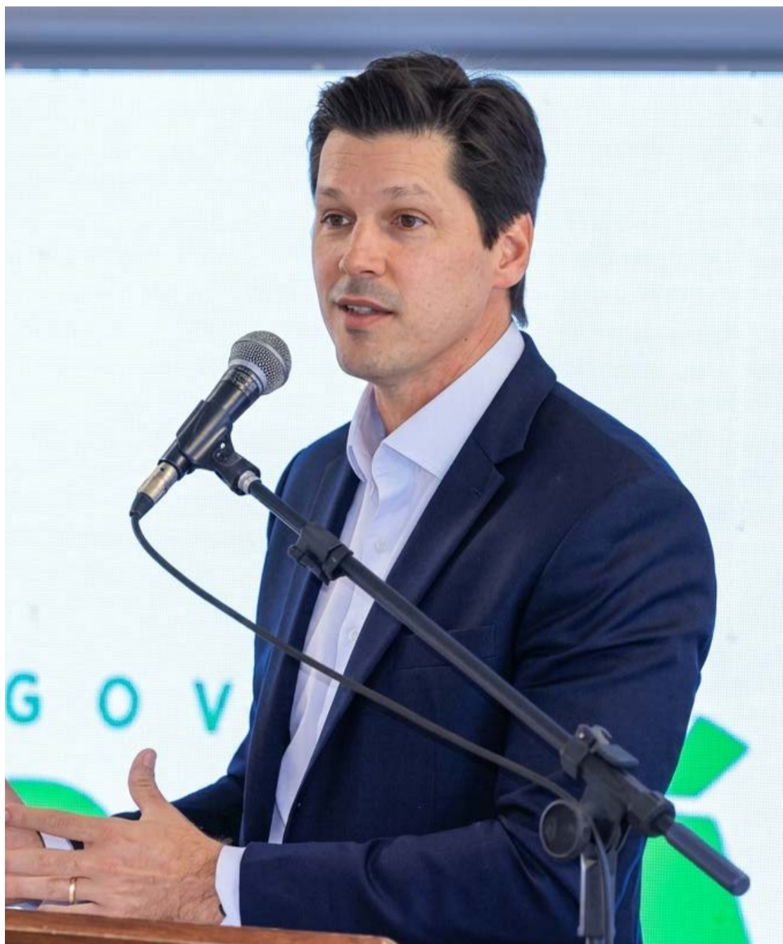
Governador Daniel Vilela abre frente de 17,9 pontos sobre Marconi Perillo, diz Paraná Pesquisas