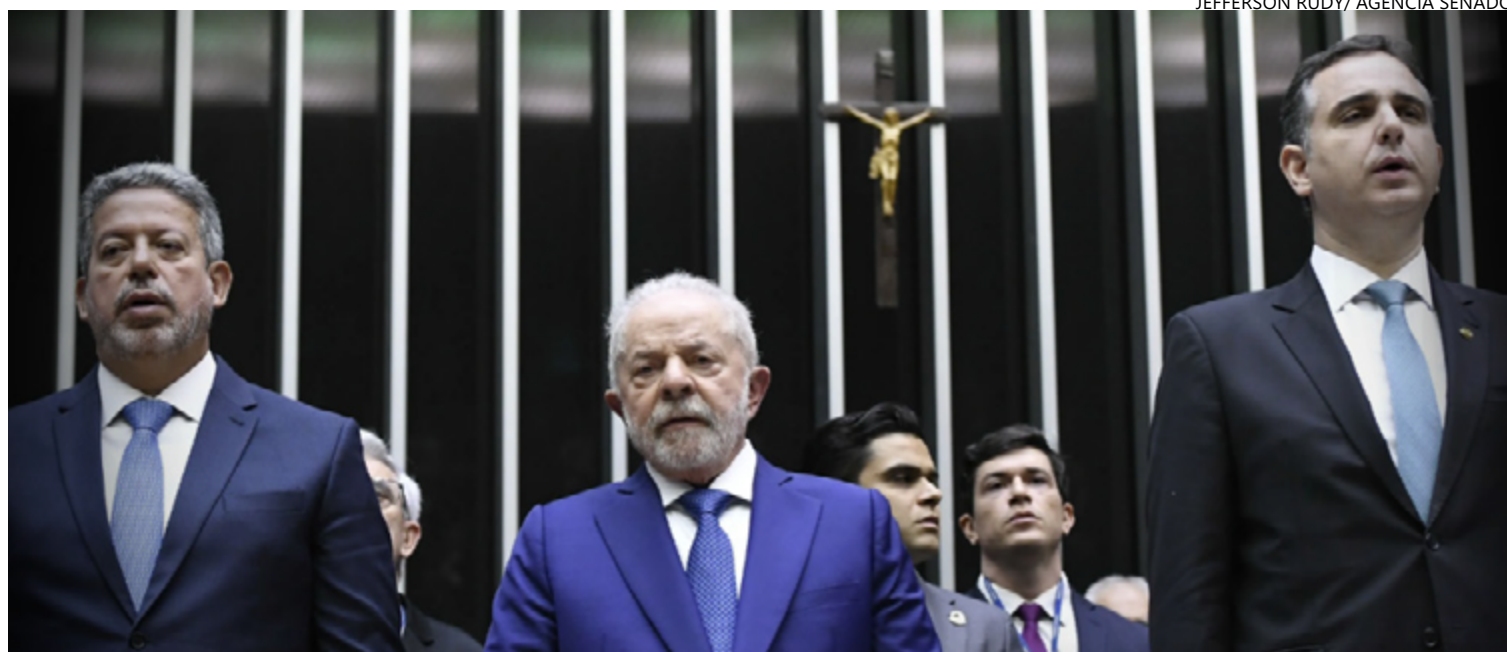
Presidente quer estreitar diálogo com cúpula tanto da Câmara quanto do Senado em crise de popularidade

do petista afirma que há também um simbolismo forte de reunir os atuais e ex-presidentes da Câmara e do Senado, num aceno de unidade com o Legislativo.