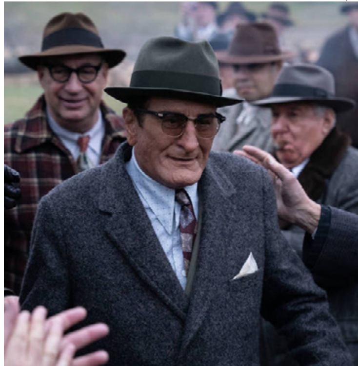
Astro do cinema: Robert de Niro interpreta dois gângsteres