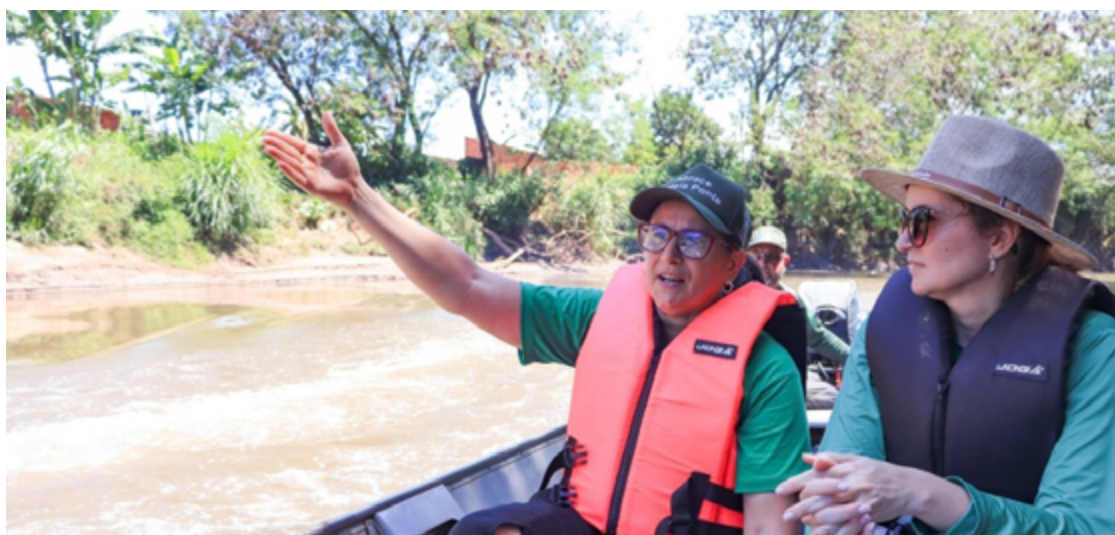
Projeto rompe com estigma de que o rio é local de descarte: pesquisadores investigam qualidade da água

A coordenadora destaca que o projeto rompe com o antigo estigma de que o rio é um local de descarte. "Existe aquela piada de que, se não presta, joga no Meia Ponte... e estamos mudando isso", afirma. Muitos moradores que participam como voluntários ou visitam as estações ambientais se surpreendem com a beleza do rio e passam a enxergá-lo de forma mais positiva. As crianças, em especial, ficam encan-