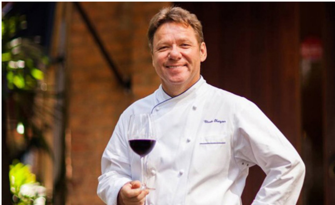
Poesia dos sabores: cozinha de Claude alimenta o corpo e abraça a alma

Cucina Mia, restaurante do renomado chef francês Claude Troisgros, elevará cenário gastronômico de Goiânia com requinte, satisfação e criatividade