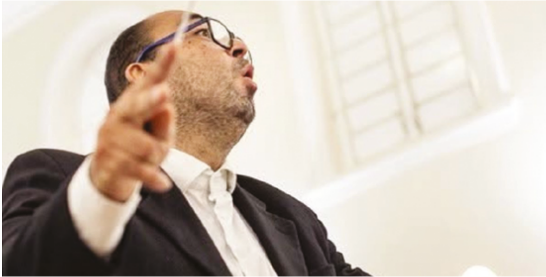
Mesmo com o avanço das novas tecnologias, a tradição do rádio se mantém forte em Anápolis