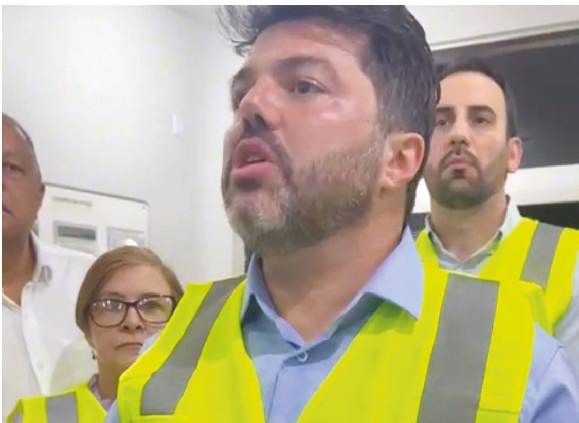
Com direito a sirenes e coletes refletivos para o prefeito e secretários, a Prefeitura entrou na unidade e determinou a intervenção para retirada da atual OS.