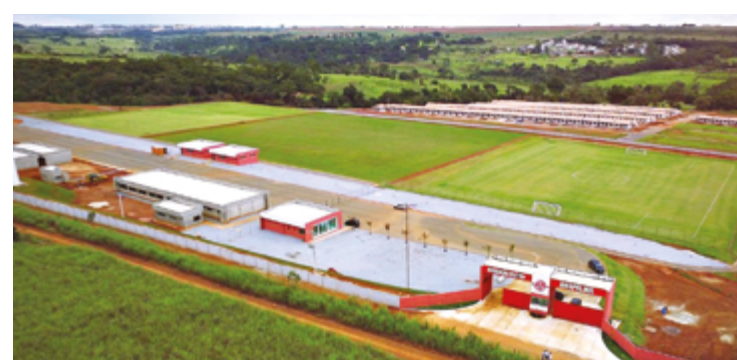
Além do aporte financeiro, a Anapolina também avança na estruturação do Centro de Treinamentos Leandro Ribeiro

O presidente ainda adiantou a chegada de um reforço de grande impacto para a equipe, mas preferiu manter o mistério quanto à identidade do atleta. “Nós temos um jogador que vai balançar a cidade na hora que sair no BID (Boletim Informativo Diário). Está chegando aí em primeira mão, eu não posso falar agora, porque ele é muito asseado”, revelou.