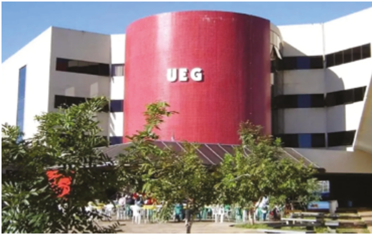
Vestibular UEG 2025/2 oferece 600 vagas na modalidade presencial e 300 vagas no ensino a distância (EAD)

Inscrições podem ser feitas até o dia 22 de abril. São ofertadas 600 vagas em cursos presenciais e 300 na modalidade EaD