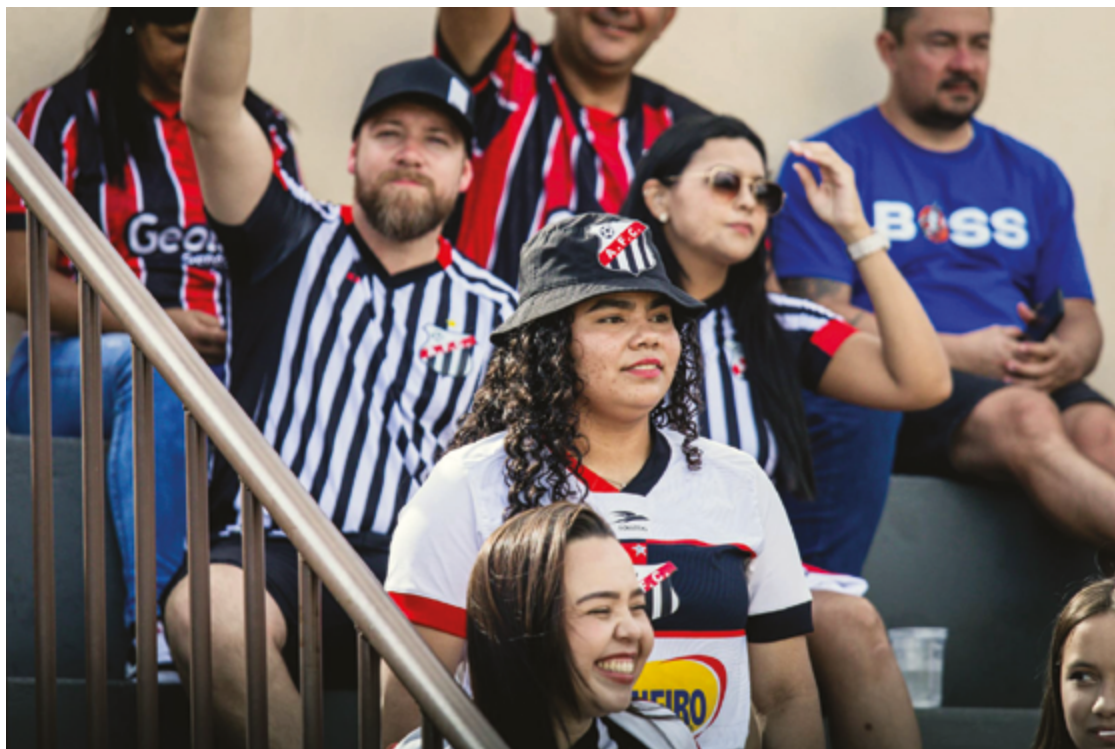
Neste Goianão, o time do Anápolis terminou a fase classificatória no topo da tabela, manteve-se na liderança e sofreu apenas uma derrota em casa