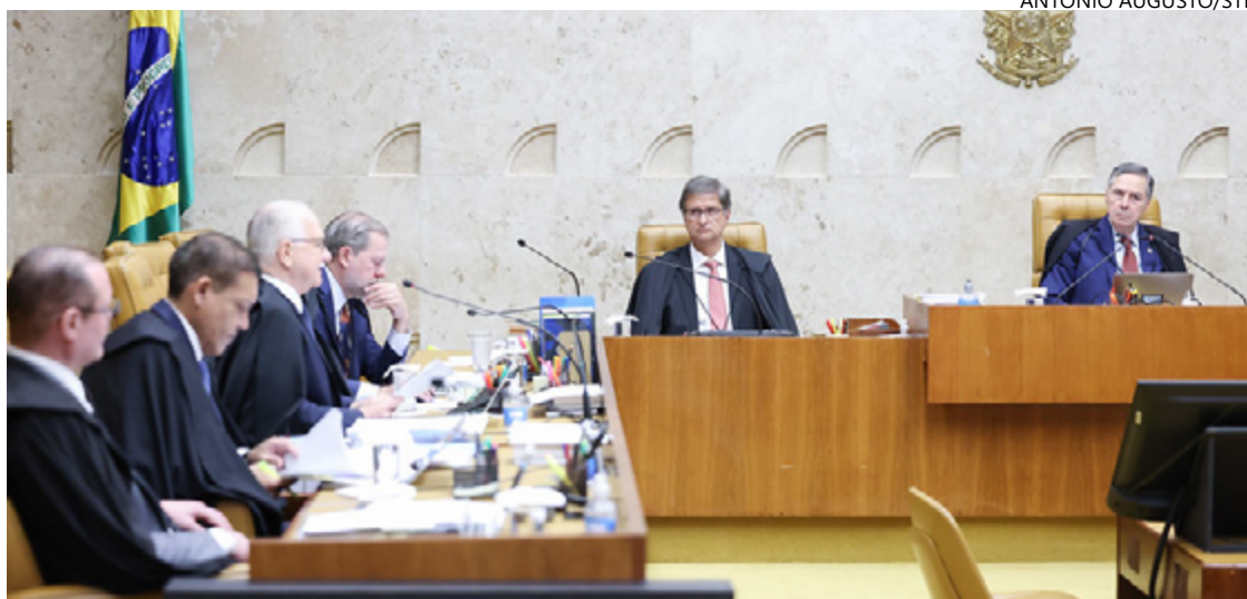
Ministros discutiram nos bastidores para reduzir discordâncias sobre detalhes da tese

Além ainda do trecho sobre entrevistas ao vivo, o terceiro ponto diz, por fim, que, quando for constatada a falsidade das declarações, deve haver remoção de ofício, ou seja, por decisão proativa da Justiça ou por notificação da vítima quando a imputação permanecer disponível em plataformas digitais, sob pena de