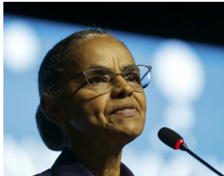
Deputadas e senadoras de diversos partidos saíram em defesa de Marina Silva

Pedido enviado ao Conselho de Ética do Senado contra Plínio Valério é assinado por parlamentares de dez partidos