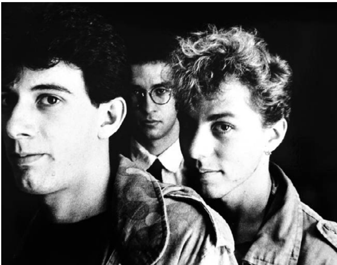
Paralamas no passado: banda debutou no cenário fonográfico com 'Cinema Mudo', em 1983

da música brasileira. "Vital e Sua Moto" virou hit do rock caboclo e rendeu-lhes convite da EMI-Odeon para gravar um disco, como faziam The Police e Led Zeppelin, bandas das quais o trio paralamico era fã confesso.