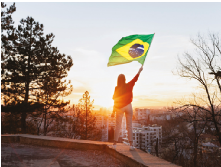
Com esse resultado, o Brasil ultrapassou o Chile, que caiu para o 45º lugar, e se tornou a segunda nação mais bem-colocada da América do Sul

Enquanto isso, a Finlândia manteve a liderança pelo oitavo ano consecutivo, seguida por Dinamarca, Islândia e Suécia. Os países nórdicos se destacam por seus sistemas de saúde e educação eficientes, além de uma rede de apoio so-