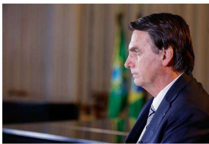
O ex-presidente Bolsonaro tenta se livrar da condenação pelo STF

Em relação à colaboração premiada de Mauro Cid, a PGR sustentou que o acordo