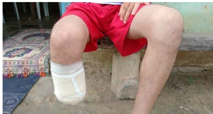
Servidor alegou ser vítima de assalto na Bahia

Suspeito contratou quatro apólices de seguro de vida e acidentes pessoais entre junho e julho