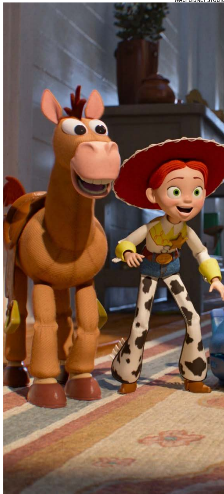
"Toy Story 5" se diferencia dos antecessores por ritmo

De qualquer forma, é saudável que "Toy Story" reconheça, enfim, a criança como uma sensível esponja, que absorve tudo aquilo ao que é exposta. O desafio é entender como sonhar com caubóis e astronautas pode conviver com "six seven", "brainrots" e afins. Contra as expectativas, este quinto capítulo não tem a vulgaridade de um "Velozes e Furiosos 5" e outras sequências que o valha. Pode ser uma mina de ouro para a Disney-Pixar, mas, sem dúvida, ainda é um filme com algo a dizer. (Folhapres)