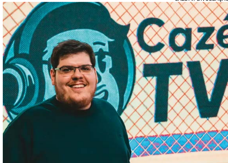
Apresentador leva linguagem da web à transmissão esportiva