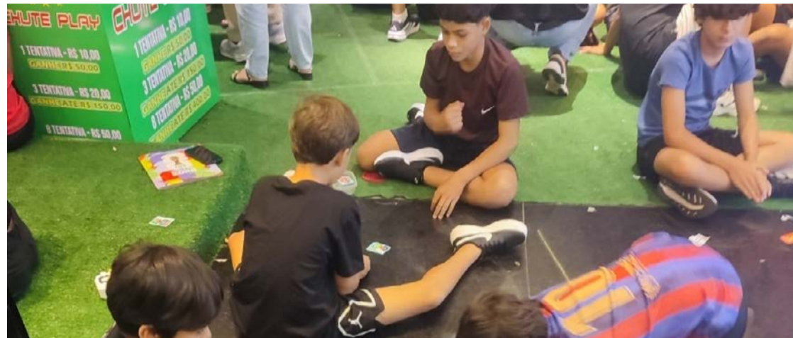
Crianças disputam 'bafó' em um dos shoppings da região Norte de Goiânia

Cromos especiais são mais pesados, enquanto mercado de revenda registra negociações acima de R$ 500 por unidades raras nos shoppings de Goiás