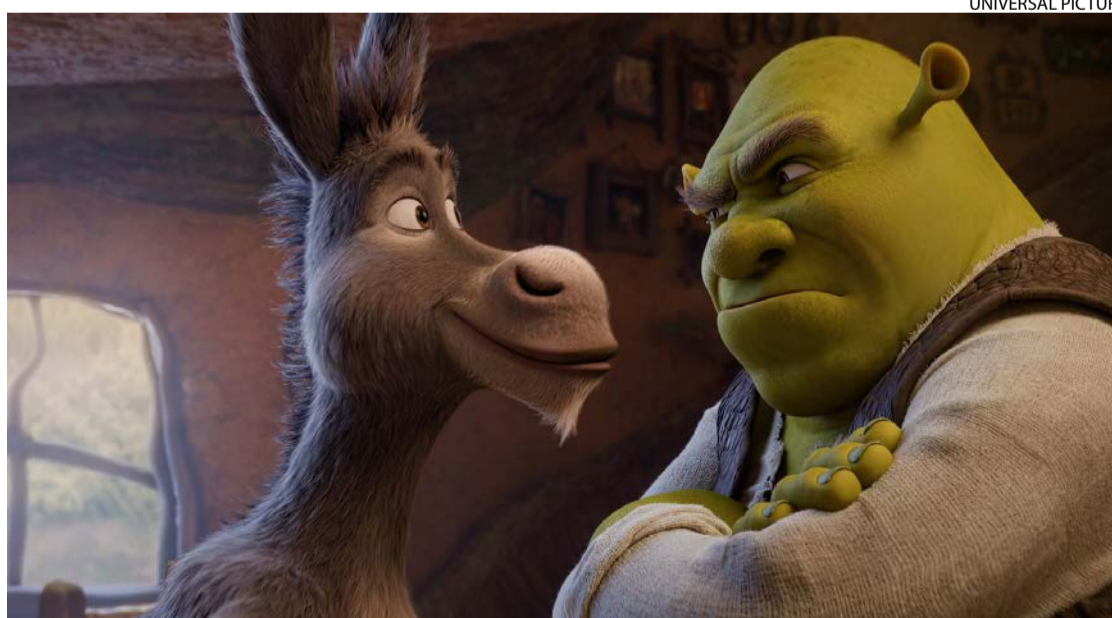
Surpresa: imagens divulgadas nesta semana revelam retorno de personagens clássicos

Nos bastidores, "Shrek 5" será comandado por