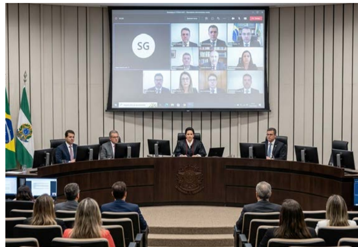
Plenário do Tribunal de Contas do Estado: contas aprovadas

Relatório mostra aumento da arrecadação com equilíbrio fiscal e ampliação dos investimentos