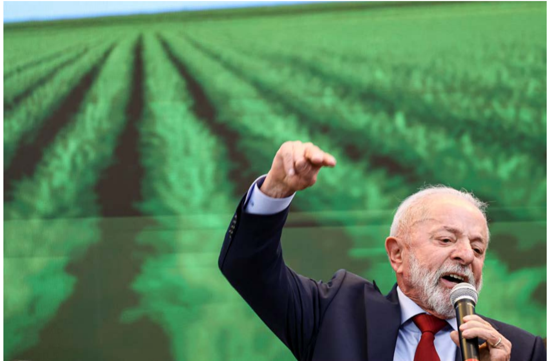
Lula reage à tentativa de Trump de influenciar as eleições no Brasil

Lula afirmou ter entregue pessoalmente a Trump, por escrito, quatro documentos durante a cúpula: um sobre o combate