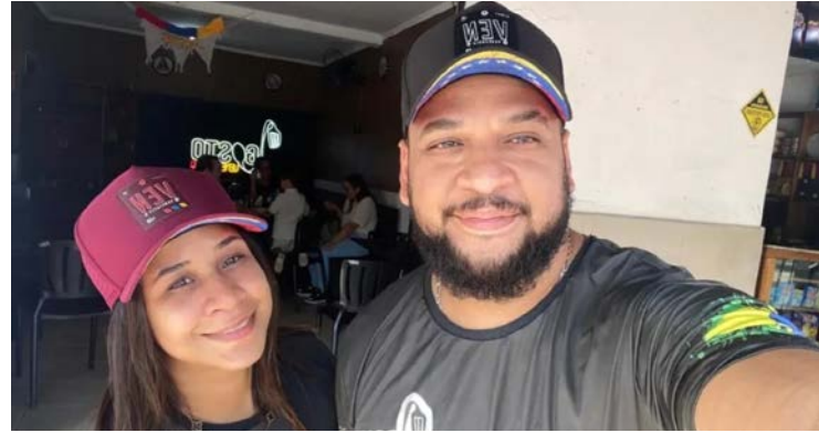
Imigrantes dizem que captura de Maduro abre caminho para a liberdade

Imigrantes relatam que vieram para o Brasil em busca de estabilidade e condições mínimas de vida