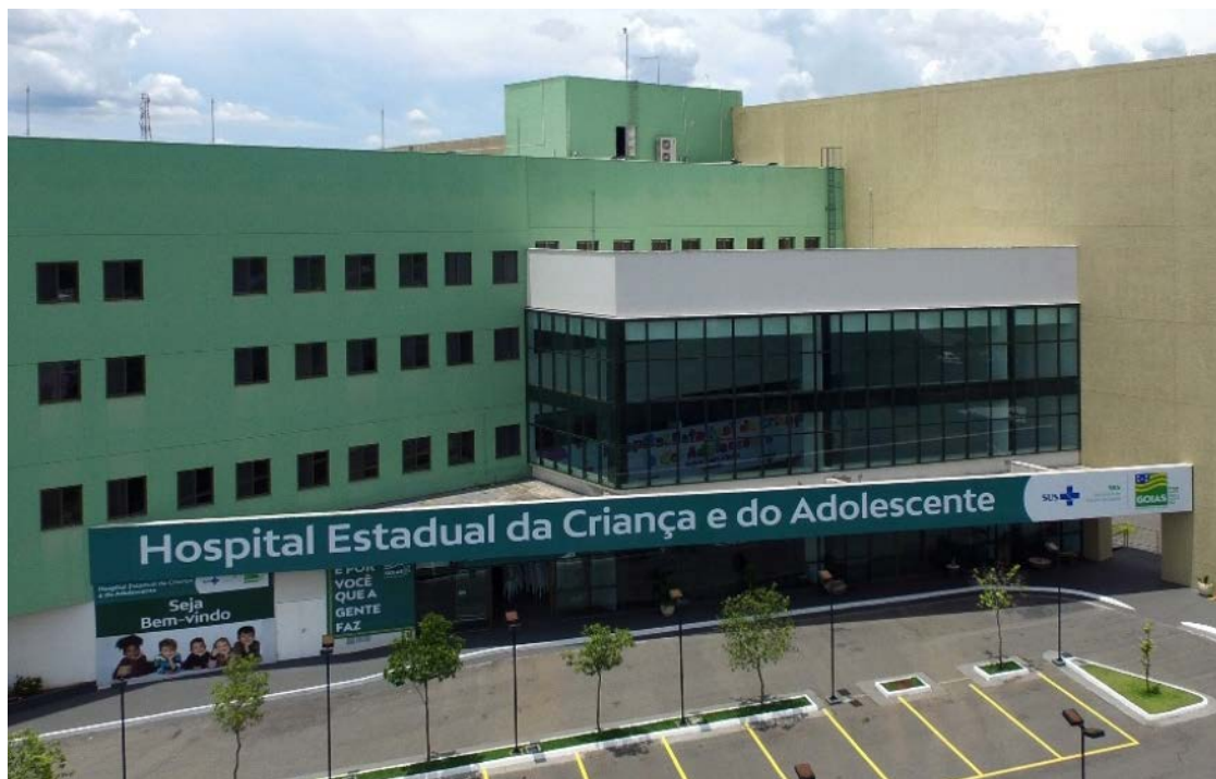
Ranking nacional avalia unidades do SUS com base em critérios técnicos: Hecad foi uma das unidades estruturadas nos últimos anos

No mesmo período, a quantidade de hospitais estaduais aumentou de 17 para 25, enquanto o número de leitos de Unidade de Terapia Intensiva (UTI) cresceu de 267 para 848. A oferta de UTIs, antes concentrada em Goiânia, Anápolis e Aparecida de Goiânia, foi ampliada para 24 municípios, segundo dados oficiais do governo estadual.