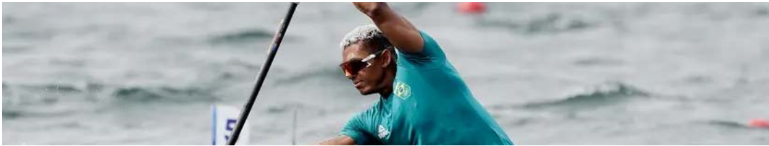
Diretoria do clube optou por descontinuar a modalidade no planejamento para este ano