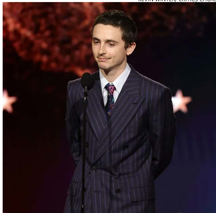
Timothée Chalamet foi um dos destaques em Los Angeles, nos EUA