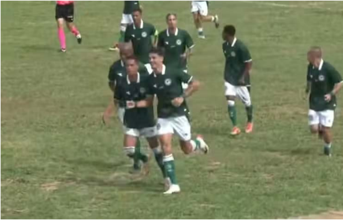
Goiás começa com vitória a sua campanha na Copa São Paulo de Futebol Júnior

Já o Vila Nova não teve o mesmo desempenho na estreia. No último domingo (4), o time goiano foi derrotado por 1 a 0 pela Portuguesa, no está-