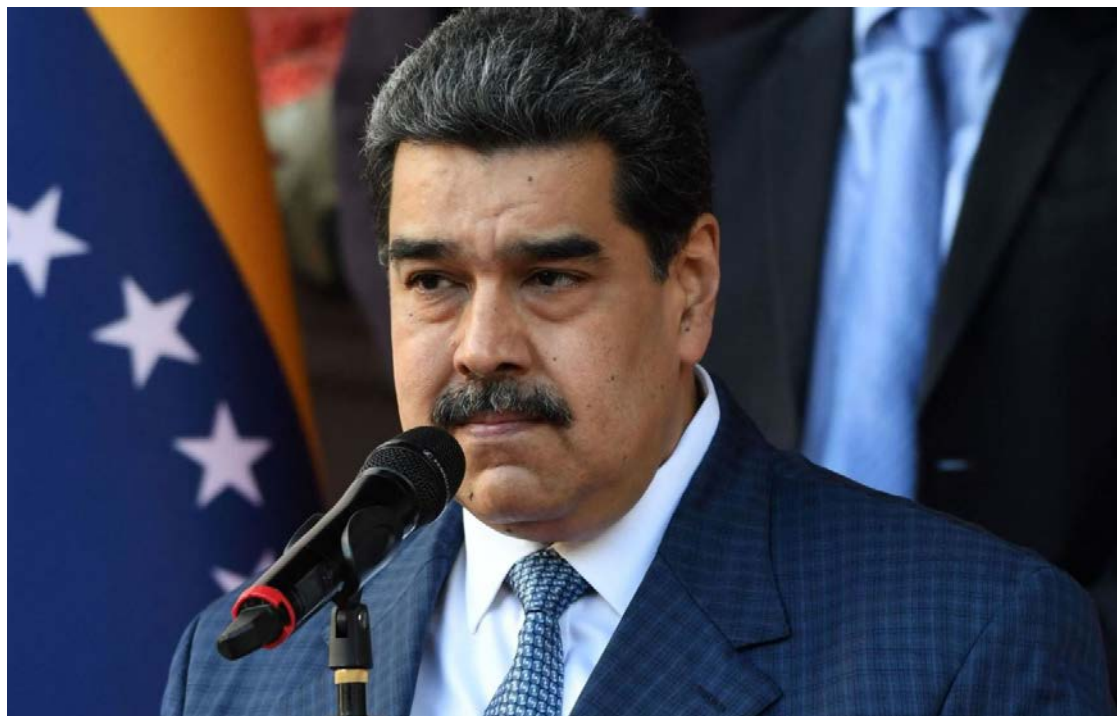
Nicolás Maduro segue preso nos EUA onde vai responder por vários crimes