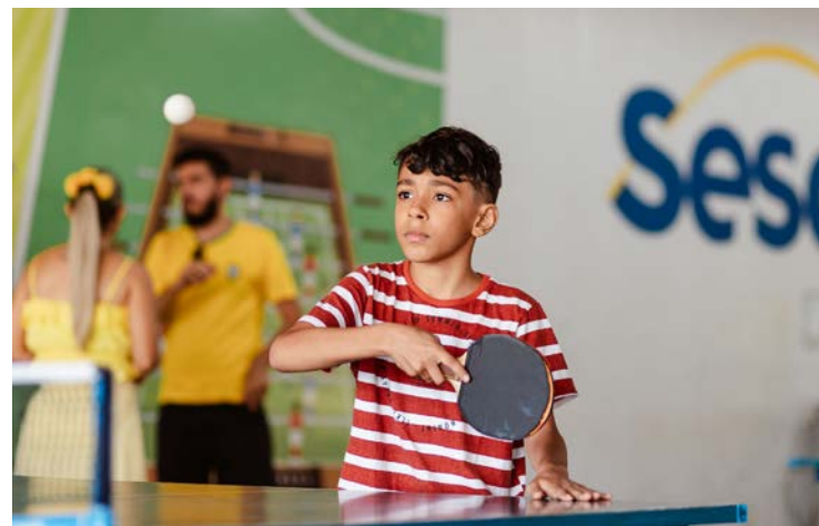
Opções combinam aprendizado e convivência

As férias escolares ampliam a agenda cultural e de lazer voltada às crianças na região metropolitana de Goiânia. Entre shoppings, centros culturais, unidades do Sesc e parques temáticos, as opções combinam diversão, aprendizado e convivência em família. A seguir, quatro sugestões de programação para ocupar o tempo livre da garotada ao longo do mês.