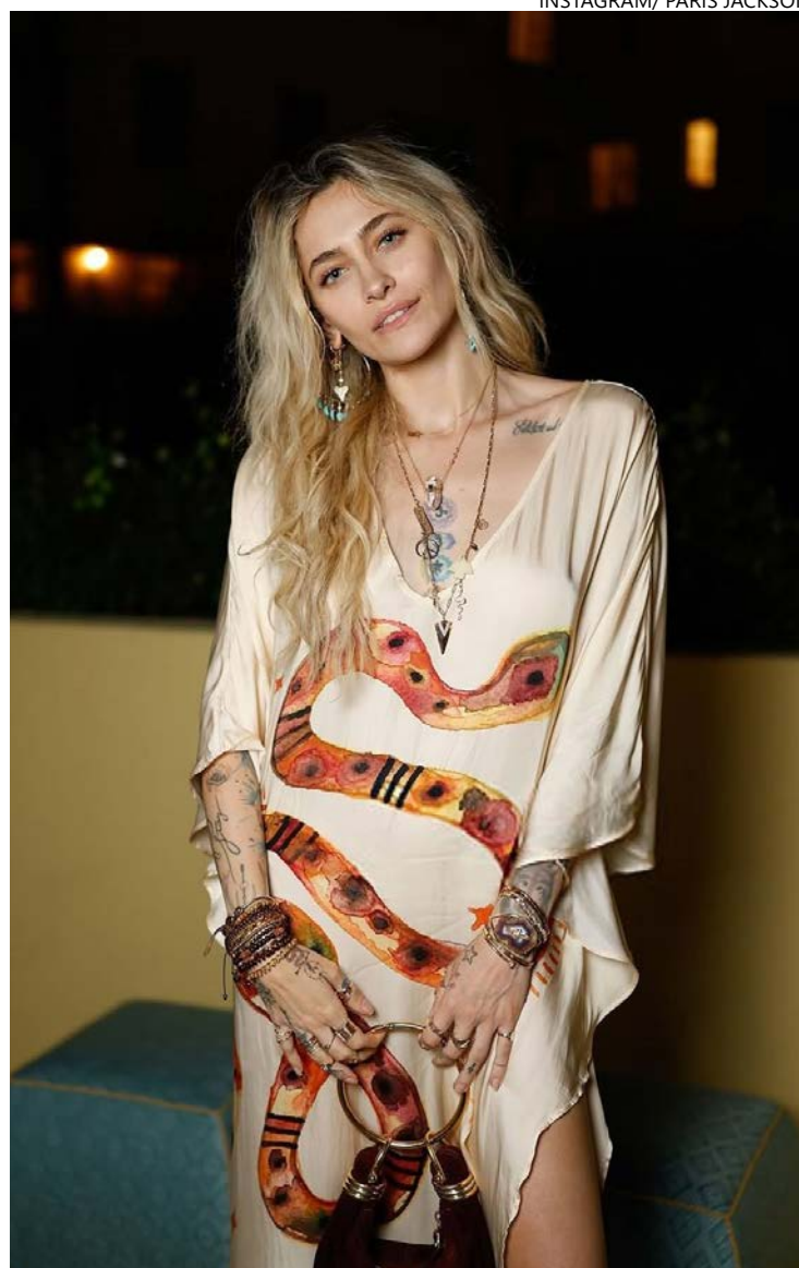
Cantora e modelo contou que precisou reaprender a viver sem mecanismos de fuga

Na mesma ocasião, a artista publicou um vídeo com registros pessoais e explicou o motivo da exposição. "Aqui está um pequeno retrato do que foi possível graças à minha sobriedade. Meu Deus, eu não consigo acreditar que quase perdi tudo isso", afirmou.