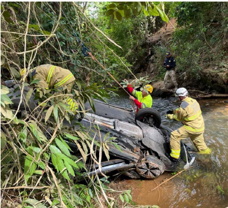
Balanço faz parte da Operação Rodovida, realizada entre os dias 30 de dezembro de 2025 e 4 de janeiro

Segundo a PRF, 27 motoristas foram autuados por embriaguez ao volante durante o feriado. Um deles foi preso após o teste do bafômetro apontar 1,10 mg/L de