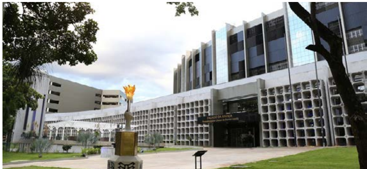
Decreto também determina inspeção de segurança com detectores de metais e raio X