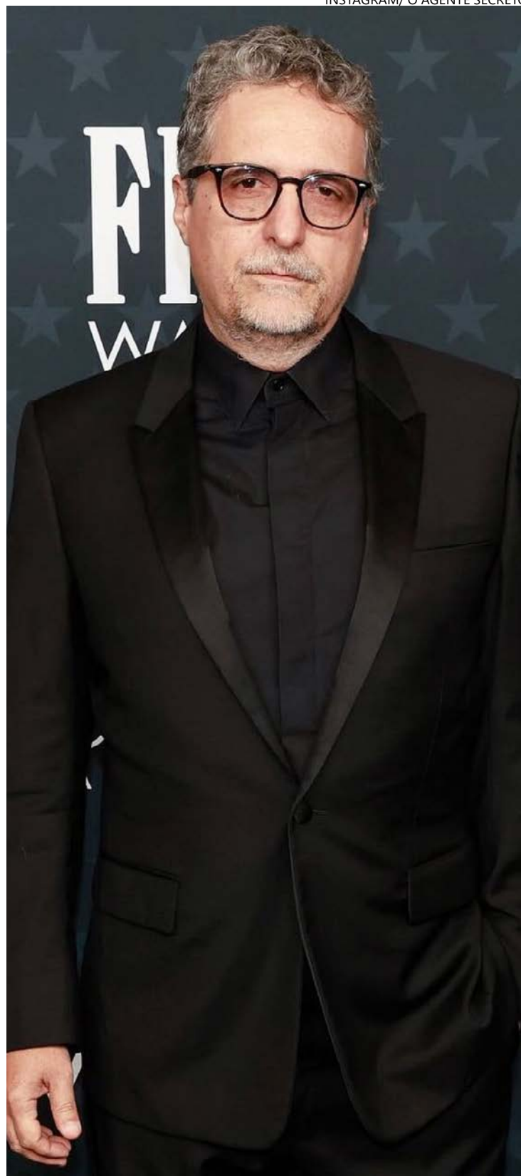
E foi assim: diretor pernambucano soube que levava o Melhor Filme Internacional de supetão