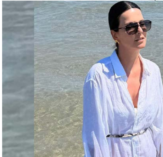
A modelo e influenciadora de lifestyle Fernanda Pacheco celebrou o Réveillon na Praia da Baleia, no litoral norte de São Paulo, brindando a chegada do novo ano em clima de verão e leveza.