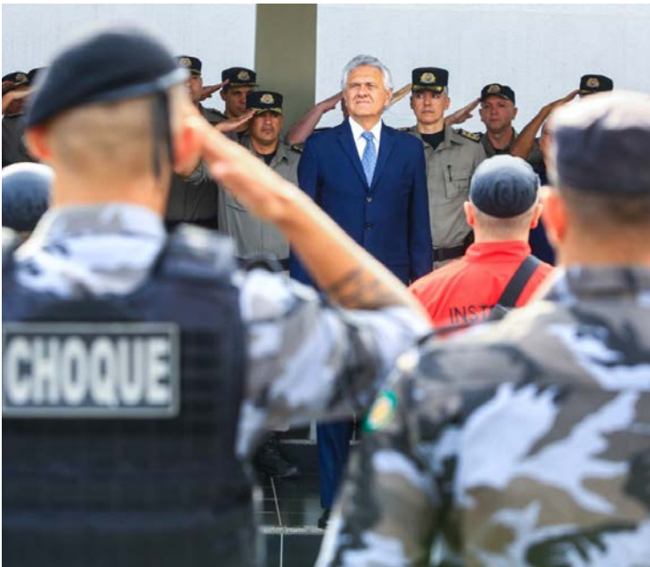
Dados envolvem investimentos em segurança pública entre janeiro e outubro de 2025

Em quatro estados – Amapá, Mato Grosso do Sul, Rondônia e Roraima – os gastos com seguran-