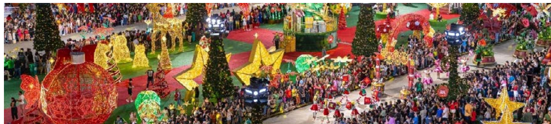
Público circula pelo Centro Cultural Oscar Niemeyer durante as últimas noites do Natal do Bem 2025