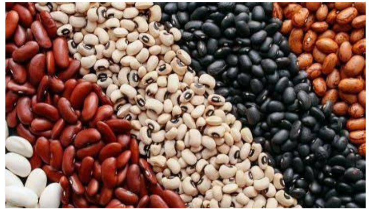
Brasil se destaca como um dos países que mais consome e produz feijão no mundo

Ontem foi comemorado mundialmente o Dia do Feijão, data criada pela ONU para incentivar o consumo do grão que tem alto valor nutricional