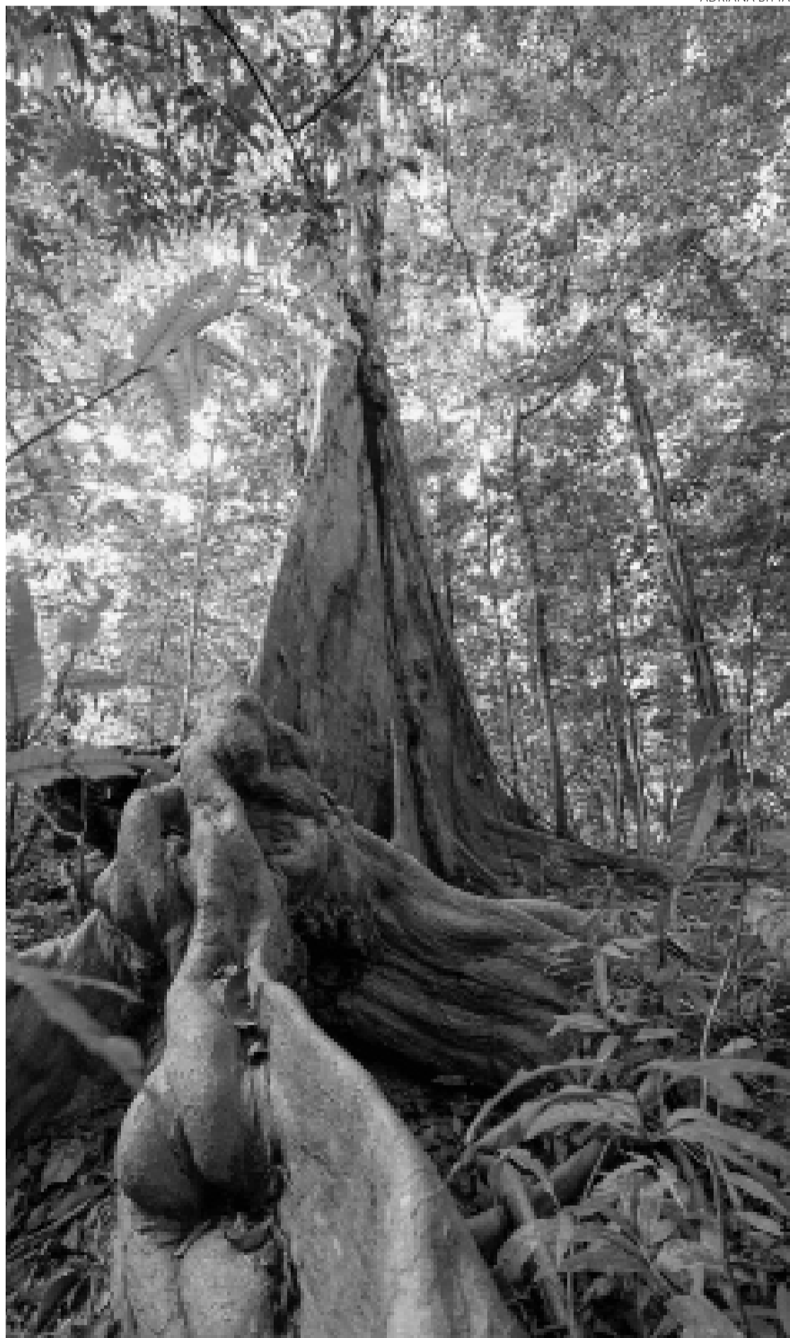
Goiana registrou fauna, flora e habitantes do Cerrado, Pantanal e Amazônia

Duarte explica que “Dentro” lhe parece um lugar que contempla o encontro dessas imagens e dessa inquietação inicial da artista. “Surtiu de