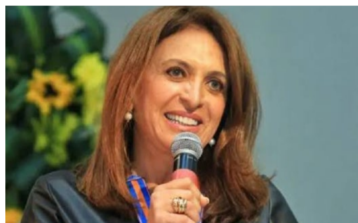
Primeira-dama e coordenadora do Goiás Social, Gracinha Caiado: "O programa tem um papel estratégico dentro do Goiás Social"

Os cursos oferecidos pelo Crédito Social fazem parte do portfólio da Emater e são voltados, principalmente, para a área produtiva, abrangendo temas como apicultura, avicultura, fruticultura, irrigação, piscicultura e manejo de pastagens. Além disso, há capacitações na área de beneficiamento e processamento de alimentos,