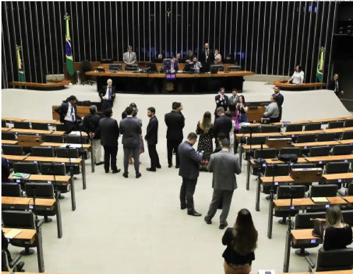
Bancada evangélica: nome surgiu durante promulgação da Constituição de 1988 com crescimento de grupo na política

De acordo com André Ítalo, a bancada tem crescido de maneira mais lenta, diferente do que ocorreu no final dos anos 1990 e em 2010. "É natural por-