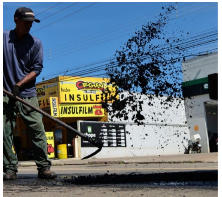
Prefeitura identifica buracos por tamanho e em duas categorias: busca de melhor solução para cada caso

Se maior do que 60 centímetros, o entorno do buraco é demarcado e preparado para receber asfalto do tipo CBUQ, tido por técnicos como um dos melhores e mais duráveis.