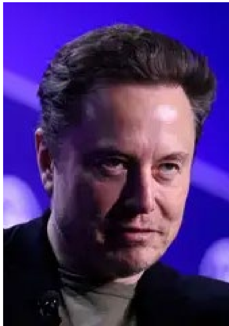
Elon Musk é o encarregado de cortar gastos públicos em todas as estruturas da nova gestão

O jornal acrescenta que "o Departamento de Defesa conta com Musk para colocar em órbita a maioria de seus satélites e trabalha em estreita colaboração com suas empresas em vários outros assuntos. No ano passado, suas empresas receberam promessas de 3 bilhões de dólares em quase cem contratos diferentes com dezessete agências federais".