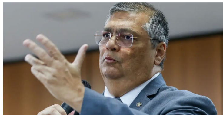
Ministro Flávio Dino do Supremo Tribunal Federal (STF)