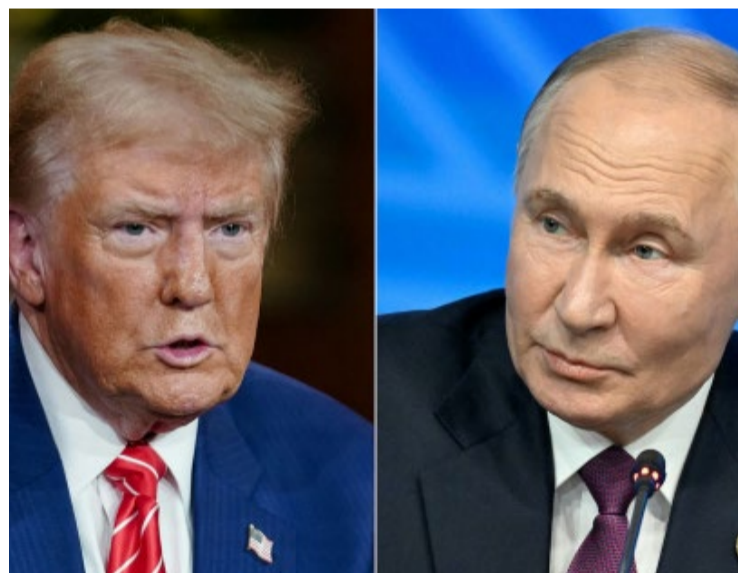
Trump revelou ter conversado por telefone com o presidente russo Vladimir Putin

A principal preocupação de Zelensky é garantir que a Ucrânia não seja excluída das discussões sobre seu próprio futuro. O líder ucraniano busca ativamente o diálogo com Trump para evitar um acordo que não leve em conta os interesses de seu país.