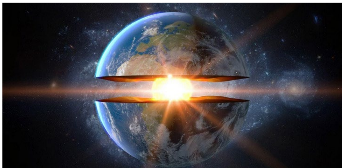
Pesquisadores descobrem transformações surpreendentes no coração do planeta

Esta descoberta representa um avanço significativo na compreensão da dinâmica interna do nosso planeta. Xiaodong Song, sismólogo da Universidade de Pequim não envolvido no estudo.