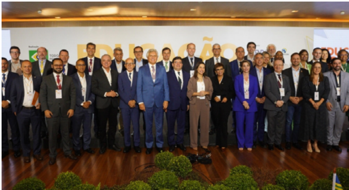
Ronaldo Caiado sublinha índices educacionais de Goiás em evento realizado em Brasília

Desde 2019, o Governo de Goiás investiu R$ 7,4 bilhões na educação, promovendo a construção de 30 novas escolas, re-