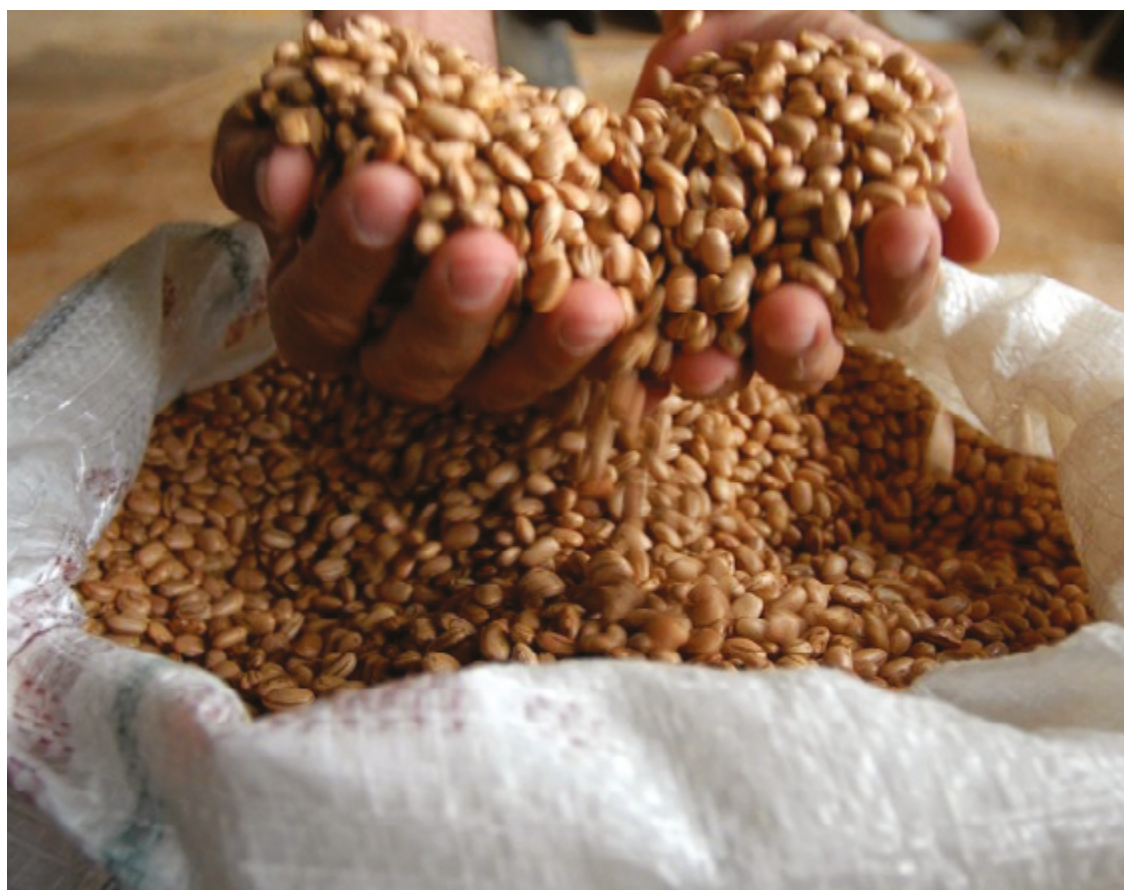
Maior peso na variação de preços para baixo ficou por conta do feijão, pacote de 4,5 kg, que teve queda de 19,95%.

Os resultados da pesquisa realizada pelo NEPE-CeTTeD/UEG,