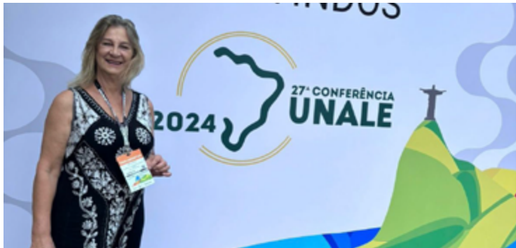
Dra. Zeli: fortalecimento do Legislativo