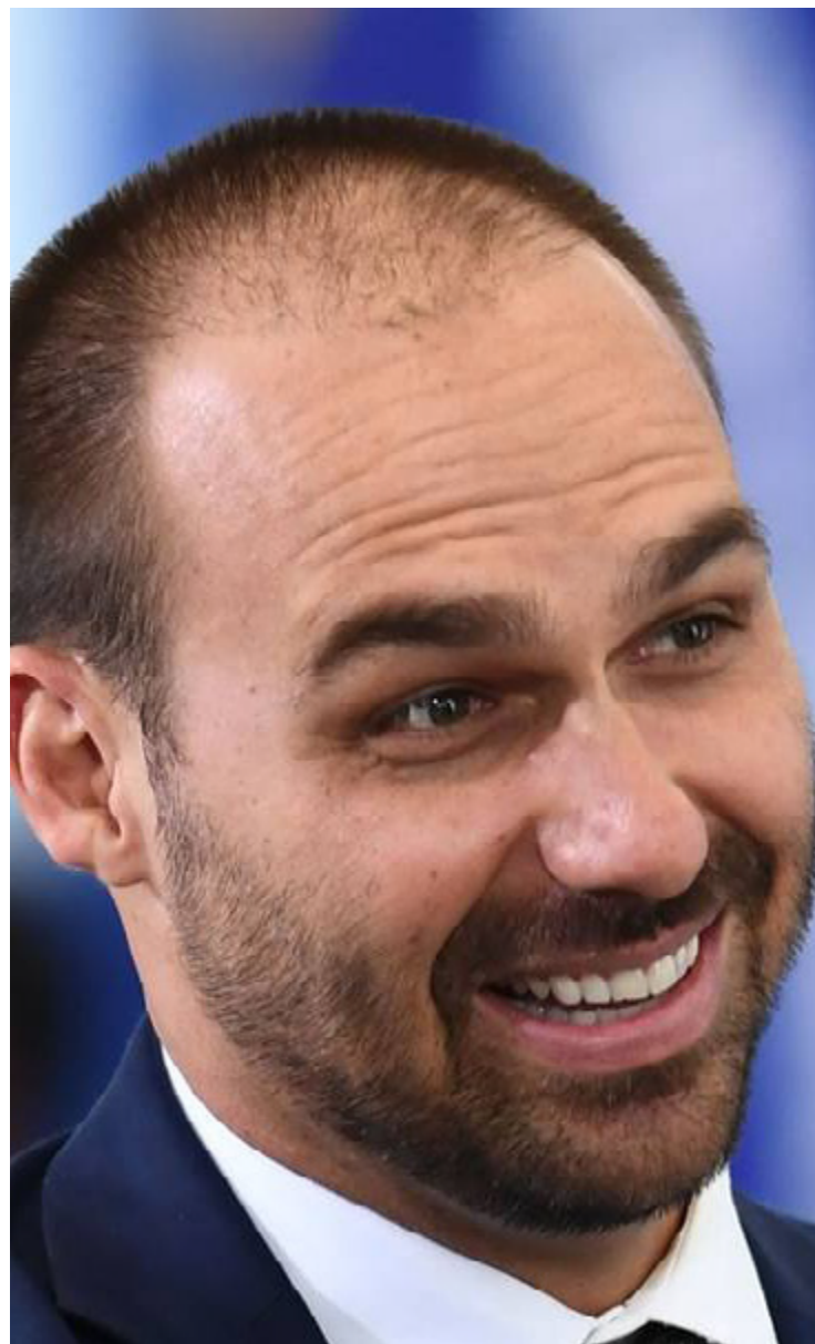
Eduardo Bolsonaro: de olho na sucessão presidencial de 2026 pelo PL

Walter Braga Netto, que compôs a chapa de Bolsonaro à reeleição, foi excluído da sanção, uma vez que não ficou demonstrada sua responsabilidade na conduta. Nesse ponto, a decisão foi unânime.