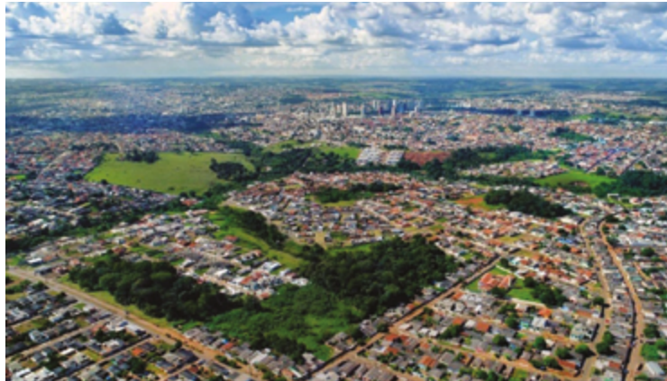
Conferência será no Centro Administrativo Adhemar Santillo e vai eleger delegados para representar Anápolis na 5ª Conferência Estadual do Meio Ambiente

Com o tema "Emergência Climática em seus cinco eixos temáticos", a Conferência se apresenta como uma oportunidade para a população anapolina contribuir diretamente para a definição de políticas públicas sobre mudança climática. Os cinco eixos a serem abordados incluem Mitigação, Adaptação e preparação