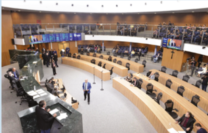
Parlamento aprovou a lei foi com 21 votos favoráveis e 4 contrários