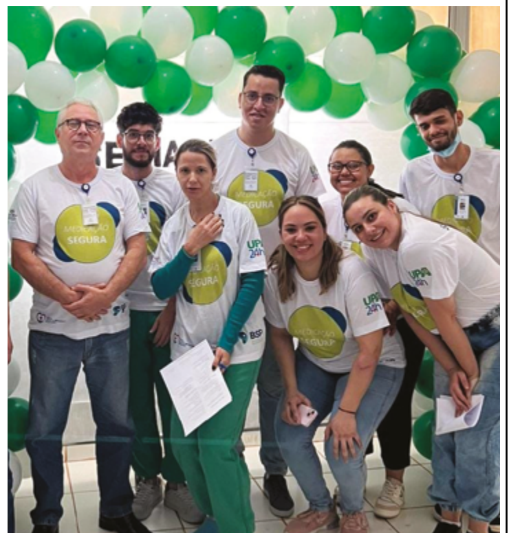
Organizadores esperam atingir centenas de pessoas, entre profissionais e usuários do sistema de saúde da Vila Esperança

"É essencial manter esses remédios em locais devidamente identificados e com acesso controlado. Muitas vezes, o erro está na organização, e isso pode ser prevenido com medidas simples, como etiquetas bem visíveis e protocolos claros", explica. Além das palestras para profissionais de saúde, o treinamento inclui atividades educativas para pacientes, que aprendem sobre o correto uso de medicamentos em casa.