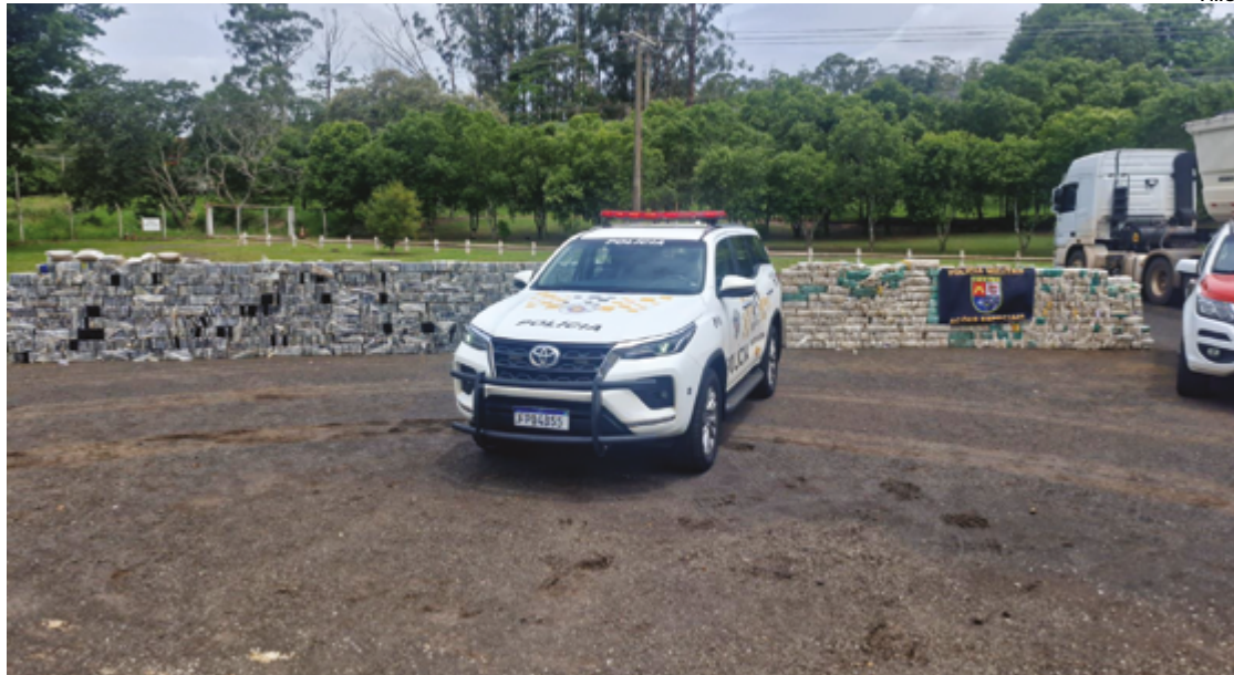
A ação teve início com o compartilhamento de informações de inteligência entre as forças policiais

A ação teve início com o compartilhamento de informações de inteligência entre as forças policiais. O alvo foi um caminhão que transportava uma carga de ração animal e que seguia em direção ao Estado de São Paulo. A abordagem ocorreu na cidade de Assis, em São Paulo, onde, após minuciosa fiscalização,