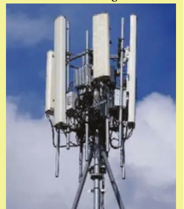
Todas as quase 60 antenas instaladas no município pelas diversas operadoras são capazes de transmitir o 5G puro, a partir da liberação da Anatel