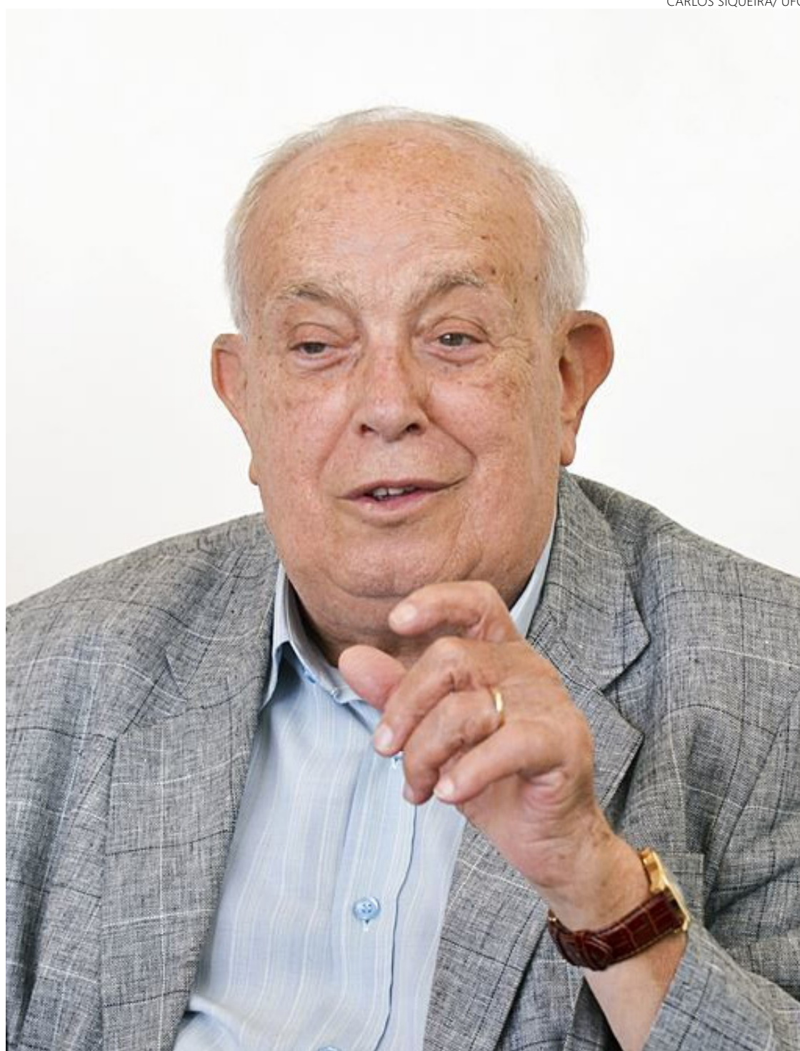
Reconhecimento: intelectual produziu textos que o tornaram referência em literatura no Brasil

Todavia, anos depois, sendo ambos professores na UFRJ, o Departamento de Letras decidiu homenagear Cyro dos Anjos em seus 80 anos e o goiano foi designado a saudá-lo. “Fiz com todas as reverências”, lembrava, sem guardar mágoa do mal-estar ocorrido em Brasília, conforme trechos de entrevista con-