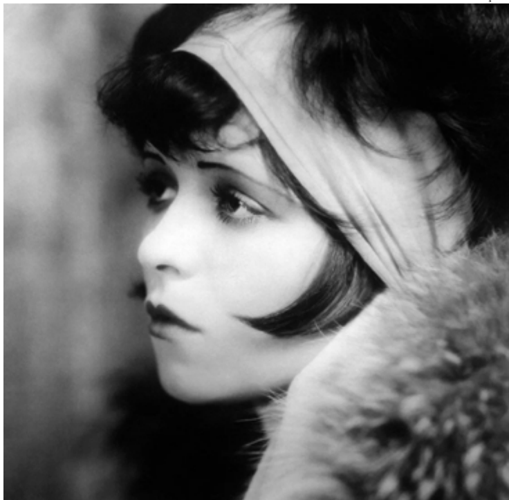
Atriz norte-americana Clara Bow está cartaz na mostra