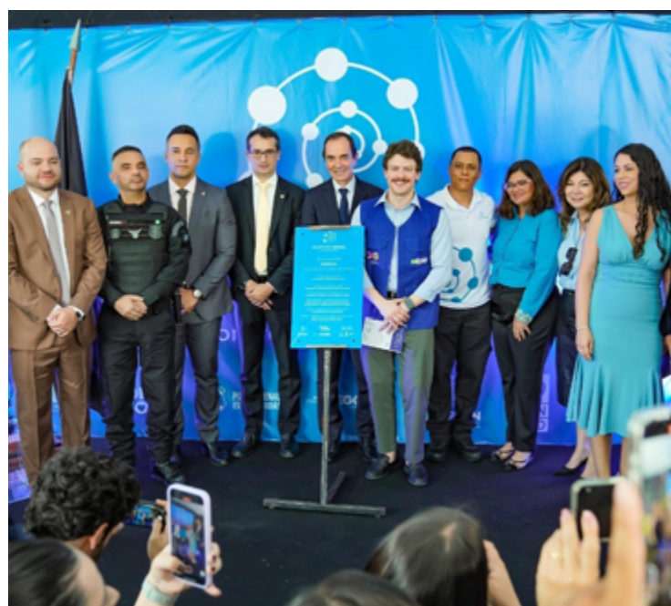
Inauguração do Escritório Social: escuta qualificada e singularização do atendimento

O Escritório Social conta com uma equipe multidisciplinar, formada por recepcionista, assistente social, psicólogo e bacharéis em Direito e Letras. O objetivo é escutar o apenado e encaminhá-lo para que acesse seus direitos, como confecção de documentos e encaminhamento para cursos profissionalizantes e ao mercado de trabalho.