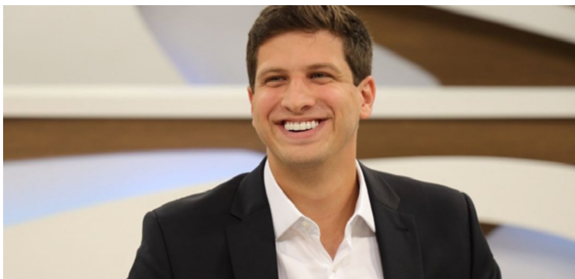
João Campos: missão à frente do PSB nacional em 2025

Para oficializar a transição, o prefeito precisa ser aprovado em votação pela Executiva Nacional do PSB.