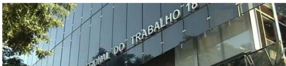
Vagas são para estudantes de cursos técnicos e graduação