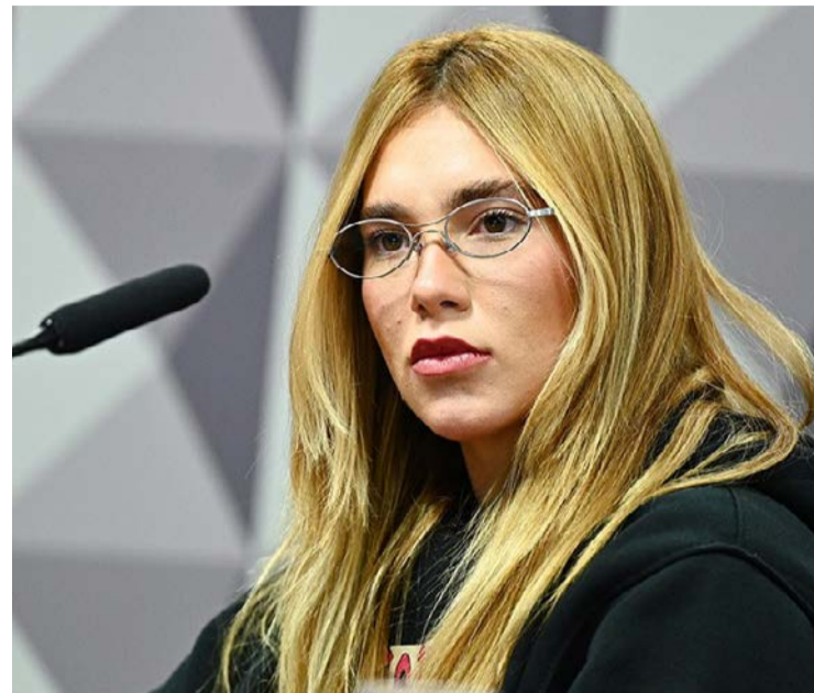
Virginia Fonseca presta depoimento em CPI no Senado, em 2025