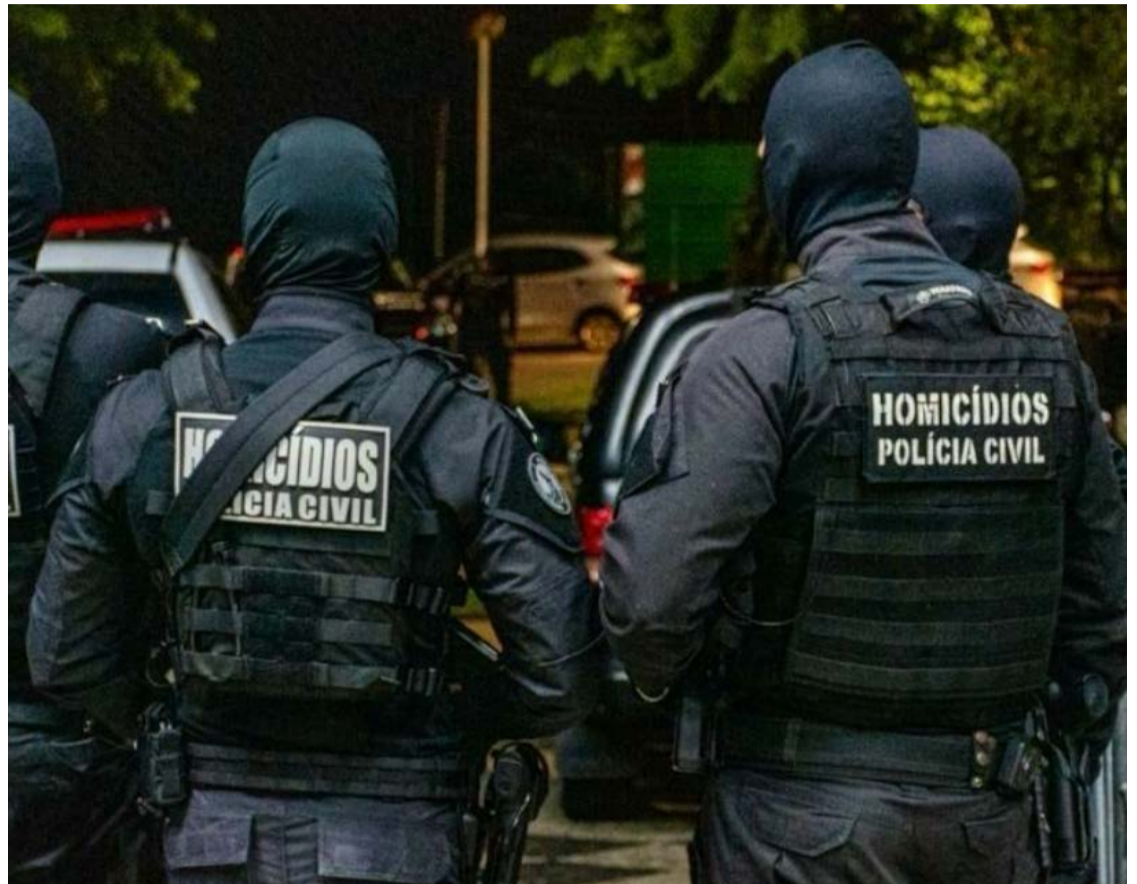
Melhores índices são associados à rápida resposta das forças policiais: menor desigualdade também contribui

O diagnóstico também avalia aspectos relacionados à dinâmica da criminalidade, às condições socioeconômicas, à estrutura das polícias e aos indicadores operacionais das investigações. A pu-