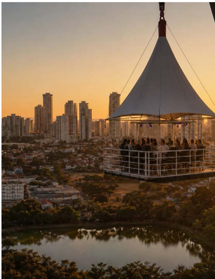
Experiência será realizada entre 12 e 27 de julho e permitirá ao público apreciar a paisagem de Goiânia

Para participar, os interessados deverão visitar o estande de vendas do City