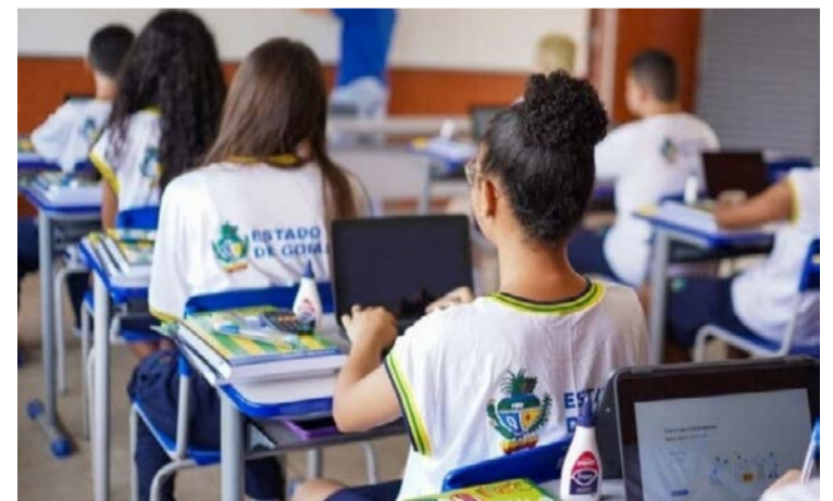
Estudo coloca Goiás na sexta posição nacional em remuneração inicial