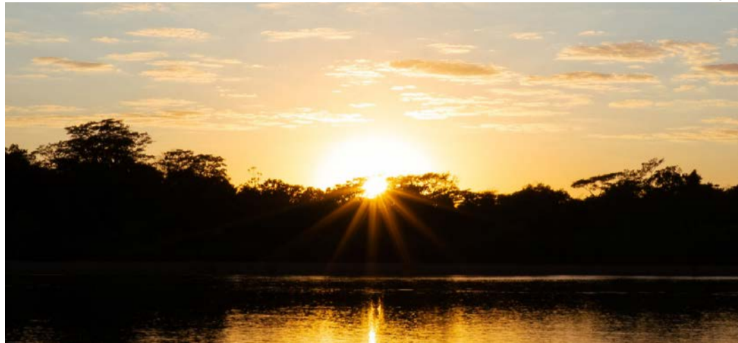
Despedida do dia: Araguaia oferece um dos espetáculos mais bonitos do Cerrado

Há lugares que nos alimentam antes mesmo de qualquer refeição chegar à mesa. O Rio Araguaia é um deles. Todos os anos, quando a temporada de praias começa, milhares de pessoas deixam para trás a rotina das cidades e seguem em direção às suas margens. Não procuram apenas um destino turístico. Procuram uma forma diferente de viver o tempo. O relógio perde importância. O celular passa horas esquecido. A conversa volta a ocupar o lugar das notificações. É um cenário onde o luxo não está na sofisticação de um hotel cinco estrelas, mas no privilégio de contemplar um dos rios mais belos do Brasil enquanto o sol nasce lentamente sobre as águas. Como gastrônoma e sommelière, aprendi que alguns lugares despertam imediatamente a vontade de cozinhar, compartilhar e brindar.