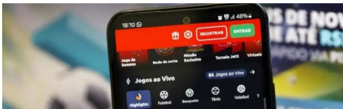
Novas regras exigem alertas sobre os riscos das apostas e mensagens de advertência