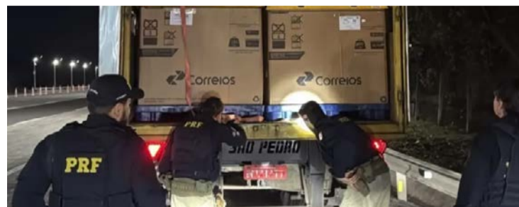
Dois suspeitos foram encaminhados à Polícia Federal

Abordagem ocorreu após uma análise de risco indicar possível irregularidade no transporte