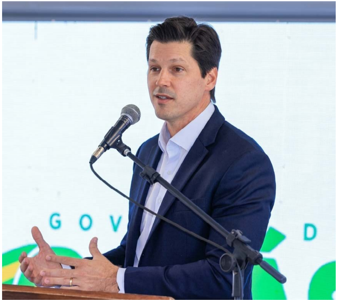
Daniel Vilela aparece com 43% dos votos; Marconi Perillo é o segundo com 26%

Os cenários de segundo turno também mostram ampla vantagem para Daniel Vilela. Em um eventual confronto contra Marconi Perillo, o governador alcança 55% das intenções de voto, contra 29% do tucano, uma diferença de 26 pontos. Já diante de Wilder Morais, Daniel registra 54%, enquanto o senador aparece com 28%, mantendo também 26 pontos