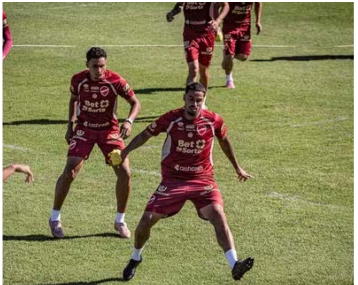
Equipe colorada enfrenta o Juventude, às 19h, no Estádio Alfredo Jaconi, em Caxias do Sul (RS)

classificação, o confronto coloca frente a frente duas equipes que vivem momentos distintos na competição. O Vila Nova chega embalado pela vitória por 2 a 1 sobre o São Bernardo, no Estádio Onésio Brasileiro Alvarenga (OBA), mas sua campanha recente tem