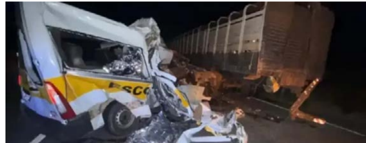
Investigação identificou irregularidades nos dois veículos