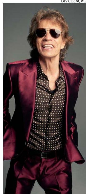
Cantor surpreende com energia jovial

O frontman desempoeira ainda a gaita em "You Know I'm No Good", de Amy Winehouse. "Back In Your Life" antecede o retorno ao início, simbolizado em "Beautiful Delilah", de Chuck Berry. "Eu adorava a naturalidade dele", disse Keith Richards ao "The Guardian".