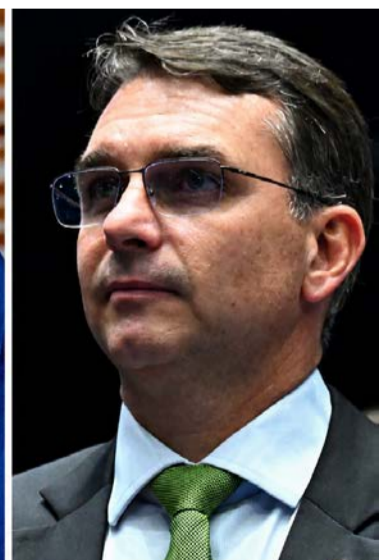
Caiado aparece na liderança segundo Real Time Big Data; seguido por Lula e Flávio Bolsonaro

que está inelegível, e Michelle Bolsonaro (PL) são citados por 1% cada.