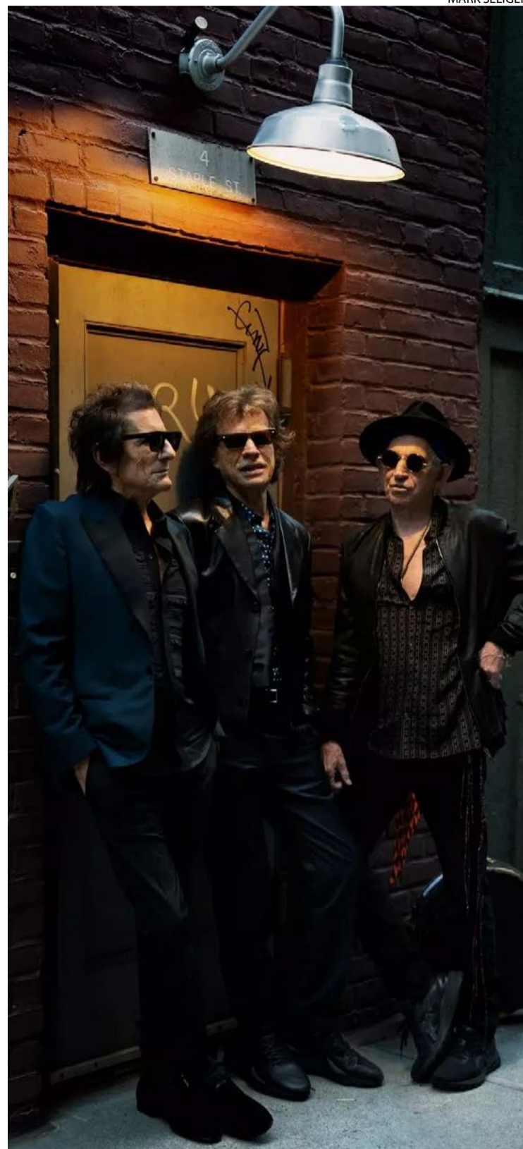
Músicos se mostram atentos ao mundo e seus dilemas

Entre os guitarristas, rola uma simbiose. Wood vê-a como se fosse pura tecelagem, união de acordes e solos entrelaçados por tons. Já Richards, gargalhando com sua voz grave e rouca, tem uma receita intuitiva. "Riffs, você não pode forçá-los. Simplesmente eles vêm até você."