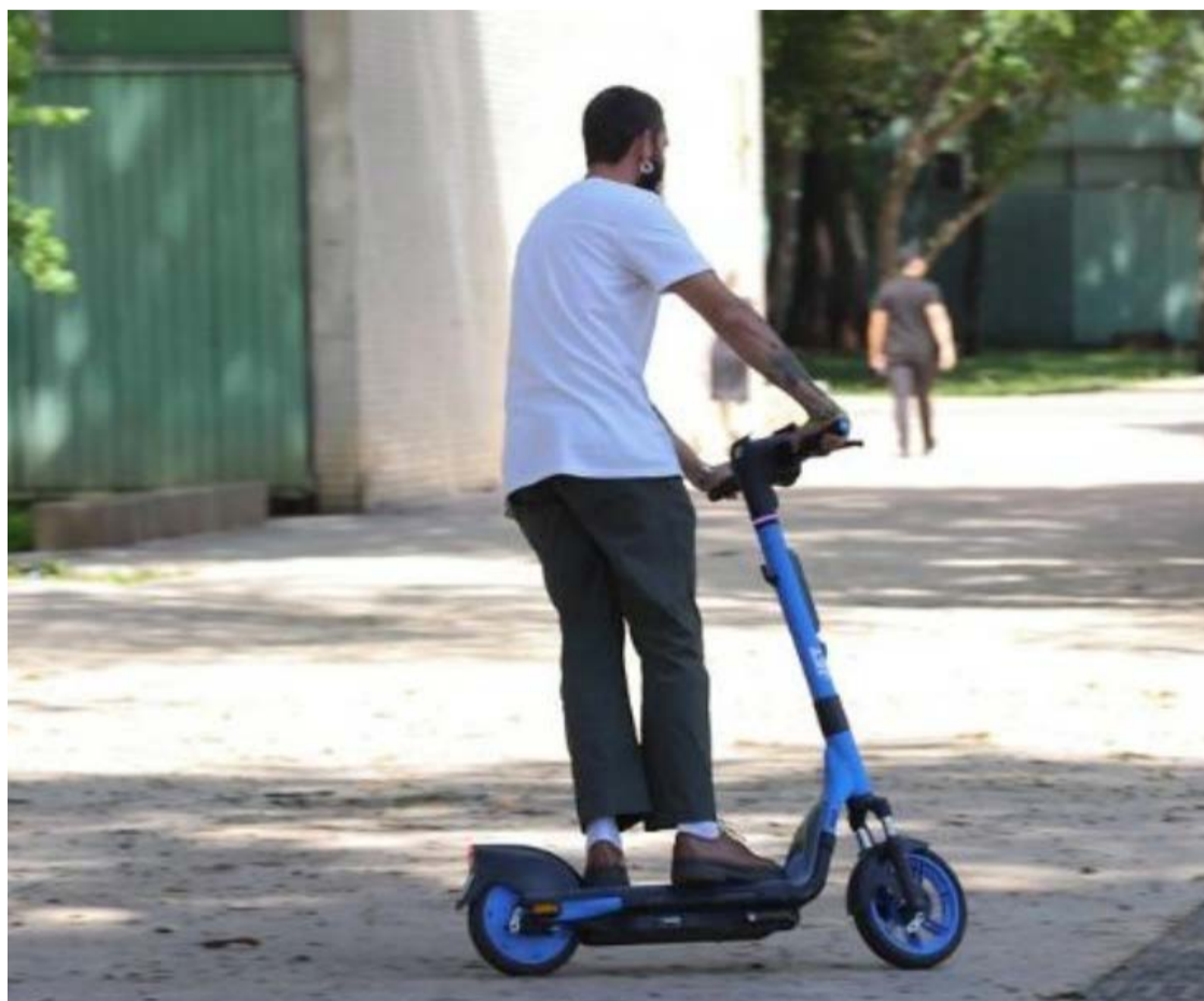
Usuários de patinetes podem circular em calçadas, mas devem respeitar velocidade

A Secretaria de Engenharia de Trânsito (SET) de Goiânia realiza nesta semana uma ação educativa no Parque Vaca Brava, no Setor Bueno, para orientar condutores sobre essas normas. A iniciativa esclarece que ciclomotores não podem trafegar em calçadas e exigem habilitação, licenciamento e emplacamento; bicicletas elétricas devem ser conduzidas como bicicletas convencionais e, nas calçadas, precisam ser empurradas; já patinetes elétricos, monociclos e outros veículos autopropelidos podem circular nos passeios em velocidade de até 6 km/h e, nas vias públicas, apenas onde