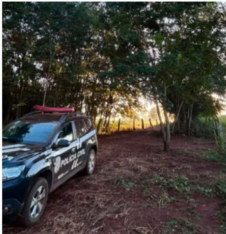
Agravamento ocorreu após mulher querer se separar

Casal mantinha relacionamento havia cerca de cinco meses; denúncia aponta violência