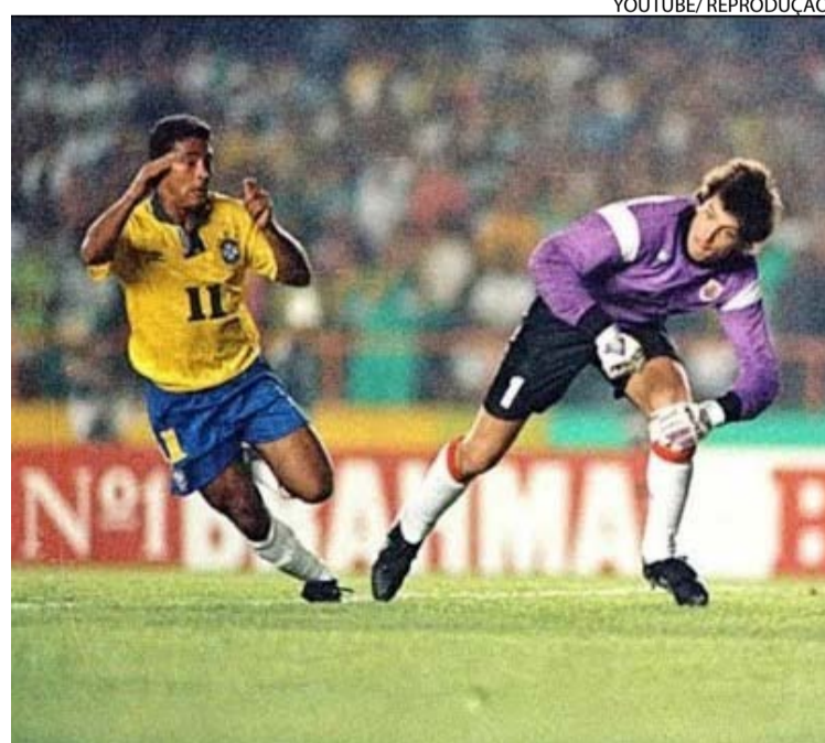
Romário dribla goleiro uruguaio nas Eliminatórias, em 1993

Em meio à muralha sueca, o pequeno Romário (1,68 m) cabeceou após cruzamento de Jorginho. O atacante perderia outra chance, chutando à direita do arqueiro escandinavo. Baggio, Roberto Baggio, perdeu aquele pênalti.