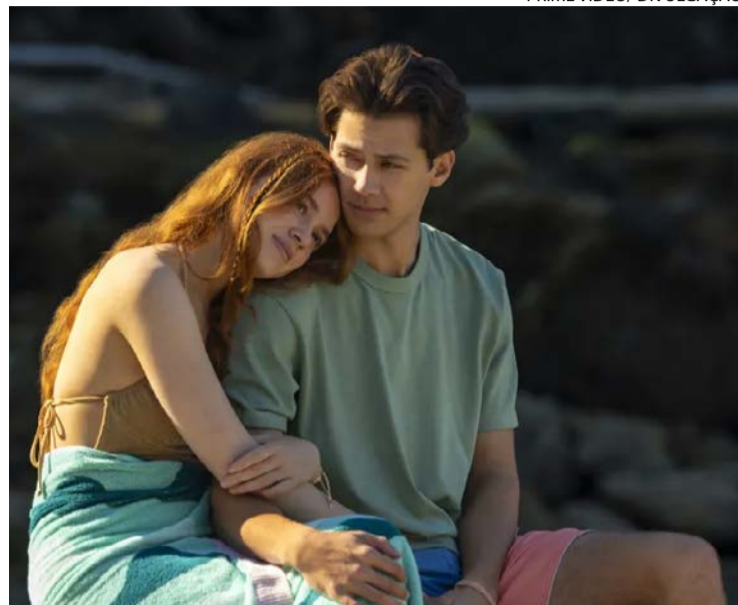
Série acompanha Percu e Sam enquanto vivem um romance