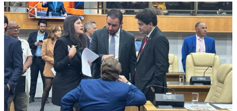
Vereadores de Goiânia no plenário durante sessão ordinária

Projeto vai à sanção com alteração: medida vale retroativamente a partir de janeiro desse ano