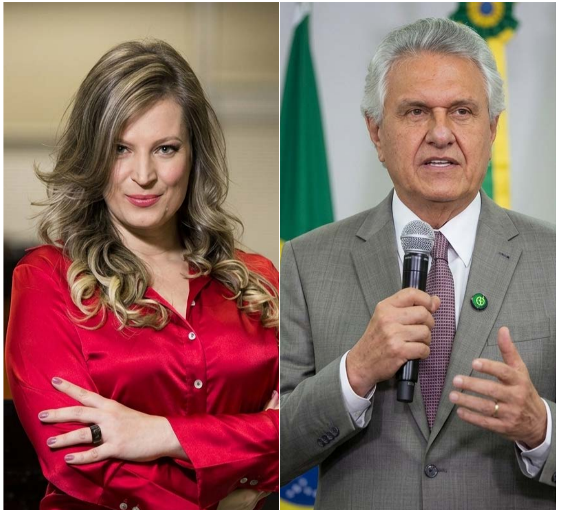
Joice Hasselmann entende que a candidatura de Caiado tem mais chances do que a de Flávio

As declarações também serviram para estabelecer um contraste com o senador Flávio Bolsonaro (PL), frequentemente lembrado como um dos possíveis representantes da direita na corrida presidencial. Sem poupar críticas, Joice avaliou que o parlamentar teria dificuldades em um confronto direto com Lula e afirmou que uma candidatura ligada à família Bolsonaro poderia favo-