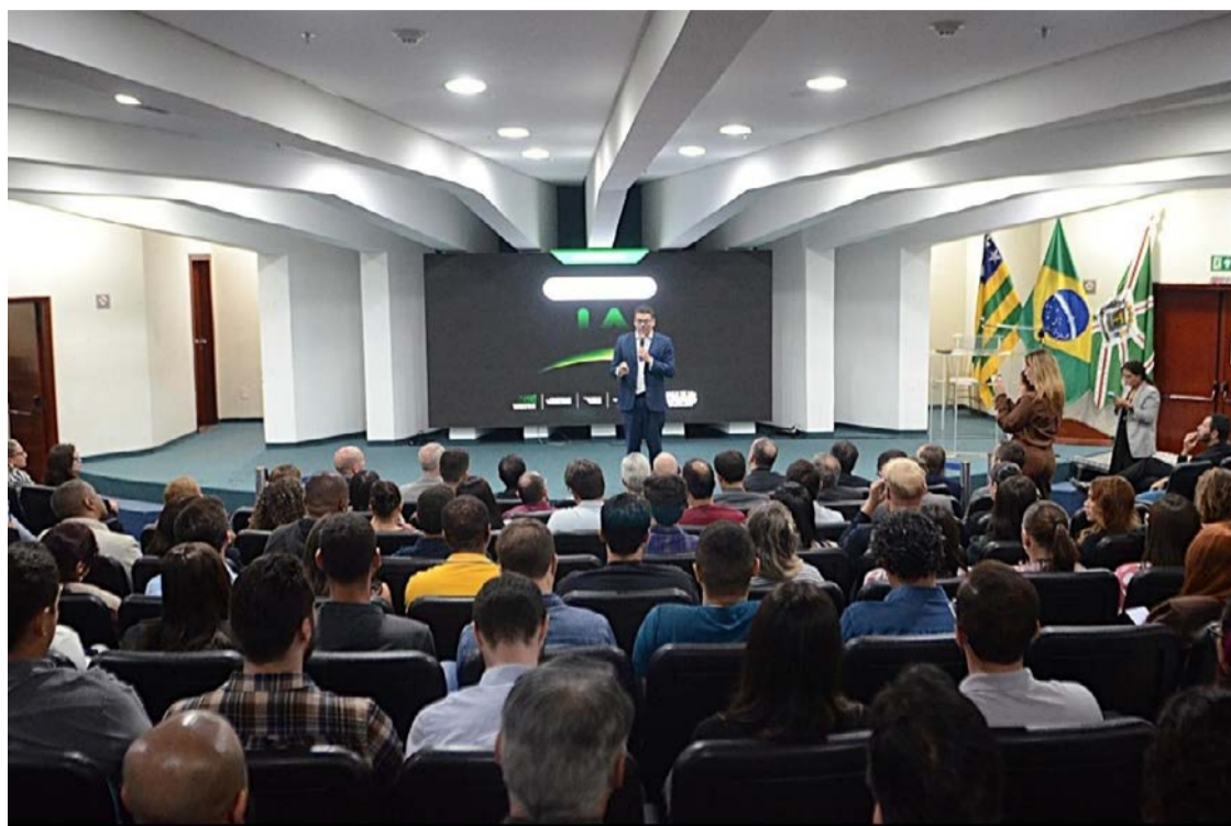
Parceria entre Governo de Goiás e Google prevê expansão gradual do uso de inteligência artificial na administração estadual

O diretor de Mercado de IA do Google para a América Latina, Marcel Silva, destacou o alcance da iniciativa e seu potencial para servir de referência nacional. “A inteligência artificial é uma das tecnologias mais transformadoras da nossa era. Este projeto é pioneiro pela sua magnitude e pela escala que pretende alcançar. Estamos falando de até 20 mil servidores utilizando o Gemini como plataforma prioritária de inteligência artificial