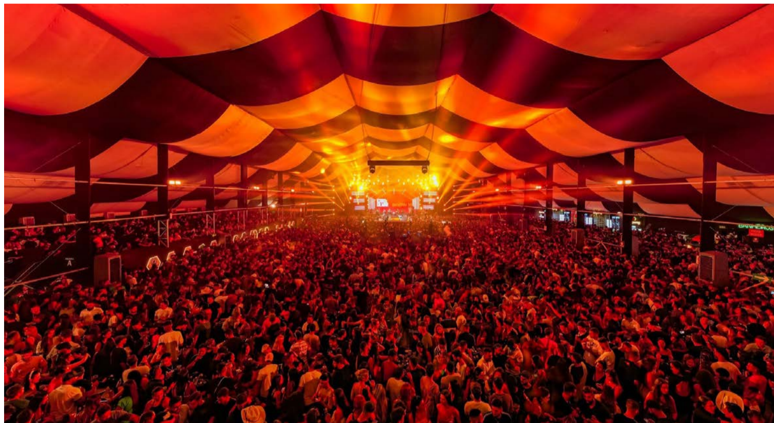
Copa Experience conta com estrutura dedicada ao entretenimento e apresentações musicais em datas da competição