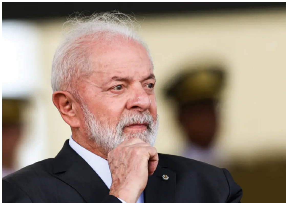
Lula da Silva: dois anos pela frente para recuperar prestígio eleitoral país afora

No extremo oposto, 33% dos eleitores classificam seu desempenho como “ruim” ou “péssimo”. Embora esse índice seja ligeiramente inferior aos 35% registrados em sua posse, a desaprovação manteve-se dentro da margem de erro de 2 pontos percentuais nos últimos dois anos, atingindo um pico de 37% em maio de 2024. Esses números, aliados a uma