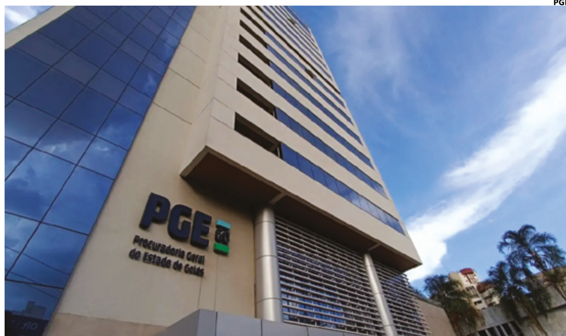
Medida promove redução do volume de processos, adotando estratégias conciliatórias para quitação das pendências