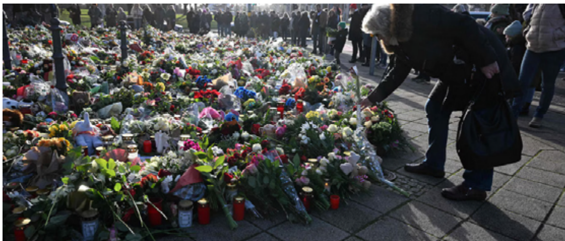
Debates sobre segurança e imigração impactam campanha para as eleições legislativas na Alemanha

O suspeito, um psiquiatra saudita de 50 anos identificado como Taleb Jawad al-Abdulahsen, foi detido na sexta-feira à noite. Suas motivações permanecem incertas, mas relatos indicam que ele expres-