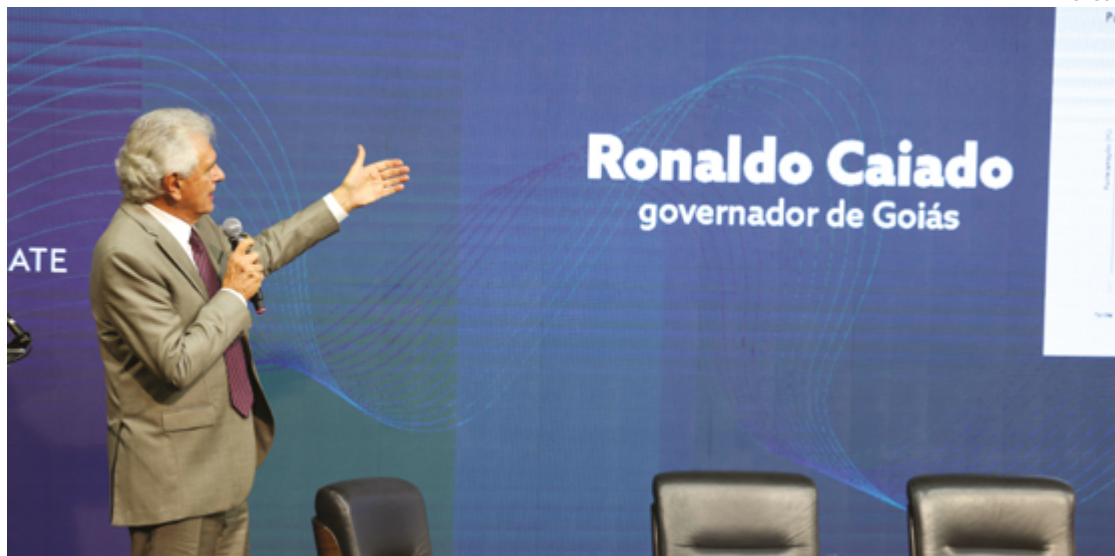
Ronaldo Caiado vê apoio à educação e ciência e tecnologia como forma de induzir desenvolvimento econômico

Caiado apresentou um gráfico com a participação do Produto Interno Bruto (PIB) do Brasil no PIB Mundial. O índice brasileiro apresenta queda desde 1980, quando era de 4%, sendo atualmente de 2,4%. Diante desse cenário, o governador de Goiás defendeu que o Brasil adote medidas semelhantes às implementadas em