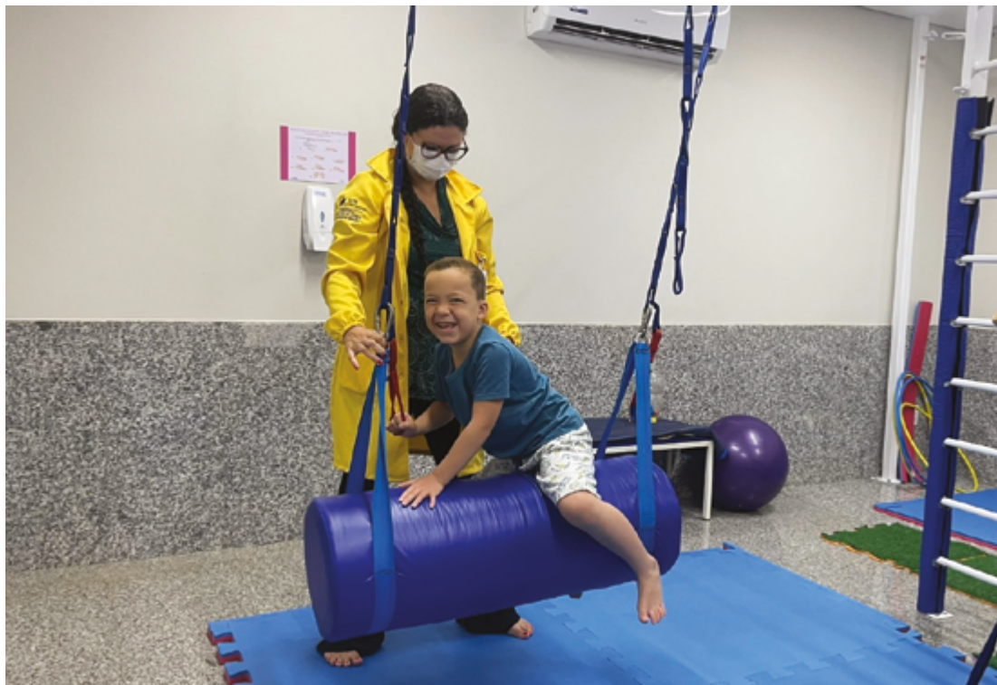
Um dos fatores que contribuem para esse desconforto é a hipersensibilidade ou hiper-reatividade auditiva