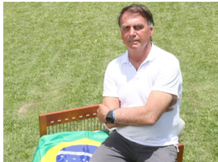
Jair Bolsonaro: inelegível, ex-presidente diversifica as atividades em Brasília

O ex-presidente foi condenado à inelegibilidade até 2030 pelo Tribunal Superior Eleitoral (TSE) devido a ataques ao sistema eleitoral. A decisão não impede que ele ocupe cargos públicos ou administre empresas.