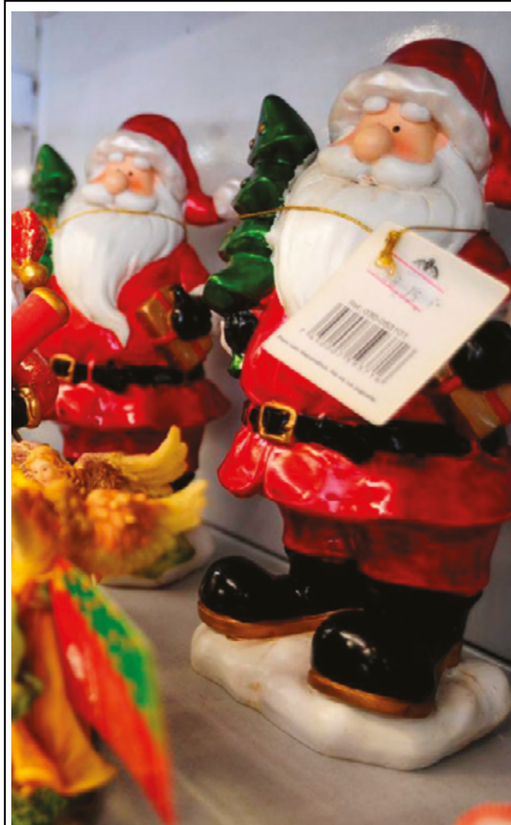
Ritmo normal do comércio será retomado após o dias de feriado