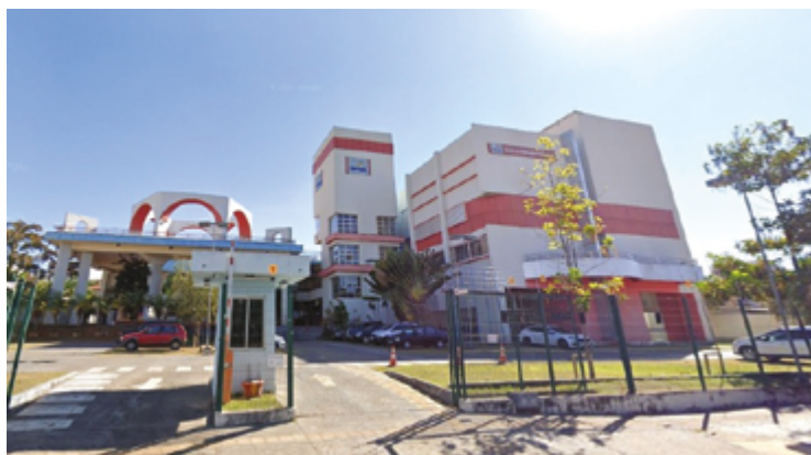
Serviço anunciou novas oportunidades de formação para aqueles que buscam iniciar novo período investindo em conhecimento e carreira

“Estamos investindo em tecnologia de ponta para formar profissionais que vão liderar a transformação digital. Nosso objetivo é oferecer ferramentas para que cada aluno possa conquistar espaço em um mercado