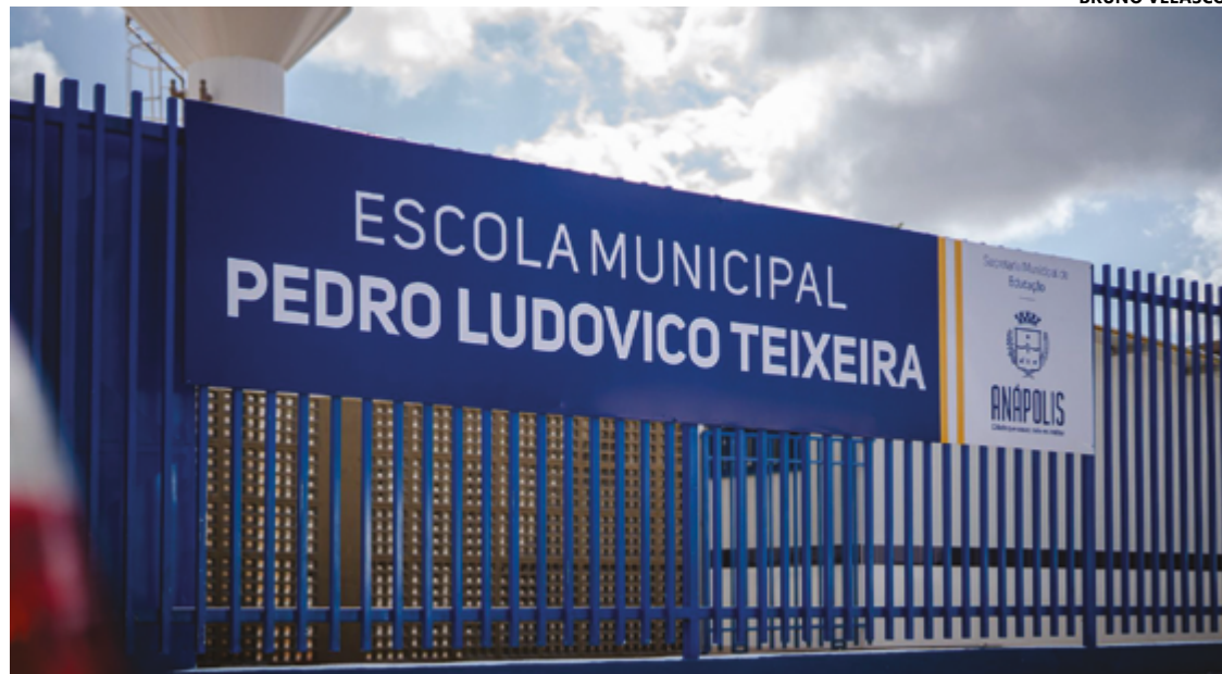
Unidade sofria com graves problemas estruturais, foi derrubada e reerguida dentro dos padrões do FNDE

Nos oito anos da gestão Roberto Naves, foram construídas ou reconstruídas 36 unidades educacionais, entre escolas e CMEIs. Na educação infantil, o CMEI do Jardim Promissão está em fase final