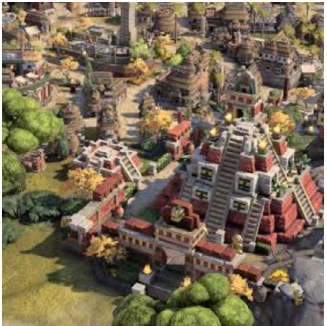
"Sid Meier's Civilization VII": jogo esperado por comunidade gamer deve ser lançado nos próximos meses

Mas tem muito mais: "Monster Hunter Wilds", "Kingdom Come: Deliverance 2", "Avowed", "Assassin's Creed Shadows", dentre outros especulados - cujo melhor exemplo é "Death Stranding 2: on the beach".