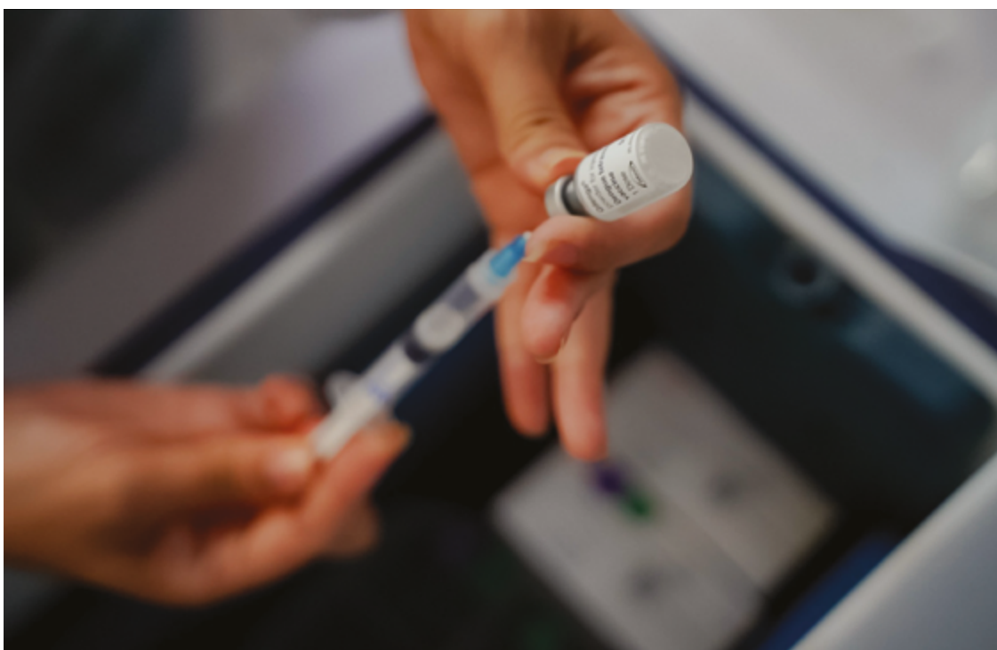
Aprovada pela Agência Nacional de Vigilância Sanitária (Anvisa), a vacina QDENG A protege contra os quatro sorotipos do vírus

A vacina contra a hepatite A é administrada em duas doses, enquanto a da hepatite B exige três. Segundo o especialista, "essas vacinas funcionam estimulando o