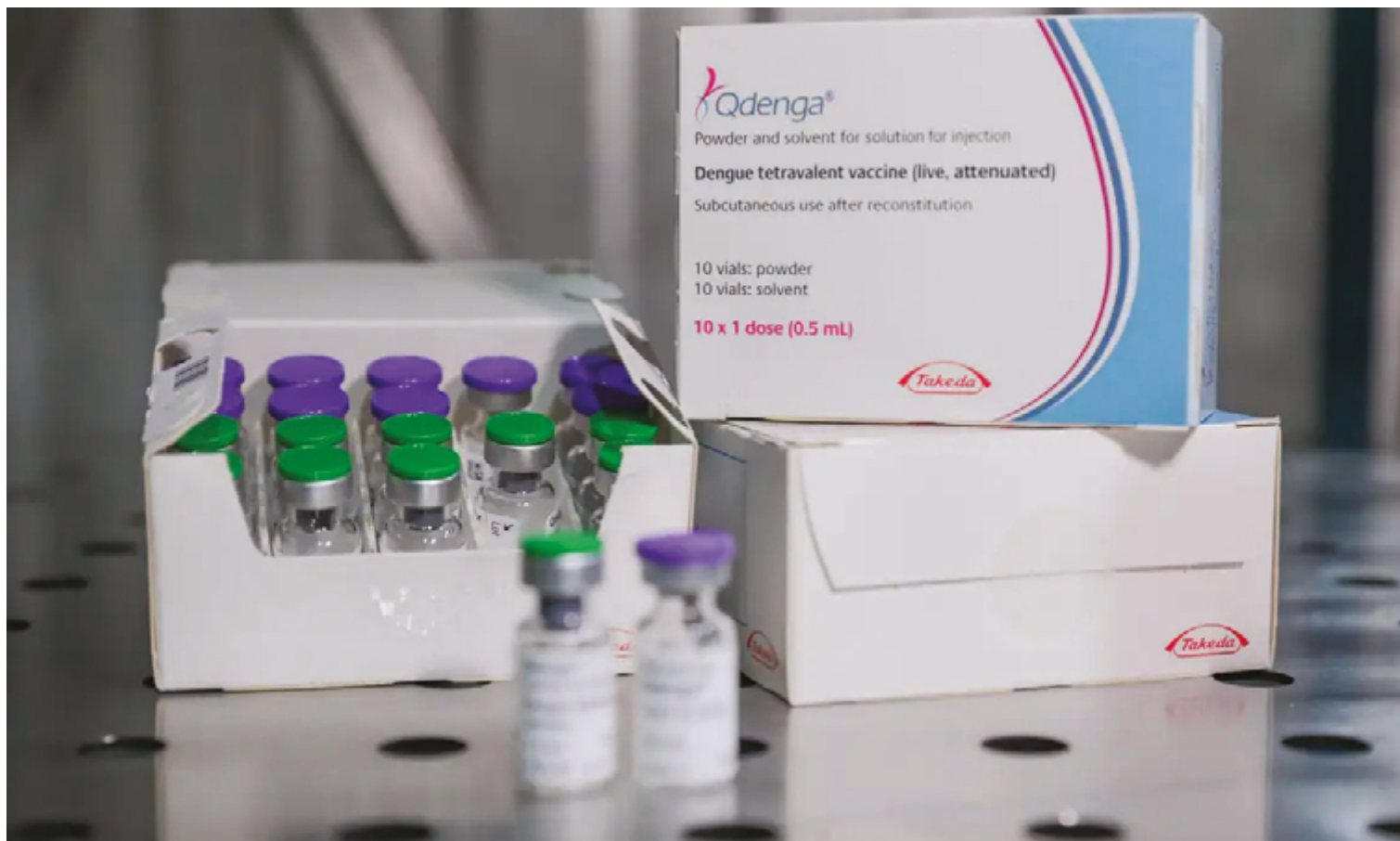
Aumento da circulação dos sorotipos 3 e 4 do vírus agrava o risco de casos graves, especialmente para quem já teve outros sorotipos

Outro exame avançado disponível é o PCR Combo, que detecta os vírus da dengue, zika e chikun-