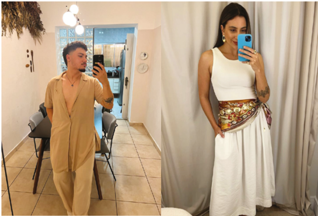
O branco continua sendo a cor mais escolhida no Réveillon no Brasil, representando paz e renovação

Os significados das cores são universais: branco para pureza, amarelo para alegria e prosperidade, vermelho ou rosa para atrair o amor desejado, verde para saúde e o azul para tranquilidade e saúde mental. “Vale lembrar que a escolha das cores não precisa ser limitada a uma única peça. Acessórios são uma ótima forma de combinar tendências e simbolismos. Por exemplo, roupas brancas podem ser complementadas com acessórios coloridos, como