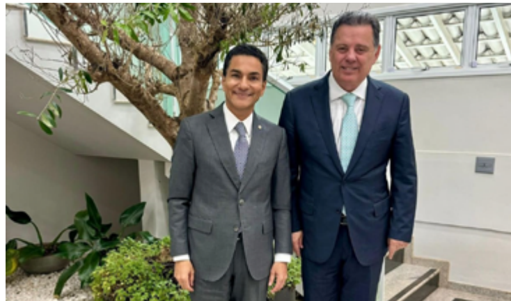
Marcos Pereira e Marconi Perillo; futuro do Republicanos e PSDB