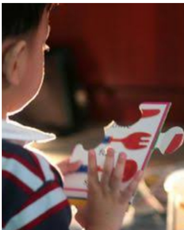
Crianças com TEA apresentam hipersensibilidade que motiva crises de choro e comportamentos autoagressivos

No entanto, a terapeuta reforça que a inclusão depende de todos. Evitar fogos de artifício e controlar o volume da música são ações simples, mas que fazem grande diferença para as pessoas com TEA. "Conscientizar a comunidade é essencial para transformar as festas em momentos de acolhimento, não de exclusão. Pequenos gestos de empatia podem mudar a experiência de quem enfrenta esses desafios", conclui Jackeline.