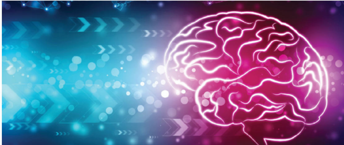
Estima-se que mais de uma em cada 20 pessoas sofra de alguma doença neurológica rara

As doenças raras, apesar do nome, afetam uma par-