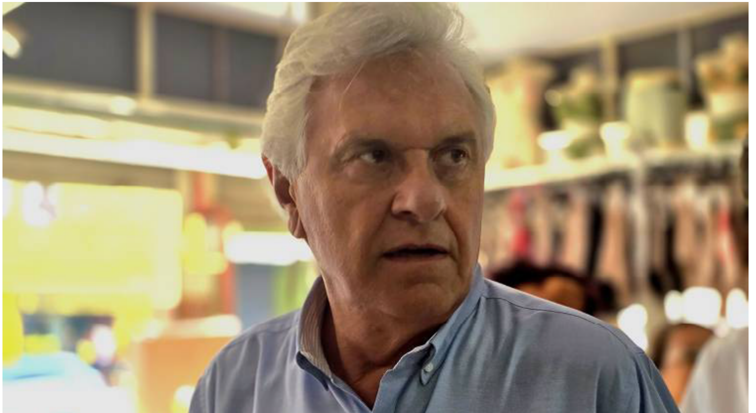
Ronaldo Caiado: goiano faz o dever de casa em Goiás para o embate presidencial de 2026

Ao contrário de Lula, que vê sua popularidade cair em Goiás, a pesquisa aponta que o governador Ronaldo Caiado tem aprovação de 84,3% da