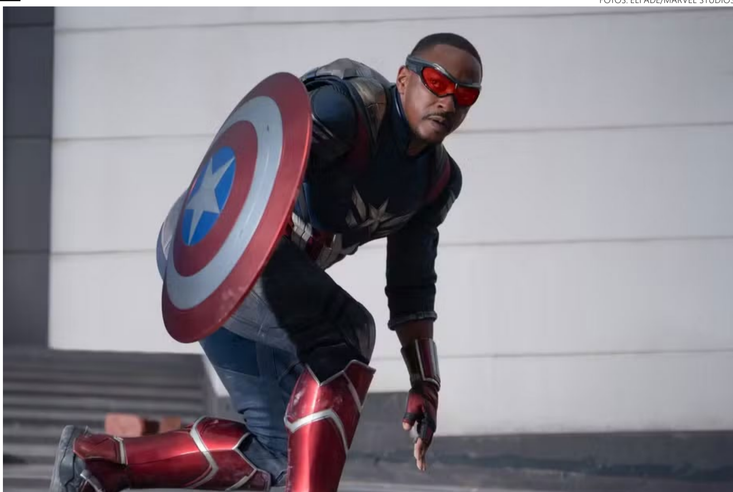
Anthony Mackie interpreta herói norte-americano: longa paga de ingênuo, com resolução de conflito risível e piegas

A continuação é um resto de filme perdido na máquina de produção da Marvel, resultado de diversas refilmagens e da sanha do estúdio em manter colado o seu universo de personagens. Essa colagem de títulos beira ao absurdo aqui, lembrando muitas vezes a bagunça generalizada de "As Marvels", de