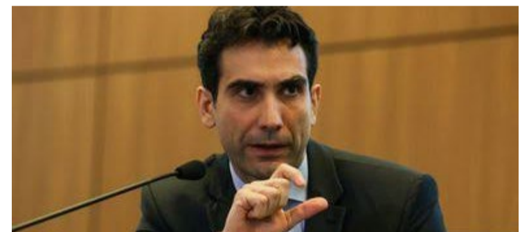
Gabriel Galípolo, presidente do Banco Central