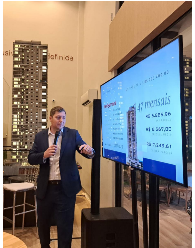
Investidores consideram altamente rentável a aplicação em imóveis

Os imóveis urbanos são alternativas para investimentos, além das aplicações e os negócios agropecuários