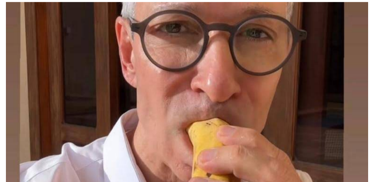
vídeo em que Zema come uma banana com casca viraliza