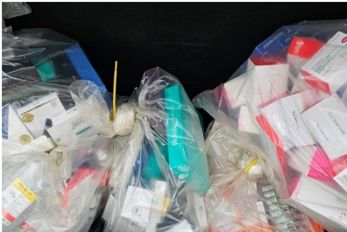
Inspeção encontrou várias irregularidades, como anestésicos reutilizados e falhas na esterilização

Os fiscais também identificaram a manipulação irregular de receitas, embalagens abertas e vencidas de fenol – substância proibida para fins estéticos –, além da reutilização de