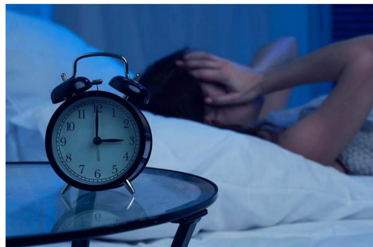
Certos hábitos alimentares podem fazer toda a diferença contra a insônia

Além da escolha dos alimentos, é fundamental jantar com antecedência suficiente antes de dormir para permitir a digestão adequada. Uma refeição equilibrada deve incluir proteínas, vegetais e carboidratos complexos para manter a saciedade e os níveis de açúcar no sangue estáveis durante a noite. Seguindo essas recomendações alimentares, você pode melhorar significativamente a qualidade do seu sono e, conseqüentemente, sua saúde geral.