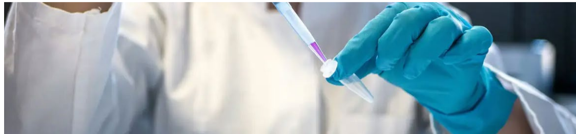
A pandemia afetou a todos, mas afetou muito mais as mulheres

Em 2023, 27% das mulheres e 23% dos homens concluíram a formação. Isso representa, para elas, uma queda de 48% na taxa de formação e, para eles, uma queda de 36%