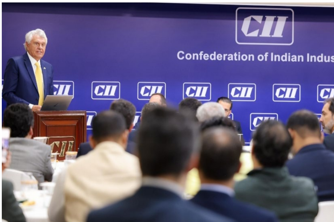
Governador Ronaldo Caiado mostra cenário econômico brasileiro e amplia networking de Goiás junto aos indianos

Caiado destacou a posição estratégica de Goiás no Brasil: "Goiás está exatamente no centro do país, Brasília, a capital, está incrustada no nosso território. É um estado de 350.000 km 2 e que tem um potencial de crescimento enorme. Nós só temos 7 milhões de habitantes. Dentro desta radiografia, quero dizer que esse é o momento oportuno para se investir em Goiás".