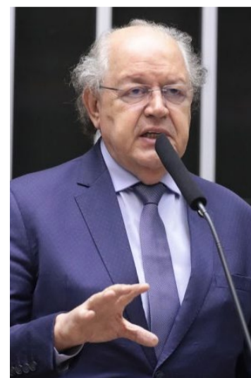
Hauly: sistema aperfeiçoado

tem um presidente que pode ser emparedado pelo primeiro-ministro", explica.