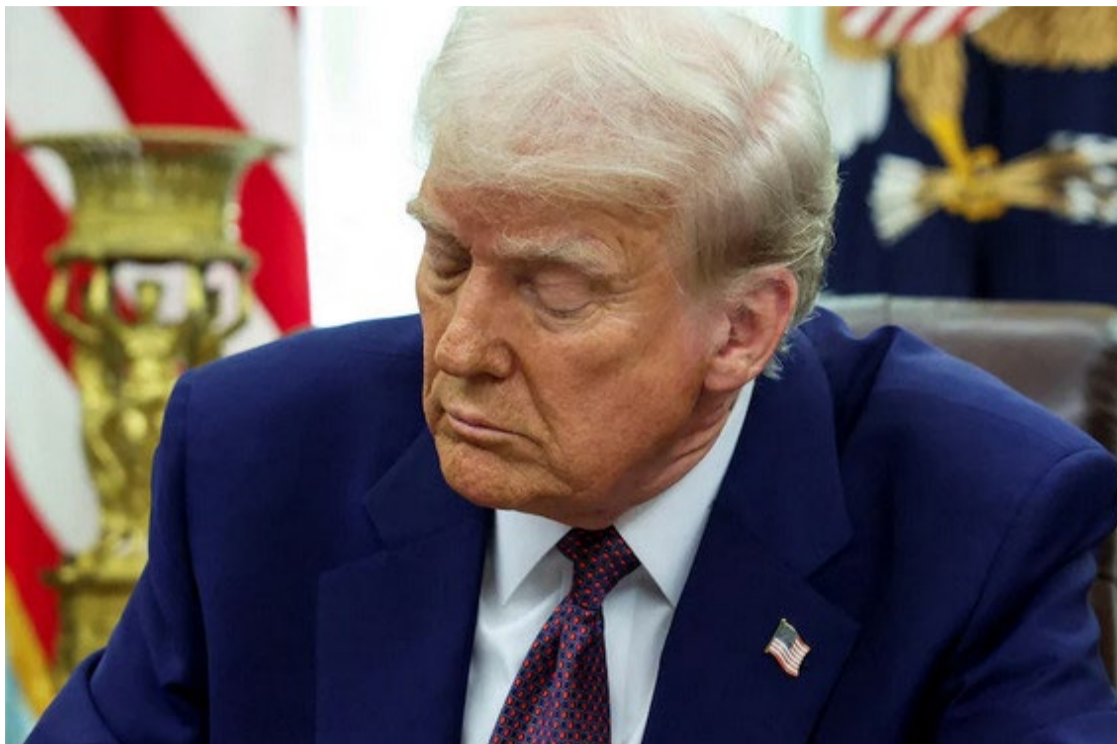
Imposição de tarifas pelos EUA está alinhada com as promessas de Trump de taxar seus parceiros comerciais

Estratégia de Trump visa equilibrar o que ele considera uma disparidade nos acordos comerciais, especialmente com a União Europeia e países emergentes como Brasil, China e Índia. Ao estabelecer uma política de "reciprocidade tarifária", o presidente americano busca proteger a indústria doméstica e reduzir déficits comerciais, mesmo que isso signifique arriscar