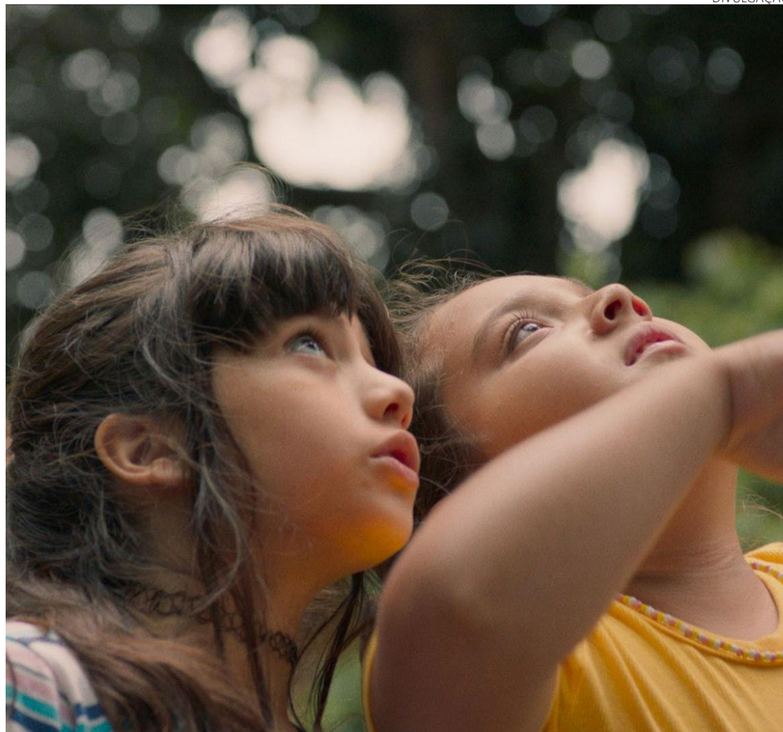
Longa mostra forte laço afetivo na infância que se desenvolve mesmo com diferenças

Apesar das diferenças entre elas, uma forte amizade surge. A relação das duas se guia pelo conforto para enfrentarem juntas os desafios e dores desse momento. Enquanto exploram o hospital e compartilham desejos de sair dali, Glória começa a lidar com sentimentos que parecem não ser seus, desde