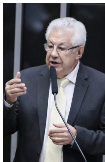
Chinaglia: instabilidade política

"O povo não decidiu o que é o programa que gostaria que fosse aplicado, porque é o primeiro-ministro que vai decidir sobre Orçamento, sobre desenvolvimento, sobre as propostas de distribuição de renda, etc. Portanto, você