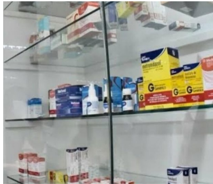
Vendas de artigos farmacêuticos, médicos, ortopédicos, perfumaria e cosméticos cresceram 23,6%

A Pesquisa Mensal do Comércio (PMC) acompanha a evolução do varejo no Brasil, analisando a receita bruta de revenda em empresas formalmente estabelecidas com 20 ou mais empregados e cuja atividade principal seja o comércio varejista.