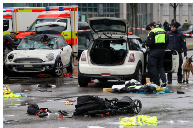
Veículo avançou contra manifestantes em uma avenida de Munique, no sul da Alemanha

O atropelamento ocorre às vésperas da Conferência de Segurança de Munique, que reunirá líderes mundiais a partir de sexta-feira (14). As autoridades afirmaram que o incidente não parece estar relacionado ao evento.