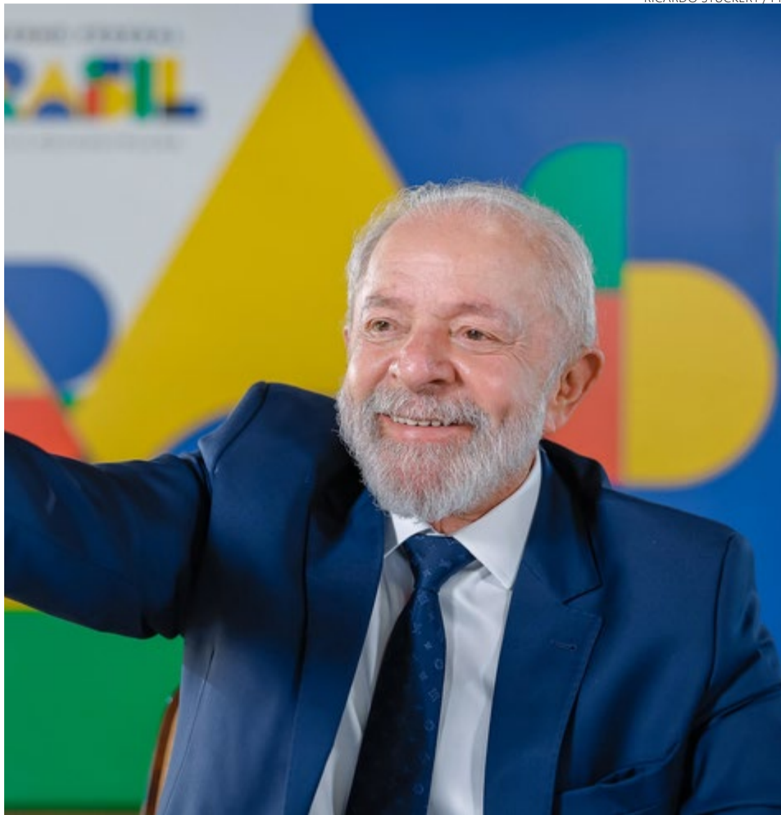
Dança das cadeiras: petista deve redesenhar ministério na próxima semana

Na Casa, Motta disse que a reunião foi boa e a "conversa amistosa", mas evitou dar