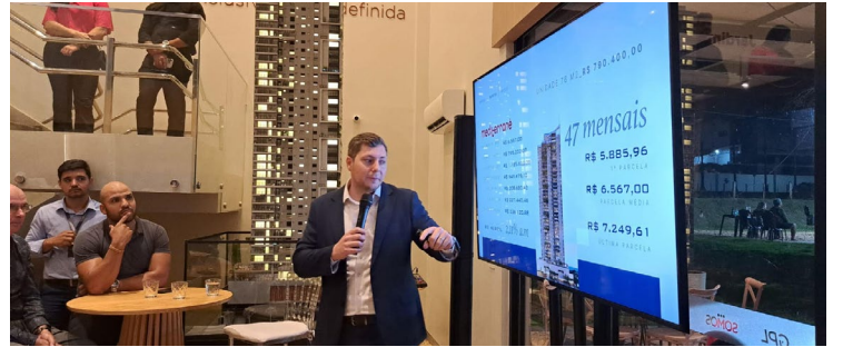
Na capital goiana a valorização é sete vezes mais que São Paulo, aponta consultor imobiliário

Entre as referências importantes, a capital goiana tem como pontos valorizados a modernidade, logística, agronegócio crescente, saúde e a questão da segurança