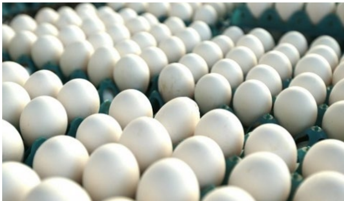
Muitos consumidores têm recorrido aos ovos de galinha para driblar as carnes mais caras

A disparada no preço dos ovos, que tem registrado alta diária no atacado nas regiões produtoras, preocupa supermercados, feirantes e consumidores