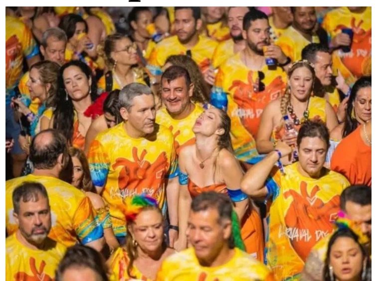
Expectativa da agência municipal é que o setor de serviços seja impulsionado com as atividades do carnaval na Capital

Diversos serviços, como fechamento de ruas, poda de árvores, limpeza das vias e pinturas de meios-fios estão sendo feitos pela prefeitura para garantir uma maior tranquilidade aos foliões. A Guarda Civil Metropolitana (GCM), em parceria com a Polícia Militar (PM), atuará no monitoramento da festa.