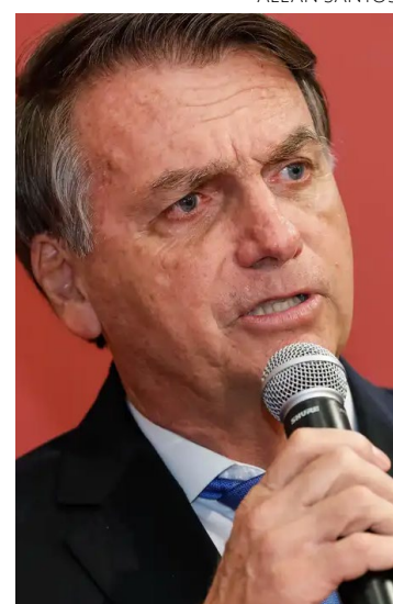
Bolsonaro retomou os ataques ao TSE e às urnas eletrônicas

A avaliação é que o derretimento da popularidade de Lula está relacionado a uma frustração de expectativas da população, que esperava da gestão petista um aumento do poder de compra, mas tem convivido com a alta dos preços, uma pauta sem pontos de contato com temas ideológicos.