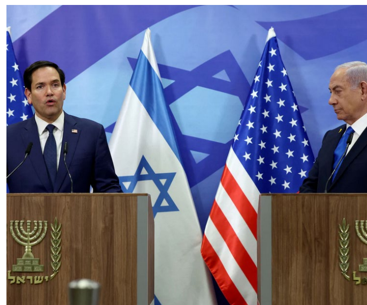
Marco Rubio e Benjamin Netanyahu durante reunião em Jerusalém

Ministro da Defesa israelense, Israel Katz, destacou que as bombas representam um recurso estratégico significativo para as Forças de Defesa de Israel (IDF) e reforçam a aliança EUA-Israel. As MK-84 são bombas não guiadas capazes de destruir concreto e metais espessos, criando um amplo raio de explosão.