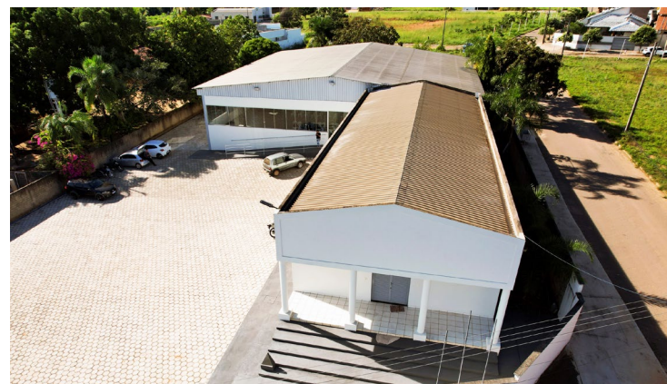
Somente em 2024, 19 projetos de equipamentos comunitários foram concluídos

Em alguns casos, os equipamentos comunitários são totalmente construídos; em outros, as estruturas passam por reforma para melhoria ou ampliação do espaço físico já existente. Os recursos liberados variam entre R$ 50 mil e