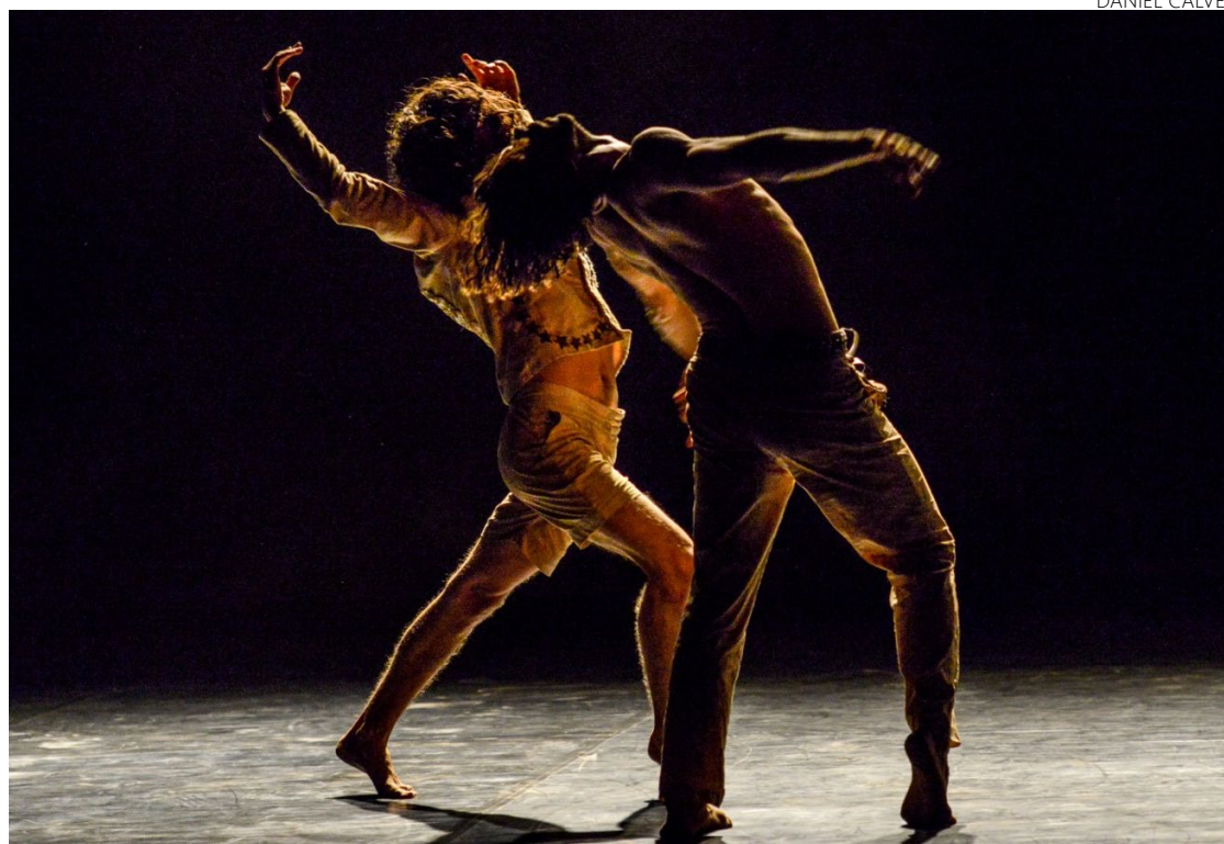
Grupo obteve nos últimos anos reconhecimento tanto aqui quanto lá fora

A oficina terá 35 vagas e é destinada a profissionais e es-