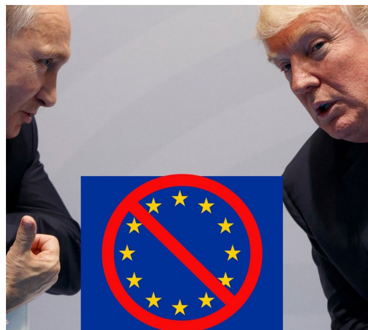
Anúncio vem após ligação telefônica entre o presidente Donald Trump e o líder russo Vladimir Putin

Enviado americano planeja visitar Kiev ainda este mês, enquanto altos funcionários da administração Trump se preparam para encontrar negociadores russos e ucranianos na Arábia Saudita nos próximos dias.