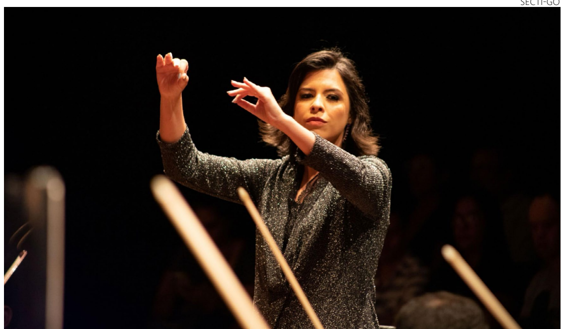
Evento celebra obra de compositores russos: resgate de clássicos da música internacional

O público vai acompanhar a execução da icônica sinfonia Nº. 2, da ópera 17, conhecida por "Pequena Rússia". E ainda da sinfonia nº 1, da ópera 25, de Sergei Prokofiev, intitulada "Clássica", escrita por ele aos 25 anos, inspirada na forma de trabalho de Mozart e Haydn.