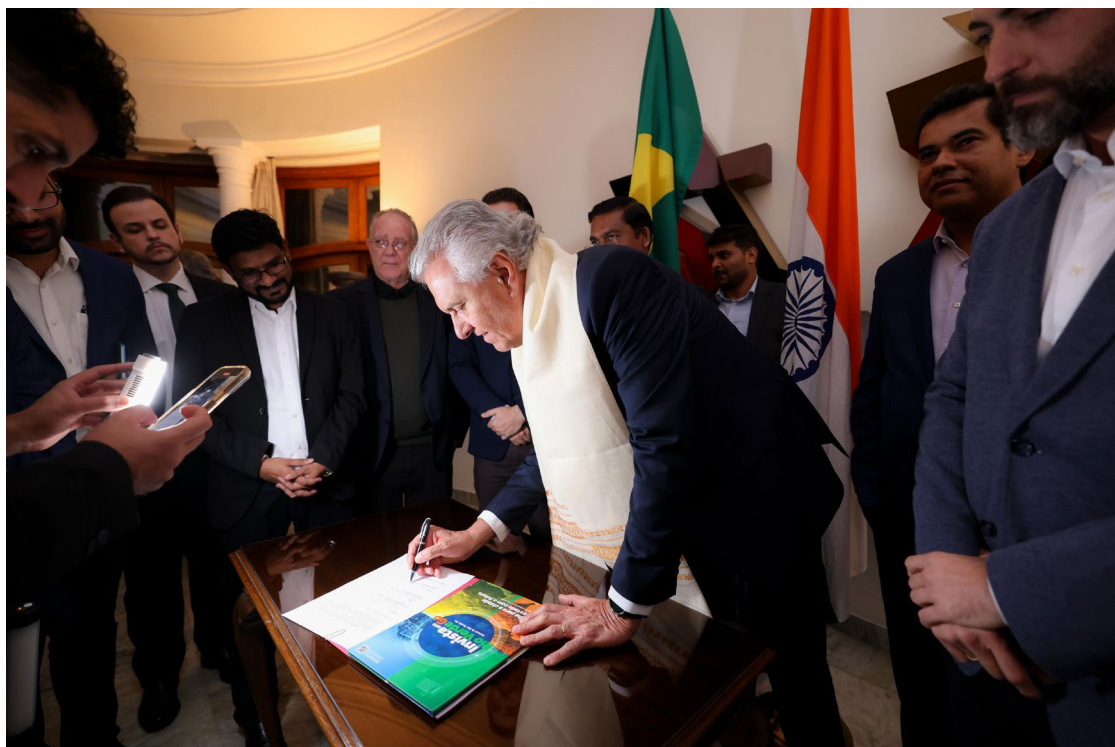
Segundo o governador, iniciativa reafirma posição de vanguarda do estado no processo de transição energética

As tratativas com a Raj começaram em 2020 e, com a parceria formalizada, os próximos passos incluem estudos técnicos para viabilizar a instalação da fábrica em Rio Verde.