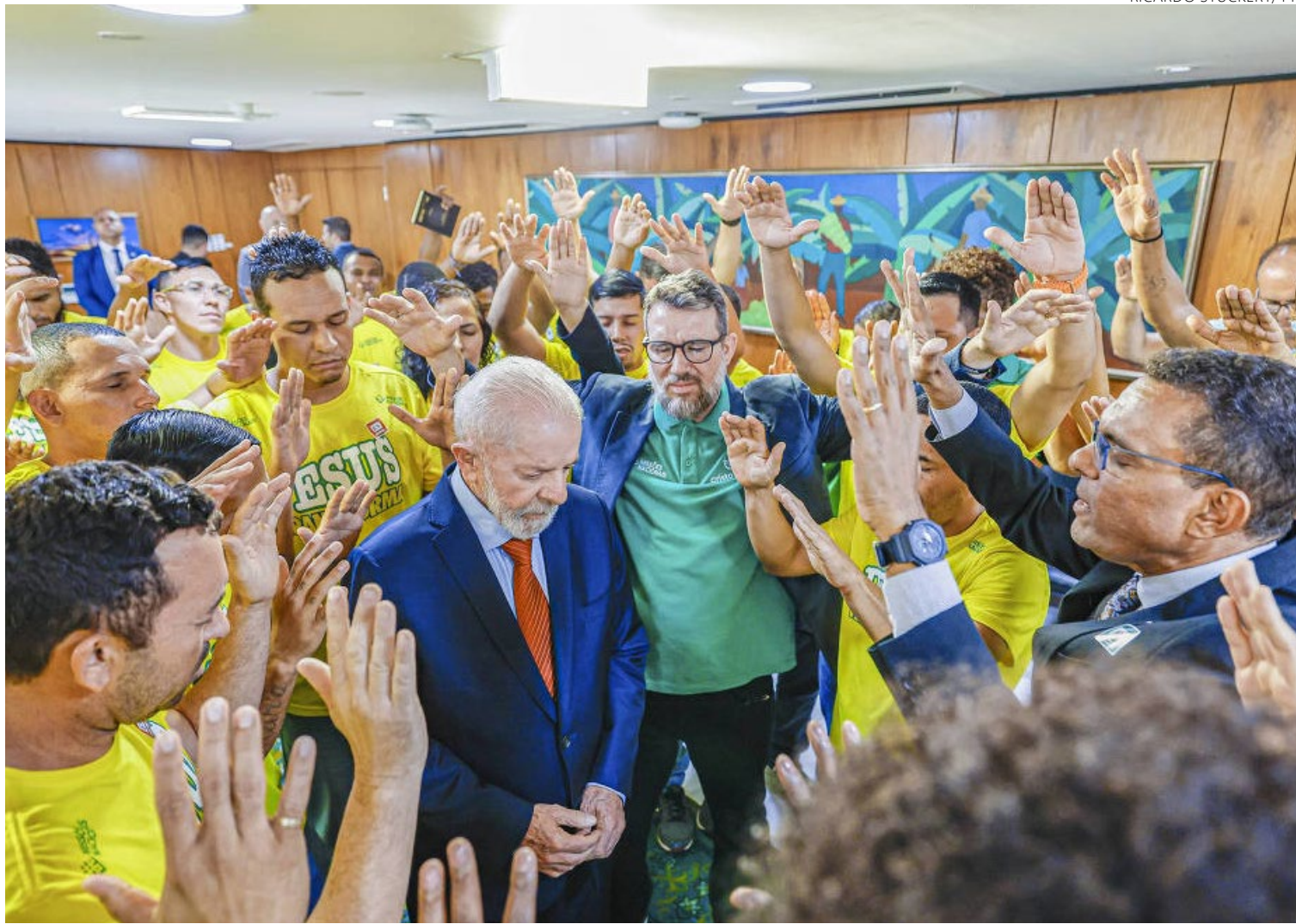
Lula ao lado de lideranças pentecostais durante criação do Dia da Música Gospel, em outubro de 2024: aceno a eleitores de olho em 2026

Os números de desaprovação na parcela feminina, por exemplo, saltaram de 26% no