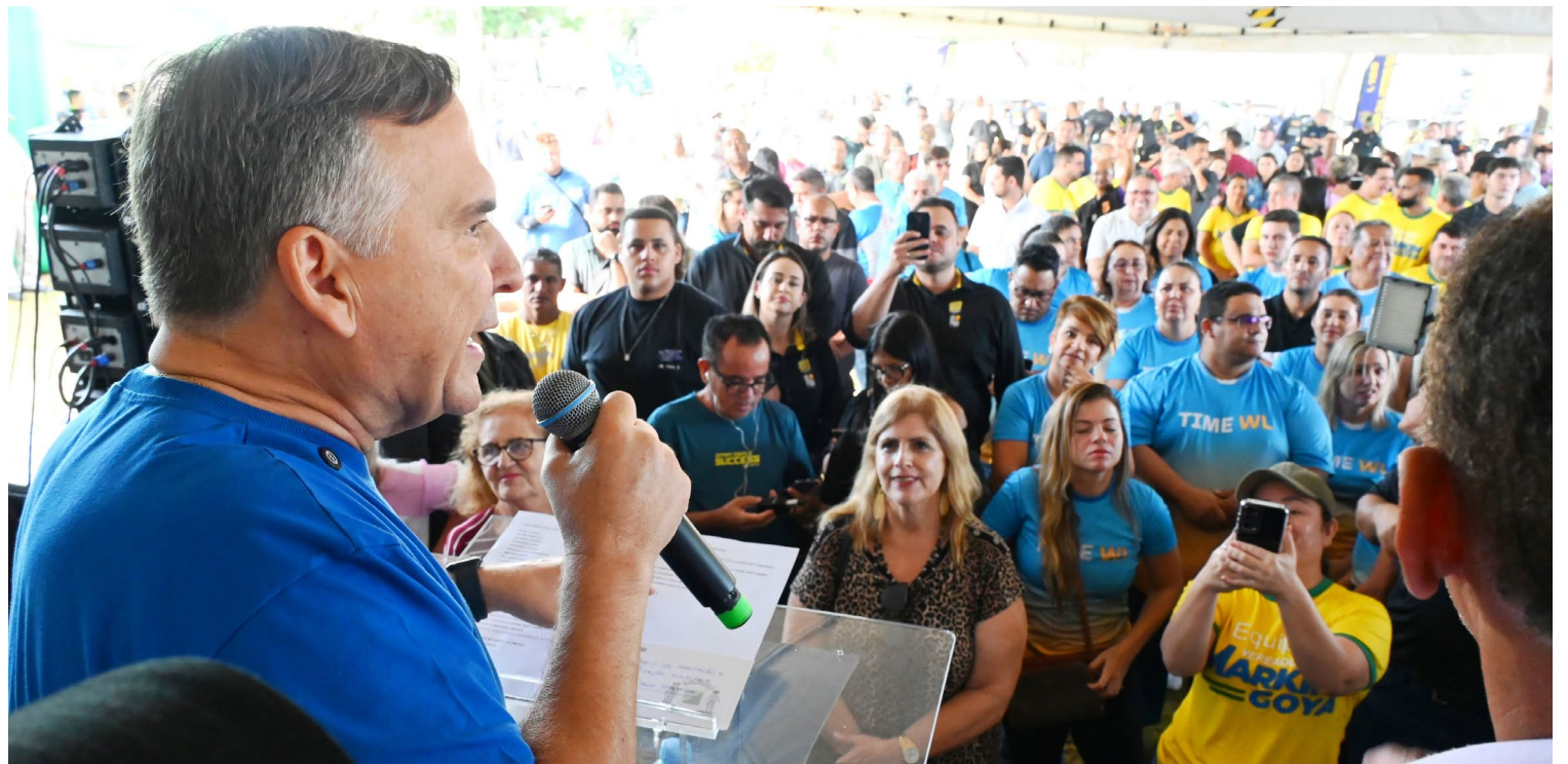
Prefeito Sandro Mabel anunciou lançamento do programa Brilha Goiânia durante a 11ª edição do Mutirão dos 100 Dias

Dezenas de bairros estão sendo beneficiados nesta edição do mutirão com serviços como vacinação, consultas médicas, roçagem, remoção de entulhos, sinalização das ruas, cadastro para emprego,