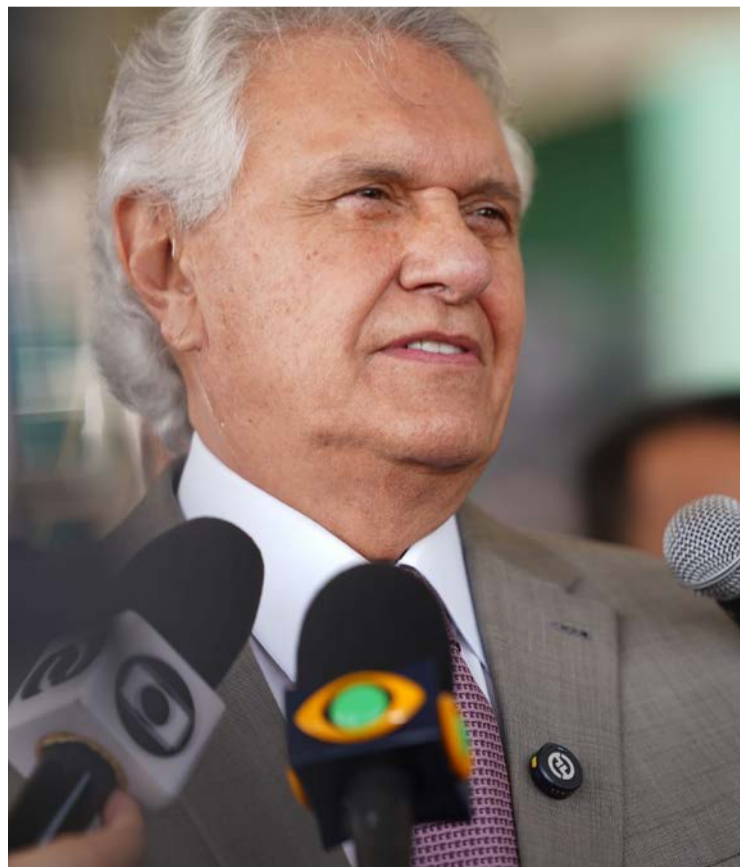
Ex-governador Ronaldo Caiado critica política de segurança de Lula

Caiado aproveitou o contexto para reforçar críticas à postura do governo federal, sustentando que a falta de medidas mais contundentes contribui para o fortalecimento dessas organizações e amplia os desafios enfrentados pelo país na área da segurança pública.