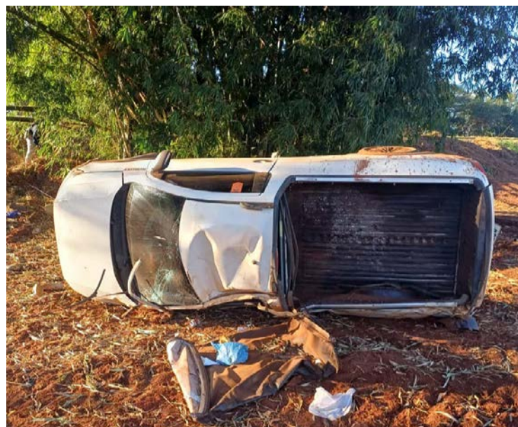
Balanço registrou 25 acidentes, com 22 pessoas feridas e uma morte

Feriado de Corpus Christi também terminou com redução no número de acidentes e feridos