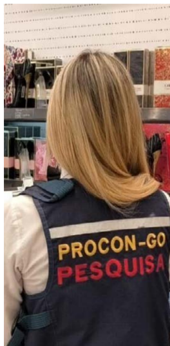
Levantamento analisou 68 itens em 46 estabelecimentos

Desenvolvida pelo Instituto Butantan, a vacina representa um marco para a ciência nacional por ser a primeira contra a dengue produzida integralmente no Brasil. O imunizante também se destaca por ser o primeiro do mundo contra a doença administrado em dose única, característica que foi considerada um avanço na ampliação da cobertura vacinal.