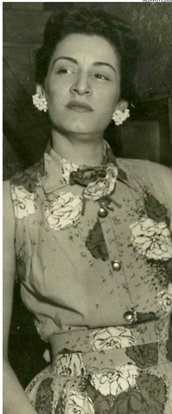
Nora Ney foi nome central da música popular brasileira