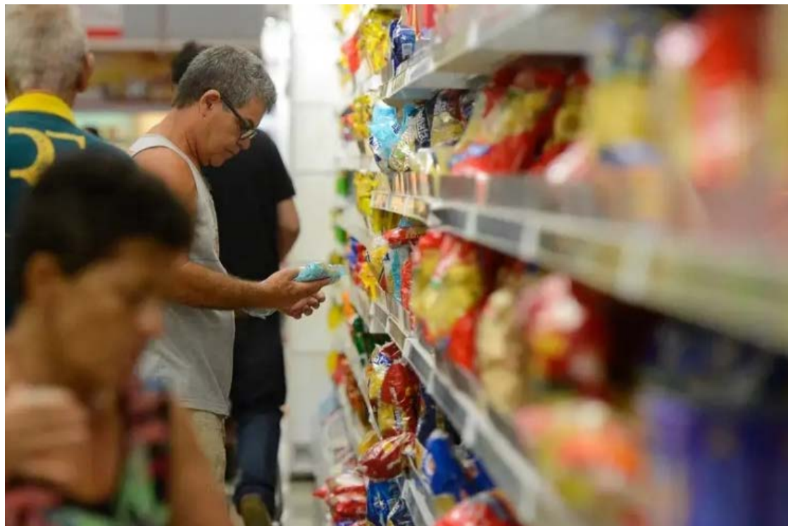
Associação de supermercados afirma que nova convenção coletiva cria desigualdade entre empresas e prejudica pequenos supermercados

Para a Agos, o modelo afronta princípios constitucionais como a livre