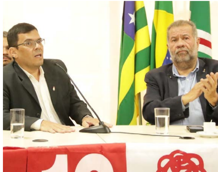
Carlos Mundim e Carlos Lupi, presidente nacional do PDT

Pedetista defende a reeleição do presidente Lula e afirma que eleição será decisiva à democracia