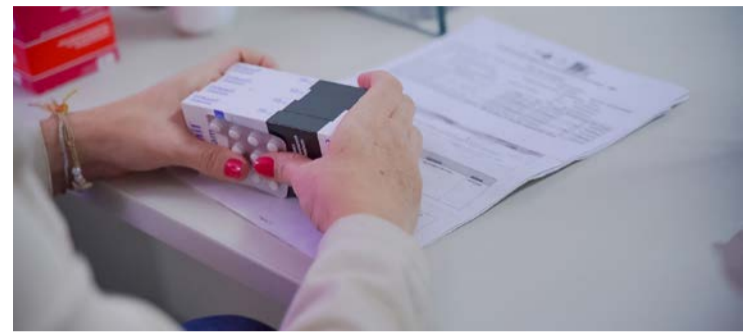
Projeção para 2026 é alcançar 36.507 novos pacientes