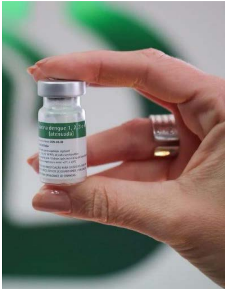
Foram notificados três casos considerados graves, além de duas mortes que estão sendo analisadas

A maior variação foi registrada no vaso de orquídeas com arranjo. Entre os eletrônicos, o celular Samsung A07 variou mais de 137%. A camisa do Co-