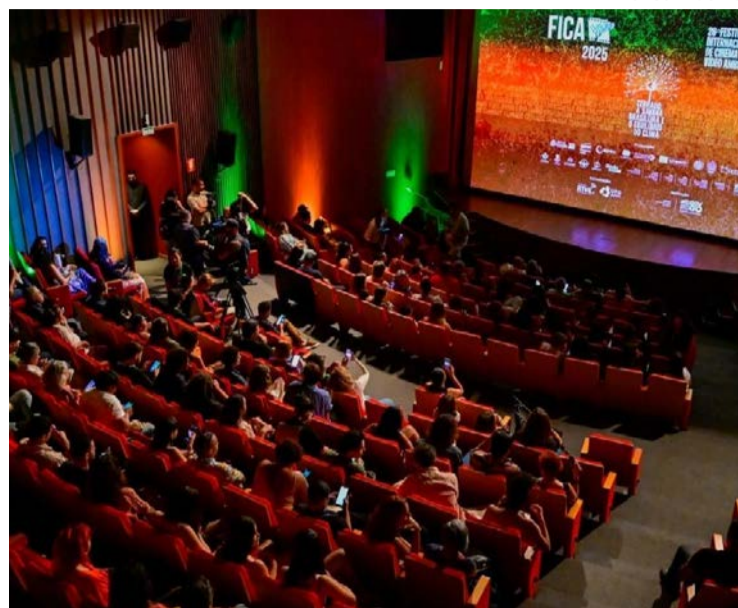
Abertura ocorre na próxima terça-feira (16/5)