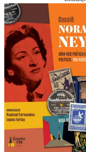
Capa do título 'Dossiê Nora Ney', editado pela Garota FM Books