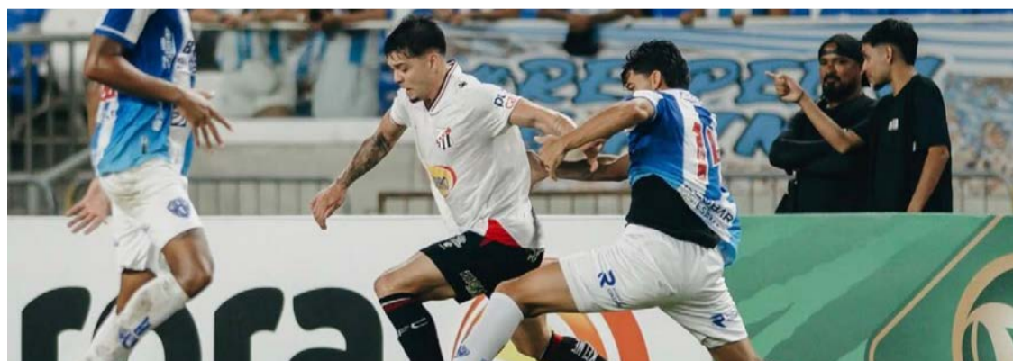
Anápolis encerra a campanha com um feito inédito em sua história