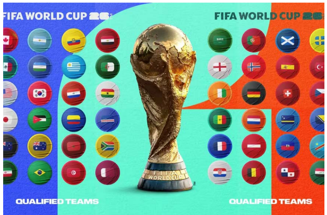
Abertura está marcada para esta quinta-feira (11), no Estádio Azteca, na Cidade do México, palco do confronto inaugural do Mundial

1ª rodada 11 de junho (quinta-feira) 16h - México x África do Sul - Grupo A 23h - Coreia do Sul x República Tcheca - Grupo A 12 de junho (sexta-feira) 16h - Canadá x Bósnia - Grupo B 22h - Estados Unidos x Paraguai - Grupo D 13 de junho (sábado) 16h - Catar x Suíça - Grupo B 19h - BRASIL x Marrocos - Grupo C 22h - Haiti x Escócia - Grupo C 01h (sábado para domingo) - Austrália x Turquia - Grupo D 14 de junho (domingo) 14h - Alemanha x Curaçao - Grupo E 17h - Holanda x Japão - Grupo F 20h - Costa do Marfim - Grupo E 23h - Suécia x Tunísia -