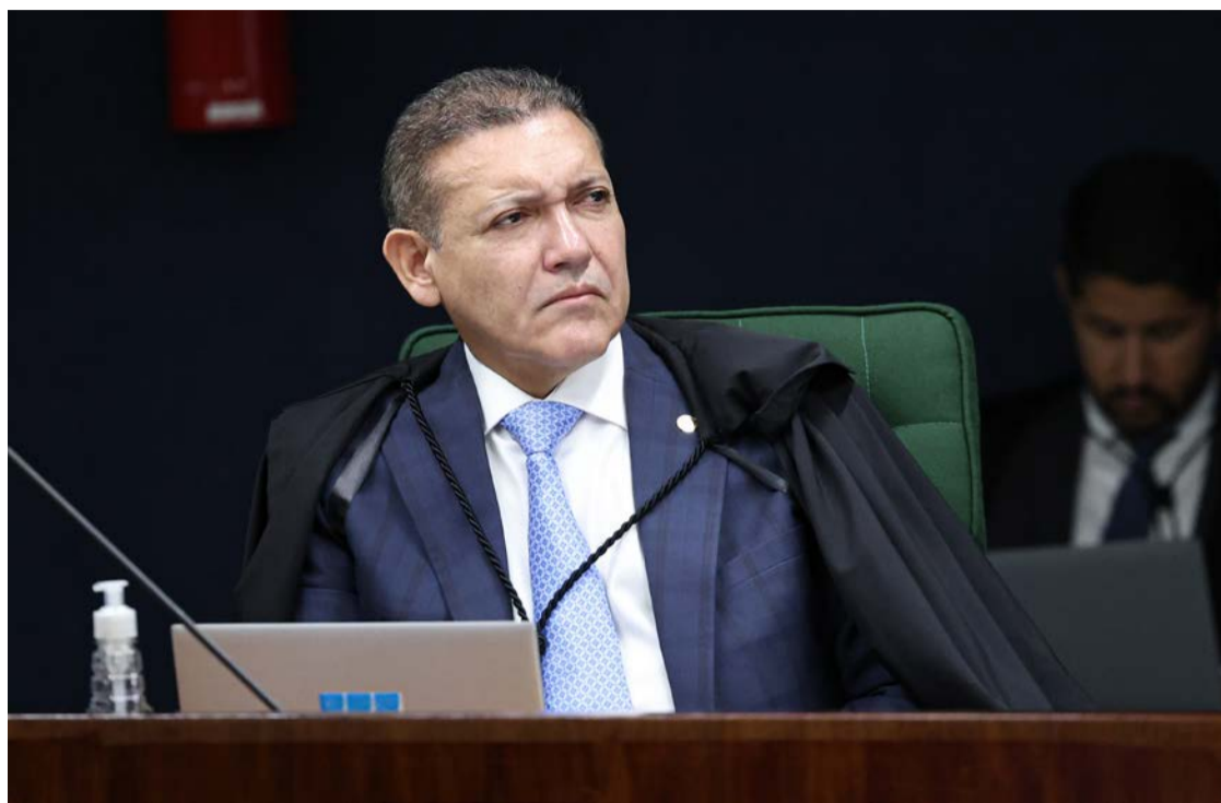
Ministro Kassio Nunes, do TSE, atendeu pedido e suspendeu resultado de pesquisa eleitoral

já havia afirmado em nota não haver qualquer problema metodológico na pesquisa.