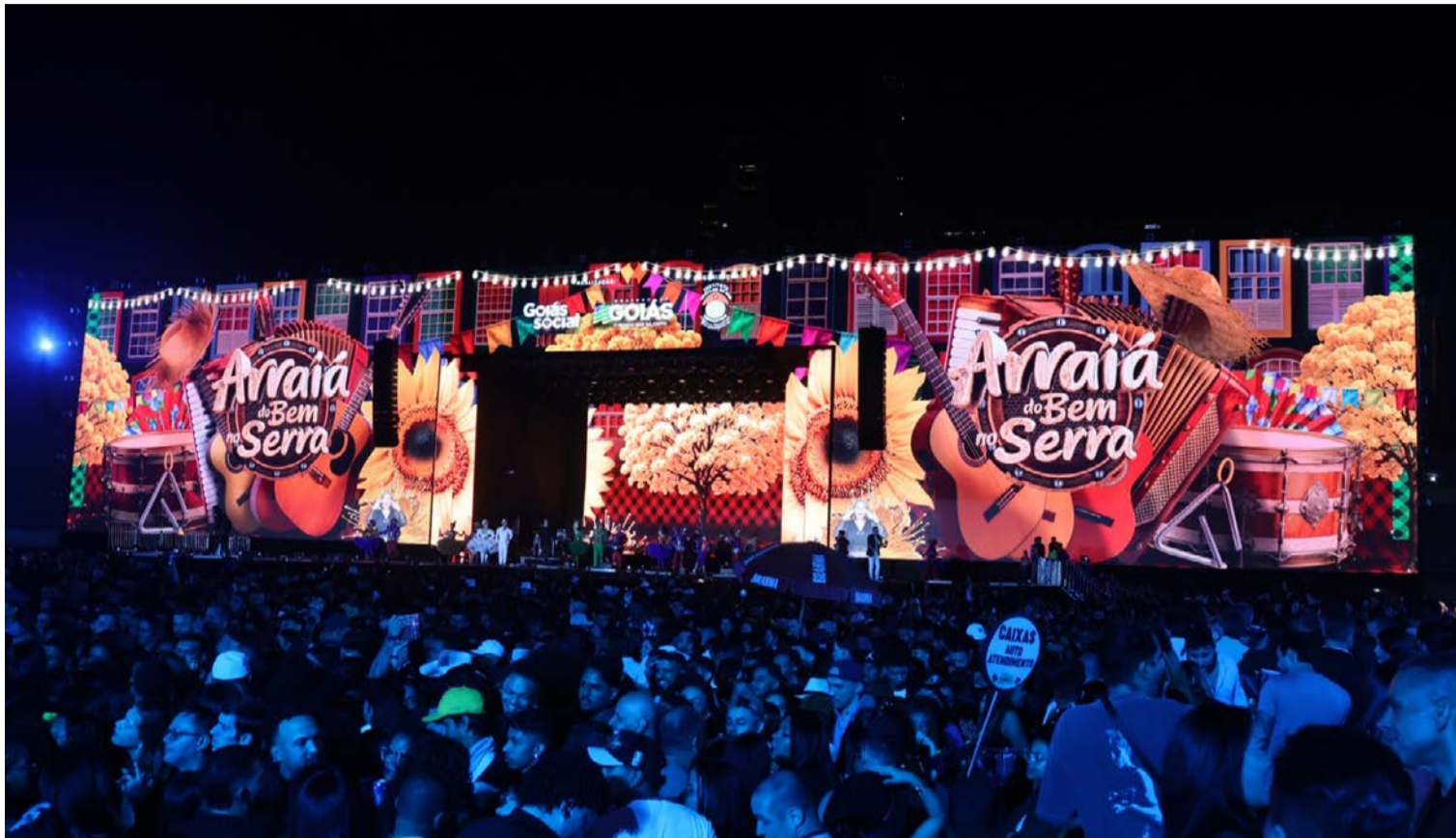
Arraiá do Bem reafirmou sua relevância no calendário cultural brasileiro e consolidou-se como um dos maiores festejos juninos do país