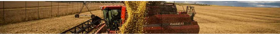
Economia goiana é fortemente impulsionada pelo agronegócio