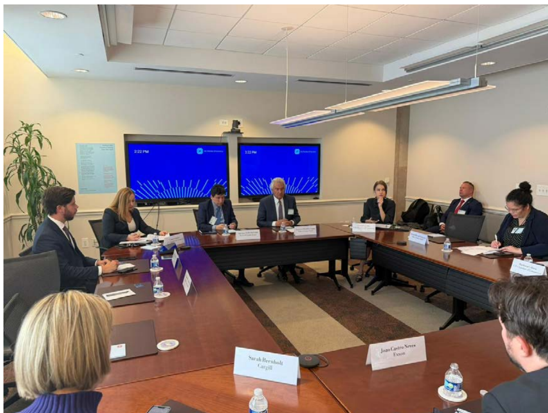
Ronaldo Caiado e gestores americanos: Brasil é visto como uma das principais alternativas ao fornecimento chinês de terras raras