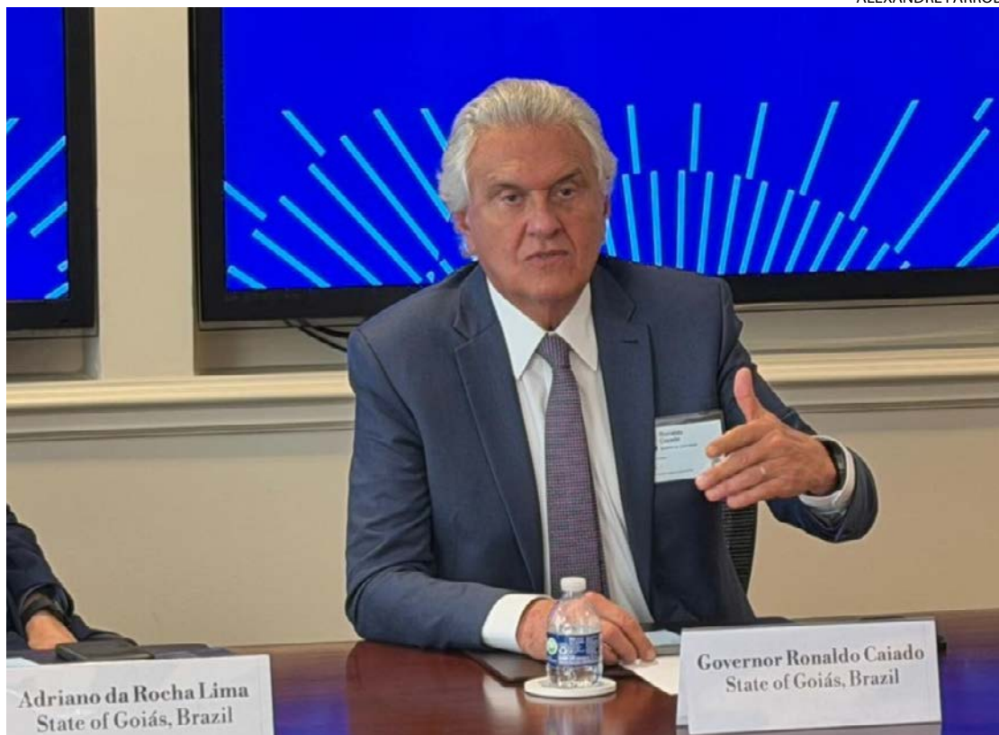
Governador Ronaldo Caiado durante reunião em Washington: parcerias estratégicas podem beneficiar municípios

A missão incluiu também compromissos na Câmara de Comércio dos Estados Unidos, com debates sobre atração de investimentos, tarifação de produtos goianos e parcerias econômicas. Caiado afirmou que Goiás já colhe resultados de alianças internacionais e avança para consolidar-se como polo estratégico na cadeia global de minerais críticos, em sintonia com o movimento dos Estados Unidos para reduzir a dependência da China nesse setor.