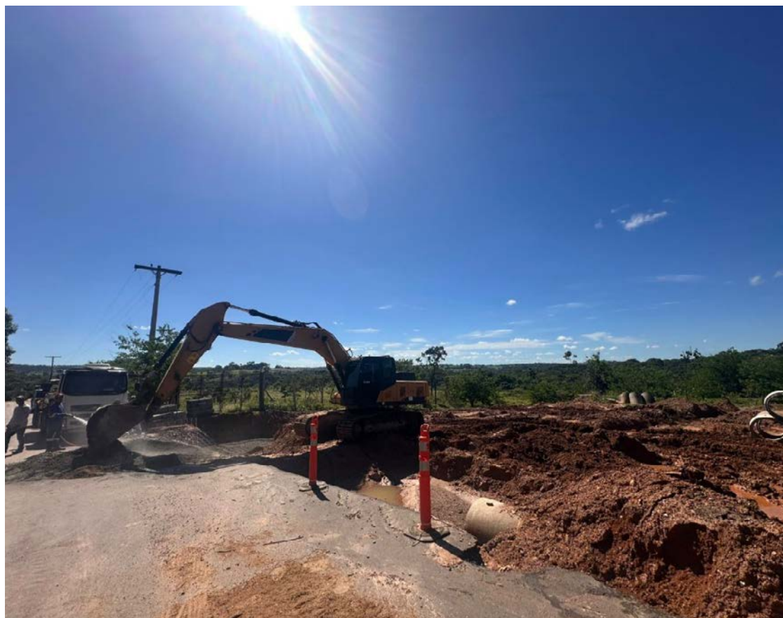
Estrutura é projetada para direcionar adequadamente a água pluvial de Senador Canedo

A ação atende a uma demanda recorrente da região, onde o acúmulo de água exigia uma solução definitiva. Com a execução do serviço, a Prefeitura reforça o compromisso com a prevenção de alagamentos, a preservação da infraestrutura viária e a melhoria da qualidade de vida da população.