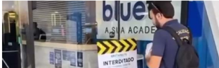
Academias só podem funcionar com profissionais registrados