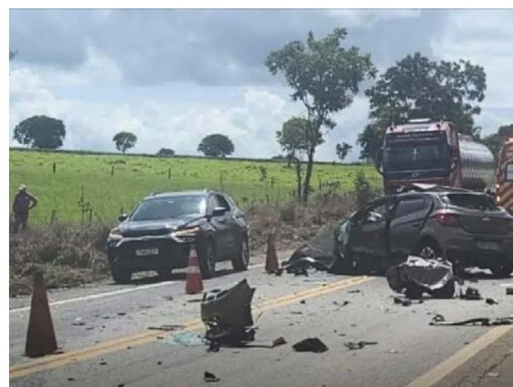
Polícia Civil investigará as causas do acidente: duas mortes ocorreram no Onyx