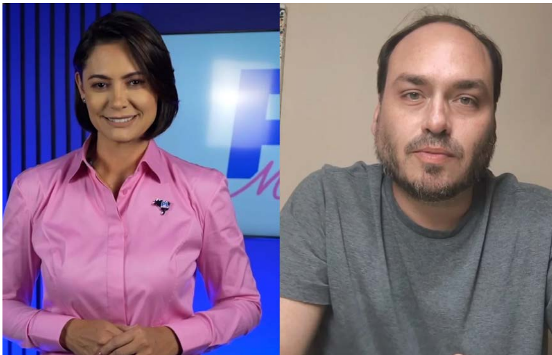
Michelle Bolsonaro e Carlos Bolsonaro: campo da direita está dividido em Santa Catarina