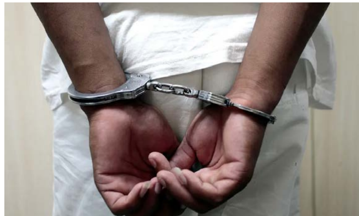
Menor de 14 anos está sob custódia após a confirmação de abuso

Episódio envolveu não apenas o abuso sexual, mas também o registro das imagens e ameaças