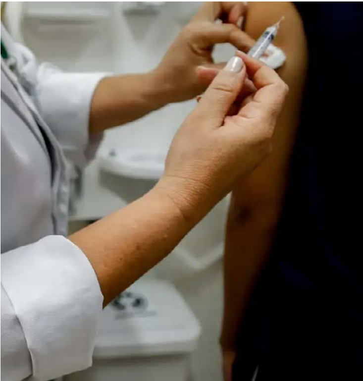
Desde 2024, o esquema vacinal é de dose única, o que facilita a adesão

Desde 2024, o esquema vacinal é de dose única, o que facilita a adesão. A SES reforça que a vacinação é a principal forma de prevenir não apenas o câncer do colo do útero, mas também outras doenças causadas pelo vírus. Goiás conta com mais de mil salas de vacinação e o imu-