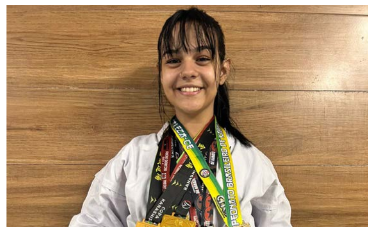
Bruna Srur: campeã brasileira de karatê