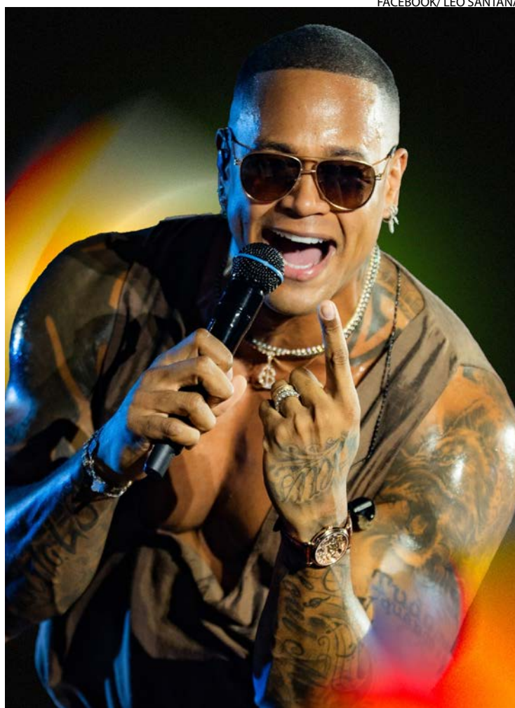
Olha ele: cantor baiano é esperado na capital goiana por fãs

A expectativa é receber até 100 mil foliões em uma festa que mistura ritmos tipicamente brasileiros, como axé, funk e sertanejo. Também participam da festa Bloquinho Parada Beer, Bloquinho Uai, Bloquinho do Cerrado, Carnaval dos Amigos e Bloco Cateretê.