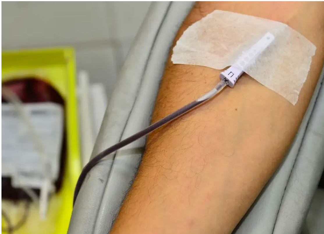
Apesar dos benefícios, a prática ainda não é amplamente divulgada no Brasil

Método evita inflamações associadas a transfusões tradicionais, reduz o tempo de internação e diminui o risco de mortalidade