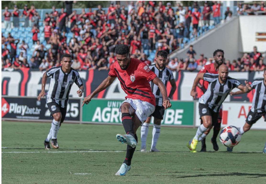
Gol foram marcados no primeiro tempo; Dragão não deu chance para o Goiânia na segunda rodada da competição