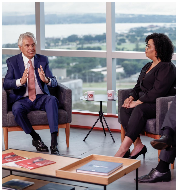
Governador afirma que proposta da União não enfrenta o caso específico da violência no Brasil

A PEC foi inicialmente apresentada em dezembro. Na última semana, passou por alterações que, para Caiado, mantém uma espécie de subordinação normativa aos estados. O governador disse que tal proposta representa uma “concentração de poder”. “Um conselho gestor em Brasília que vai distribuir a mesada de cada governador e cada prefeito. É simplesmente assim”, comentou.