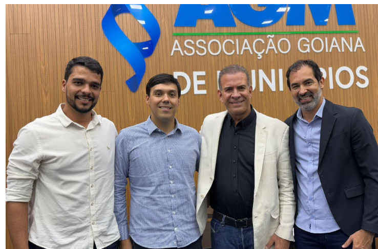
Ao assumir o cargo, o prefeito de Nova Veneza reforçou o compromisso com o desenvolvimento regional