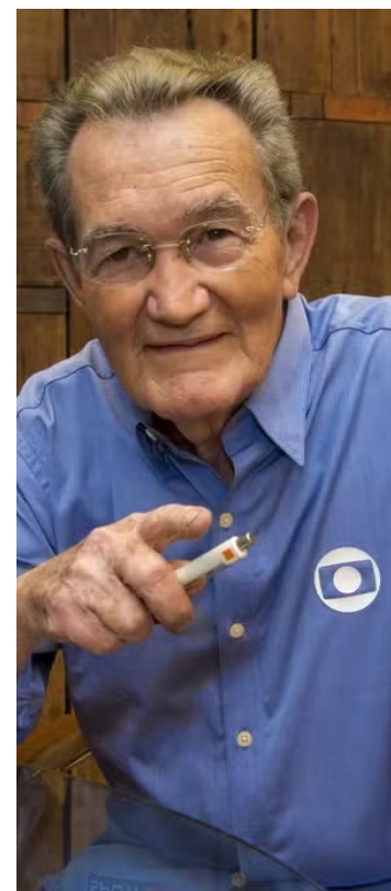
Léo Batista supera os 70 anos de carreira e chamou a atenção por seu estilo descontraído

Ele ainda descartou a aposentadoria e afirmou que "enquanto tiver saúde para continuar trabalhando, é o que pretendo fazer". Na época, Léo Batista estava com 89 anos.