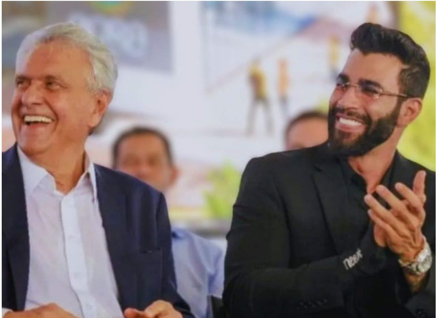
Ronaldo Caiado e Gustavo Lima: aliança para debater o futuro do Brasil

De acordo com Caiado, Gustavo Lima ainda não respondeu sobre o convite para filiação no União Brasil. Caso decida embarcar na mesma legenda que o governador goiano, os dois disputariam a preferência do partido em um processo de prévias eleitorais. “Eu não tenho monopólio. Se o partido quer tê-lo, amanhã outros podem também se colocar no debate. É uma discussão, né? [É como] concurso público, ele tem que entrar no vestibulo