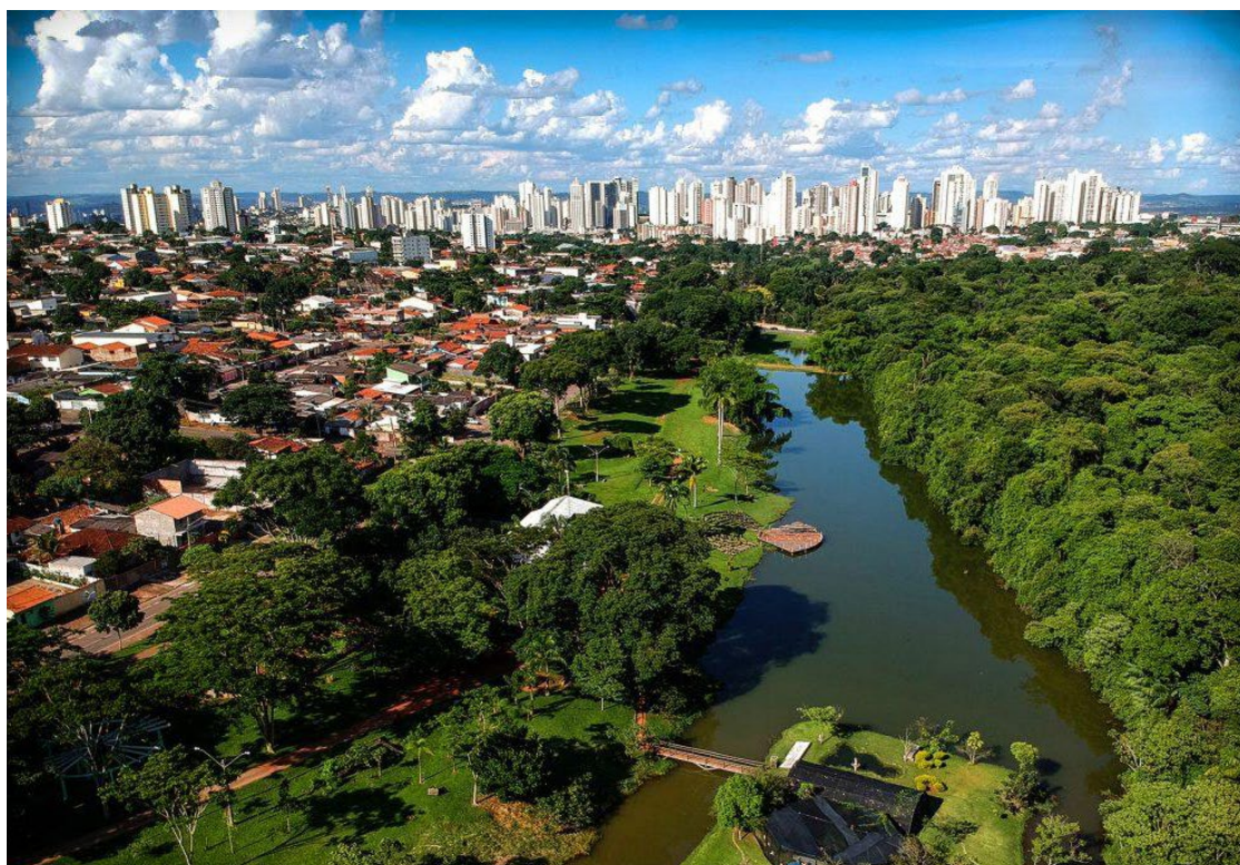
Evento é um auxílio no enfrentamento da crise climática que assola o mundo