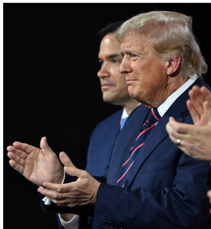
Donald Trump: posse suntuosa nos Estados Unidos

Outro representante importante é o diretor do TikTok, Shou Zi Chew. A plataforma da empresa chinesa ByteDance está prestes a ser proibida nos EUA por decisão do Congresso referendada sexta-feira (17) pela Suprema Corte —uma medida que Trump busca reverter durante a sua administração.