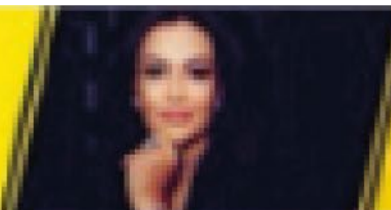
ADELITA COSTA @adelitacostaetiqueta