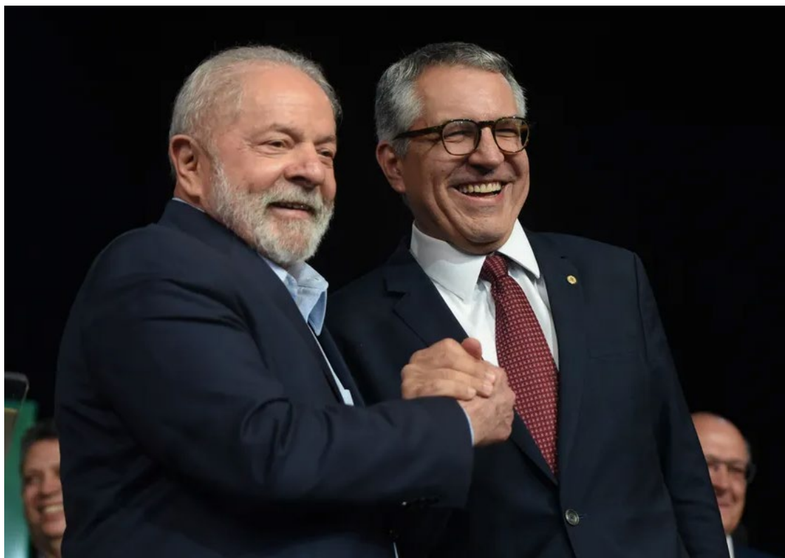
Lula da Silva e Alexandre Padilha: mudanças no ministério de olho nas eleições de 2026

Dessas conversas dependerá o futuro do ministro das Minas e Energia, Alexandre Silveira (PSD). Antigo aliado do ministro, Pacheco avisou ao presidente que a permanência