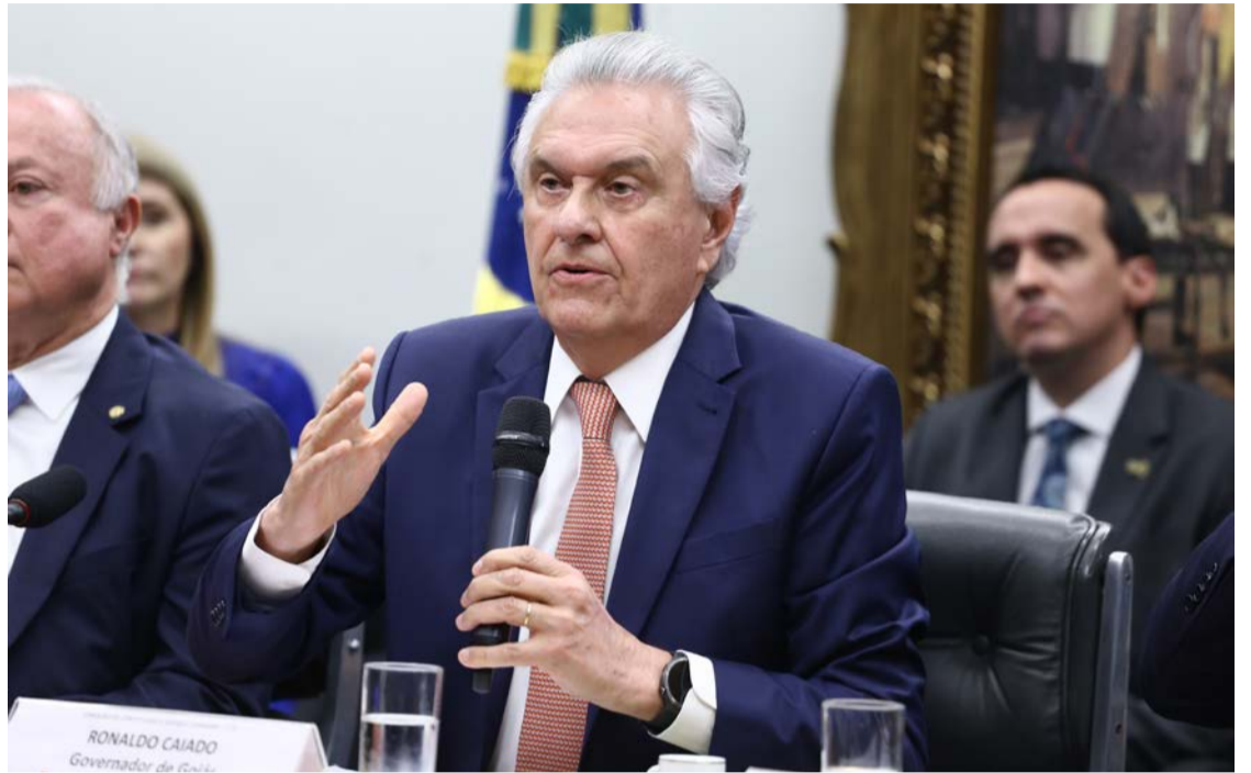
Ex-governador Ronaldo Caiado é apontado como o maior cabo eleitoral no país

Nenhum outro governador ostenta os números de Caiado. Quem mais se aproxima é o governador do Paraná, Ratinho Júnior (PSD), com 64%. O ex-governador de Minas Gerais Romeu Zema (Novo), também pré-candidato à presidência, merece eleger o sucessor para 42% dos mineiros. Outros 49% descartam a possibilidade. No Rio Grande do Sul, 39%