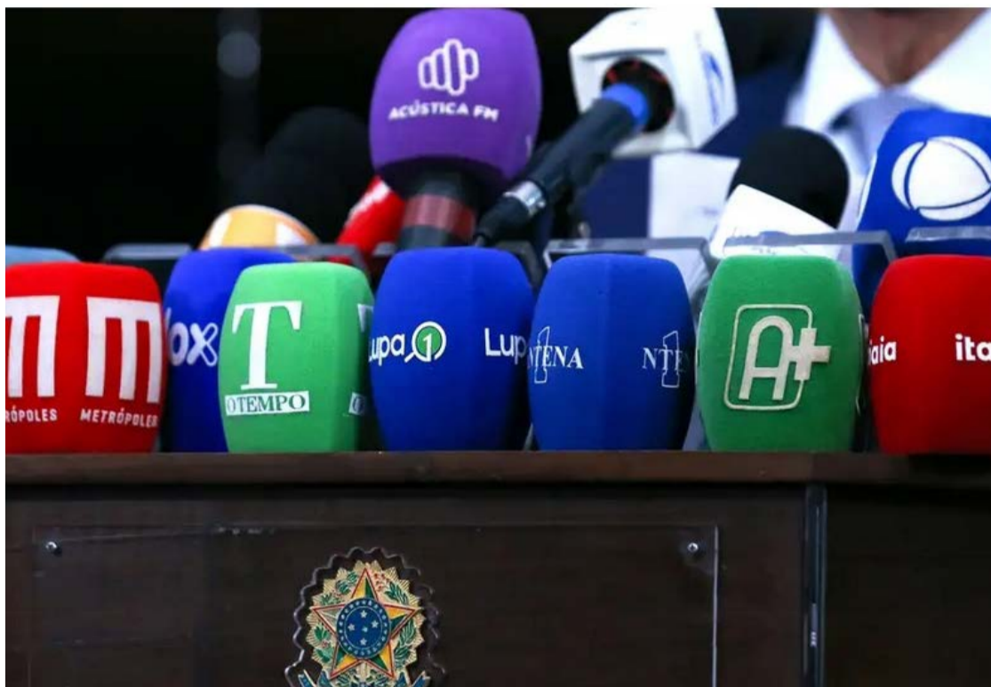
Relatório da RSF indica piora generalizada no mundo e avanço brasileiro impulsionado por mudanças políticas e institucionais

"Trump travou uma verdadeira ofensiva contra a liberdade de imprensa, afetando todos os indicadores", diz Romeu. "Atacou jornalistas, cortou o financiamento de veículos públicos, instrumentalizou agências federais contra meios de comunicação,