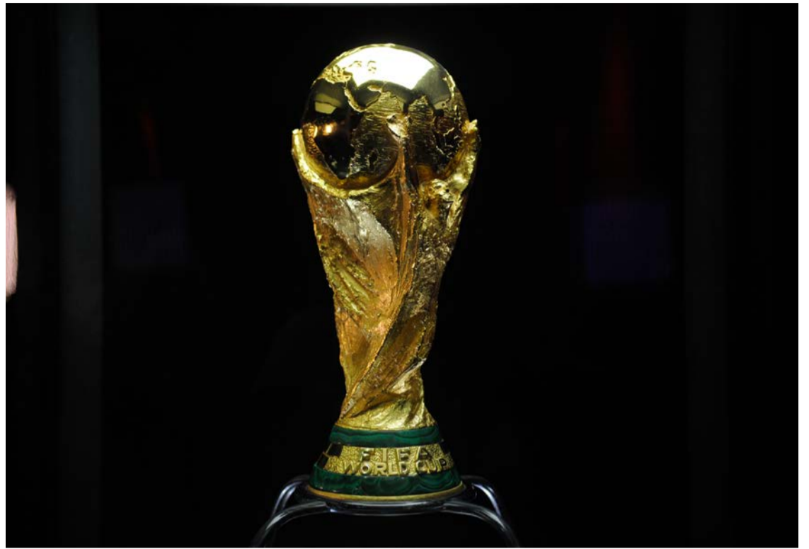
Mundial será disputado pela primeira vez em três países simultaneamente: Estados Unidos, México e Canadá

Para a final, marcada para o MetLife Stadium, nos Estados Unidos, ingressos chegaram a ultrapassar 10 mil dólares em categorias específicas, embora também existam