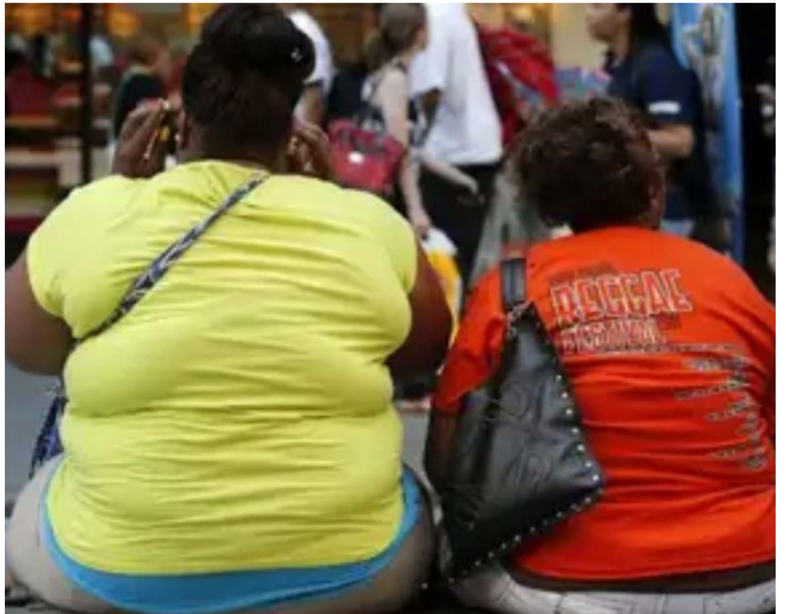
Pesquisa da The Lancet revela eficácia na redução de consumo de álcool por obesos

Os achados do novo estudo, dizem os autores, "apoiam uma indicação expandida para a semaglutida, potencialmente afetando milhões de pessoas" -dado que o transtorno por uso de álcool responde por cerca de 5% das mortes no mundo a cada ano e apenas três medicamentos são aprovados pelo FDA (agência regulatória americana de alimentos e medicamentos) para seu tratamento.