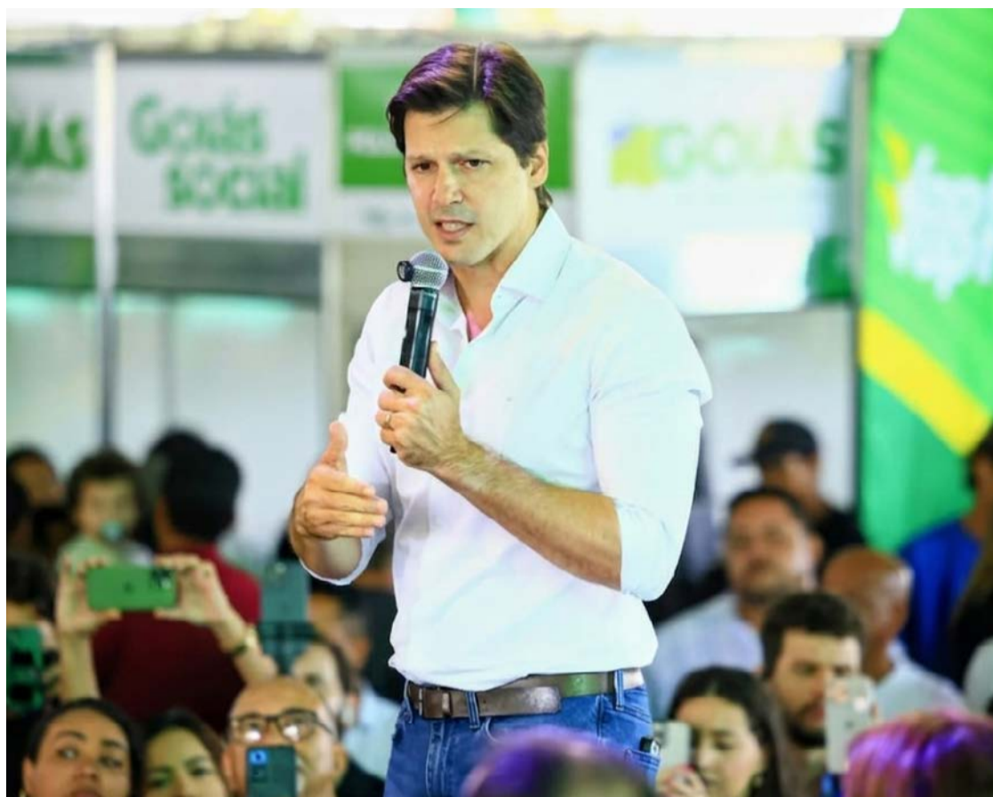
Governador Daniel Vilela é líder com 33%

A Genial/Quaest fez a pesquisa entre os dias 24 e 28 de abril entre 1.104 eleitores de Goiás, com coleta domiciliar e presencial. A margem de erro é de 3 pontos percentuais, para mais ou para menos. Já o nível de confiança é de 95%. A pesquisa tem registro na Justiça Eleitoral sob o número GO-00211/2026 e foi feita no dia 24 de abril de 2026.