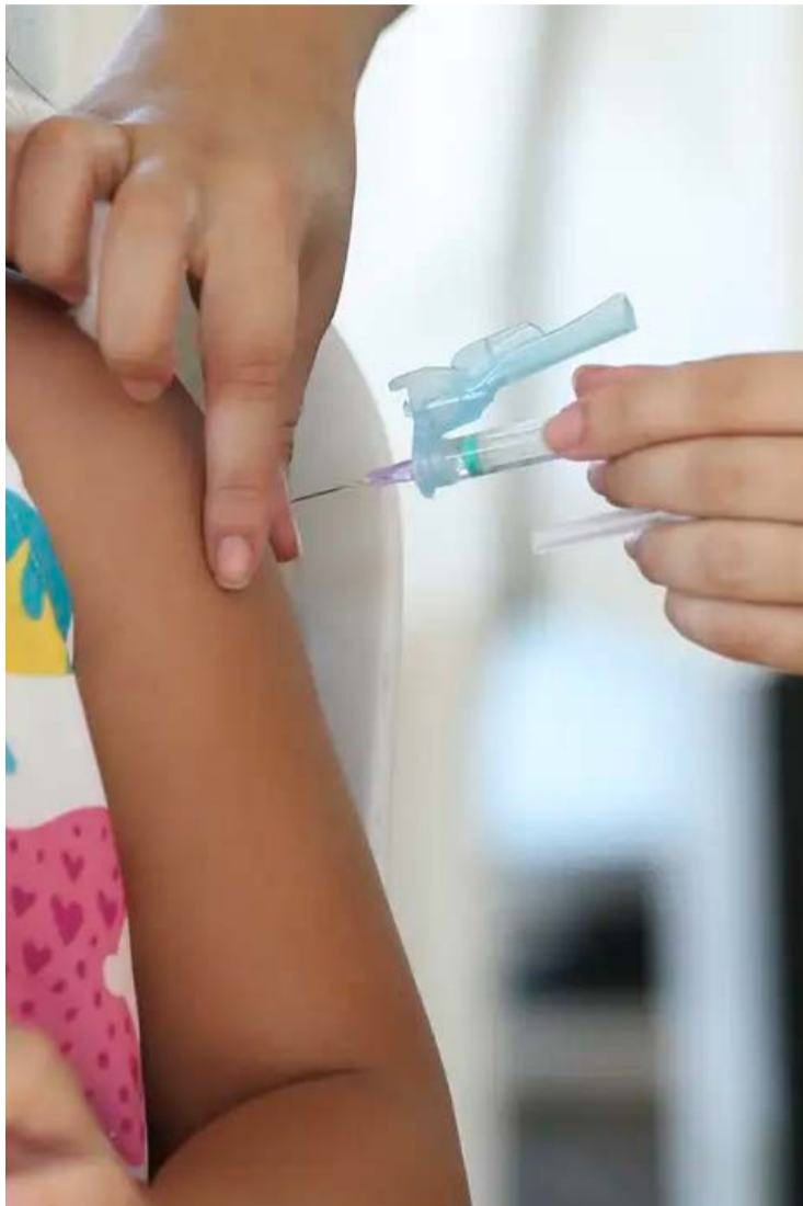
3.013 casos de Síndrome Respiratória Aguda Grave (SRAG) já foram registrados em Goiás em 2026

Entre pessoas com 60 anos ou mais, foram contabilizados 531 casos. Desse total, 326 são de SRAG sem agente especificado. Além disso, 68 estão relacionados a outros vírus respiratórios. Outros 56 foram causados por influenza, 54 estão ainda em in-