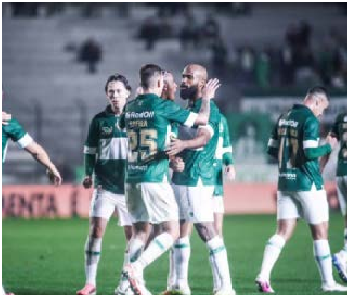
Jogadores do Juventude celebram vitória diante do Vila, que perdeu a liderança na série B

Na próxima rodada, o Vila Nova terá mais um confronto direto. O Colorado enfrentará o Criciúma, atual líder da competição, em Santa Catarina, no sábado (18/07), às 16h. Já o Juventude medirá forças com o Cuiabá na sexta-feira (17/07).