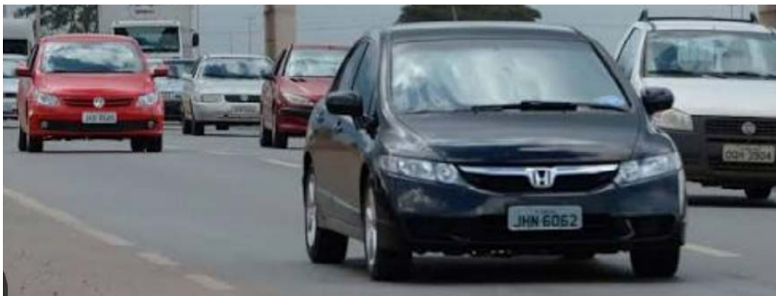
Mapa da Segurança Pública aponta Goiás como o estado com a menor taxa de roubo de veículos do Brasil em 2025