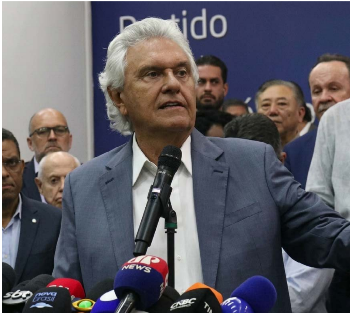
Ex-governador Ronaldo Caiado promete "alforriar comunidades do Rio dominadas pelo crime"

O crescimento da presença de Ronaldo Caiado