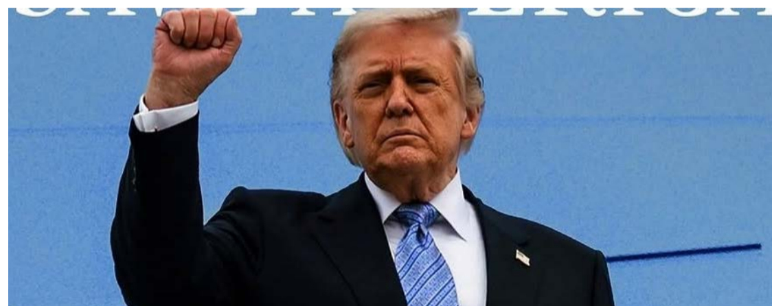
Trump afirmou que deixou instruções para resposta militar dos Estados Unidos caso seja assassinado

Donald Trump afirma que determinou uma resposta militar sem precedentes caso seja morto e volta a dizer que é alvo do governo