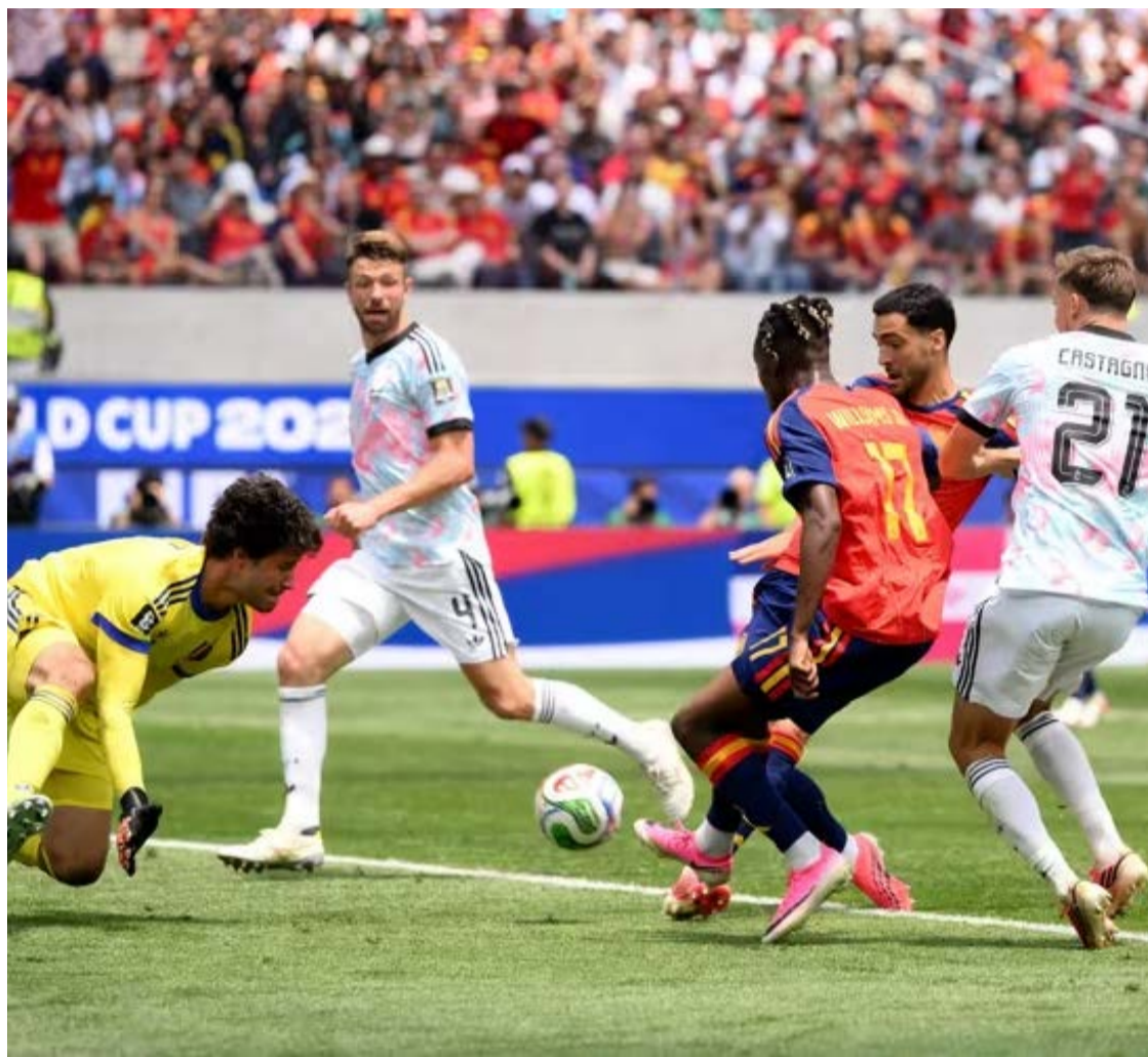
Espanha está de volta entre as quatro melhores seleções de uma Copa do Mundo

Mesmo sendo dominada, a Bélgica conseguiu reagir antes do intervalo. Aos 40 minutos, Kevin De Bruyne cruzou na medida para Charles De Ketelaere, que venceu a marcação de Pau Cubarsí e cabeceou firme para empatar. Foi o