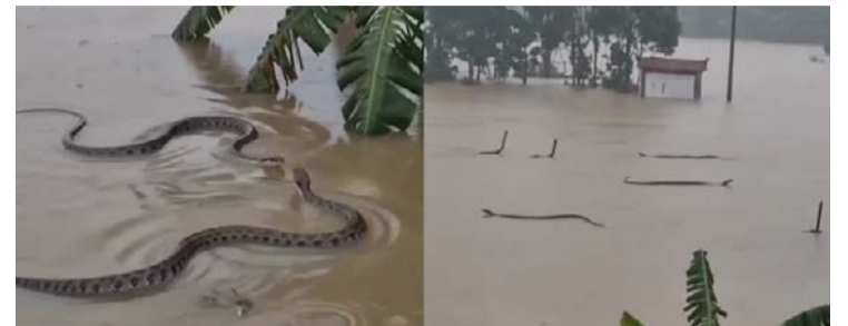
Cobras escaparam de criadouros atingidos pela inundação

Fortes chuvas provocadas por um tufão transformam sul da China em área de risco