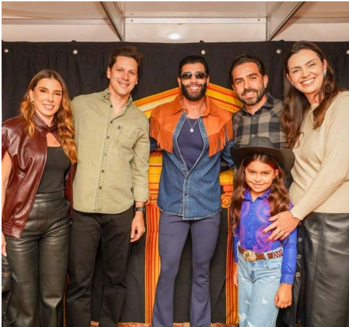
Governador Daniel Vilela ressaltou relevância da Expo Rio Verde 2026 para economia e cultura goiana

O prefeito Wellington Carrijo destacou o valor histórico da exposição para o município e para Goiás. Segundo ele, a festa preserva os costumes e as tradições do homem do campo, ao mesmo tempo em que apresenta inovação, tecnologia e práticas que fortalecem o agronegócio moderno. A Expo Rio Verde 2026 segue até este sábado (12/7).