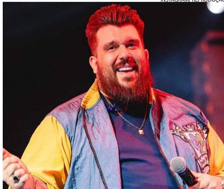
Panda e MJ Records lideram lista com 'Eu Te Seguro (Ao Vivo)'