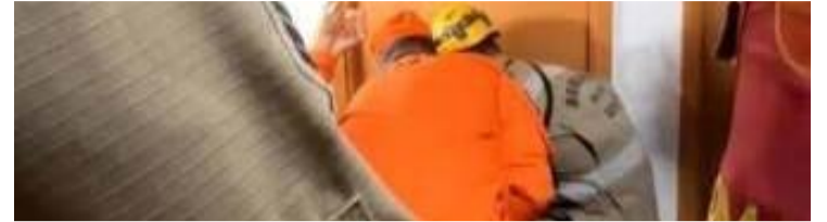
Criança estava abandonada sozinha no imóvel