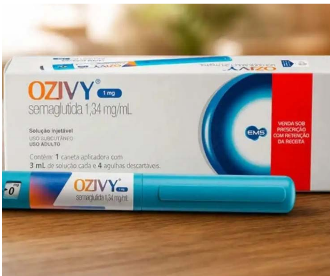
Ozivy é o primeiro medicamento brasileiro com semaglutida sintética a integrar a Lista de Referência

O Ozivy também foi o primeiro medicamento produzido pela indústria farmacêutica brasileira