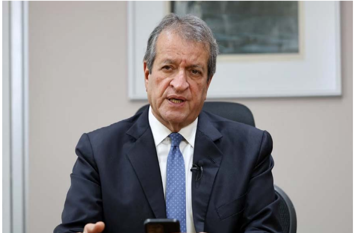
Valdemar da Costa Neto teria, segundo a PF, desviado mais de R$ 100 milhões em emendas

"Basicamente, Valdemar Costa Neto contava com autonomia para direcionar recursos de emendas (de comissão, proeminentemente) conforme sua cota pessoal e particular, atribuída a partir de sua condição de presidente da