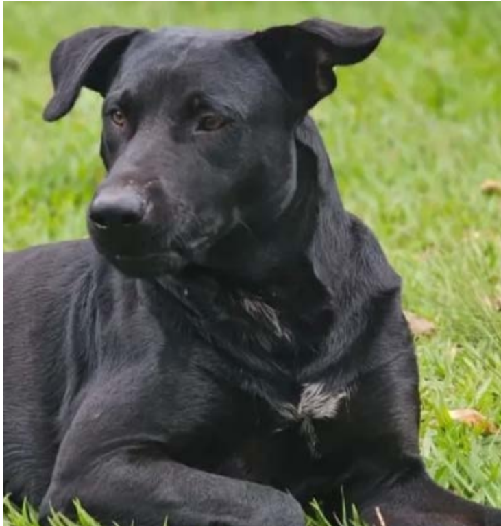
Mobilização está marcada para o próximo domingo no Parque Flamboyant

O disparo ocorreu no estacionamento do Estádio Serra Dourada. O militar do Corpo de Bombeiros Militar de Goiás relatou à Polícia Civil que sofreu um ataque de uma matilha e foi mordido na perna. Ele declarou que tentou afastar o animal antes de usar