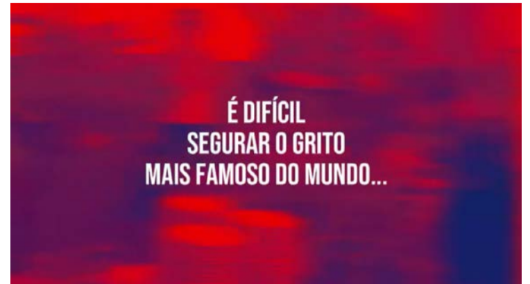
Vila Nova fez postagem em rede social "zoando" o fato