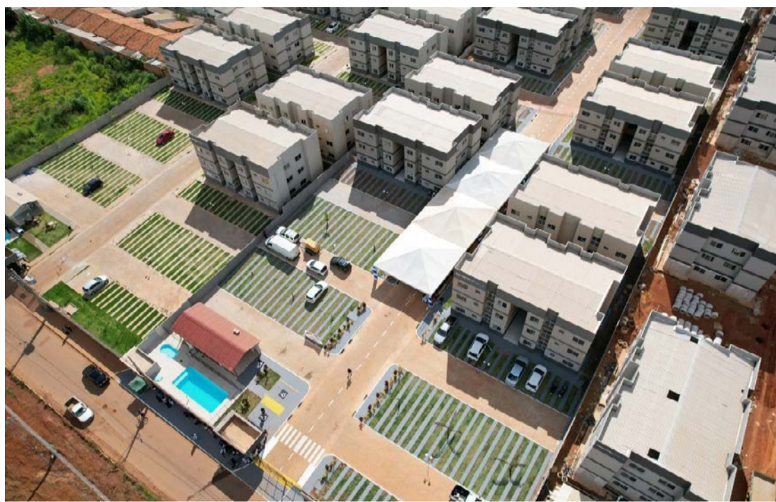
Inscrições para apartamentos a custo zero em Goiânia foram prorrogadas até 17 de abril de 2026