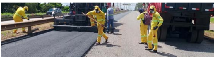
Intervenção começou no fim de março e concentrou serviços no sentido da capital

Para evitar congestionamentos, principalmente nos horários de maior movimento, condutores