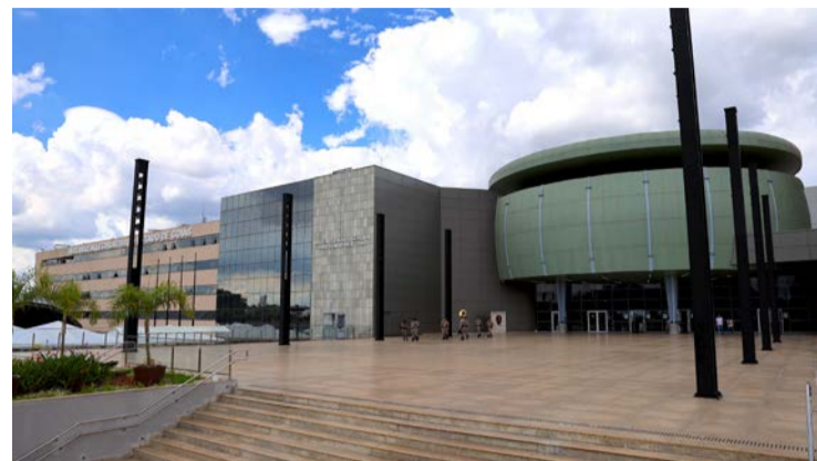
Sede da Assembleia Legislativa de Goiás: reajuste aprovado pelos servidores

Servidores da Alego, TCE, Defensoria Pública, TCM, Judiciário e do Ministério Público contemplados