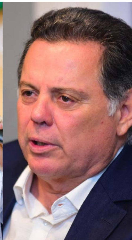
Marconi Perillo, segundo Paraná Pesquisas, é o líder em rejeição

lidera com 13,1% das citações, seguido por Marconi Perillo, com 5,9%, e Wilder Moraes, com 3,9%. Adriana Accorsi aparece com 0,6%.