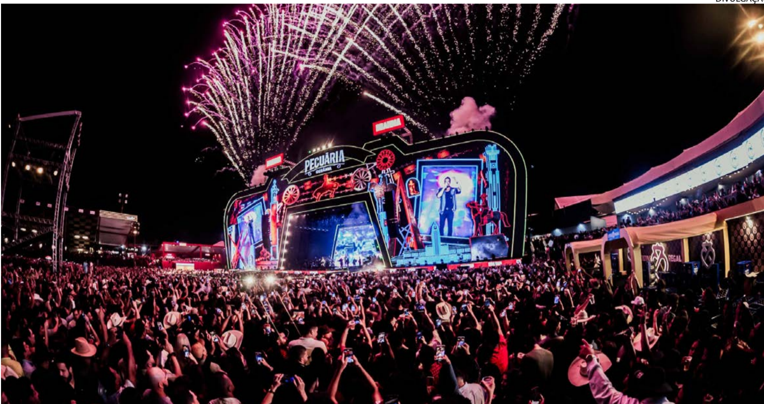
Artistas vão se apresentar em palco montado no Parque de Exposições Agropecuárias de Goiânia entre 14 e 24 de maio

Com Alok confirmado, evento será realizado em maio com expectativa de movimentar R$ 100 milhões e gerar mais de 10 mil empregos. Neste ano, além do DJ, público assistirá a Ana Castela