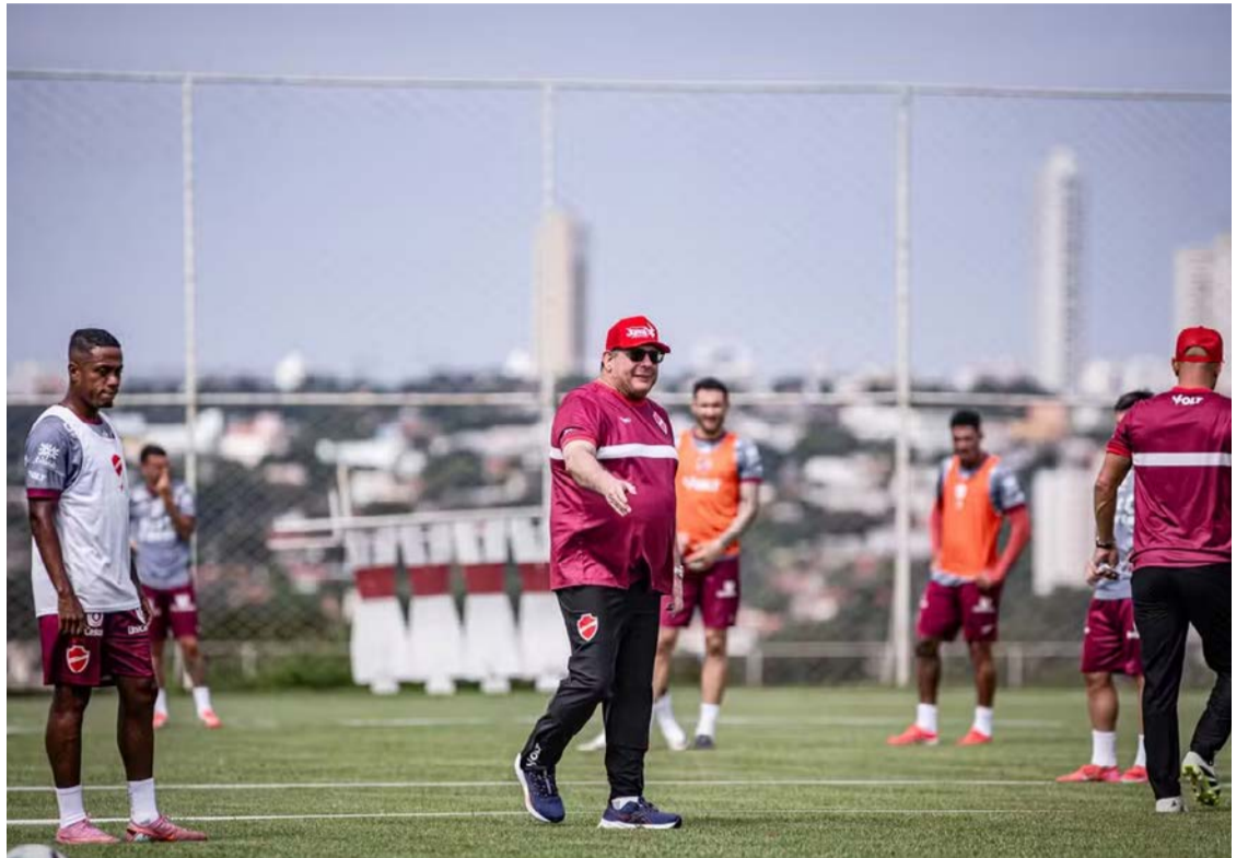
Confronto marca mais um desafio do Tigrão em meio à maratona de competições na temporada

Na temporada, a equipe mato-grossense tem dividido atenções entre diferentes competições e encara