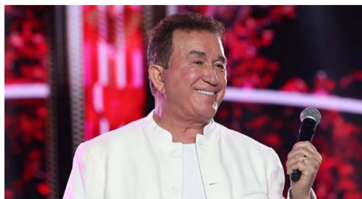
Assessoria de Amado Batista contesta a inclusão no cadastro

Cantor foi incluído na atualização mais recente do cadastro de empregadores no MTE