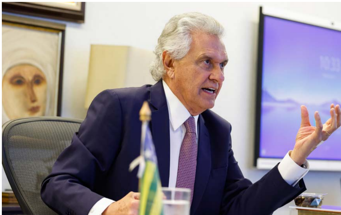
Ronaldo Caiado diz que é "gestor de entregas e não dos likes" em redes sociais

A crítica sinaliza um movimento de diferenciação dentro do eleitorado conservador, ao mesmo