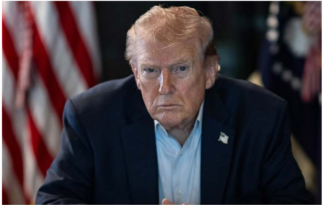
Donald Trump anuncia trégua temporária enquanto negociações com o Irã avançam sob pressão internacional

Até o fechamento desta edição, o governo iraniano não havia se manifestado. Autoridades do país clas-