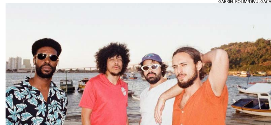
Banda é aclamada no cenário internacional com shows em festivais dos Estados Unidos e da Europa

Antes da balada “Falsa Folha de Rosto”, o Boogarins chega ao ápice. É “Mario de Andrade Selvagem”. Guitarra nervosa, solando. Acabou? Não, a música não acabou. Rola