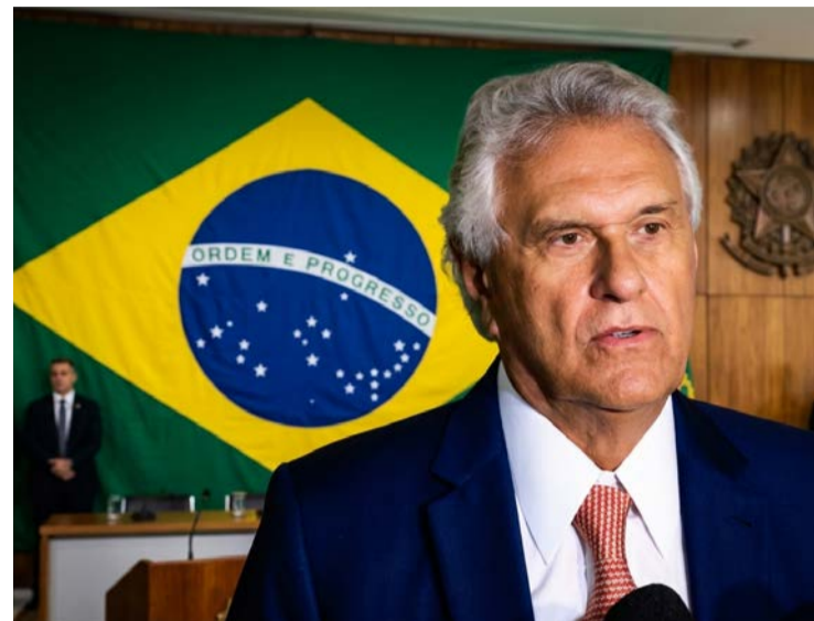
Governador Ronaldo Caiado conquistou 84,7% de aprovação entre os goianos

Entre o segmento das mulheres, a aprovação atinge 85,5%; entre os homens chega a 83,8%