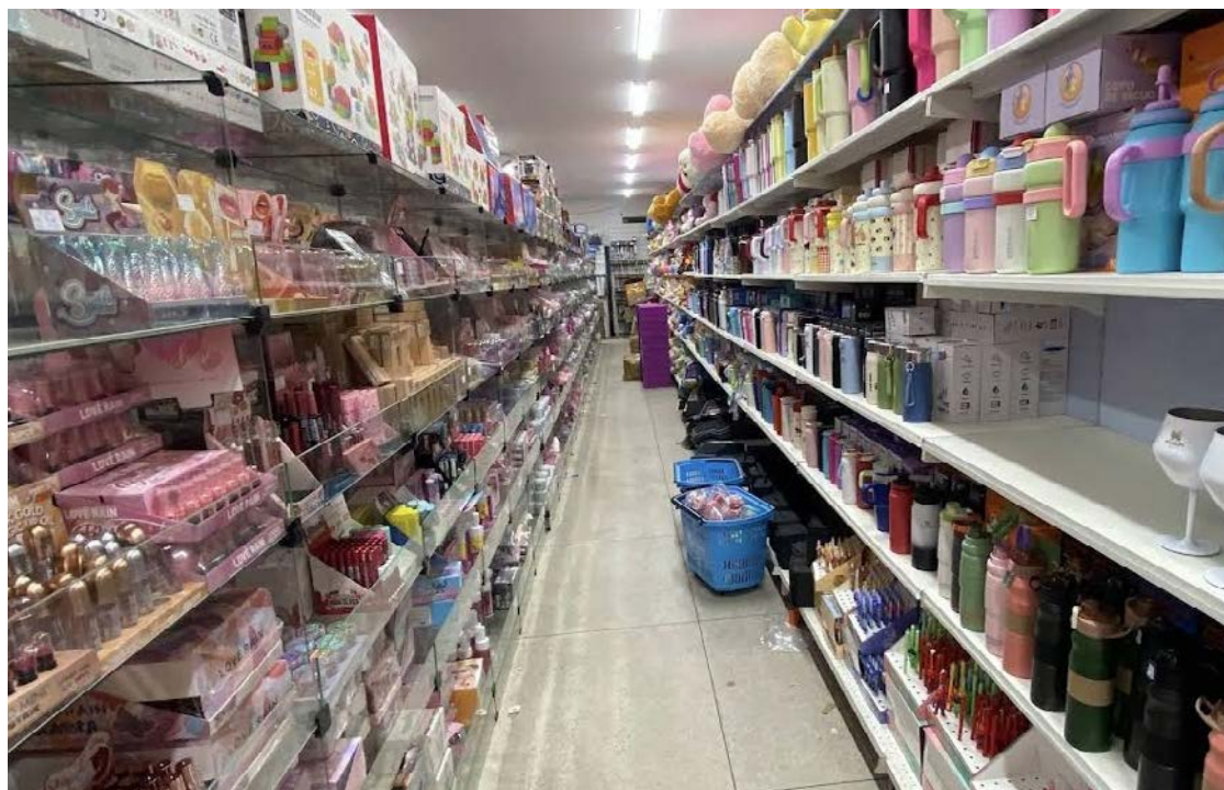
Atratividade econômica de Goiás une presença de estrangeiros e empreendedorismo regional