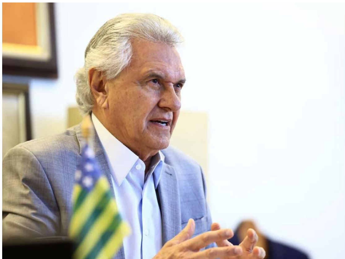
Ronaldo Caiado: críticas e cobranças das promessas do go governo Lula

O presidente nacional do PSD, afirmou que a fi-