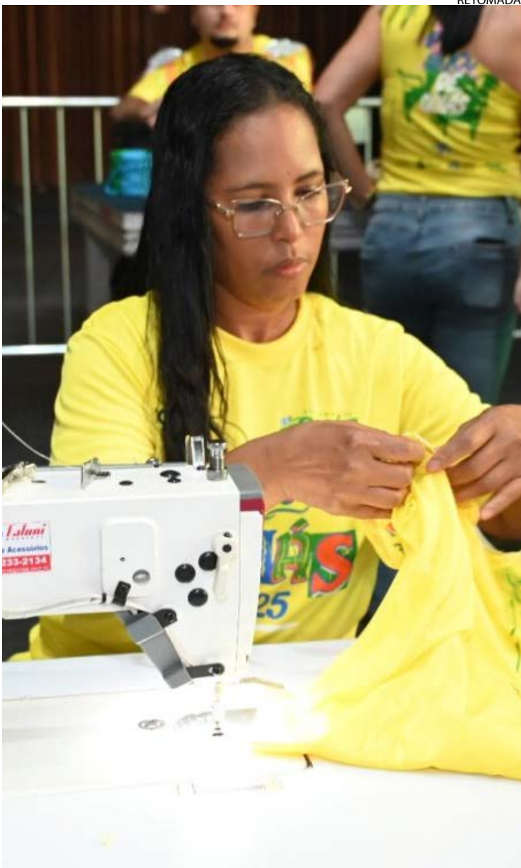
Dez profissionais da moda vão customizar abadás

Entre as atrações estão Léo Santana, Dennis DJ e a dupla Guilherme e Benuto. A realização do circuito é do Governo de Goiás, por meio das secretarias da Retomada e da Cultura, com o apoio da Prefeitura de Goiânia.