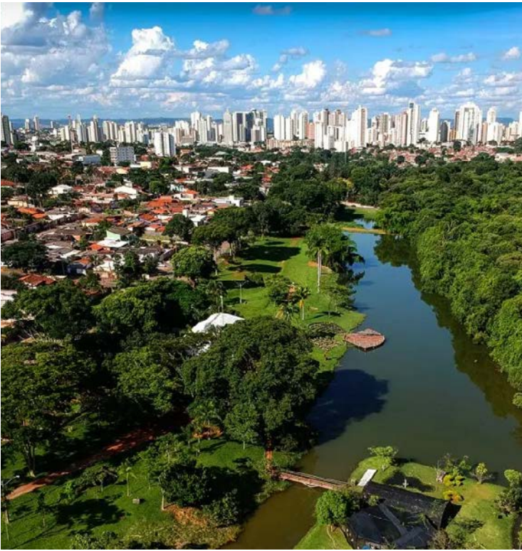
Em 2024, a capital goiana arrecadou cerca de R$ 17 bilhões em impostos

Ao analisar os dados de forma mais ampla, a pesquisa aponta que 82 municípios concentram 50% de toda a arrecadação do país, embora reúnam cerca de 40% da população brasileira. Em contrapartida, 5.494 municípios dividem R$ 1,81 trilhão da arrecadação, mesmo abrigando aproximadamente