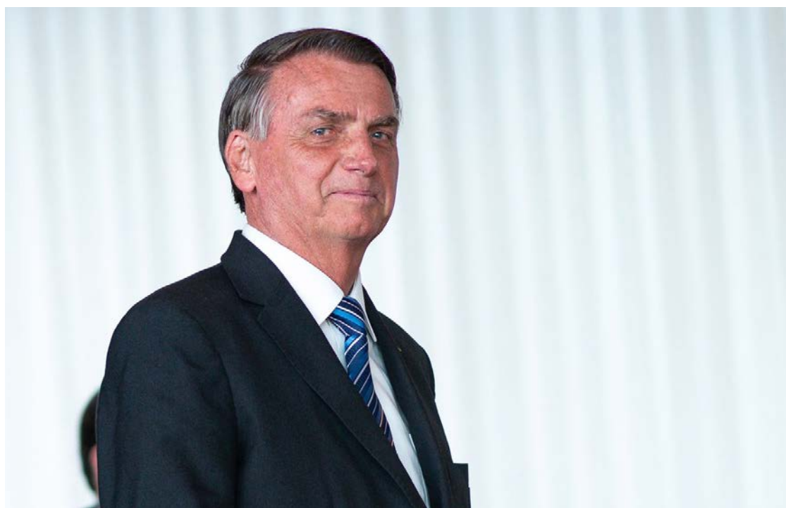
Ex-presidente Jair Bolsonaro demonstrou descaso com ética, diz Ministério Público Militar

O STM recebeu na mesma terça-feira as representações que pedem a perda de patente dos cinco militares apontados como integrantes do núcleo central da trama golpista liderada por Bolsonaro, todas en-