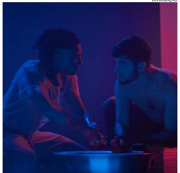
Desejo homoerótico comanda filme ambientado em Porto Alegre (RS)

"Ato Noturno" parece moldado por uma lógica neoliberal, na qual o êxito individual — no palco artístico ou no campo político — funciona como justificativa da própria existência, em um contexto em que o movimento LGBTQIA+ se mostra assimilado pelo establishment. (Com informações da Folhapress)