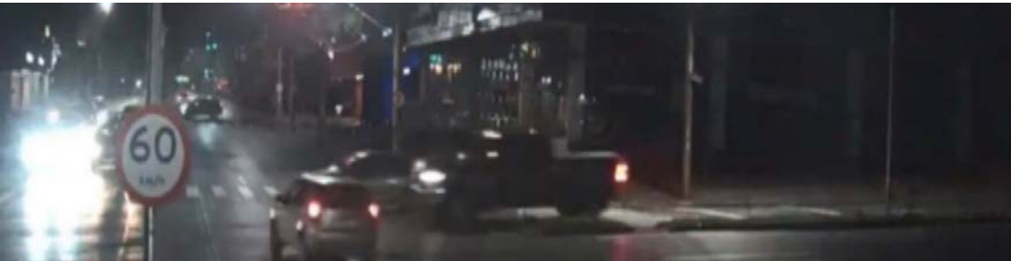
Acidente ocorreu no cruzamento da Avenida Mutirão com a T-9, no Setor Marista