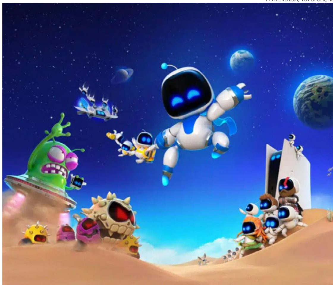
Astro Bot recebeu elogios por reforçar experiência lúdica de brincar

Como categoria que enfoca a melhor experiência geral (jogabilidade, design de levels, game design, música, etc), cumpre dizer que até aqui não existe favorito. Mas com certeza existem polêmicas: 'Elden Ring: Shadow of the Erdtree', por exemplo, é uma DLC e não deveria estar aqui. É a opinião do autor deste texto: um downloadable content (conte-