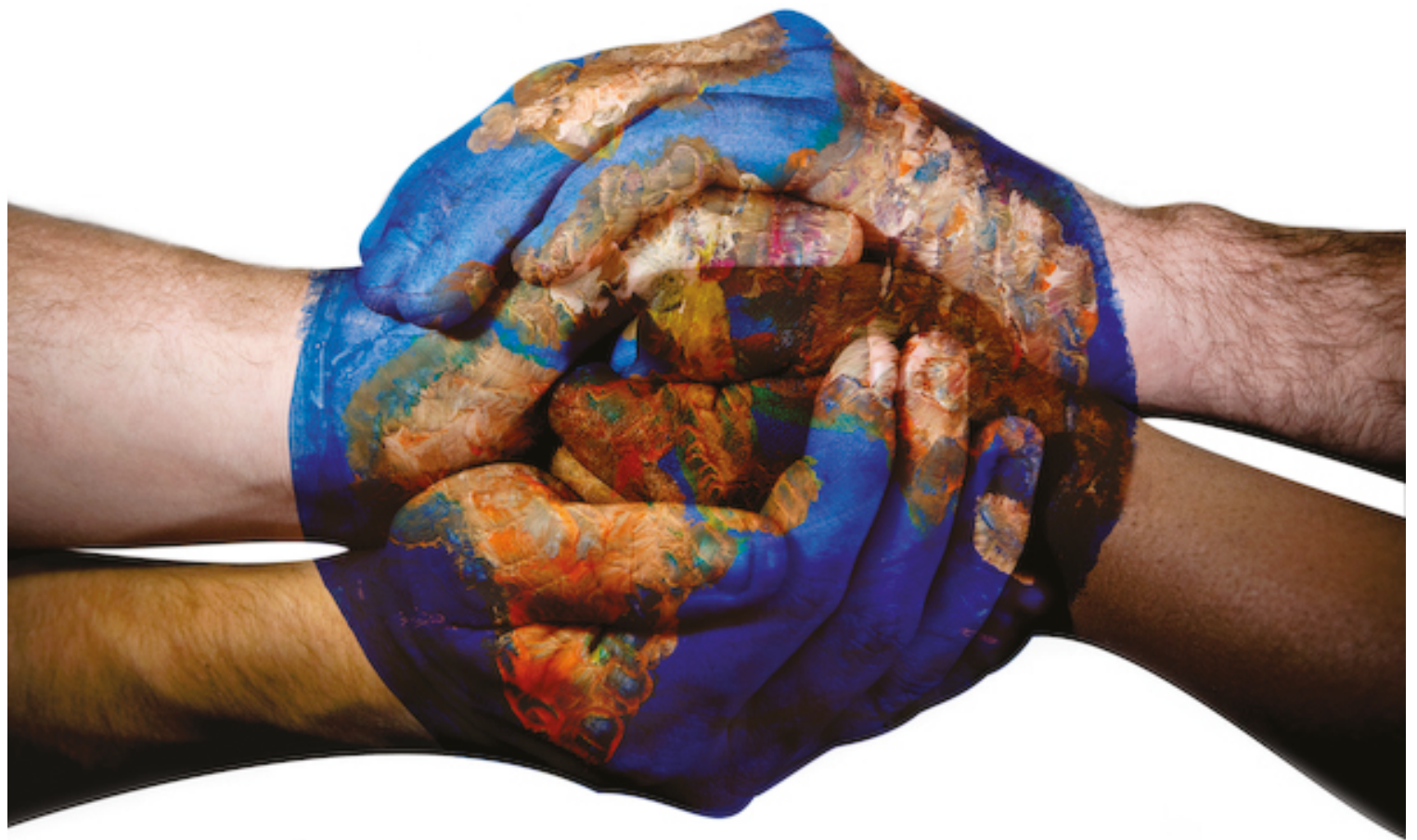
O pacto mundial em prol dos direitos humanos foi assinado em 10 de dezembro de 1948, no âmbito da Organização das Nações Unidas (ONU)

Na propositura, o autor destaca, de forma especial, documentos de referência para a promoção dos direitos das crianças, adolescentes, mulheres e idosos. Dentre eles, são citados: a Constituição Federal; o Estatuto da Criança e do Adolescente (ECA); a Convenção Americana sobre Direitos Humanos; os Pactos Internacionais dos Direitos Cívicos e Políticos e dos Direitos Econômicos, Sociais e Culturais; a Convenção sobre a Eliminação de Todas as Formas de Dis-