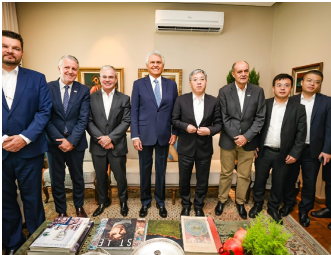
Governador Ronaldo Caiado durante encontro com representantes do Grupo Shandong Heavy Industry (SHIG)