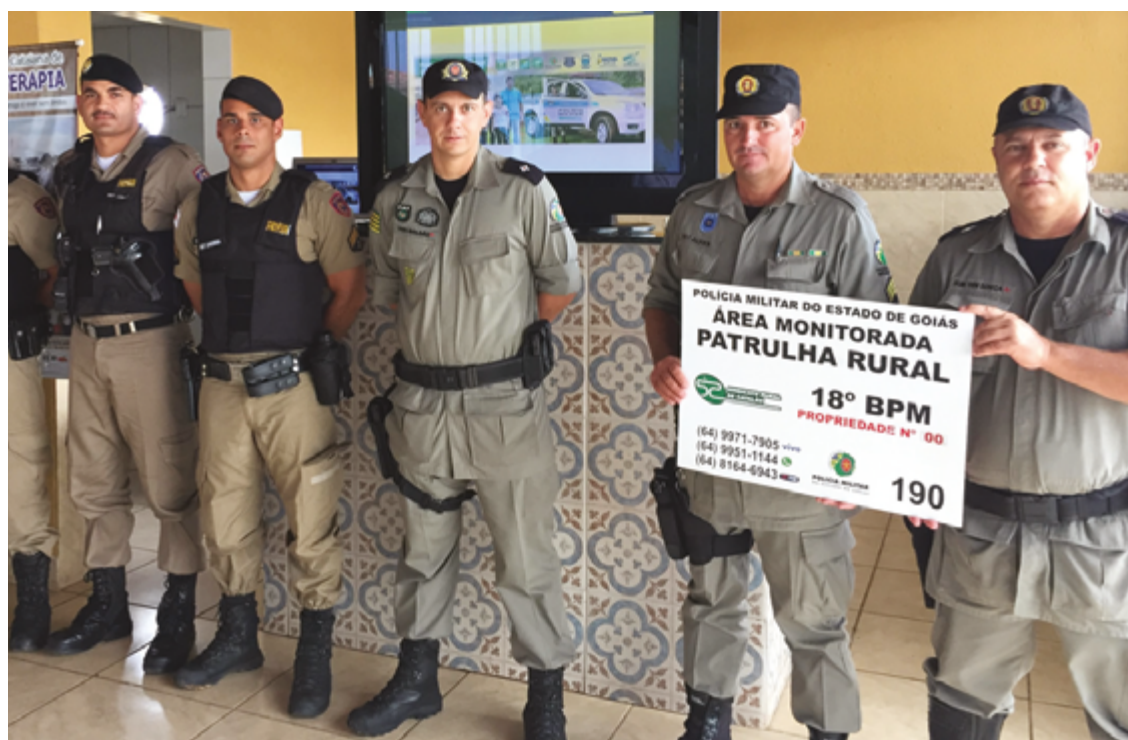
Iniciativas de patrulhamento rural, gestão de penitenciárias e apoio às mulheres vítimas de violência são premiadas

Presidente do Consórcio Brasil Central, o governador Ronaldo Caiado destacou que a terceira edição do Prêmio de Boas Práticas ajuda a divulgar iniciativas positivas na área de segurança pública e incentiva o intercâmbio de experiências com todos os interessados em "realmente combater o crime e proporcionar resultados concretos à população". Ele também elogiou os projetos goianos que se destacaram no