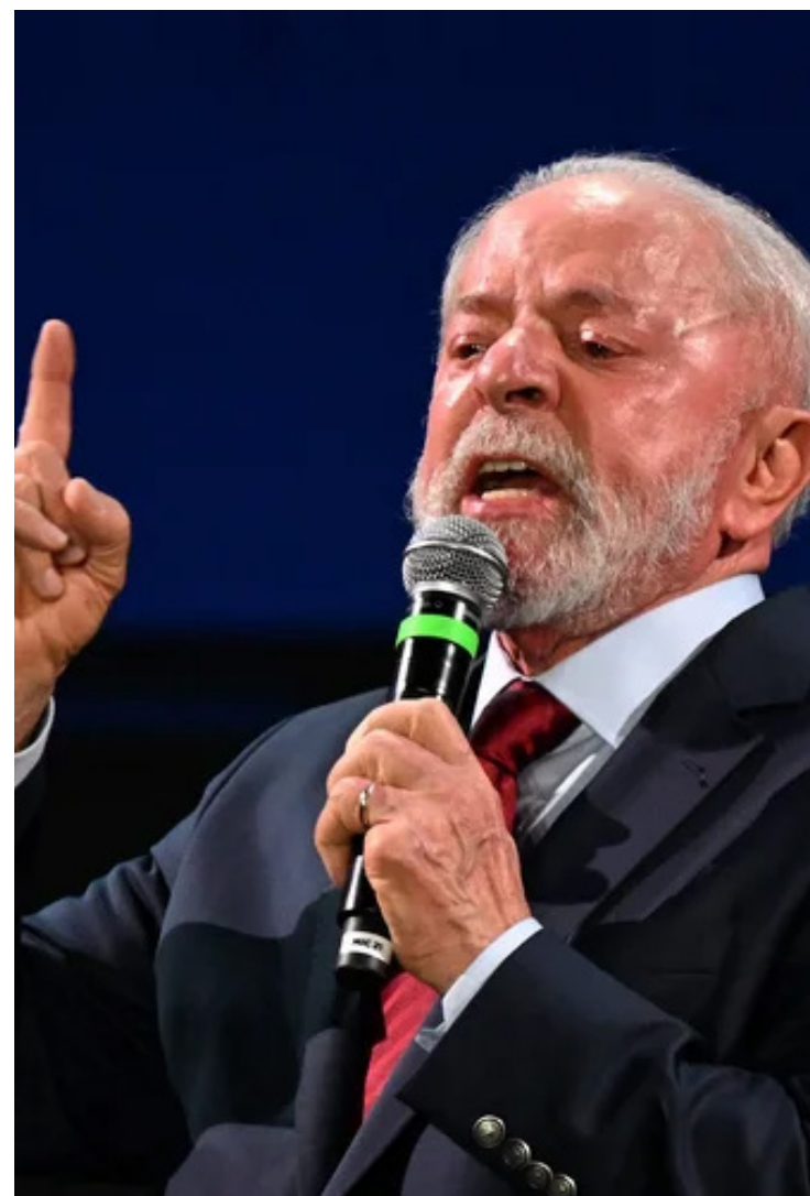
Luiz Inácio Lula da Silva: segundo ano de governo