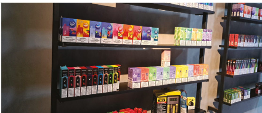
Fabricação, comercialização, importação, distribuição, transporte e propaganda do produto são proibidas no Brasil