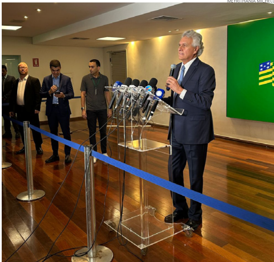
Ronaldo Caiado: defesa prepara recurso e projeto presidencial mantido

Caiado também comentou sobre o contexto da reunião que foi alvo da ação, realizada no Palácio das Esmeraldas com vereadores eleitos de Goiânia, que segundo a sentença do TRE-GO, teria sido usada para