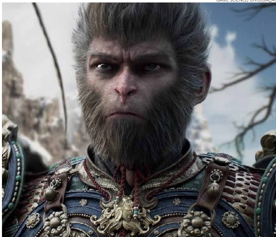
'Black Myth: Wukong' game vendeu bem, mas não tem cara de Goty

údo 'baixável') não deveria ter o status de jogo em si. Mas está aqui para provar que o Goty pode ter polêmicas nas próximas horas, já que 'Elden Ring' venceu o jogo do ano em 2022. Qual a aposta do DM ao jogo do ano? Lá vai... 'Astro Bot'.