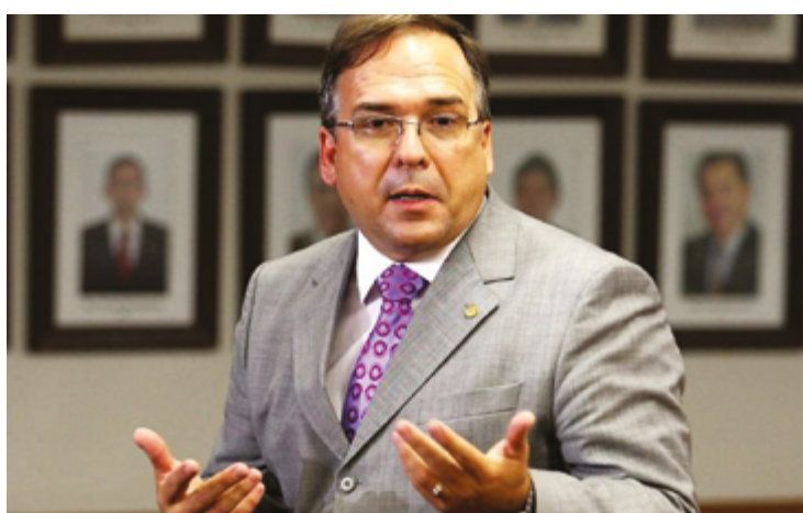
Defensores de Mabel discordam da análise que, entendem, se baseou em premissas equivocadas e não condizem com jurisprudência do TSE e TRE

Os juristas também destacaram que a decisão proferida não possui execução imediata. Assim, não haverá qualquer