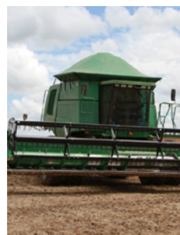
Soja e derivados são os produtos mais vendidos por Goiás a outros países

No levantamento referente apenas a novembro de 2024, o saldo comercial goiano foi de US$ 299 milhões, apresentando valores de exportação de US$ 736 milhões e de importação de US$ 437 milhões. No mesmo período, a balança comercial brasileira registrou saldo positivo de US$ 7 bilhões, apresentando valores de exportação de US$ 28 bilhões e de importação de US$ 20 bilhões.