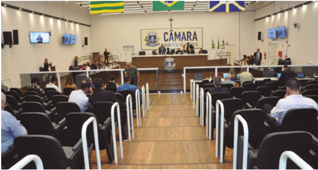
Plenário vai analisar pedido de autorização para suplementação; projeto é acompanhado de dois anexos