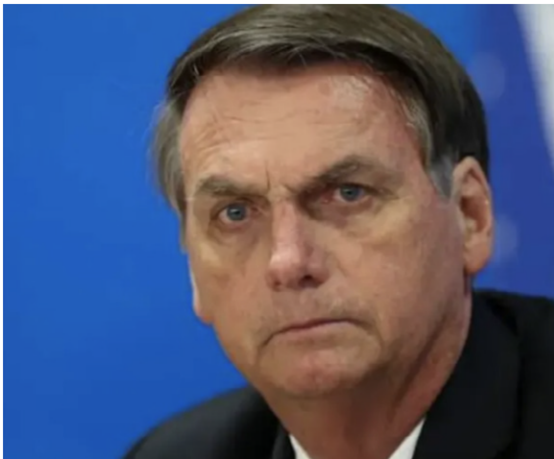
Jair Bolsonaro: fora das eleições por decisão do TSE

Em São Paulo, Tarcísio de Freitas, que já despontava como sucessor natural de Bolsonaro para a disputa presidencial de 2026, ganhou terreno. O apoio do chefe do Executivo paulista foi considerado