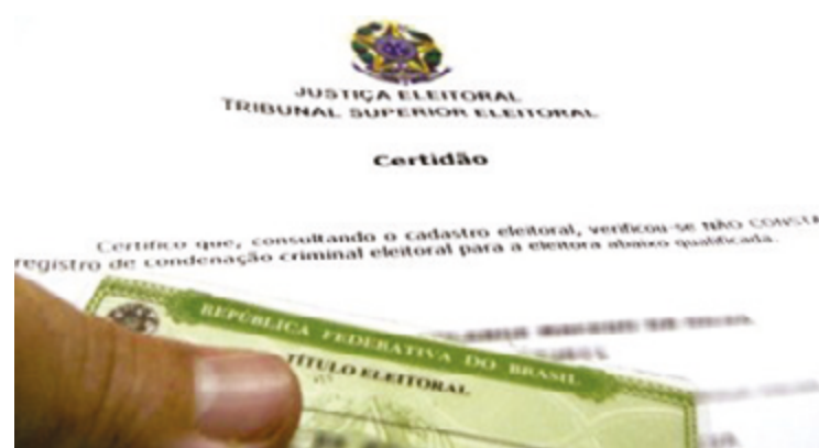
Certidão comprova que o eleitor está em dia com a Justiça Eleitoral

Finalizadas as Eleições Municipais de 2024, a eleitora e o eleitor já podem emitir a certidão de quitação eleitoral por meio do Autoatendimento Eleitoral na página do Tribunal Su-