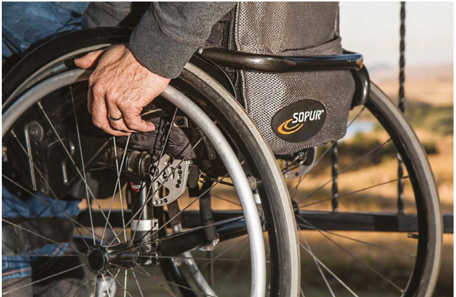
Para pessoa com deficiência, esta condição tem de ser capaz de lhe causar impedimentos de natureza física, mental, intelectual ou sensorial de longo prazo

A proposta também redefine o conceito de composição familiar. Atualmente, apenas as rendas de pessoas que moram sob o mesmo teto são consideradas. Com a mudança, rendimentos de parentes que vivem em endereços diferentes, como pais, filhos e irmãos, poderão ser incluídos, desde que contribuam financeiramente sem comprometer a própria subsistência. Enteados e menores tutelados também passarão a ser