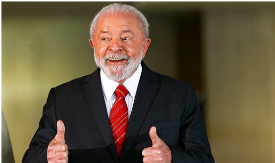
Luiz Inácio Lula da Silva: dilema do PT se o presidente não disputar reeleição

O episódio envolvendo a saúde do presidente, naturalmente, antecipa a discussão sobre a sucessão presidencial de 2026. Fontes próximas ao PT comentaram à agência Sputnik Brasil que a situação, embora sob controle, acendeu discus-