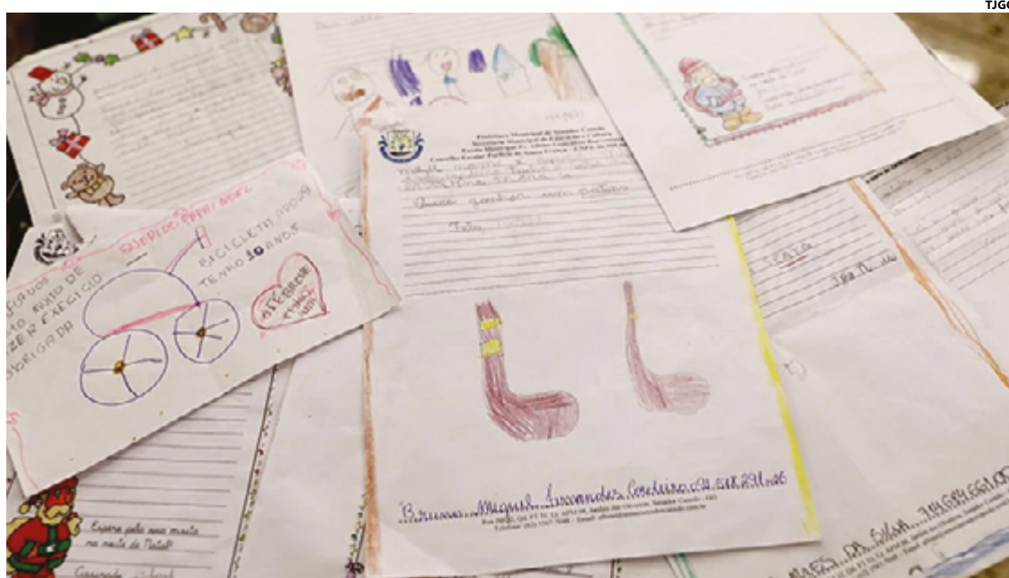
Bicicletas, bonecas, patins, carrinhos de controle remoto, kits de arte, pipa: alguns dos pedidos feitos pelos pequenos