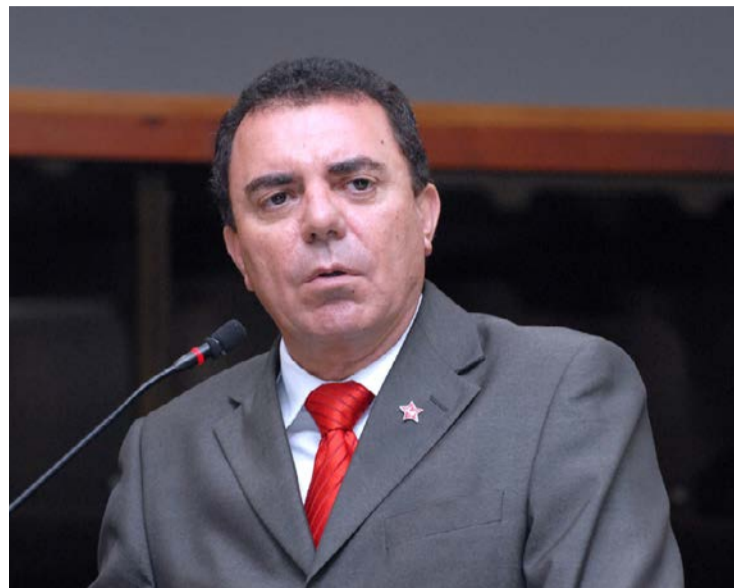
Luís César Bueno é um dos nomes cotados no PT ao governo

Decisão atende orientação da direção nacional do partido, que cobra palanque competitivo a Lula