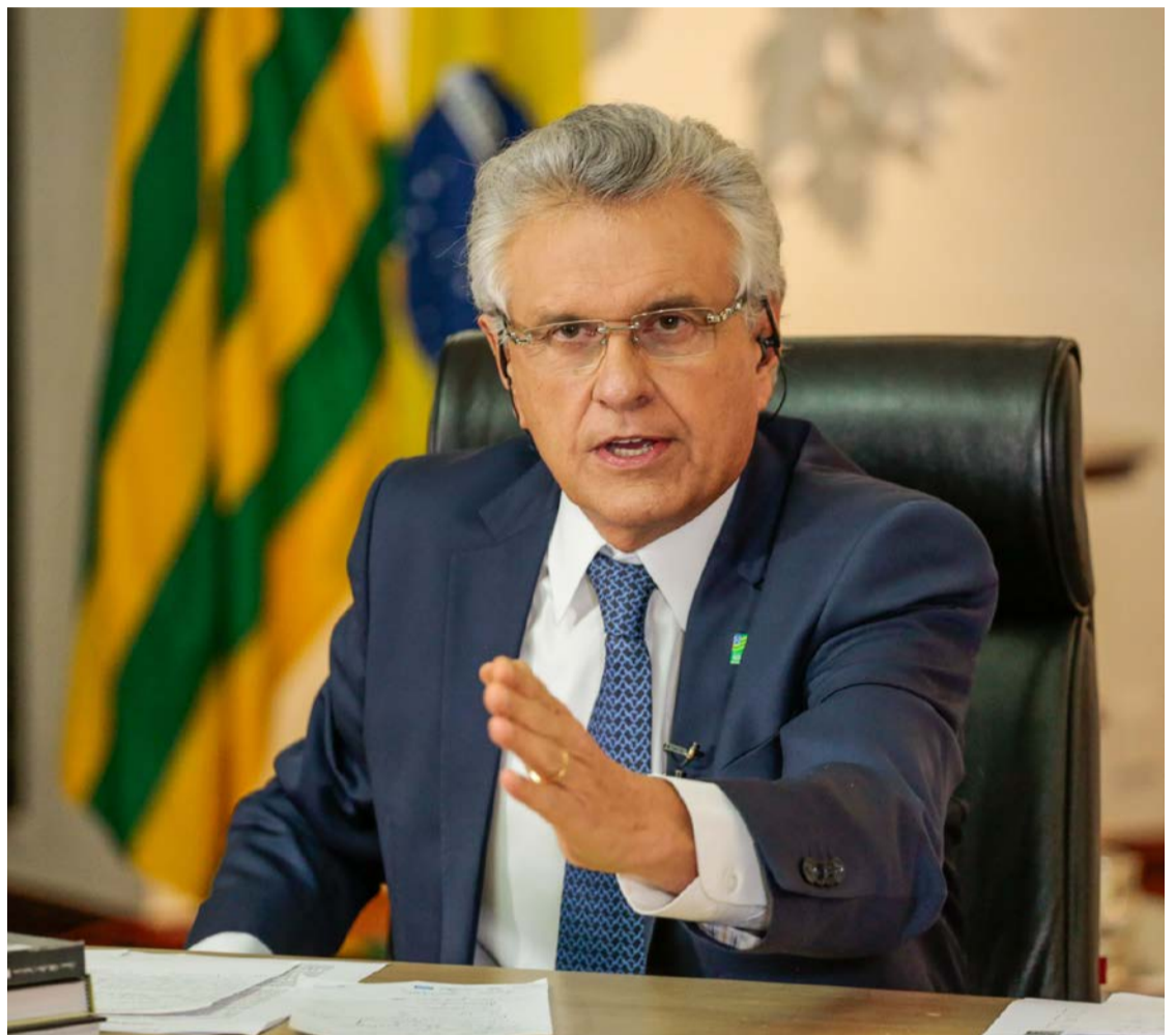
Ex-governador Ronaldo Caiado descarta alianças com outras siglas no primeiro turno

Segundo ele, definições dessa natureza costumam ocorrer apenas em estágios mais avançados do processo eleitoral. Caiado ainda lembrou que esta será sua