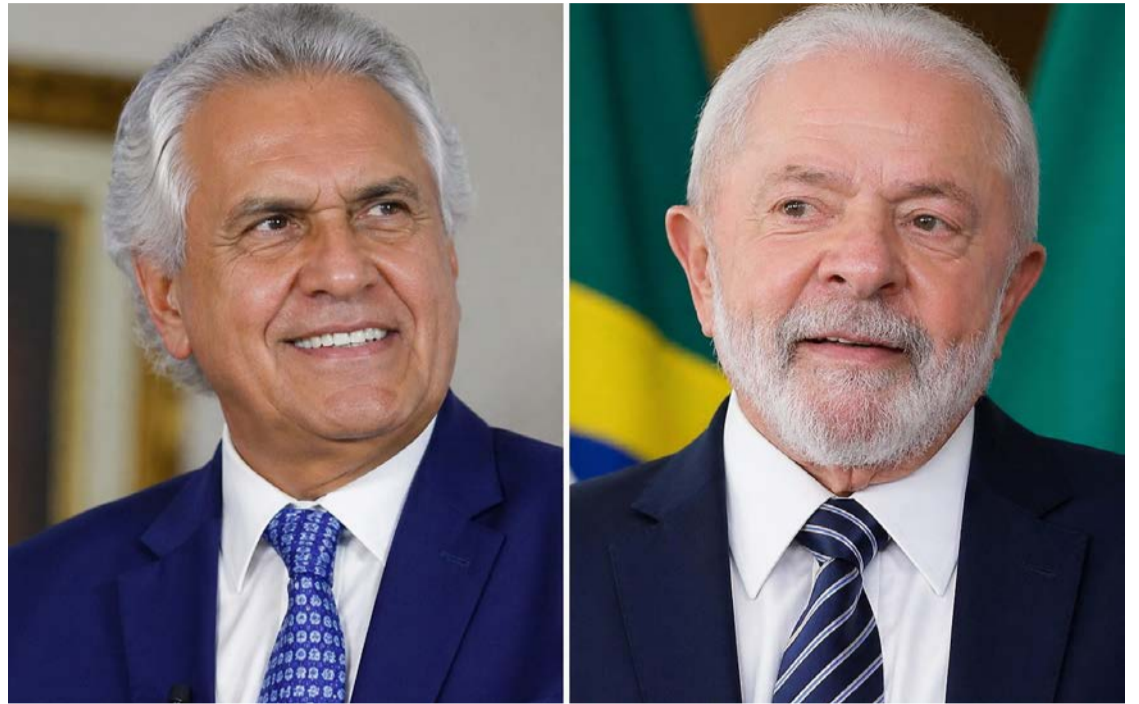
Ronaldo Caiado empata dentro da margem de erro com Lula em eventual segundo turno

No primeiro turno, Lula lidera com 41% das intenções de voto na pesquisa