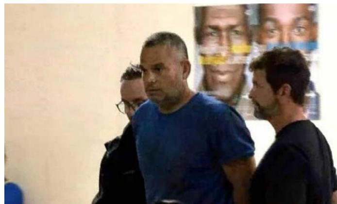
Delegado baleou a esposa e mais duas mulheres em 2025

Corpo do delegado foi encontrado em uma área de mata, situada às margens da BR-153