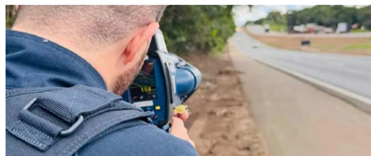
697 autuações aplicadas em diversas irregularidades no trânsito