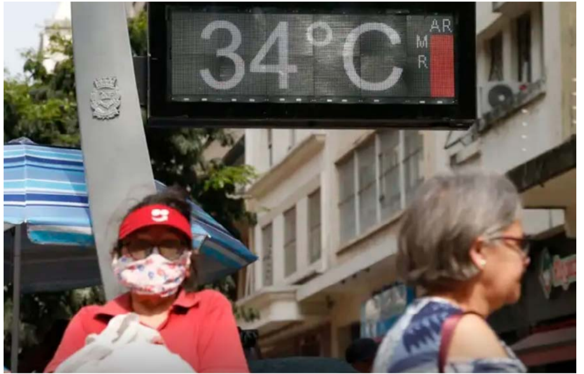
Relatório reúne evidências recentes e alerta que, sem controle da poluição, décadas de avanços no enfrentamento do câncer podem ser comprometidas

Países de baixa e média renda concentram a maior parte desse impacto. Além de lidarem com maior poluição, dispõem de menos recursos para prevenção e tratamento, o que agrava tanto os desfechos de saú-