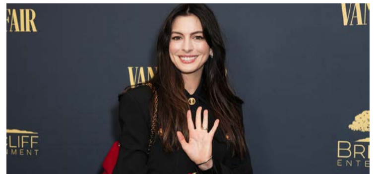
Anne Hathaway está de volta às telas