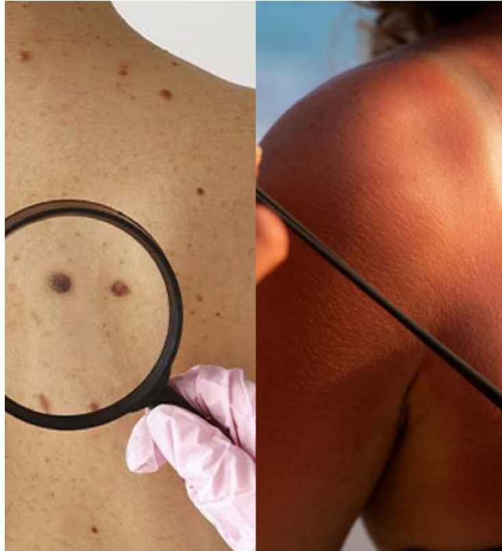
Exposição solar é um dos principais fatores para o aumento dos casos

Outro fator relevante é a associação cultural entre pele bronzeada e aparência saudável. A médica reforça que não existe bronzeamento seguro. "O bronzeado é uma resposta da pele a uma agressão. Quando a pele bronzeia, ela já sofreu dano", explica