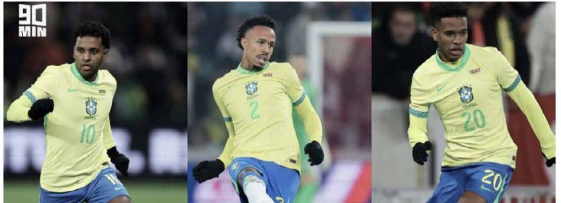
Lesão confirmada tira Rodrygo da Copa do Mundo de 2026, enquanto Éder Militão e Estêvão ainda são dúvidas

A Seleção Alemã lida com a ausência de Serge Gnabry, que apresentou