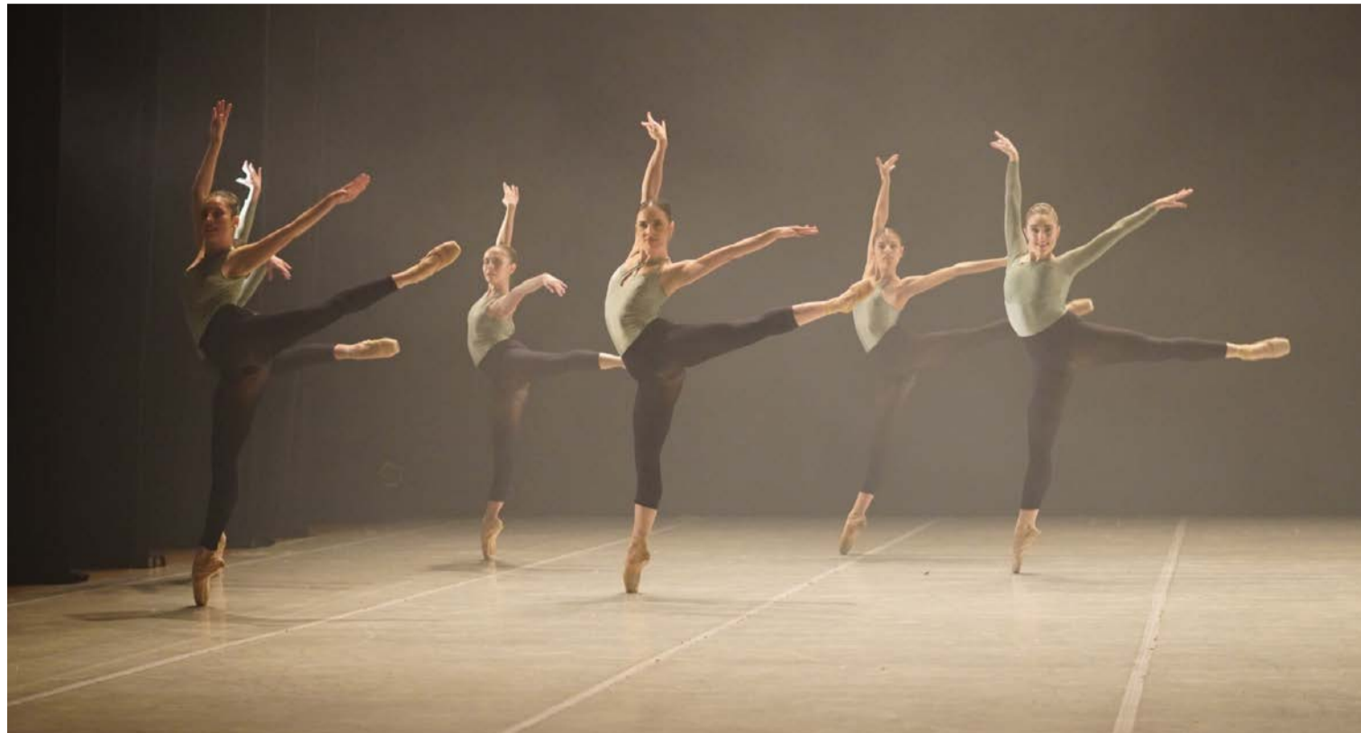
20ª Mostra Didática de Dança reúne alunos em espetáculos realizados entre quinta-feira (25) e domingo (28) no Teatro Escola