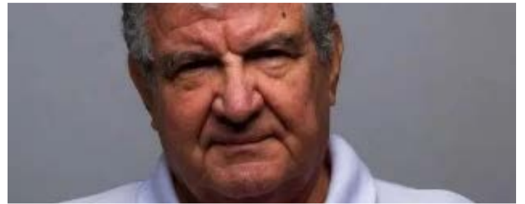
Campos teve papel fundamental no desenvolvimento do automobilismo