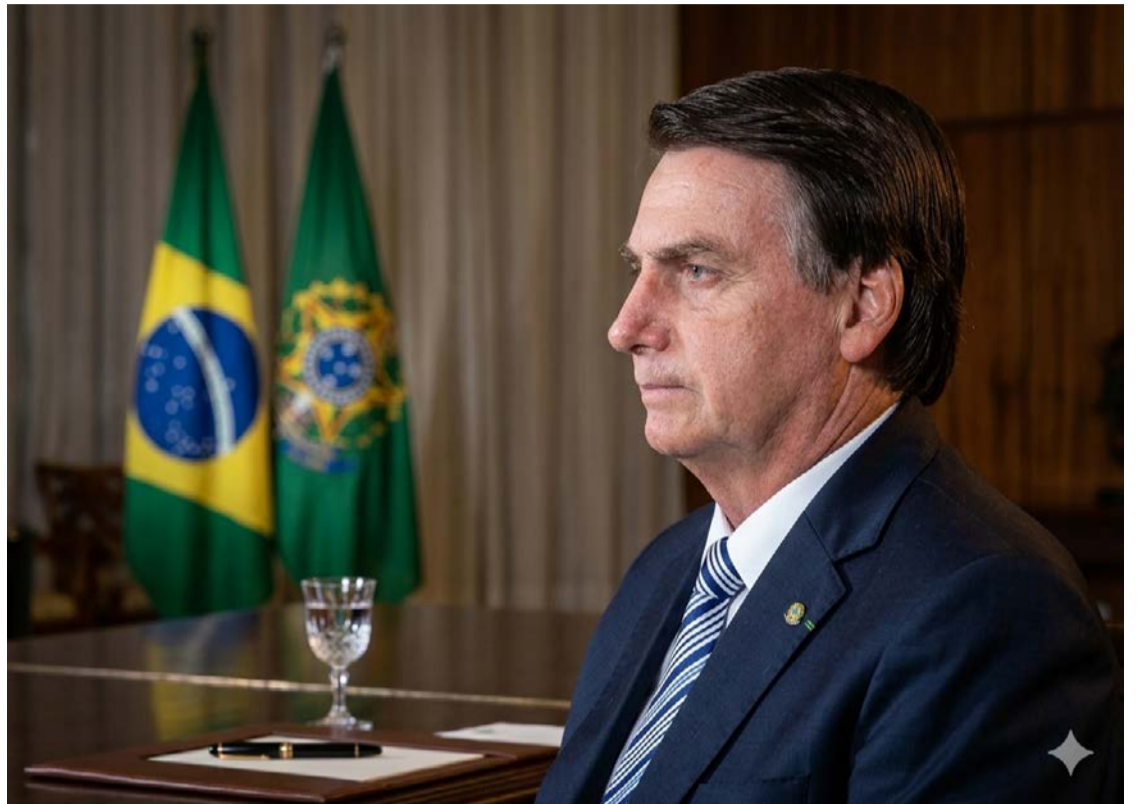
Ex-presidente Bolsonaro entendeu a força das redes e usou na sua vitória em 2018

Os números ajudam a explicar esse fenômeno. Pesquisa do DataSenado mostrou que quase metade dos eleitores brasileiros afirmou ter levado em consideração informações vistas nas redes sociais para decidir o voto. O levantamento também identificou os aplicativos