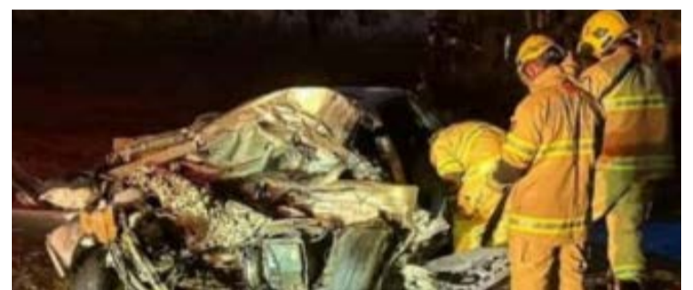
PRF realizou fiscalização nas rodovias federais durante o fim de semana