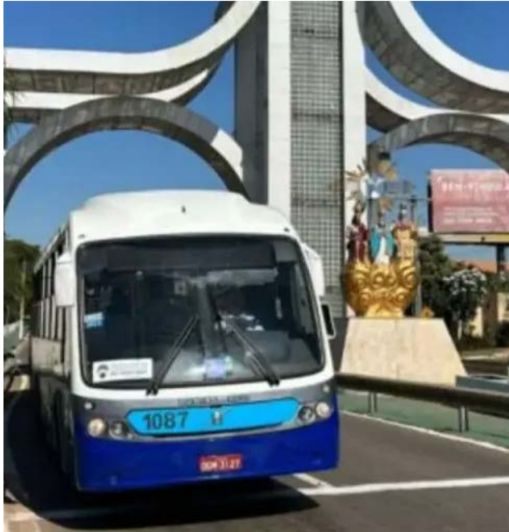
CMTC reforçará as linhas que atendem Trindade, com mais de 1,4 mil viagens programadas

Entre as novidades da operação deste ano está a implantação da Linha 736,