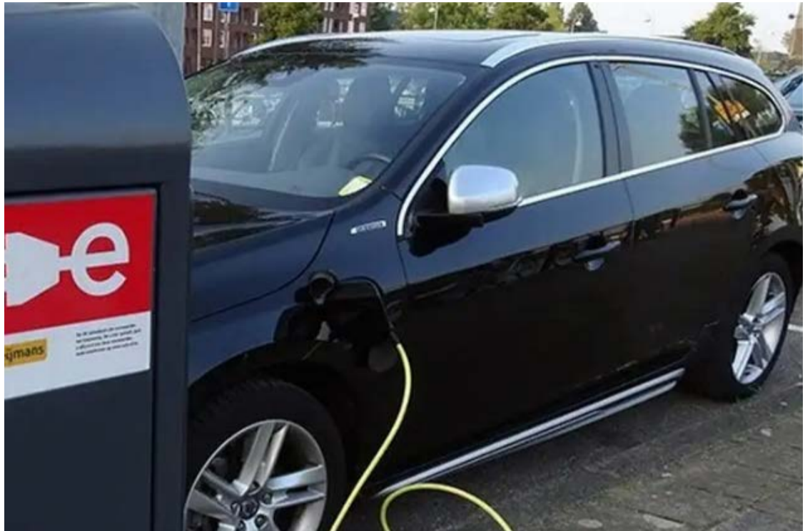
Anfavea entende que os carros elétricos já receberam benefícios suficientes do governo