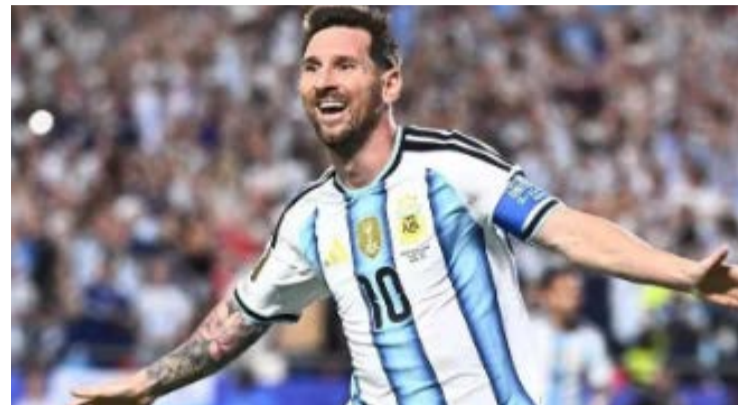
Camisa 10 argentino chegou a 18 gols em Mundiais

Argentino supera Klose e se torna o maior artilheiro da história das Copas do Mundo