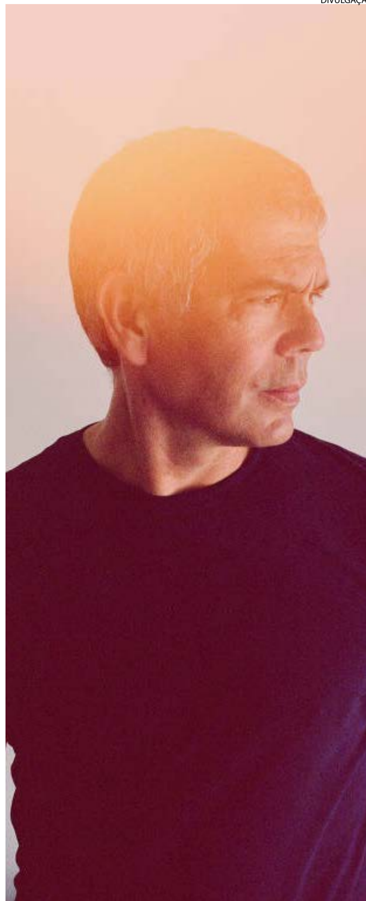
Guitarrista leva trabalho para zona menos soturna