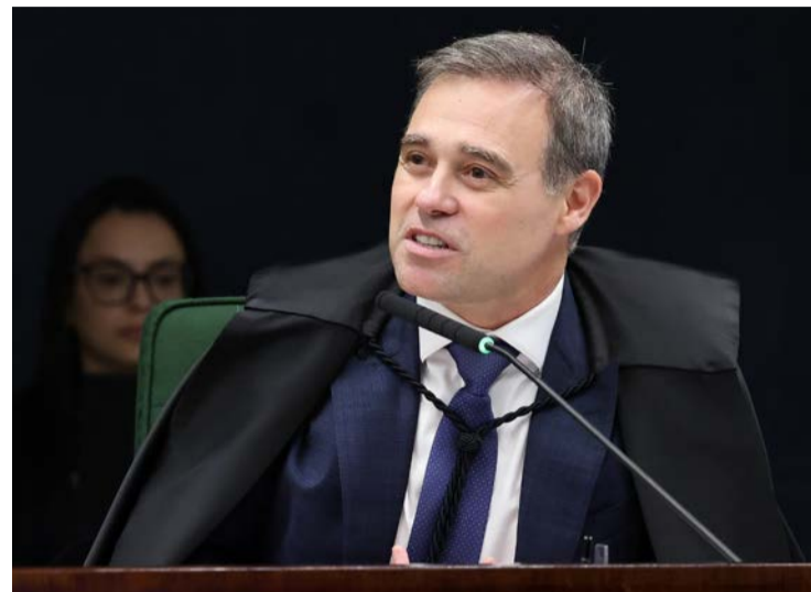
Ministro André Mendonça determina retirada de vídeos com fakenews

Ministro ressaltou que a liberdade de expressão não elimina a necessidade de fatos serem reais