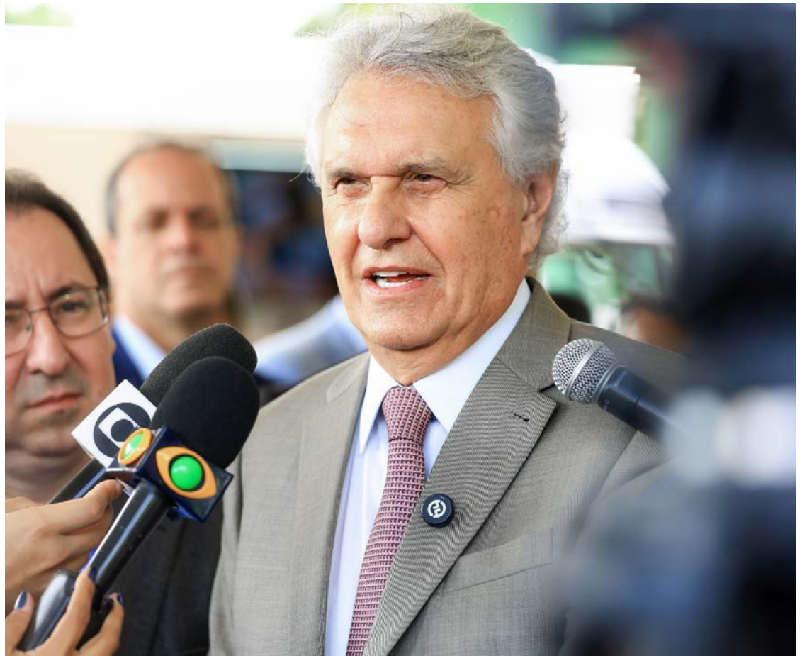
Governador Ronaldo Caiado alerta população sobre riscos de retrocesso em Goiás

Caiado destacou que, pela oitava vez consecutiva, seu governo lidera o ranking nacional de aprovação, alcançando 80%, conforme levantamento do instituto AtlasIntel divulgado em 17 de dezembro. Na interpretação do governador, o resultado é consequência direta da reorganização das contas públicas, do controle fiscal e da retomada da capacidade de investimento do Estado, após o início de sua gestão em 2019.