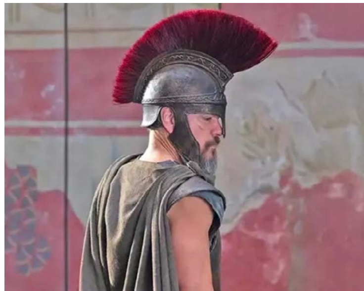
Matt Damon interpreta Odisseu em adaptação épica dirigida por Christopher Nolan, rodada em tecnologia Imax 70 mm

Nova adaptação do clássico de Homero é protagonizada por Matt Damon e chega aos cinemas em julho do próximo ano