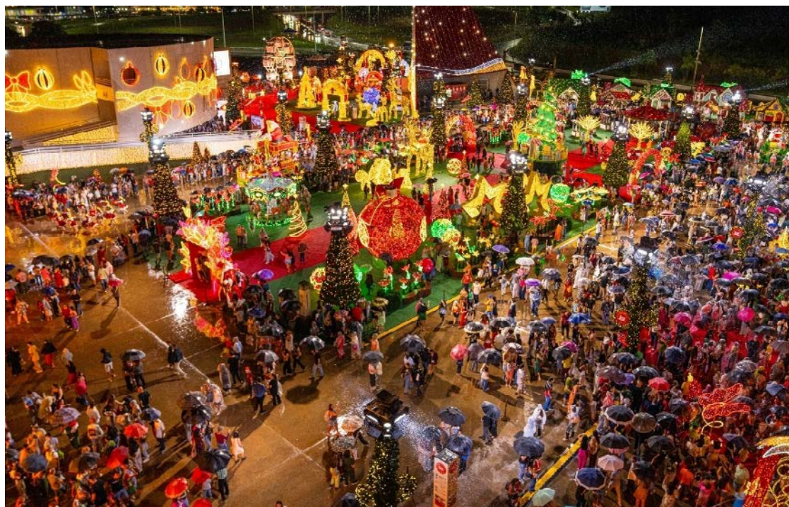
Iluminação cênica e apresentações artísticas compõem o cenário no Centro Cultural Oscar Niemeyer

A iluminação cênica é um dos grandes destaques do evento, com milhões de pontos de luz que desenharam caminhos, fachadas e espaços de convivência,