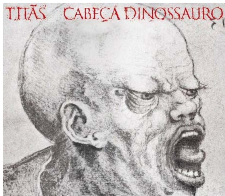
Capa traz um esboço do artista Leonardo Da Vinci

Se o Brasil, em 1986, reaprendia o que se chamava de liberdade após duas décadas de censura, o cenário hoje segue parecido. Atualmente, a sociedade cindiu-se a partir da intolerância. Por isso, na visão dos Titãs, o grito do "Cabeça..." ainda soa necessário.