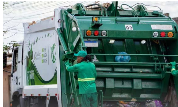
Mudança ocorre após rescisão dos contratos com antiga prestadora