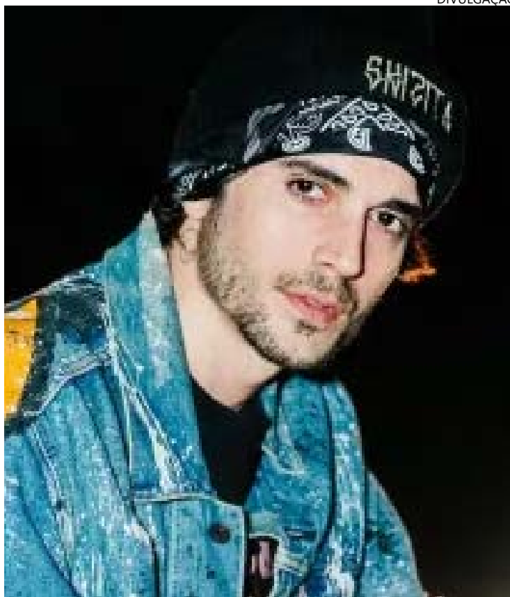
Fiuk desabafa e reclama da família em nova música