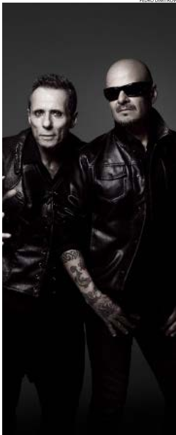
Banda pegará a estrada no próximo ano para celebrar clássico do rock brasileiro