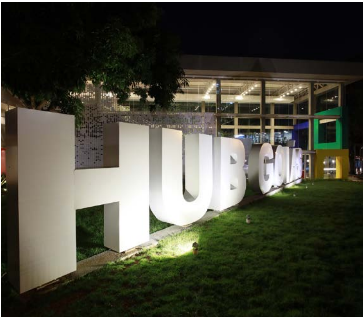
Startups estão presentes em 24 municípios e atuam em 69 segmentos

As startups estão presentes em 24 municípios e atuam em 69 segmentos, com ênfase em AgroTech, SoftTech, HealthTech, BioTech, EdTech e Construtech. Segundo o secretário José Frederico Lyra Netto, os resultados refletem investimentos contínuos em ciência, tecnologia e empreendedorismo inovador. Em dois anos, o Hub Goiás apoiou mais de 170 startups por meio de nove editais, com investimentos superiores a R$ 30 milhões, incluindo o programa Epicentro da Inteligência Artificial, que