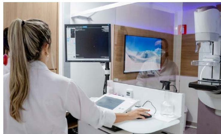
Programa Goiás Todo Rosa: acesso a exames genéticos e ao diagnóstico precoce do câncer de mama