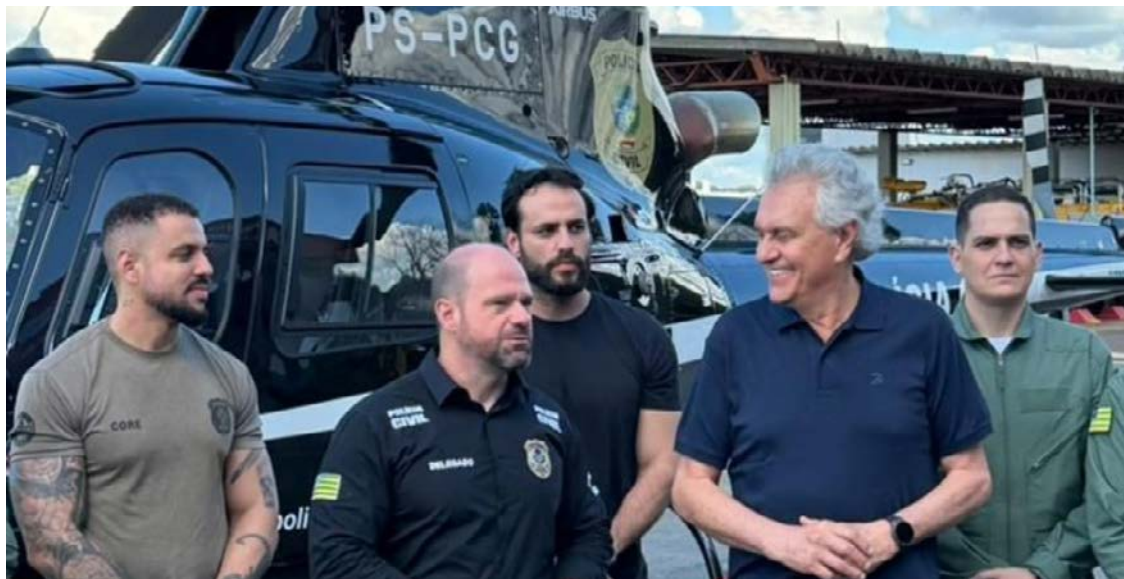
Helicóptero Airbus/Helibras AS350 B3 passa a integrar a estrutura aérea da Polícia Civil de Goiás

Aeronave de U$ 5,022 milhões amplia precisão, alcance e resposta operacional da PC-GO. Modelo Airbus/Helibras AS350 B3 é robusto