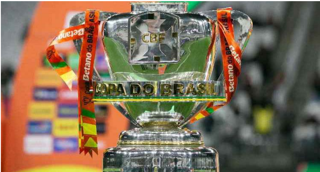
Competição terá 126 clubes, número recorde e significativamente superior ao da edição anterior

De acordo com o regulamento, a primeira fase será disputada pelos 28 clubes com pior posição no Ranking da CBF. Desse confrontos, 14 equipes avançam para a segunda fase, que contará ainda com a entrada de outros 72 times. Na etapa seguinte, juntam-se os campeões