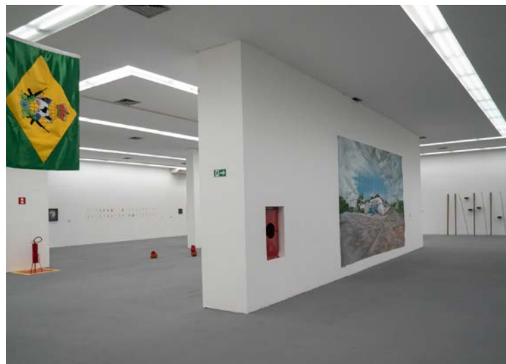
Mudanças não afetam os órgãos e entidades essenciais

Ponto facultativo será nos dias 24 e 26 de dezembro de 2025 e nos dias 31 de dezembro de 2025 e 2 de janeiro de 2026