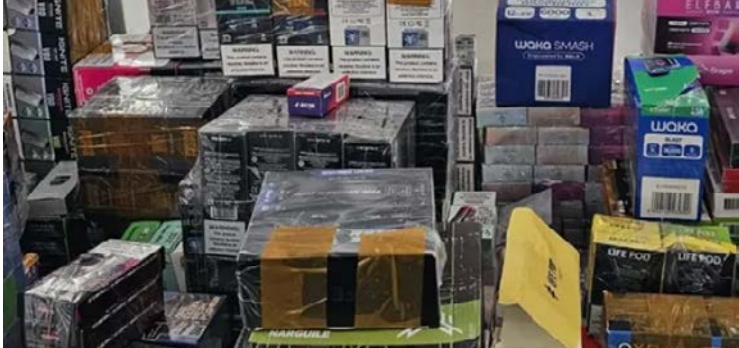
Polícia foi investigar veracidade da denúncia