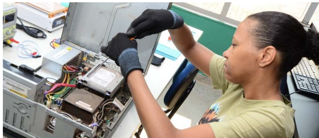
Selecionados precisam ter idade mínima de 12 anos: 60% das vagas são destinadas para mulheres