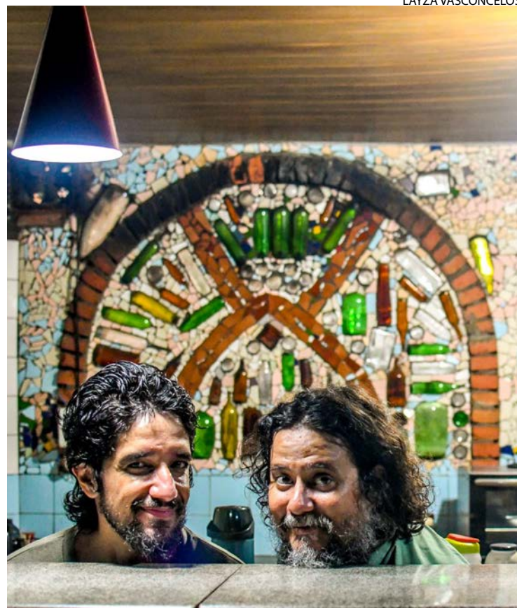
Nu Escuro escapa da nostalgia ao remontar espetáculo

A plateia será guiada por ambientes da Oficina Cultural Geppetto. “A itinerância não é apenas um recurso cenográfico, mas parte fundamental da proposta: ao transitar pelos espaços, o espectador experimenta na própria pele o deslocamento, a desorientação, a perda de referências — sensações que ecoam a experiência da loucura e do confinamento”, pontua. (M.V.B)