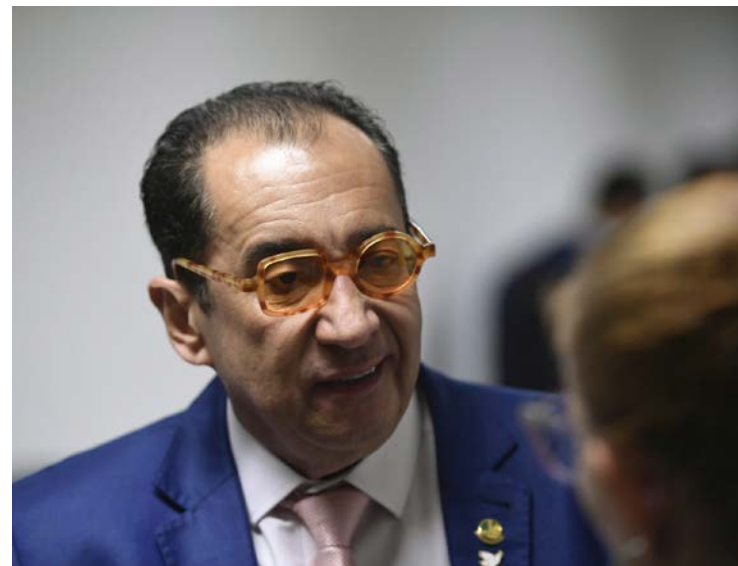
Jorge Kajuru: de Goiás para a política de São Paulo

Senador por Goiás recebeu diagnóstico no final do ano passado e agora quer cuidar da sua saúde