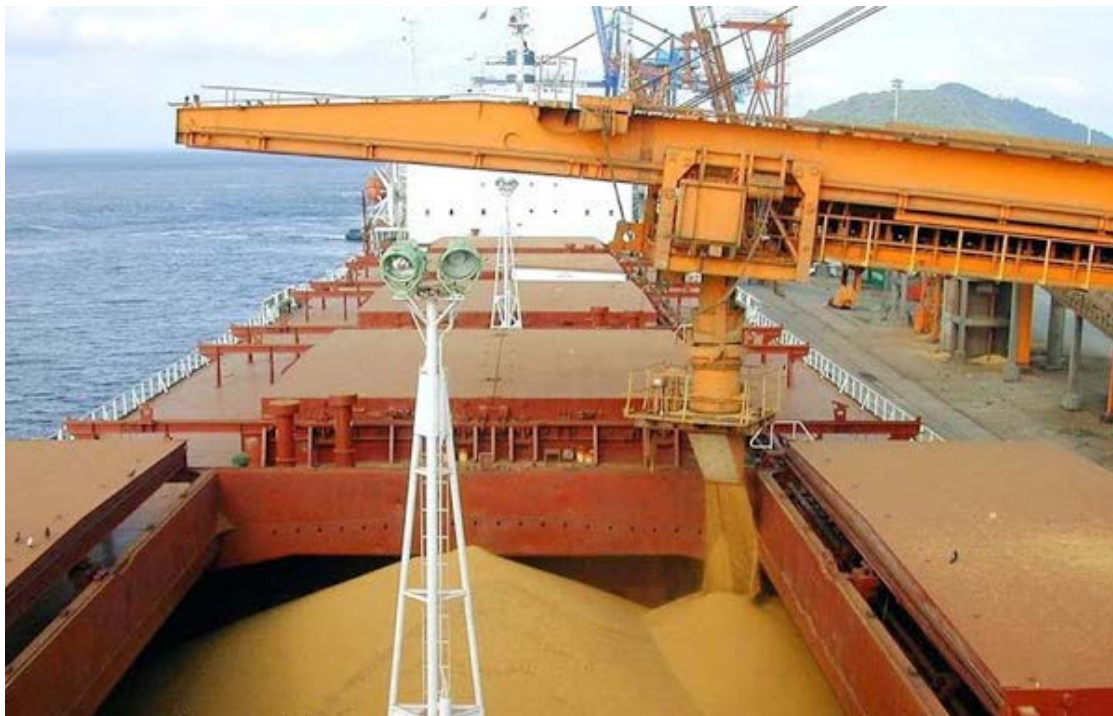
Exportações brasileiras de soja em grãos, acumuladas até dezembro de 2025, somaram 108,1 milhões de toneladas

As exportações brasileiras de soja em grãos, acumuladas até dezembro de 2025, somaram 108,1 milhões de toneladas, superando as 98,8 milhões de toneladas registradas no mesmo período do ano anterior. Pelos portos do Arco Norte foram expedidos 36,2% das exportações nacionais, acima dos