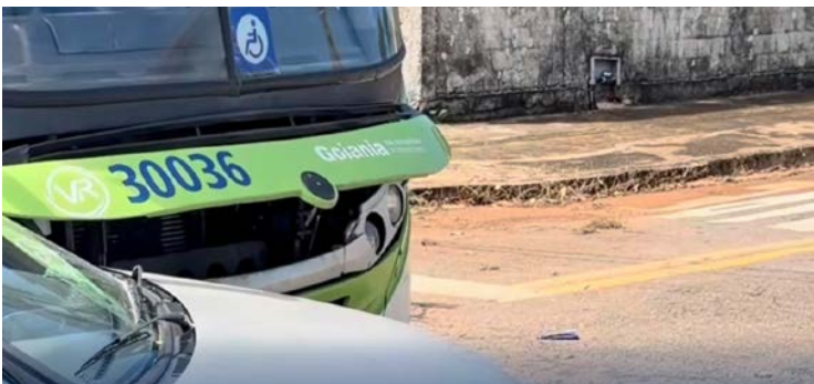
Colisão aconteceu na Rua Gonzaga Jayme, no setor Jardim Balneário

Um carro de passeio e um ônibus do transporte público se envolveram em um acidente nesta segunda-feira (26/01).