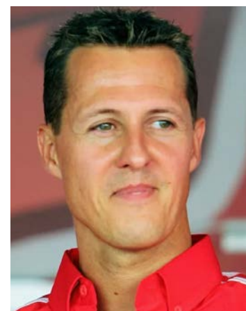
Vítima de um grave acidente de esqui em 2013, Schumacher necessita de cuidados permanentes

Ainda de acordo com o Daily Mail, os custos com o tratamento médico do ex-piloto chegam a “dezenas de milhares de libras por