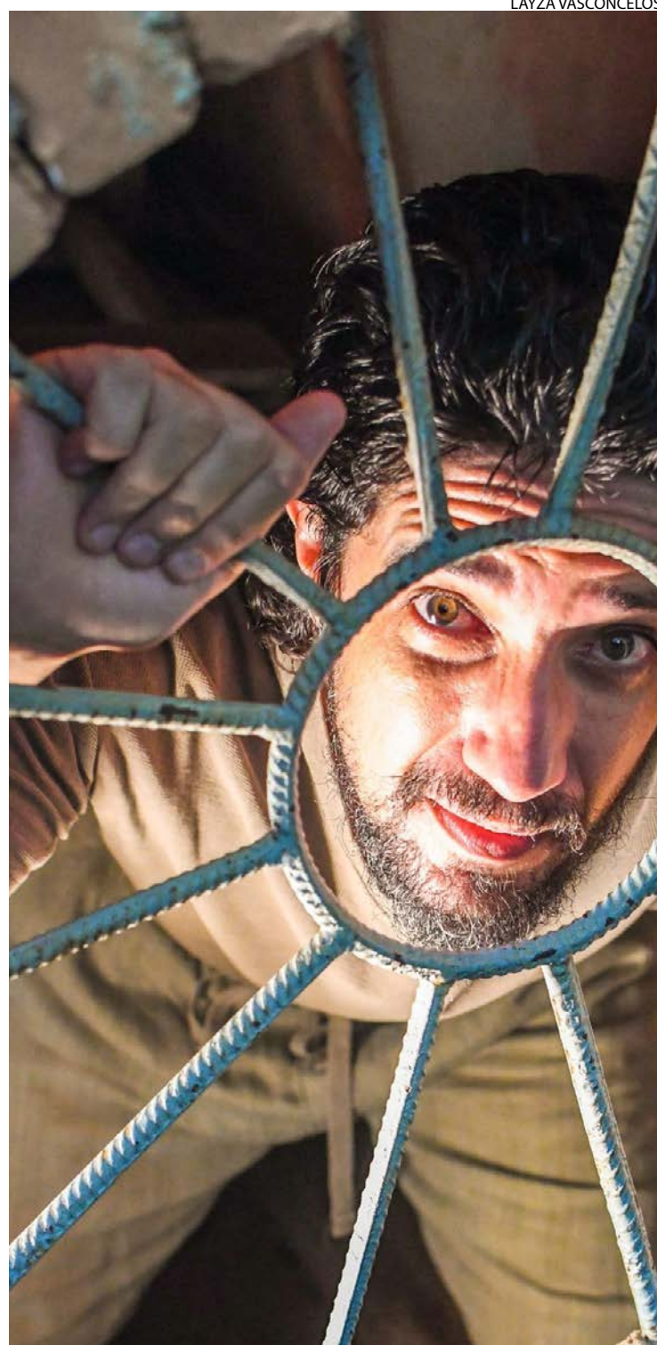
Cia de Teatro Nu Escuro se baseia em livro clássico publicado pelo escritor Machado de Assis em 1882

“Mais do que isso, o espetáculo propõe uma crítica ao culto dos salvadores individuais. Se o Dr. Bacamarte encarna o cientista iluminado que, sozinho, pretende curar a sociedade, a montagem questiona essa lógica messiânica tão presente em nossos tempos”, diz a diretora.