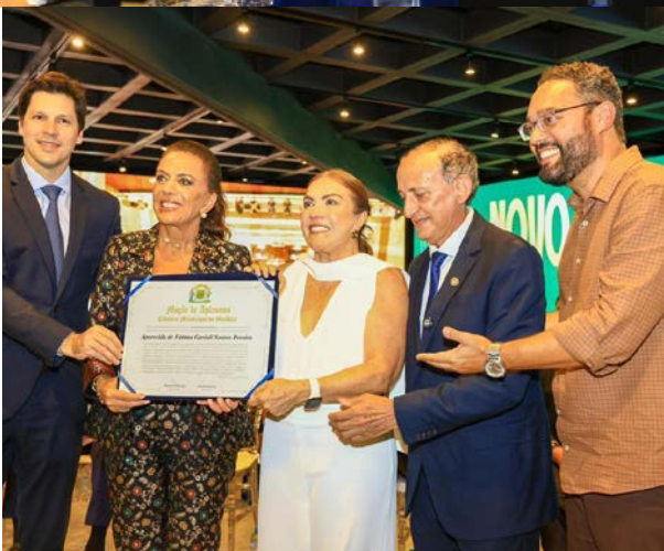
Vice-governador Daniel Vilela, primeira-dama Gracinha Caiado, secretária de Estado da Educação Aparecida de Fátima Gavioli, vereador Anselmo Pereira e deputado estadual Virmondes Cruvinel, na inauguração do Colégio Lyceu de Goiânia restaurado, no Centro.

O governador Ronaldo Caiado entregou, na última sexta-feira, a reconstrução do tradicional Colégio Lyceu de Goiânia, em uma inauguração considerada histórica. Prestes a completar 90 anos, a unidade — primeira instituição bilíngue (português/francês) da rede estadual — recebeu investimento de R$ 20 milhões e agora atende cerca de 800 alunos, sendo 30% oriundos da rede privada. O projeto preserva o estilo Art Déco do prédio tombado pelo Iphan e reposiciona o Lyceu como referência na educação pública goiana, com reconhecimento inclusive da Embaixada da França.