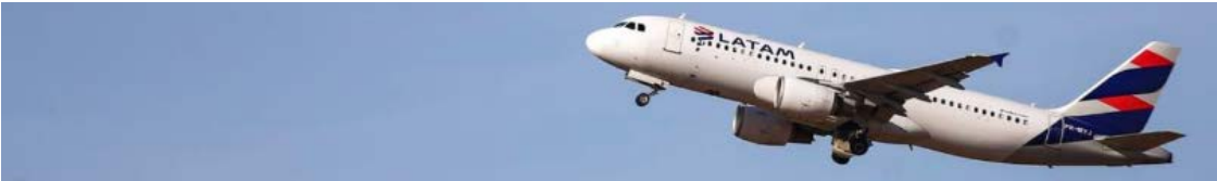
Expectativa é que os voos tenham início em junho, próximo às férias escolares

A Latam Airlines Brasil anunciou a criação de novas rotas domésticas que comecem a operar ao longo de 2026, entre elas a ligação aérea direta entre São Paulo e Caldas Novas. A rota partirá do Aeroporto Internacional de Guarulhos e será realizada com aeronaves Airbus A320, com capacidade para até 180 passageiros. A