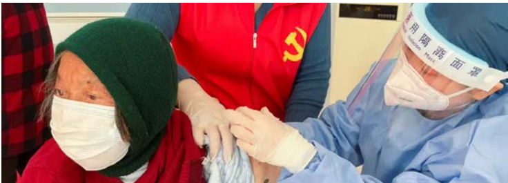
Surgimento de novos casos do vírus Nipah na Ásia voltou a despertar medo

O surgimento de novos casos do vírus Nipah na Ásia voltou a despertar o medo de uma nova pandemia e colocou autoridades de saúde em alerta máximo.