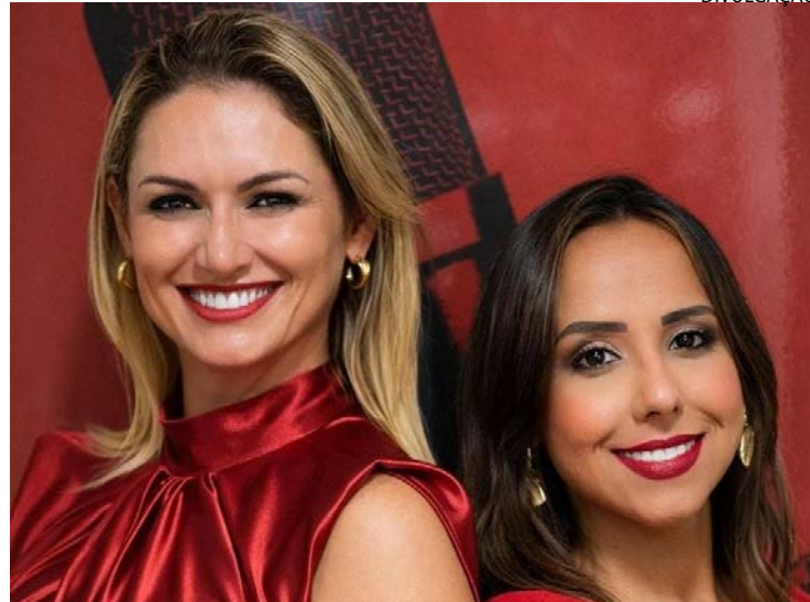
Iniciativa gera fusão entre conversa, estratégia e entretenimento