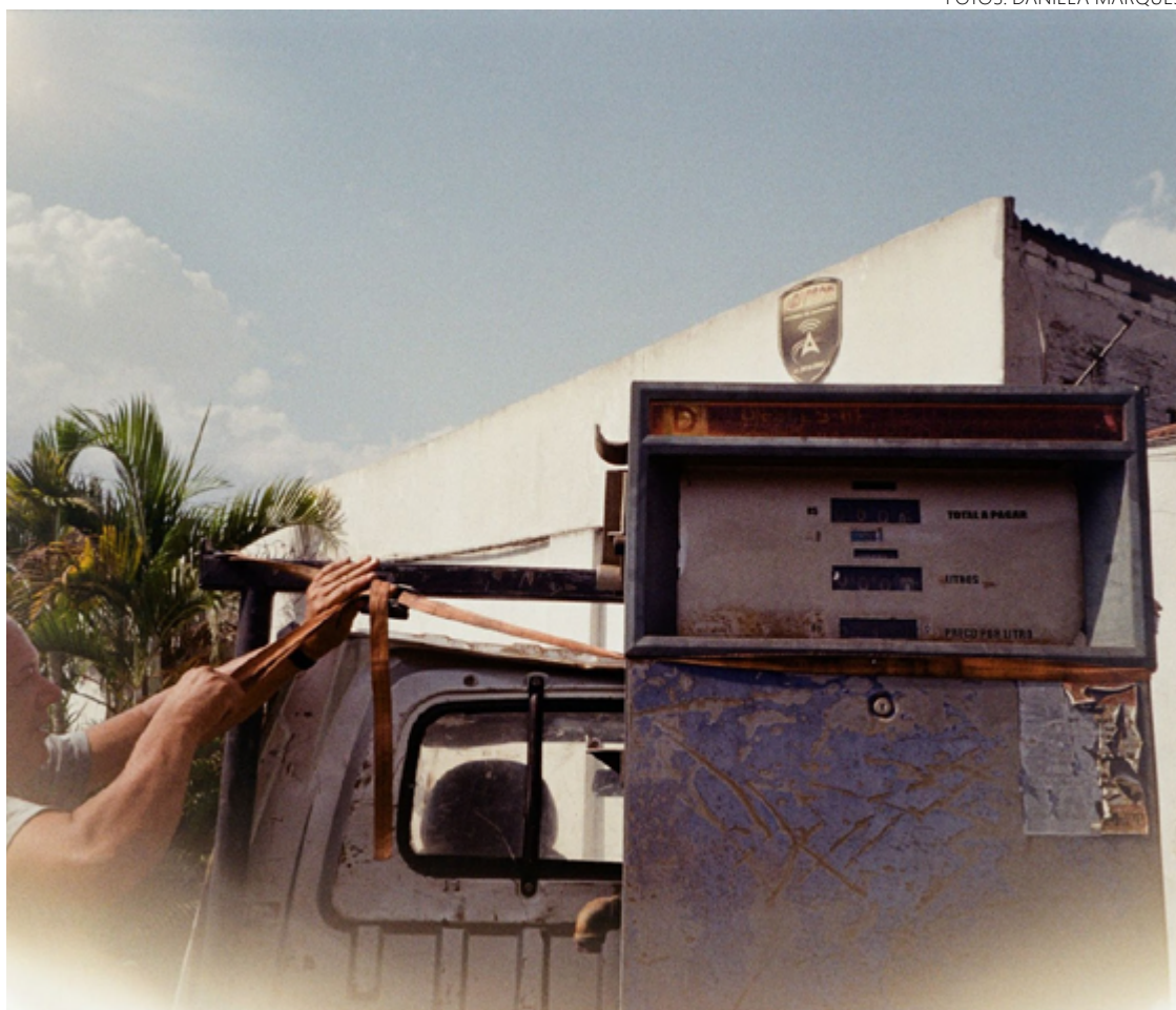
"Contemplador": bomba de combustível foi modificada em parceria inédita