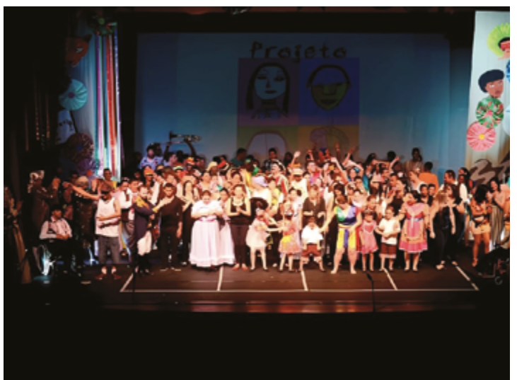
Momento Cultural promove inclusão por meio da arte, destaca o potencial artístico de alunos com deficiência intelectual e múltipla