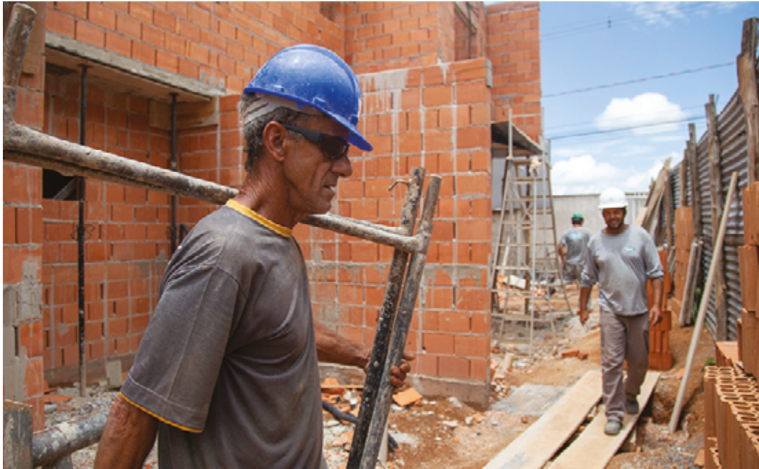
Segundo advogado especialista, tudo vai depender se haverá ou não alteração do salário sob o novo sistema