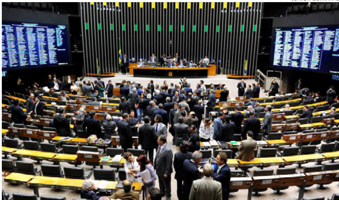
Decisão do ministro Flávio Dino desagradou Congresso sobre emendas parlamentares

Se o dinheiro bloqueado pelo Supremo não for pago, há a ameaça do Congresso de barrar o pacote anunciado pelo Ministério da Fazenda. Nesta terça, havia na Câmara dos Deputados expectativa de que a urgência de dois projetos do