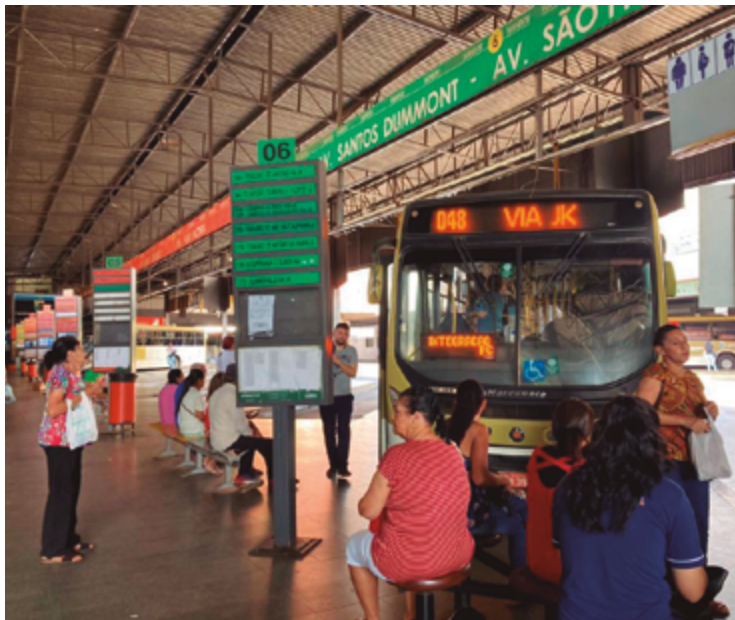
Sindicato ressalta que qualquer decisão sobre a negociação será levada à apreciação dos trabalhadores em assembleia geral