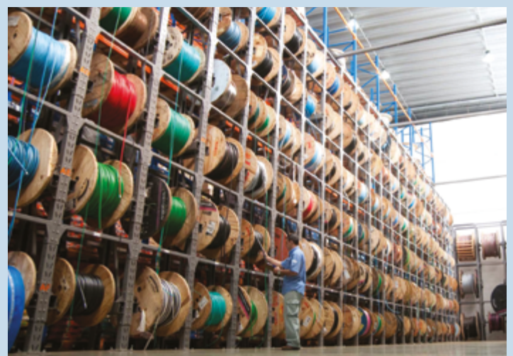
Números são da Junta Comercial do Estado de Goiás (Juceg); empresas MEI não estão enquadradas neste contexto

As cinco atividades com mais registros em novembro de 2024 foram serviços combinados de escritório e apoio administrativo; atividades de consultoria em gestão empresarial, exceto consultoria técnica específica; promoção de vendas; construção de edifícios; e serviços de engenharia. O penúltimo mês do ano registrou 2994 novos CNPJs. (Com informações Juceg)