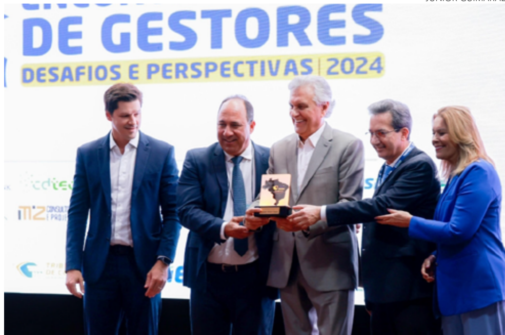
Ronaldo Caiado durante Encontro Anual de Gestores: prêmio Destaque Municipalista 2024

Caiado destacou a importância da parceria entre o governo estadual e as prefeituras. "Não existe sucesso de um governo sem o sucesso dos prefeitos e prefeitas. Não tem esse descasamento", afirmou.