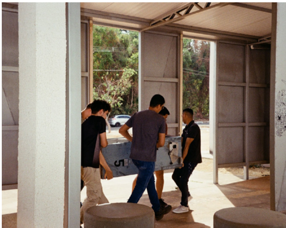
Artista afirma que obra propõe diálogo com a noção de desejo a ser preenchido

versais para um contexto local em expansão. Também comenta sobre a diversidade de elementos na mostra.