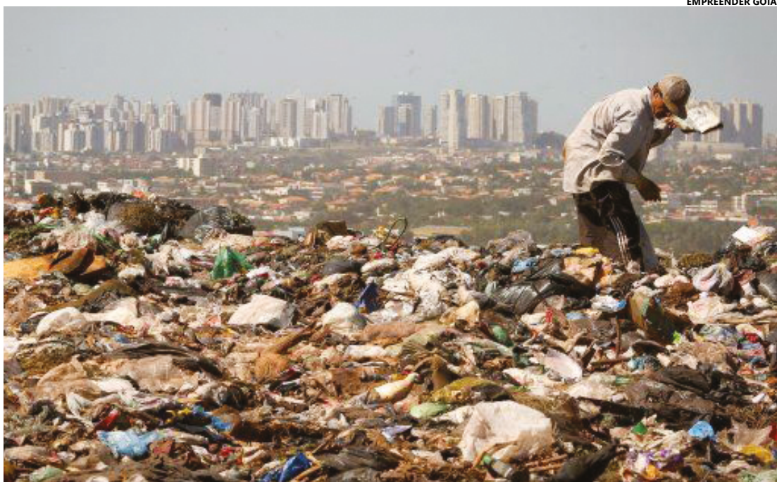
1,3% da população está abaixo da linha de pobreza, definida em R$ 210 de renda domiciliar per capita

"O custo da dívida será reduzido, passando a ser corrigido pelo IPCA mais 4%, com possibilidade de redução para IPCA mais 2%, mediante um aporte inicial de 20% do valor da dívida", concluiu. (Com informações Secretaria da Economia)