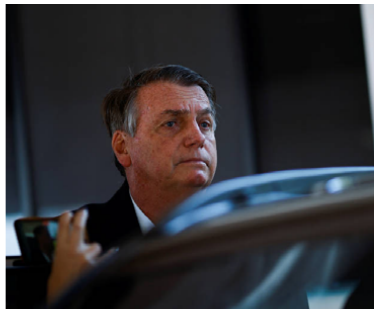
Jair Bolsonaro: elogios à conduta de Javier Milei na Argentina

Na CPAC, Bolsonaro falou também de sua situação jurídica. "Não houve golpe, nós apenas conversamos sobre hipóteses constitucionais, mas Lula da Silva quer dizer que eu tentei dar um golpe de Estado. Temos um juiz na Suprema Corte que não segue o devido processo legal. Ele se faz de vítima. E por isso não tenho meu passaporte.