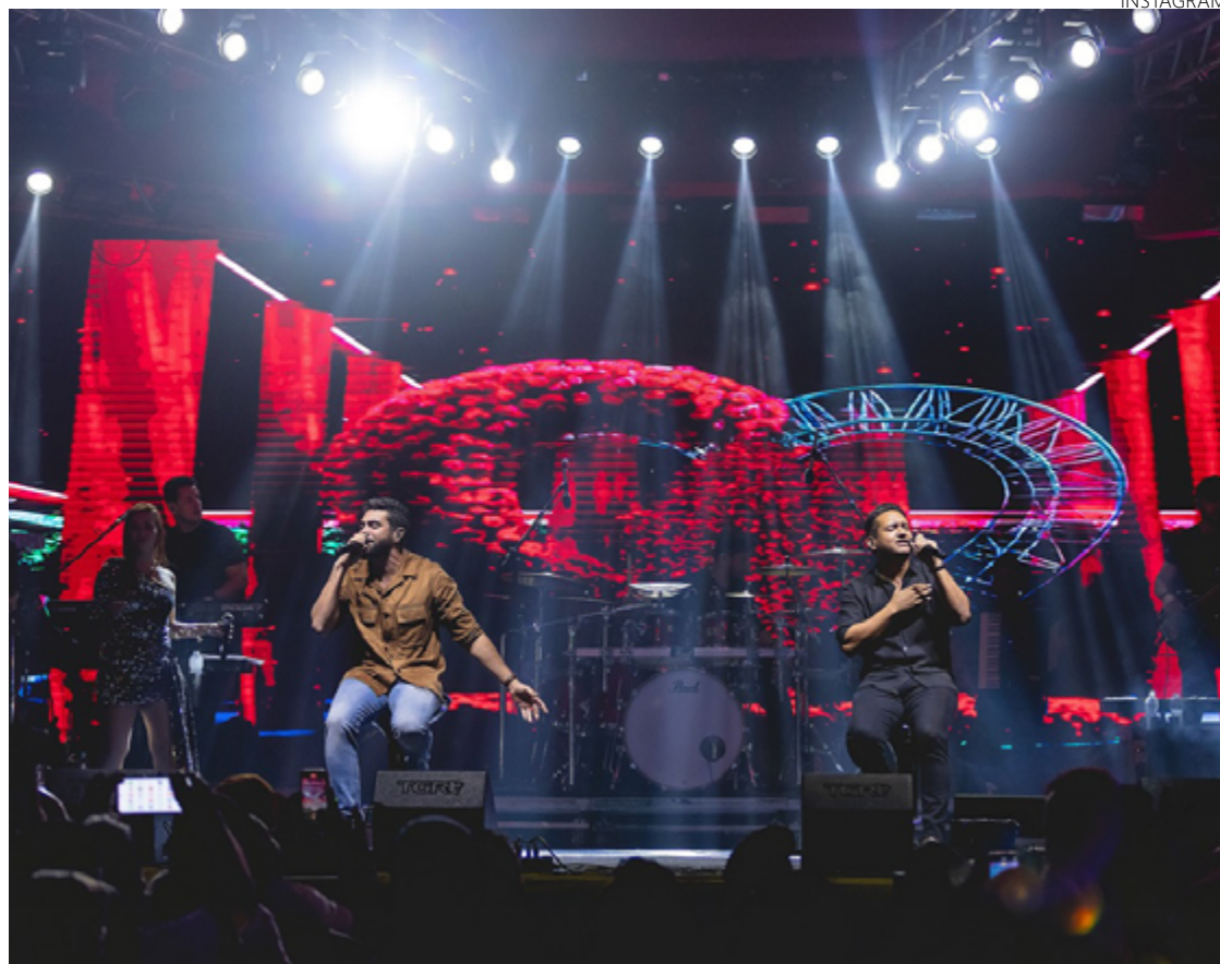
Henrique e Juliano durante show na histórica Ouro Preto (MG): artistas foram os mais ouvidos em ranking

A sétima e a décima posição ficaram com os hits "Mtg Quero Te Encontrar" e "Aquariano Nato", respectivamente. Entre os artistas mais ouvidos