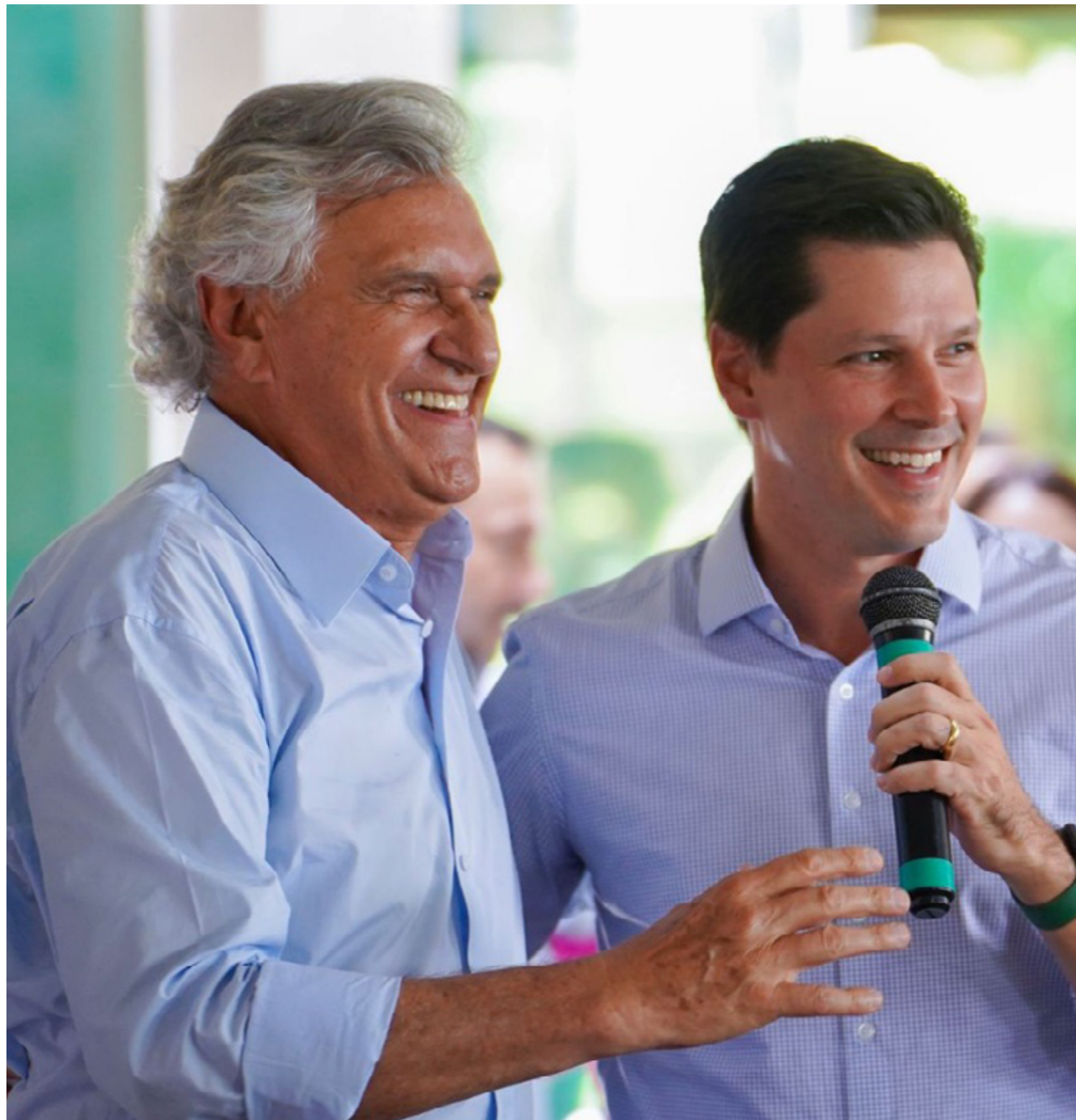
Ronaldo Caiado e Daniel Vilela: vice vai disputar as eleições ao Palácio das Esmeraldas

Daniel. Ele está ligado em tudo, irá trabalhar ainda mais e tenho certeza de que ele será reeleito ao final de 2026, para dar sequência aos avanços que estamos promovendo no estado", disse Caiado. Ele ressaltou que o projeto de seu governo, diferente daqueles que tentaram pessoalizar a administração, foi feito para garantir que Goiás continue a crescer e a melhorar a vida dos goianos,