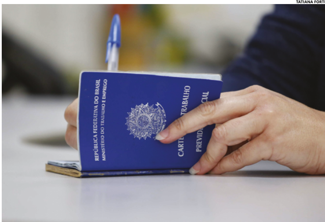
O número de pessoas desocupadas caiu de 303 mil, em 2022, para 240 mil, uma redução de 20,9%

Apesar dos avanços no mercado de trabalho, a desigualdade de rendimentos permanece um desafio. O rendimento médio real do trabalho principal em Goiás foi de R$ 2.891, alinhado à média nacional. Contudo, as diferenças entre gênero e raça persistem.