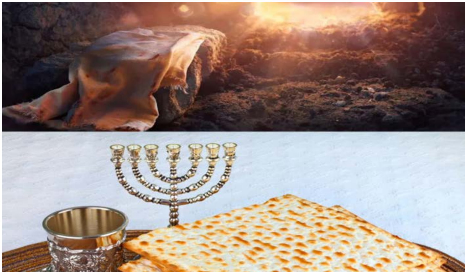
Celebrações da Páscoa Judaica e da Páscoa Cristã tem pontos de convergência e distintos

Tanto judeus quanto cristãos celebram suas Páscoas em datas que reforçam raízes históricas comuns e as diferenças que se consolidaram ao longo dos séculos