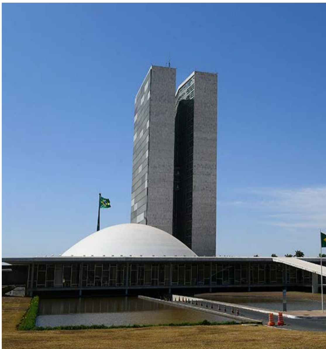
Congresso Nacional, em Brasília, onde a proposta do Governo Federal será avaliada à votação

O Poder Executivo mantém a meta de superávit equivalente a 0,25% do Produto Interno Bruto (PIB) para 2026, ou R$ 34,3