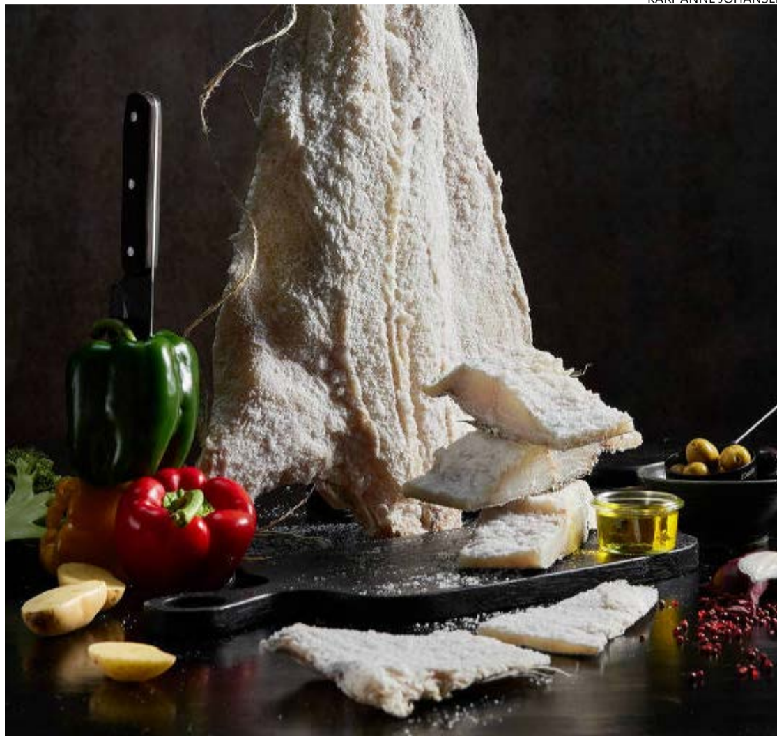
Processo concluído: ideal é que a carne esteja praticamente sem sal

É recomendável usar pedras de gelo e colocar o recipiente na geladeira, para que o peixe fique bem conservado. Um segredo do dessalgue é a baixa temperatura, que acelera o processo. A proporção indicada é de duas partes de água para cada parte do