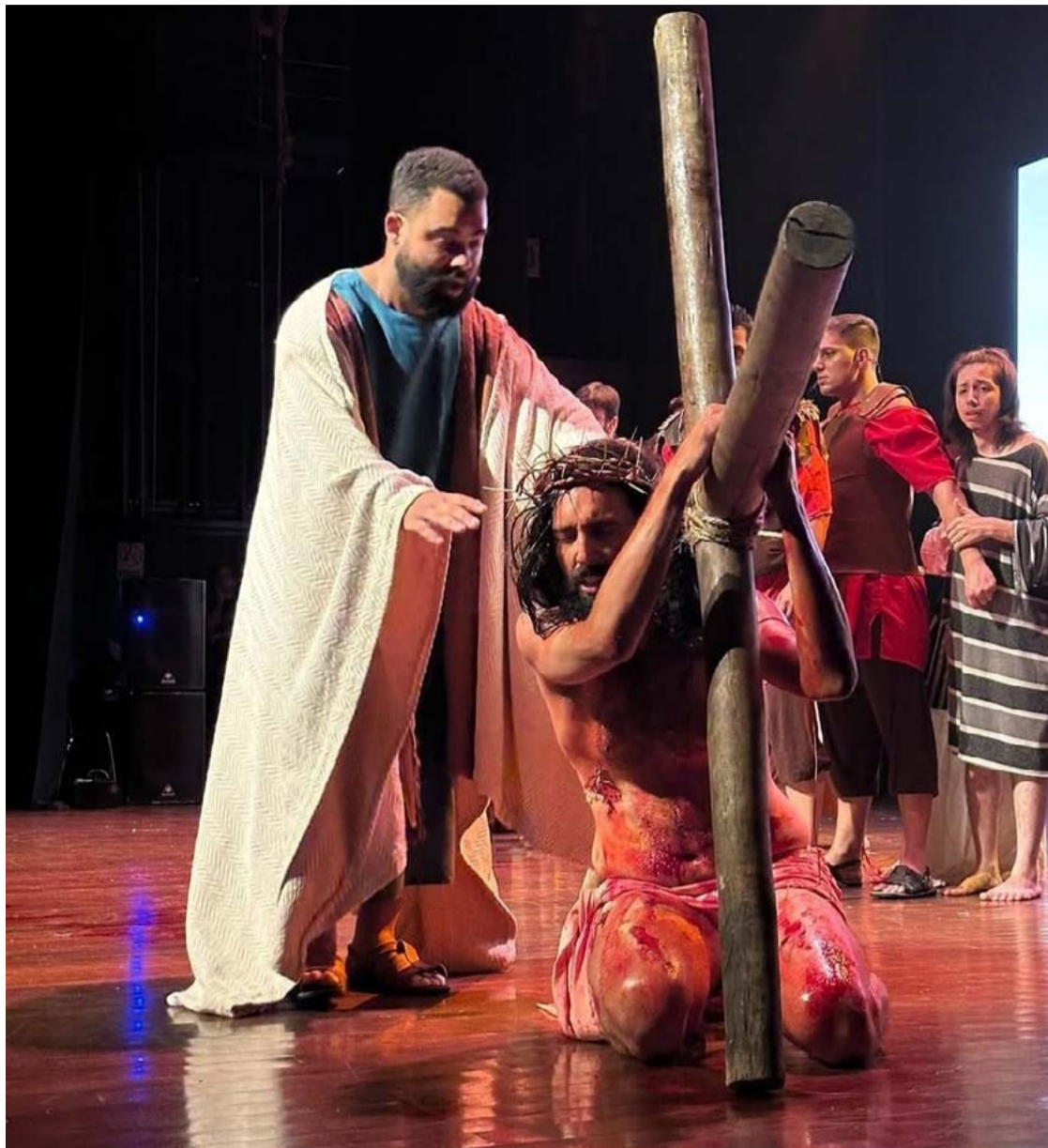
Na última terça-feira, 15, Colégio Santo Agostinho montou a encenação "A paixão, morte e Ressurreição de Cristo": imagem está nas redes

Ontem, a Cidade de Goiás teve procissões pelas ruas, além de encenações. Em Goiânia, na última terça-feira, 15, o tradicional Colégio Santo Agostinho - uma das três escolas mais antigas da Capital - montou a emocionante encenação "A paixão, morte e Ressurreição de Cristo". A Cia Arte e Graça do Santuário Basílica Sagrada Família, no teatro Madre Esperança Garrido, converteu em arte a emoção