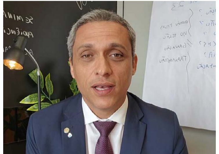
Dono da segunda maior votação em 2022, Gayer corre risco de ter seu mandato cassado no STF

STF quer evitar o ano eleitoral para julgar processo envolvendo o parlamentar e deve decidir até dezembro