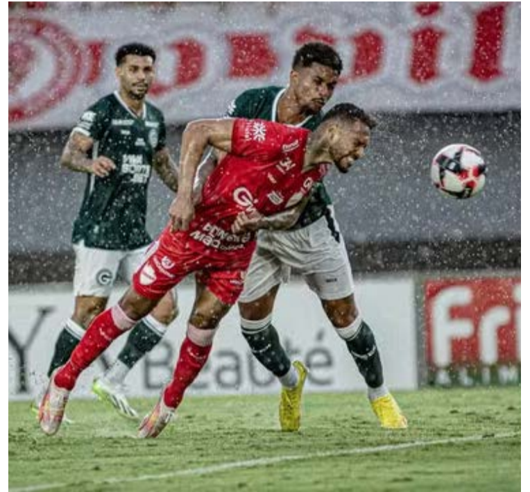
Vila vem de oito confrontos sem perder para o Goiás