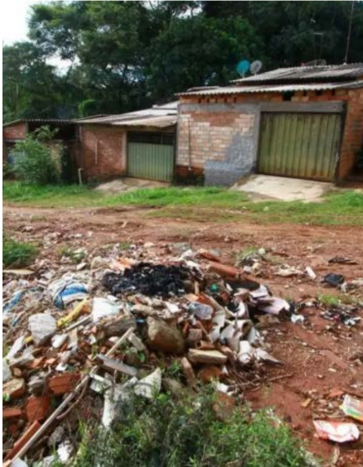
Além das áreas de risco, a capital possui 136 pontos sujeitos a alagamentos

O número de famílias residentes nessas regiões já alcançava cerca de 2 mil no último levantamento, feito em 2022. A nova atualização tende a ampliar esse contingente, diante da inclusão de novos pontos classificados como