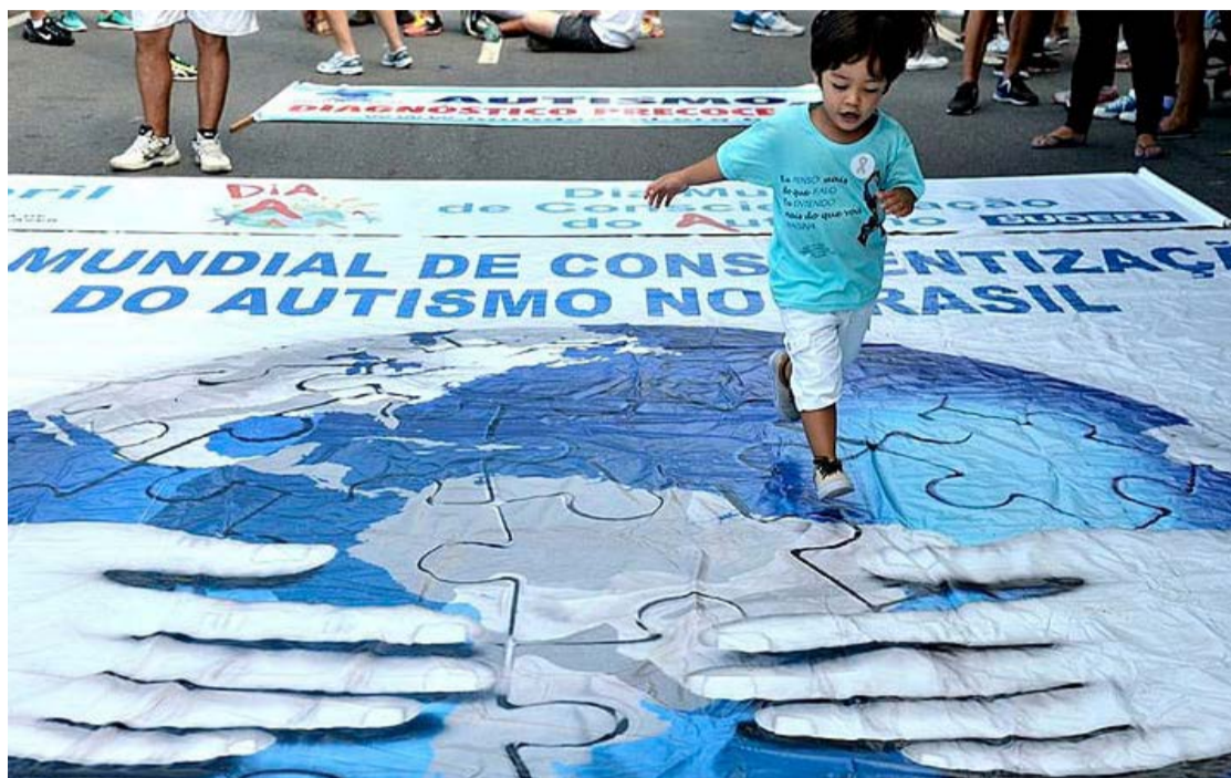
Especialistas afirmam que desgaste emocional das mães está ligado a um processo fisiológico e estresse crônico

Sob o olhar da neurociência, os efeitos são ainda mais profundos. A exposição prolongada ao estresse afeta diretamente o funcionamento do corpo e do cérebro, elevando os níveis de cortisol e provocando inflamação sistêmica, além de comprometer a capacidade de adaptação ao longo do tempo. “Esse processo indica níveis elevados de cortisol e, com o tempo, o eixo de comando do es-