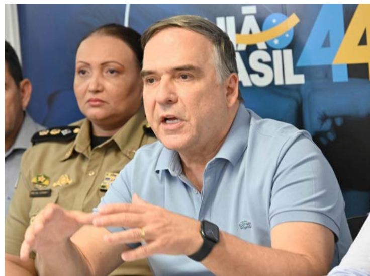
Prefeito Sandro Mabel quer mais recursos para promover investimentos em obras

Projeto autoriza o remanejamento de até 30% Do orçamento por meio de créditos suplementares