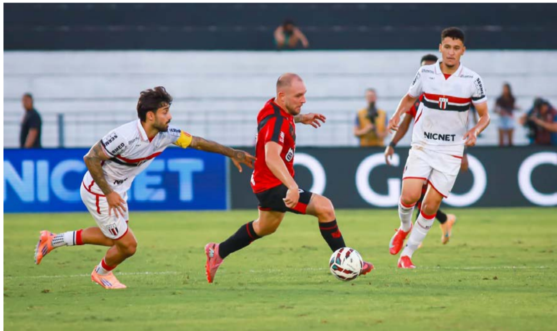
Time da casa saiu na frente, mas o Dragão reagiu ainda no primeiro tempo