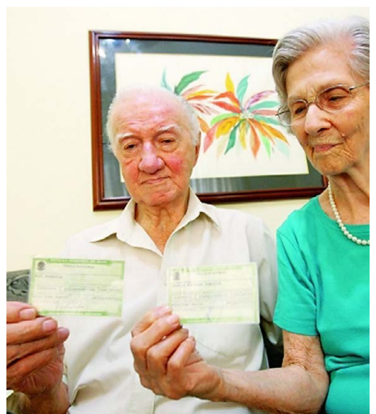
Eleitores idosos prontos para votar no pleito de outubro

No Norte, por outro lado, o perfil segue mais jovem, com média de 16,5% de eleitores acima dos 60 anos. O avanço desse grupo também se reflete nas candidaturas: em 2024, mais de 70 mil pessoas nessa faixa etária disputaram cargos eletivos, evidenciando o aumento da participação política dos idosos no país.