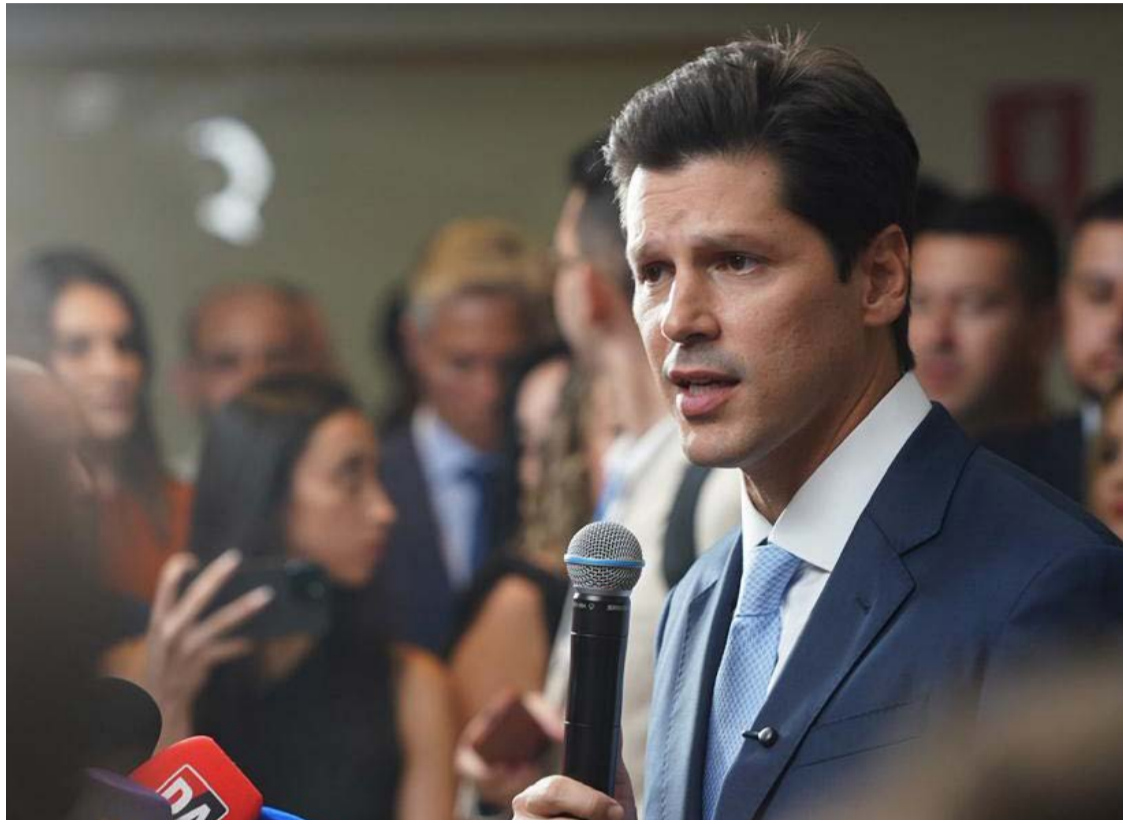
Daniel Vilela destacou a importância do diesel para a economia goiana durante a assinatura

Daniel Vilela já havia informado, no dia de sua posse, em 31 de março, que Goiás aderiria ao regime emergencial. "Vamos dar a nossa contribuição para que a população não seja ainda mais prejudicada com novos aumentos. Qualquer tipo de reajuste no diesel, combustível essencial para o principal modal de transporte do país, que é o rodoviário,