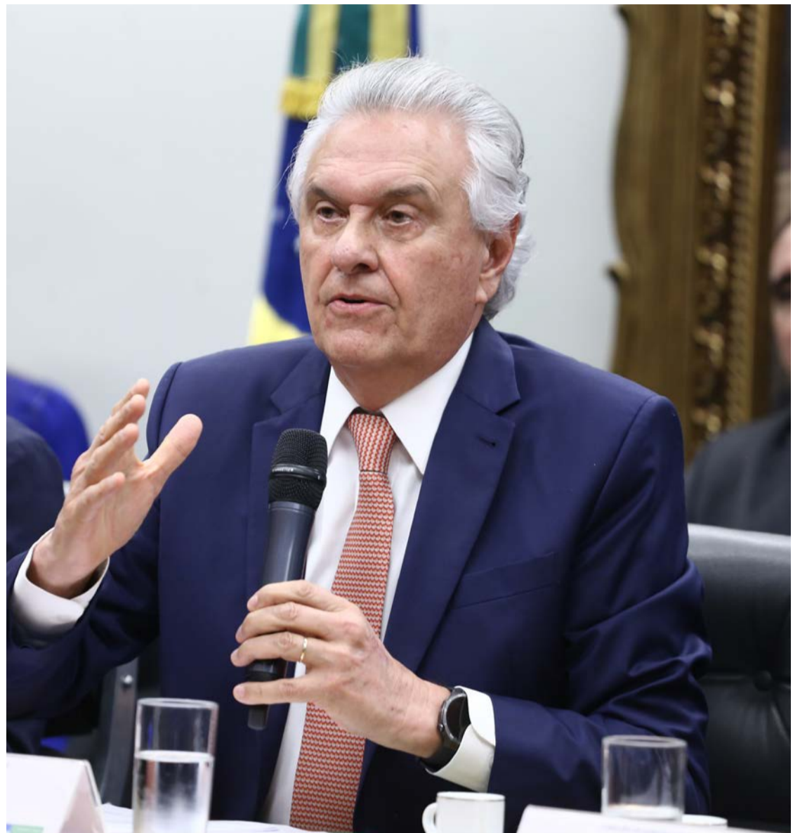
Ex-governador Ronaldo Caiado é pré-candidato à Presidência da República do Brasil

Nesse contexto, a performance do goiano ganha densidade política e passa a ser observada com maior atenção pelos demais atores da corrida presidencial. A leitura política que emerge dessas pesquisas é a de que há espaço para a construção de uma candidatura que combine perfil