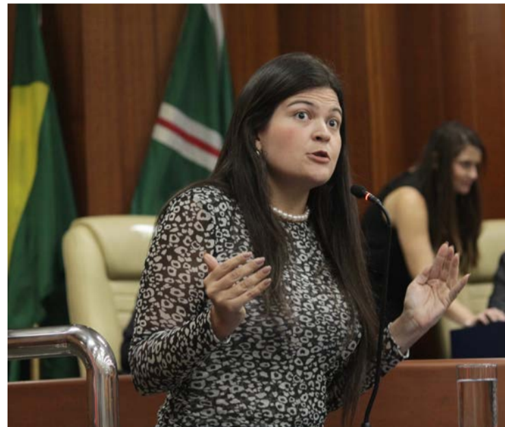
Aava Santiago pode ser o nome para disputar o governo pelo campo da esquerda

Nos últimos meses, vários nomes ligados ao PT foram ventilados, mas nenhum ganhou tração