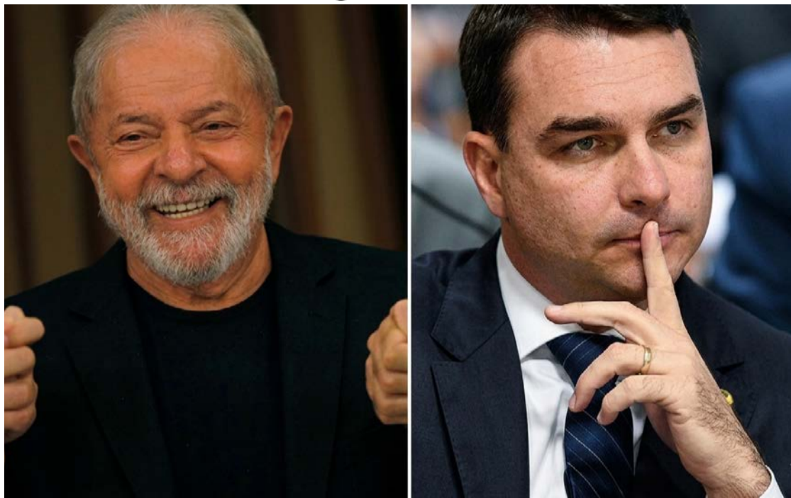
Lula apoia o PL da Misoginia, já aprovado no Senado, enquanto Flávio ainda tem dúvidas

Em nota, o PT classificou a proposta como um avanço no combate à violência de gênero e mencionou o Pacto Nacional Bra-