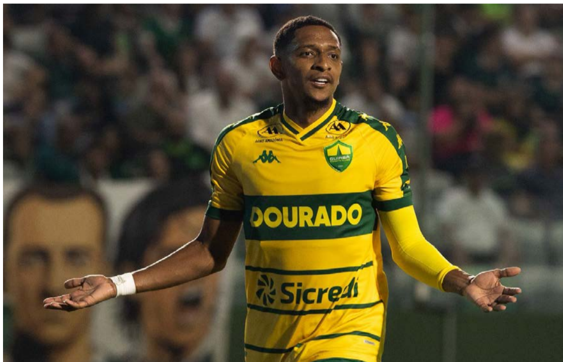
Goiás e Cuiabá se enfrentaram na noite deste domingo (19), no Estádio Hailé Pinheiro (Serrinha), em Goiânia

Com o resultado, o Goiás caiu para a 11ª colocação com sete pontos. O Cuiabá subiu para a 15ª posição com seis pontos, deixando a zona de rebaixamento. O Atlético-GO permanece no Z-4, com quatro pontos, na 17ª posição.