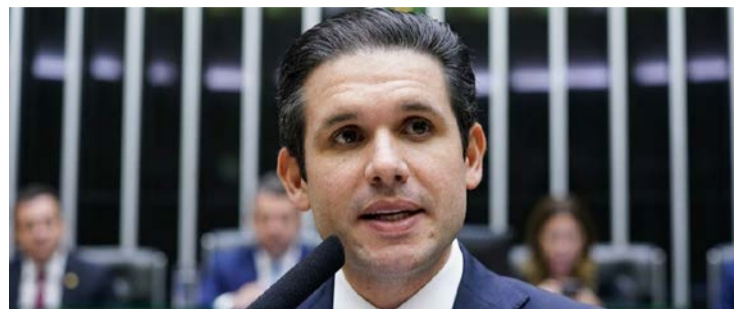
Deputado Hugo Motta, presidente da Câmara, quer debate sobre violência

Grupo de trabalho vai discutir projeto de lei que criminaliza misoginia: punições ainda mais severas