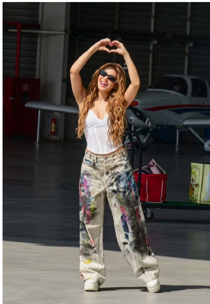
Shakira fará show único em Copacabana, no Rio

Apresentação da musa pop deve atrair grande público à orla de Copacabana: tradição de shows