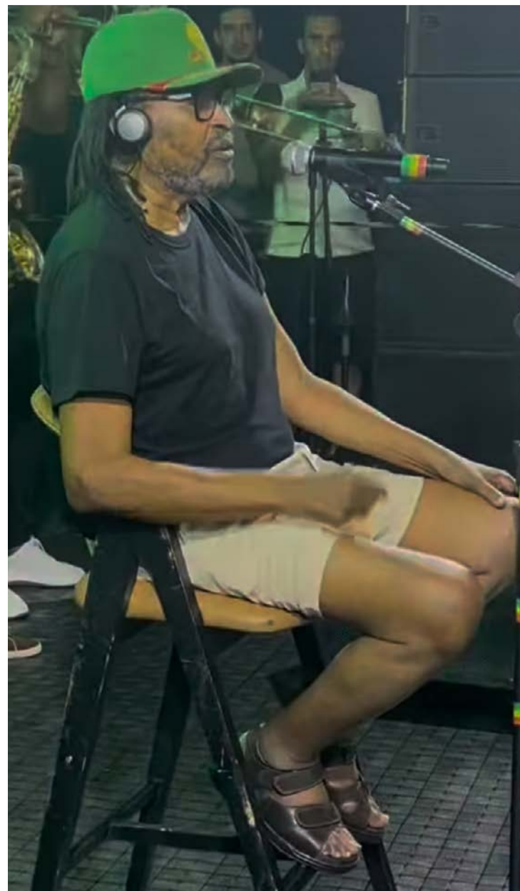
Natural de Cachoeira, no recôncavo baiano, Edson Gomes tem posicionamentos polêmicos

Apesar das controvérsias, a dimensão artística do cantor segue reconhecida. Nos últimos anos, passou por festivais como o Lollapalooza e o Circo Voador.