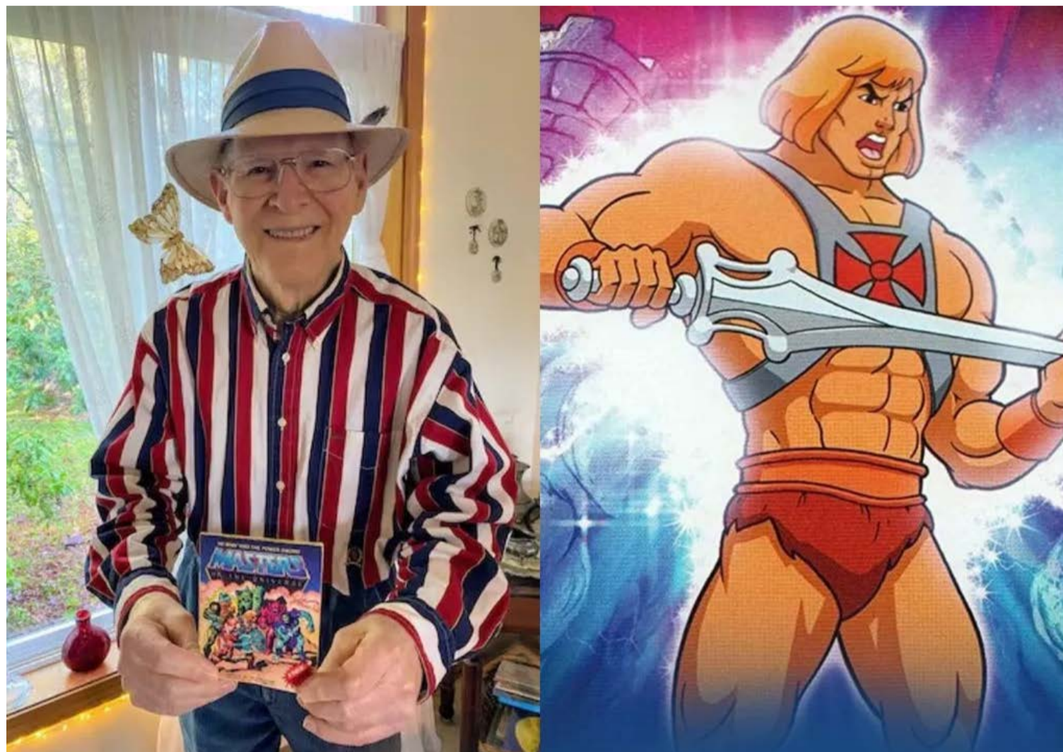
Sweet morreu em um centro de cuidados nos Estados Unidos, onde estava internado após o agravamento de um quadro de demência

No início dos anos 1980 Roger Sweet liderou o desenvolvimento do personagem He-Man, figura central da linha "Masters of the Universe", que se tornou um fenômeno global