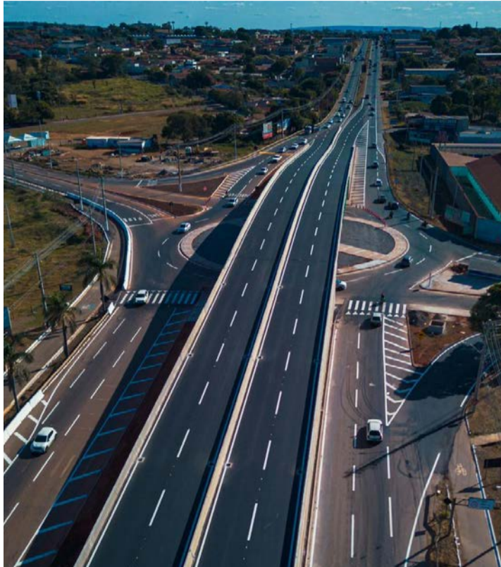
Além do viaduto, há previsão de obras de recuperação em trechos da rodovia GO-070, que liga Goiânia a Goianira

zam diariamente o trecho entre Goiânia e Trindade enfrentam congestionamentos frequentes, principalmente em horários de pico e em períodos de maior movimento, como durante a Romaria do Divino Pai Eterno. Apesar da expectativa de melhorias no trânsito, ainda não há data confirmada para o