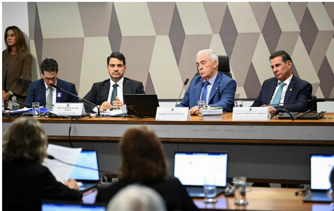
Jorge Messias teve o seu nome rejeitado para indicação ao STF

A derrubada de Messias foi patrocinada pelo presidente do Senado, Davi Alcolumbre (União Brasil-AP). Ele defendia a