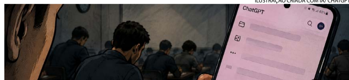
ILUSTRAÇÃO CRIADA COM IA/ CHATGPT