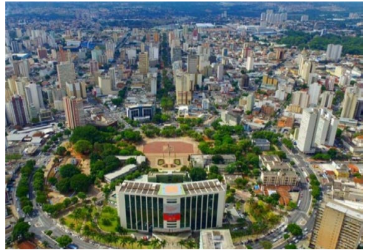
Goiânia bem avaliada: Índice de Progresso Social 2024 mede segurança, saúde, educação e oportunidades