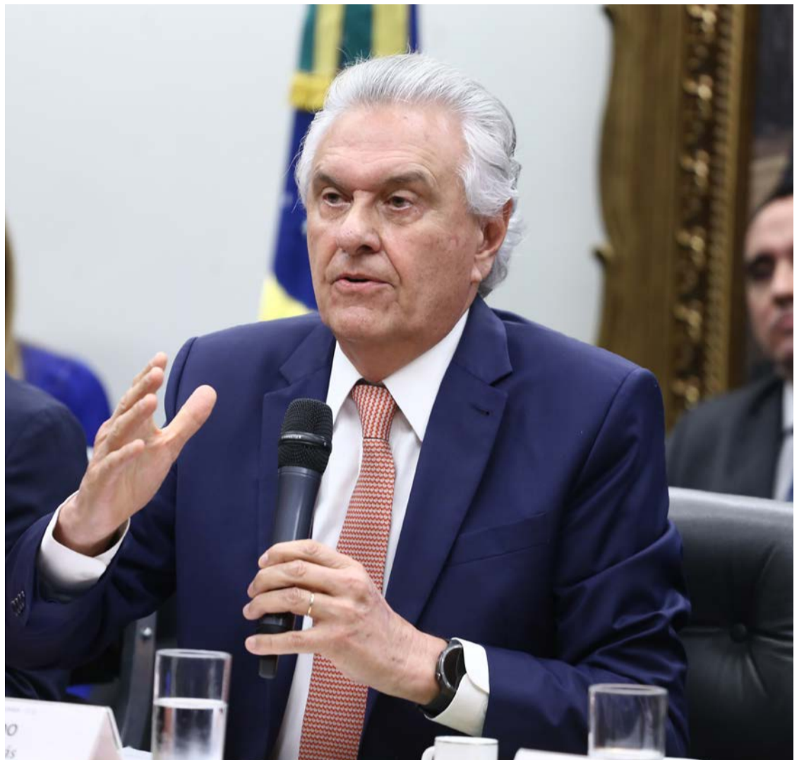
Ronaldo Caiado não alivia para Flávio Bolsonaro e quer explicações sobre Master

Embora tenha cobrado esclarecimentos do senador do PL, Caiado evitou ampliar o tom de confronto e afirmou que cabe a cada agente político responder por seus próprios atos. "Cada um deve explicar suas relações e assumir a responsabilidade pelos próprios problemas. Não cabe a mim ficar julgando