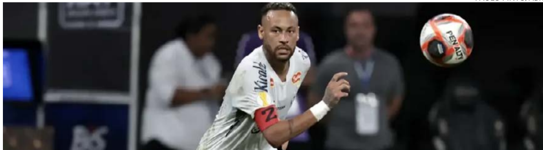
Quadro clínico do jogador exige período de recuperação