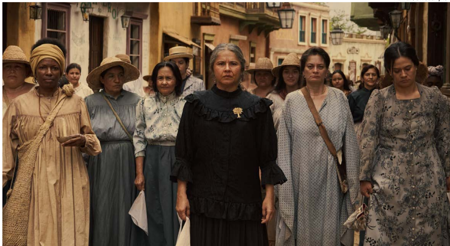
Sete primeiros episódios chegam à plataforma em 5 de agosto, enquanto o capítulo final será lançado no dia 26