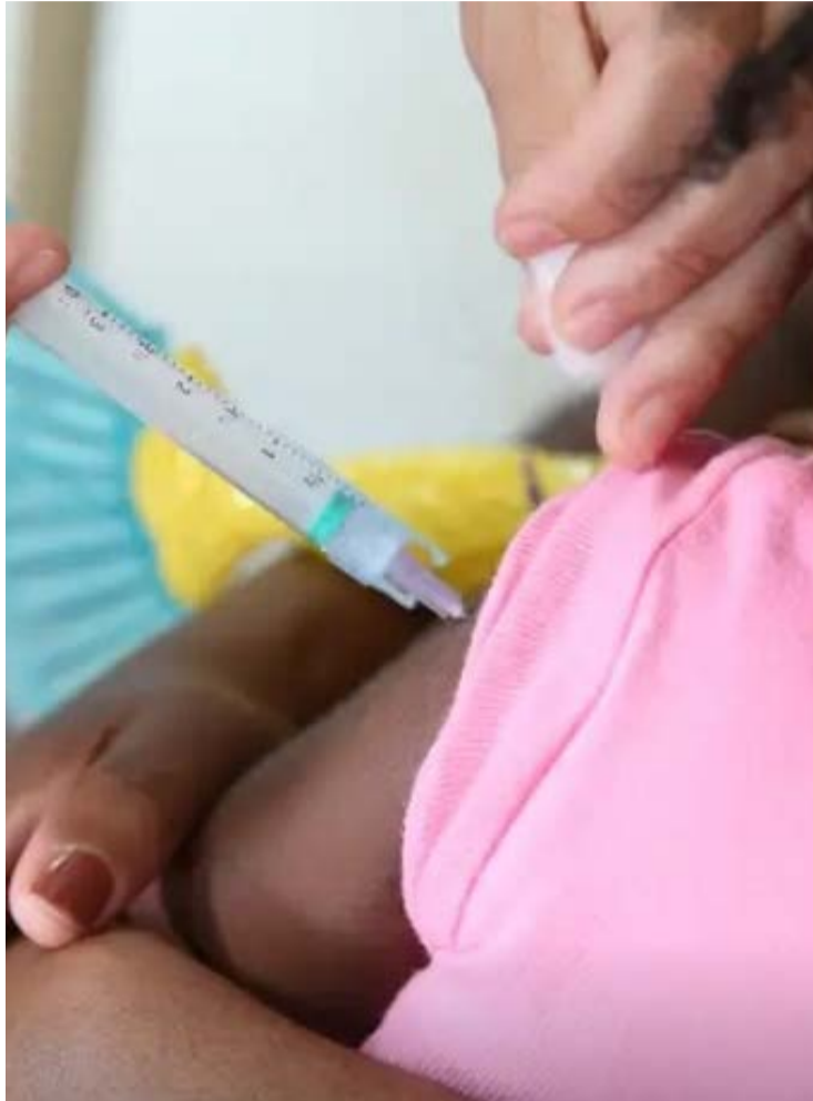
Campanha de vacinação contra influenza em Goiás tem baixa adesão entre crianças

A SES/GO reforça o pedido para que os municípios se mobilizem para a realização do 2º Dia D de Vacinação contra a Influenza neste sábado (23/05) e pede às famílias que levem as crianças e os pertencentes aos gru-