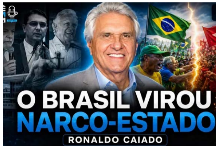
Caiado na arte de divulgação da entrevista ao "Café com Ferri"

Maiores multinacionais do governo são PCC e Comando Vermelho, denuncia ex-governador