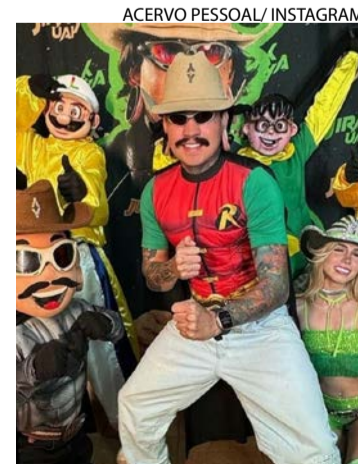
DJ ganhou projeção ao aproximar música eletrônica e rodeio

Liderada pelo vocalista Luiz Carlos, o Raça Negra se consolidou nos anos 1990 ao aproximar o samba de sonoridades pop e românticas, emplacando sucessos como "Cheia de Manias", "É Tarde Demais" e "Cigana".