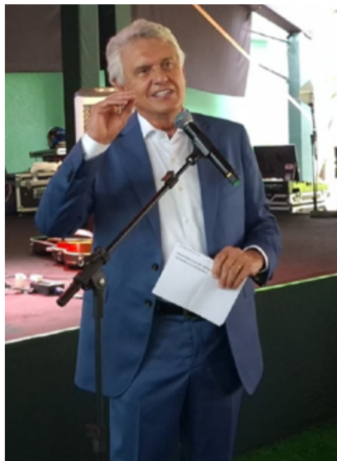
Ronaldo Caiado durante confraternização: "Sou governador aberto ao diálogo, que valoriza sugestões"

Além de imprensa e sua missão, Caiado falou muito sobre goianidade. "Nunca deixei de