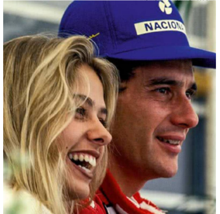
Apresentadora recebeu elogios dos fãs nas redes sociais