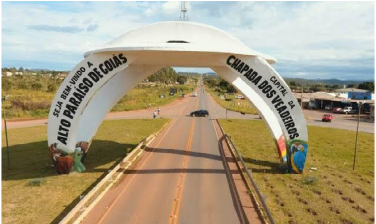
O parlamentar busca o reconhecimento das práticas de bem-estar, turismo espiritual e conexão com a natureza

Na justificativa da iniciativa, o parlamentar aborda a crescente demanda por alternativas de turismo que promovam o bem-estar físico, mental e emocional, que tem colocado Alto Paraíso de Goiás em posição de destaque. A medida tem o intuito de valorizar as contribuições de Alto Paraíso de Goiás em tais áreas, explica o parlamentar em sua motivação. Para Moraes, é necessário "incentivar o turismo sustentá-