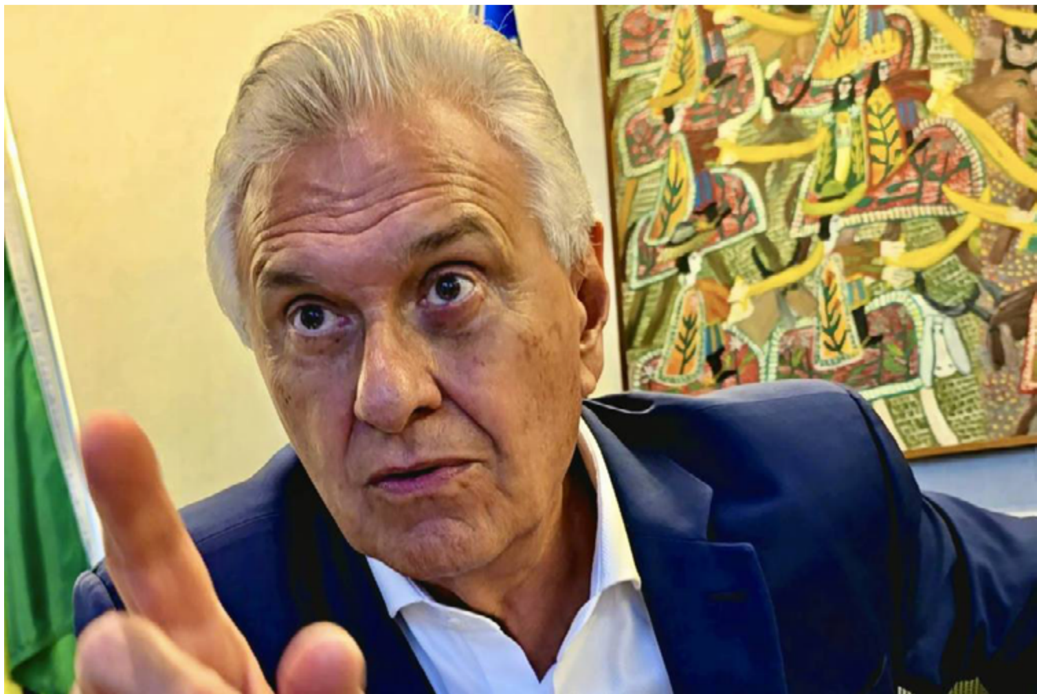
Ronaldo Caiado: protagonismo do governador de Goiás desperta reação do bolsonarismo

No mesmo evento, comentou sobre o indiciamento de Bolsonaro pela Polícia Federal, afirmando que "a vida continua", e criticou a falta de