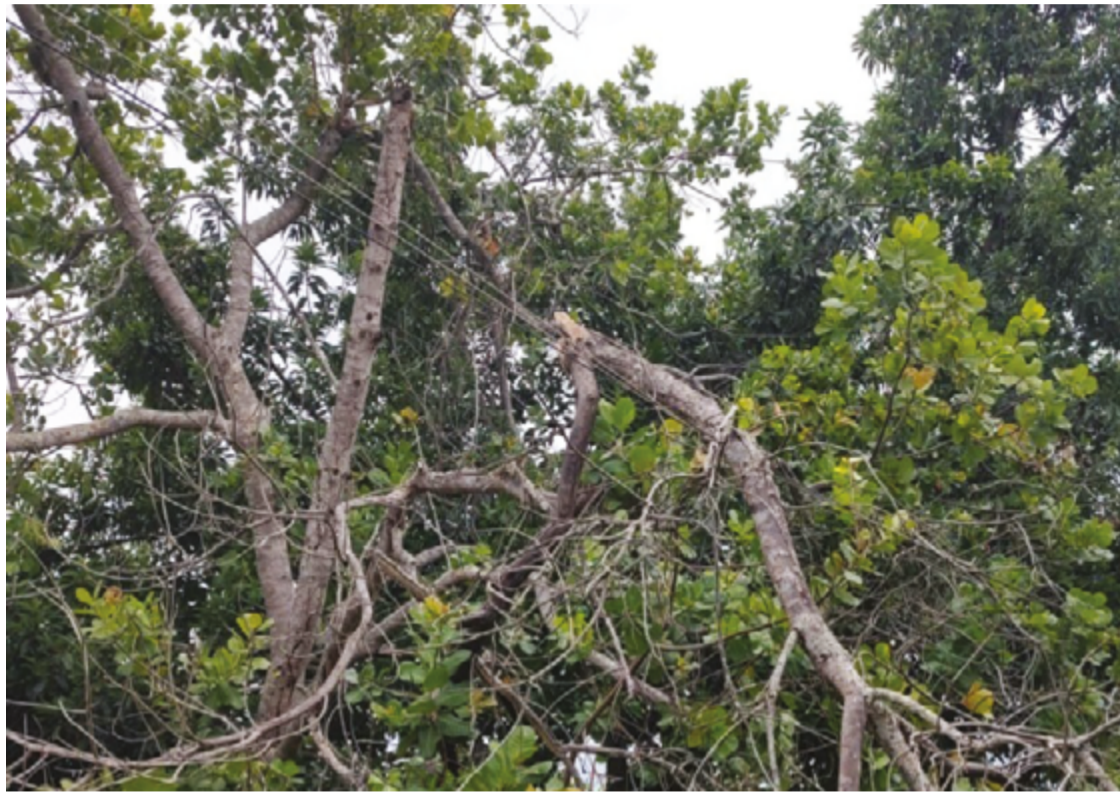
Durante tempestades, a rede elétrica pode sofrer interferências, ocasionando quedas de energia

Mais de 60 cidades do estado, incluindo o centro onde ficam Goiânia e Anápolis, estão sob alerta de tempestades. O aviso foi emitido pelo Instituto Nacional de Meteorologia (INMET) e pelo Centro de Informações Meteorológicas e Hidrológicas de Goiás (Cimehgo). As condições indicam instabilidade em diversas regiões, incluindo Rio Verde, Anápolis, Goiânia, Aparecida de Goiânia,