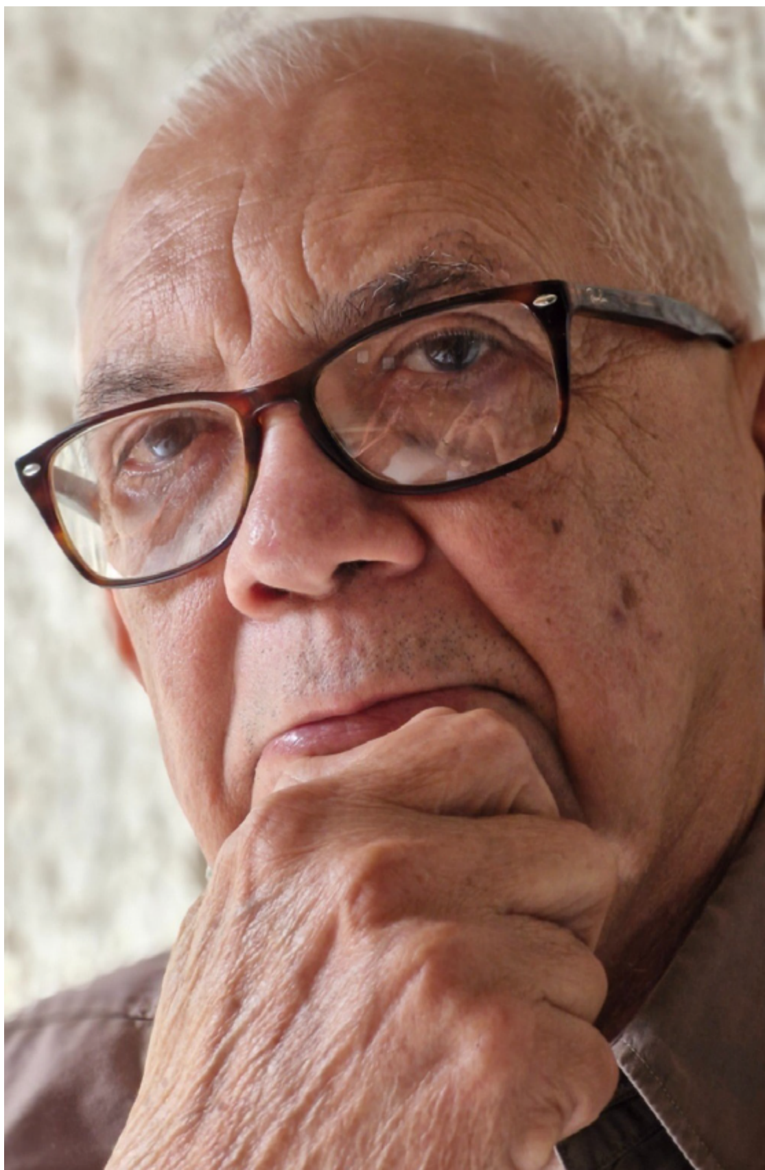
Escritor afirma que não há segredo para praticar escrita poética, mas método

o autor classifica "Pegadas de Gato" como sendo testemunho poético desse período sombrio da vida brasileira. "O mundo parecia ter se tornado um lugar inóspito, imprevisível, aberrante", lembra. "A poesia também é um lugar de memória".