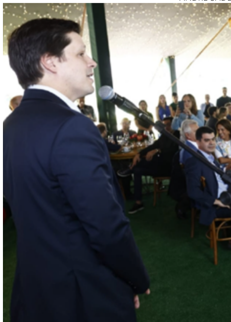
Daniel Vilela, vice governador: "Sucesso de Goiás passa pela contribuição da imprensa"