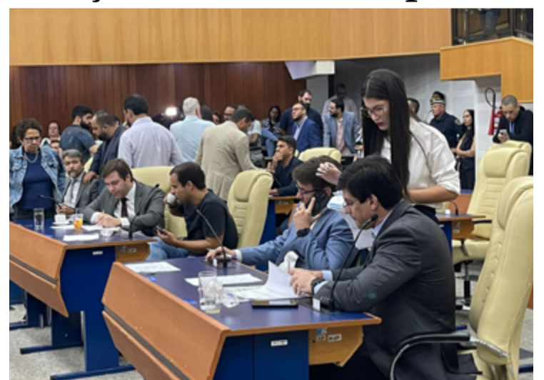
Vereadores aprovam a chamada Taxa do Lixo