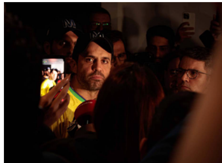
Pablo Marçal: candidato ao Palácio do Planalto