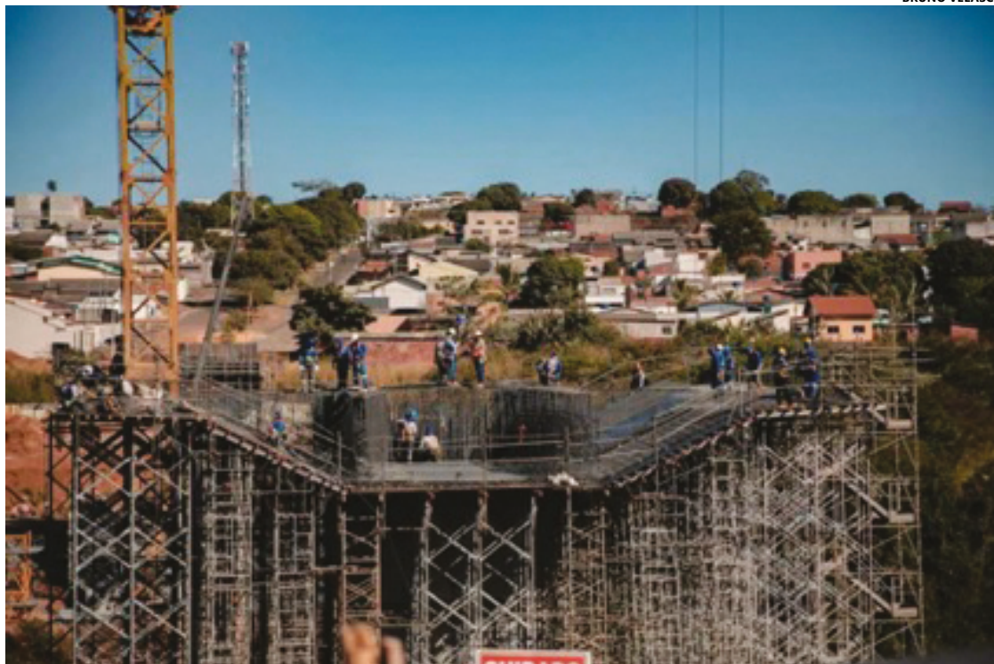
Obra da ponte estaiada, na região Sul da cidade, não deve ser retomada por Corrêa

Corrêa fez duras críticas à obra do Politec, que classificou