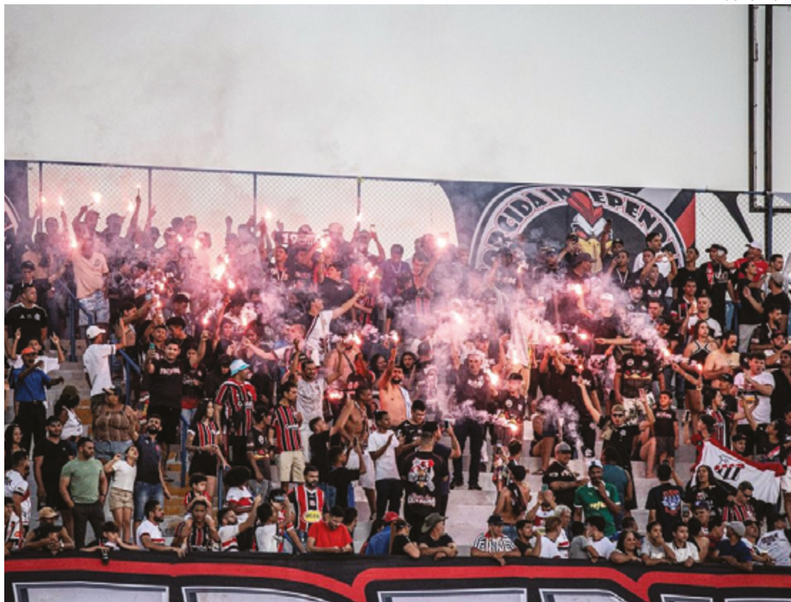
Torcida do Anápolis no Jonas Duarte: tricolores serão os primeiros a usufruir do programa em 2025