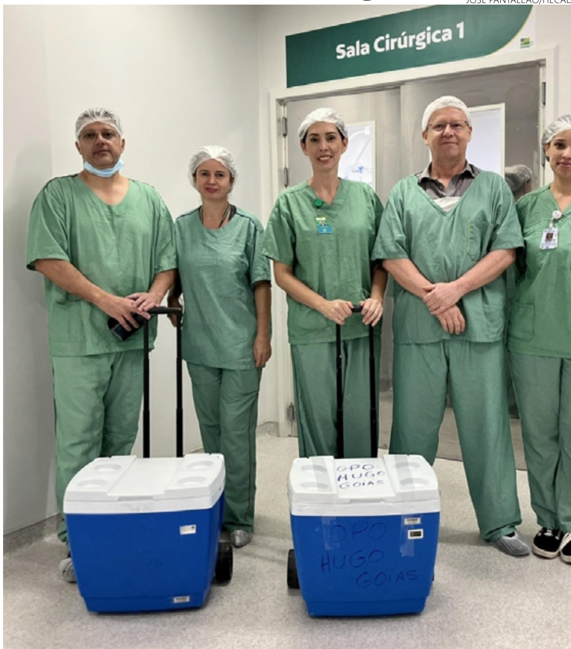
Hecad agora passa a integrar a rede estadual de doação de órgãos para transplantes

A fila pediátrica é ainda mais sensível que a de adultos, pois o nível de aptidão para a doação considera, além da compatibilidade sanguínea, o peso e o tamanho do doador, fatores cruciais para o sucesso dos transplantes infantis. No Brasil, a doação de órgãos só acontece com o consentimento da família. Os pacientes aptos a doar são aqueles com diagnóstico por morte encefálica, vítimas de dano cerebral irreversível.