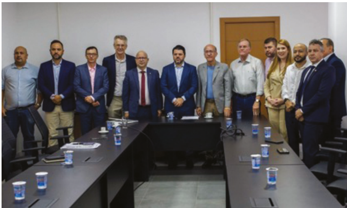
Ministro interino de Relações Institucionais em visita ao Centro Administrativo Adhemar Santillo