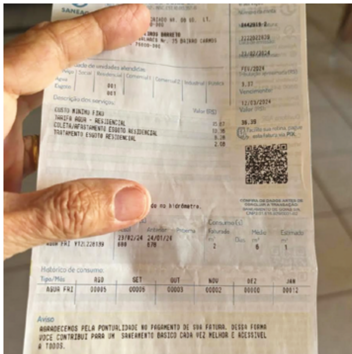
Golpe tem utilizado boleto falso das contas de água da Saneago e já fez diversas vítimas

A ARM continua a receber denúncias através de sua Ouvidoria, no telefone (62) 9 9683-9076, e reforça a importância da colaboração da comunidade para mapear a extensão do problema e buscar soluções para os afetados.