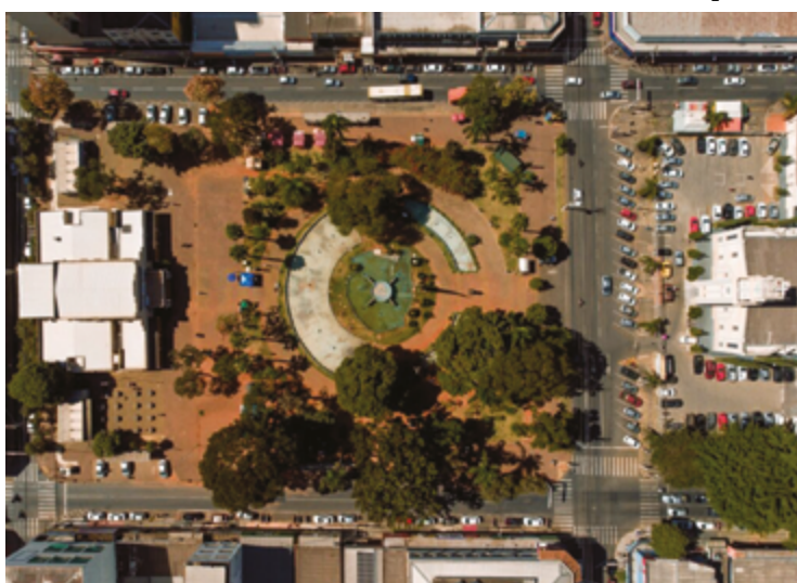
Vista área da Praça Bom Jesus, no Centro de Anápolis, que deve ser alvo de projeto de revitalização.