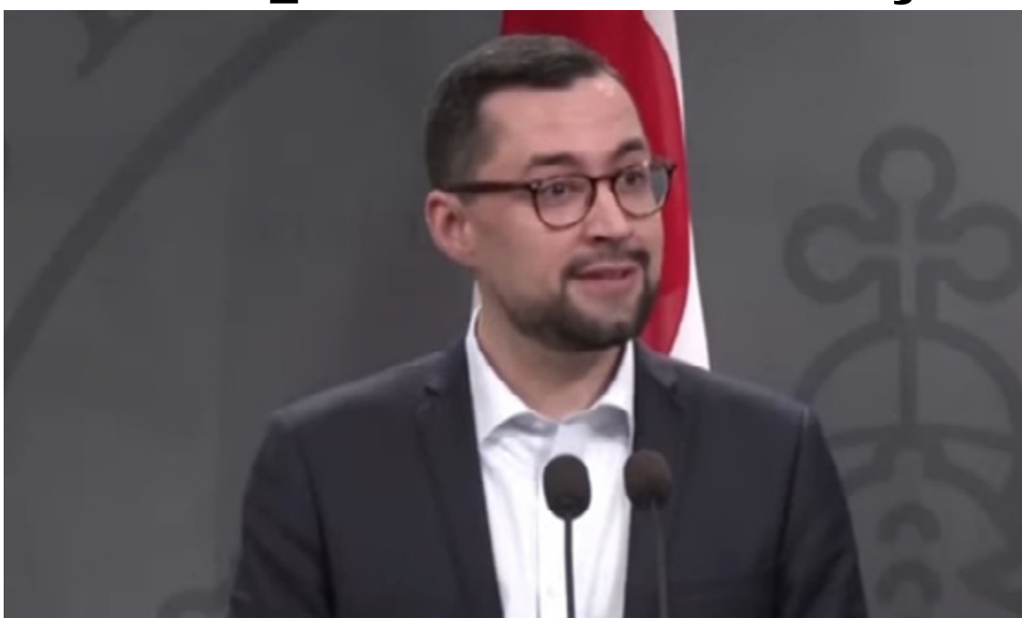
Primeiro-ministro da Groenlândia Múte B. Egede em alerta com ameaças: "Groenlândia pertence aos groenlandeses"

A possibilidade de ações militares ou pressões econômicas por parte dos EUA gerou apreensão na Dinamarca e na Europa, considerando a longa história de domínio dinamarquês sobre a Groenlândia. O primeiro-ministro expressou abertura ao diálogo com Trump sobre questões que unem os dois países, afirmando que "cooperação significa trabalhar para encontrar soluções".