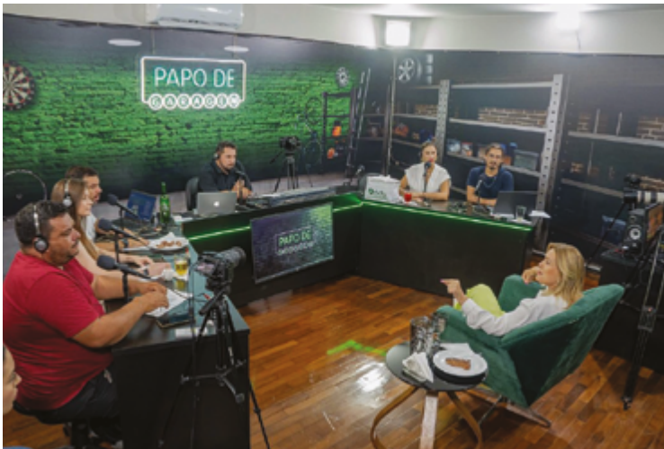
Estúdio do Papo de Garagem: programa passa a ser diário e não é única novidade no cardápio

Produtora também lançará Mata-Mata, com o Craque Evair, e programetes que serão distribuídos em rádios de todo o país