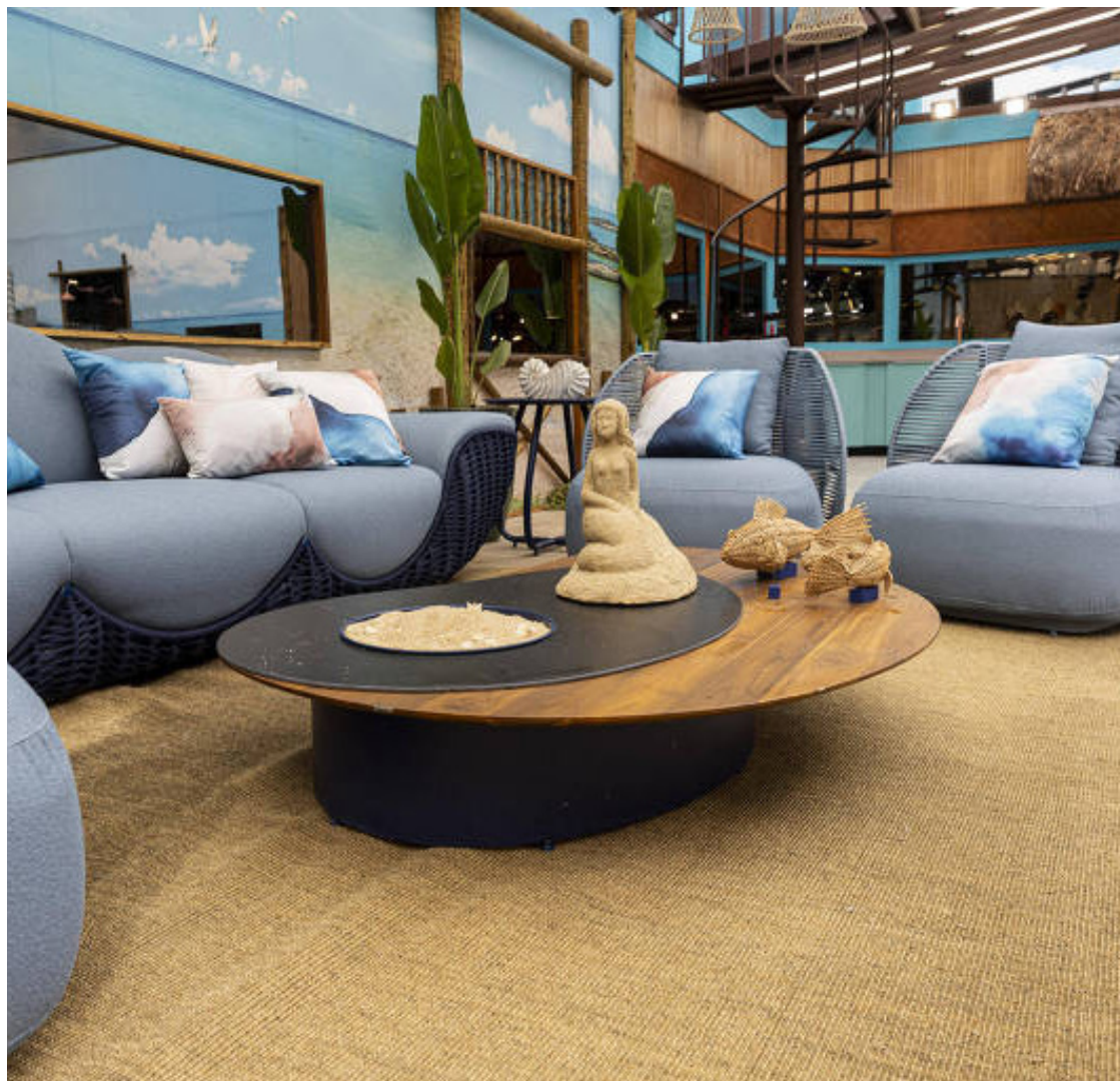
Área externa: casa em que brothers são confinados foi repaginada para vigésima quinta edição do BBB

ao programa diário, que vai ao ar em tempo real, no Globoplay. A emissora não divulga esses dados e, mesmo que o fizesse, seriam dados autodeclarados, sem o lastro de instituição respeitada como o Kantar Ibope.