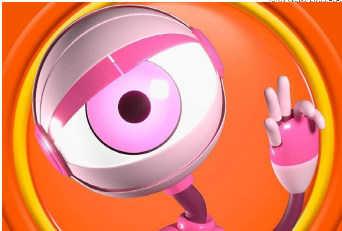
Experimento: programa se tornou laboratório da Globo para a TV 3.0, que deve ser inaugurada em breve

O problema é que ninguém sabe quantas pessoas assistem