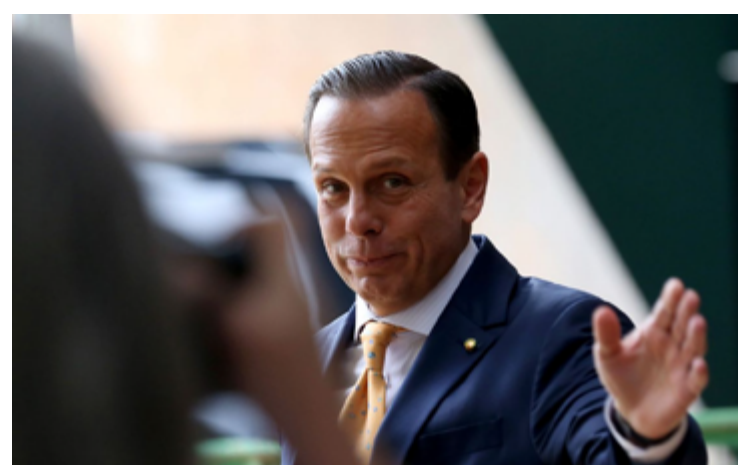
João Doria: liderança tucana esvaziada no cenário político nacional

O resultado após a eleição municipal também foi um dos