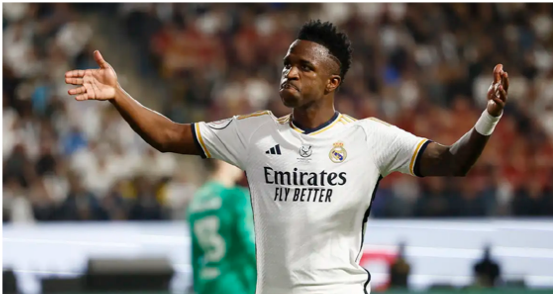
A nomeação do brasileiro foi feita em uma cerimônia em Doha, no Qatar

O brasileiro superou outros dez jogadores nomeados para o prêmio, incluindo o atual Bola de Ouro, Rodri. A votação envolveu torcedores, capitães de seleções, treina-