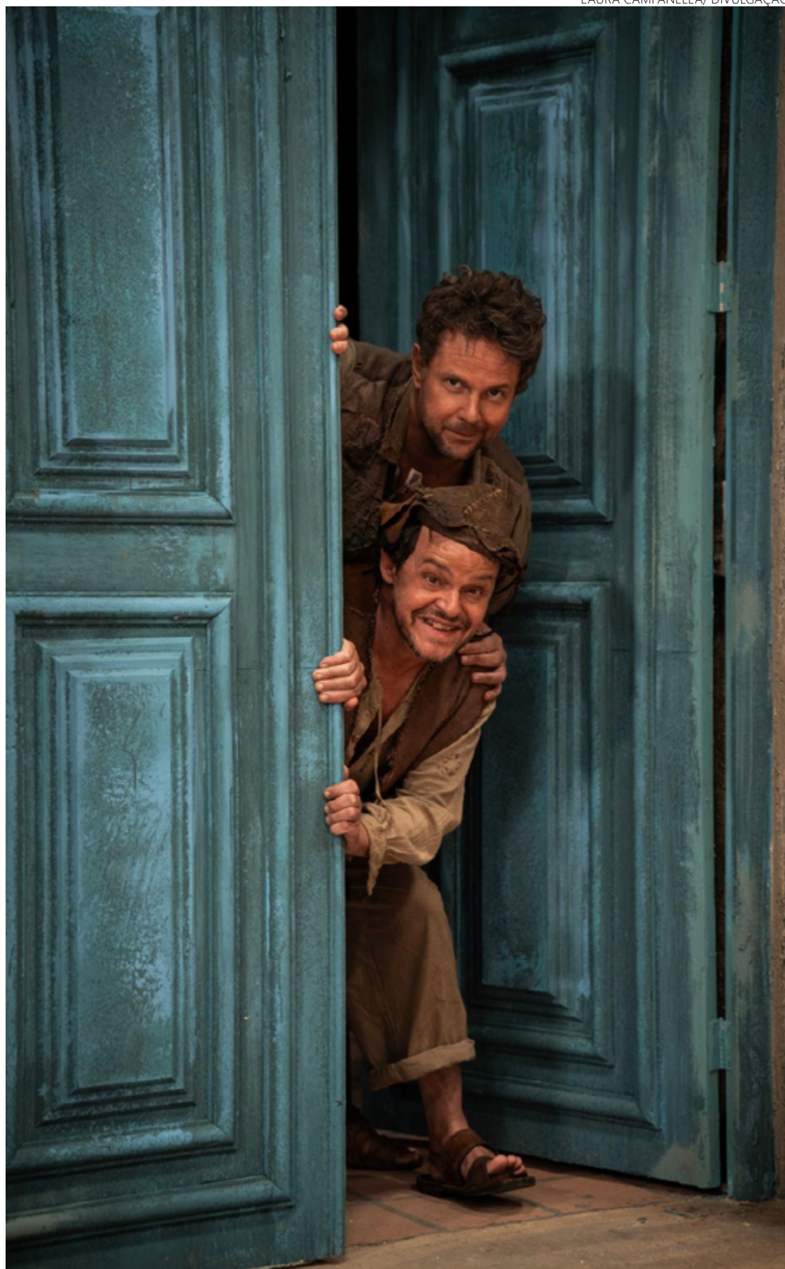
Chicó e João Grilo voltam à tela grande para encantar público como nos anos 2000

de sua amada Rosinha, mas precisa resistir à sedução da voluptuosa Clarabela, vivida por Fabíula Nascimento. Diferente do original, em que as falcaturas de Grilo eram quase como pequenas narrativas separadas que se encavalam, surpreendendo o espectador de forma hilária, "O Auto da Compadecida 2" tem um conflito central que serve de fio condutor para o enredo.