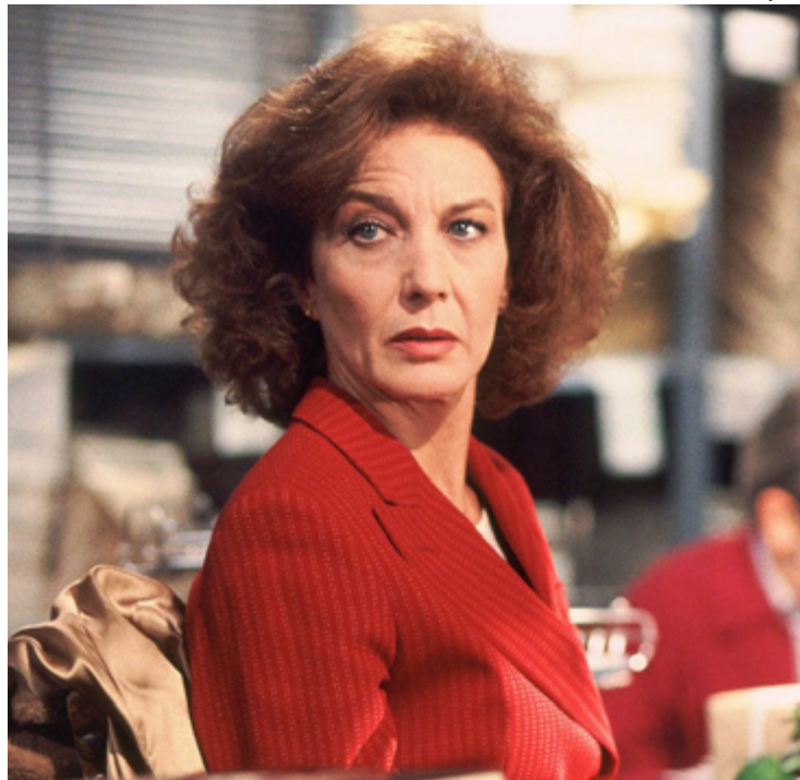
Marisa Paredes atua em 'A Flor do Meu Segredo', longa lançado em 1995