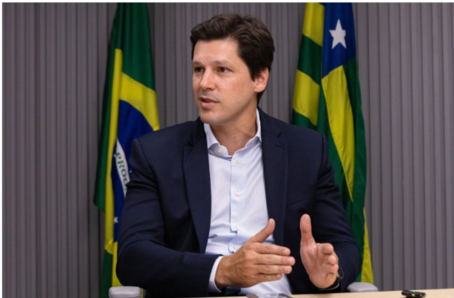
Ronaldo Caiado e Jair Bolsonaro: divisão da direita provoca incertezas para 2026

“O ex-governador Perillo está atrasado, com um discurso completamente des-