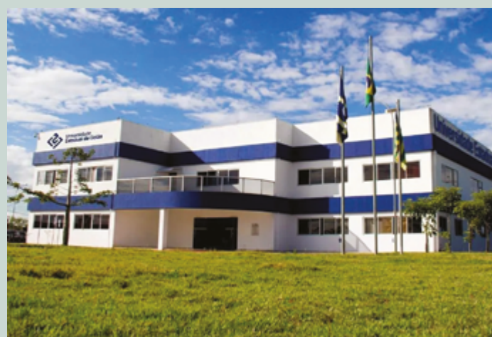
Resultado final do concurso previsto para 12 de agosto de 2025

A previsão é que o resultado final do concurso seja publicado em 12 de agosto de 2025. Os candidatos não classificados dentro do número de vagas e não eliminados por qualquer motivo previsto nos editais irão compor a reserva técnica até o limite de quatro vezes o número de vagas previsto.