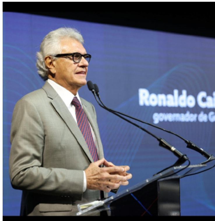
Ronaldo Caiado durante seminário CB Debates Desafios 2025, em Brasília