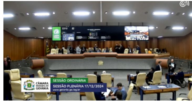
Vereadores de Goiânia discutem no plenário aumento de cargos, verbas e salários