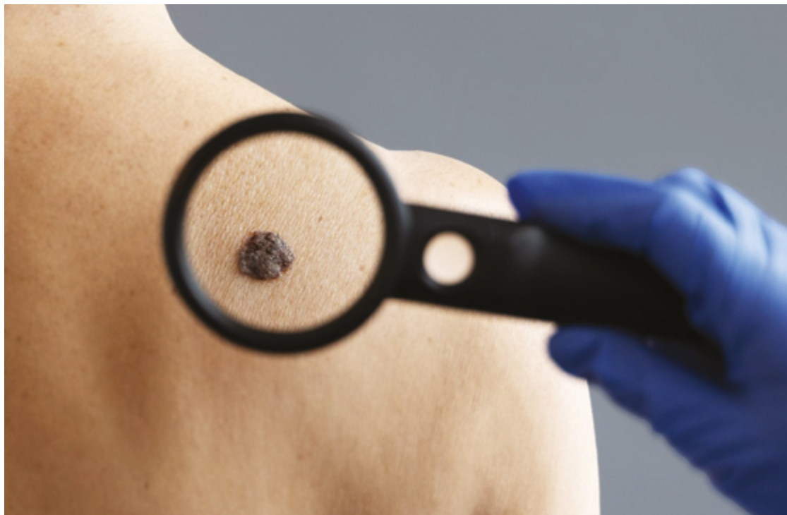
Câncer de pele é o mais frequente no país e corresponde a mais de 30% de todos os tumores malignos

"O câncer de pele pode ser evitado através de cuidados diários com a pele, com a finalidade de se proteger do sol e dos raios UV. Evite a exposi-