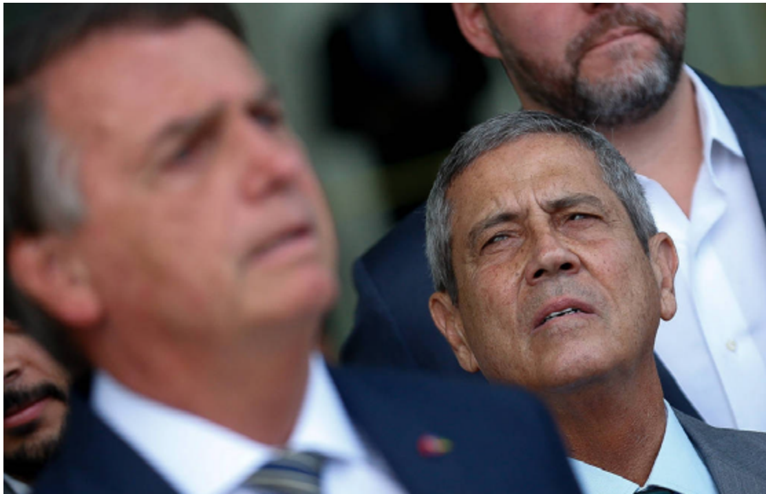
Jair Bolsonaro e Braga Netto: participação do agro nos atos golpistas

A frente parlamentar que representa os interesses do setor