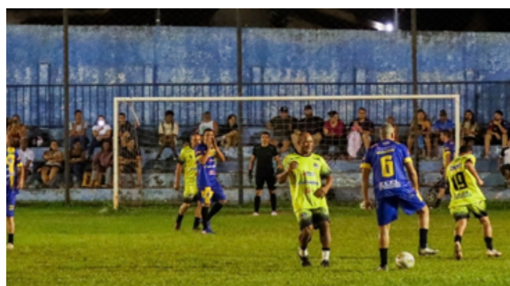
Partida contou com a participação de ex-atletas, músicos, autoridades

O ingresso para assistir aos jogos foi simbolizado pela doação de 1 kg de alimento não perecível. Toda a arrecadação será destinada a instituições que assistem idosos e famílias carentes da região. A Prefeitura de Senador Canedo, por meio da Secretaria Municipal de Esporte e Lazer, deu apoio para a realização do evento, que contou também com a colaboração da população local.