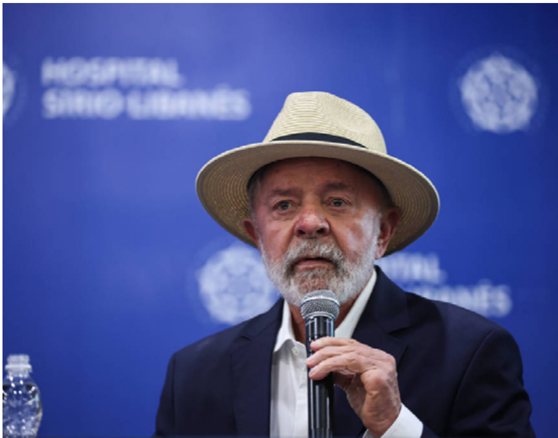
Lula da Silva: economia desgaste imagem do governo

na série histórica de presidentes eleitos em primeiro mandato, contudo, Lula só está melhor também do que os agônicos José Sarney (1987) e Fernando Collor (1992).