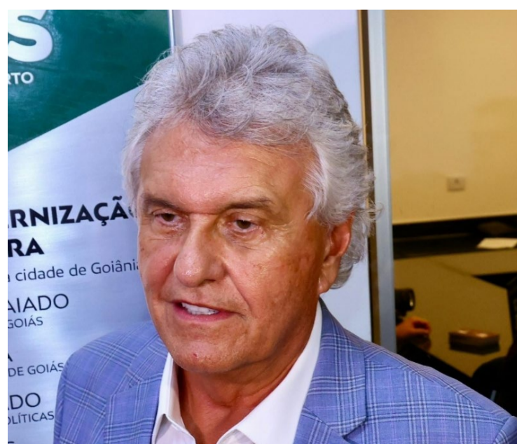
Ronaldo Caiado, governador de Goiás, entregará também 224 chromebooks para estudantes

O governador também visitará as obras do Projeto Mercado, uma iniciativa do Goiás Social em parceria com a Secretaria de Estado de Indústria, Comércio e Serviços (SIC). O projeto, com aporte de R$ 250 milhões provenientes do Fundo de Proteção Social do Estado (Protege), visa impulsionar a economia do Entorno do Distrito Federal. Águas Lindas será a primeira de cinco cidades a receber o empreendimento, com inauguração prevista para março.