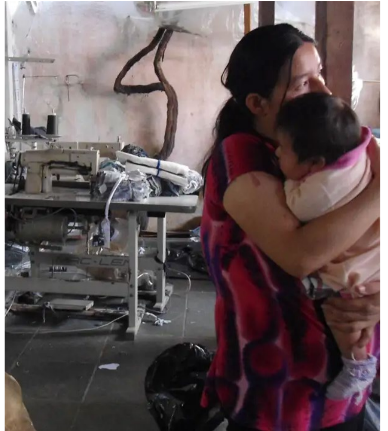
Ações fiscais foram realizadas pelo Ministério do Trabalho e Emprego

Áreas com maior número de trabalhadores resgatados foram na construção civil e agricultura