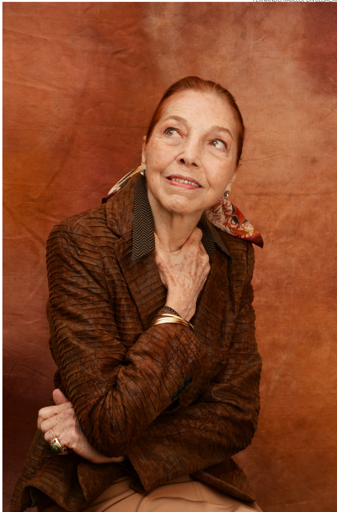
Respeitadíssima: autora se tornou referência em literatura infantojuvenil

No Rio de Janeiro, morou na mansão de sua tia-avó, a cantora lírica Gabriella Be-