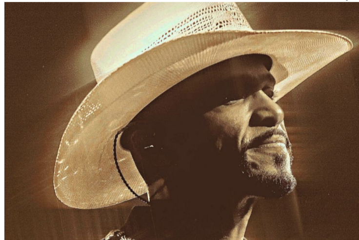
Atento: cantor diz que sempre se interessou pelos 'modões'