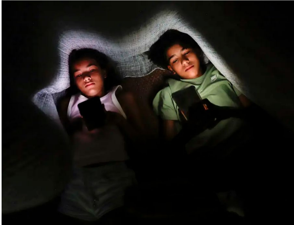
Quase metade (47%) das famílias pesquisadas não controla seguidores dos filhos nas redes sociais

Segundo pesquisa divulgada nesta terça-feira, pelo menos uma a cada três contas atribuídas a crianças e adolescentes de 7 a 17 anos de idade em redes sociais no Brasil têm perfil "totalmente aberto"