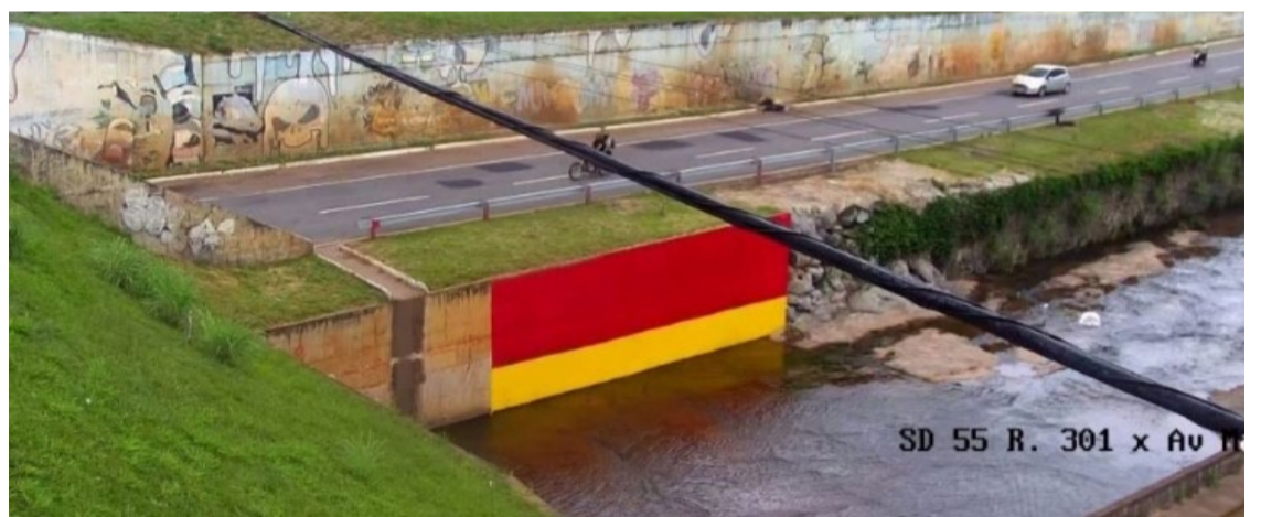
Réguas de altura ficam visíveis para os motoristas que acessam a Marginal Botafogo

Também participam do grupo a Secretaria Municipal de Infraestrutura Urbana, a Secretaria Municipal de Engenharia de Trânsito, e a Companhia de Urbanização de Goiânia (Comurg). Além