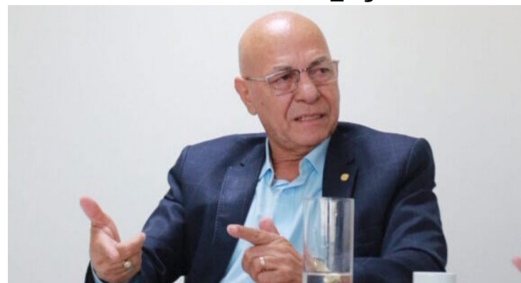
Professor Alcides: desfiliação do PL