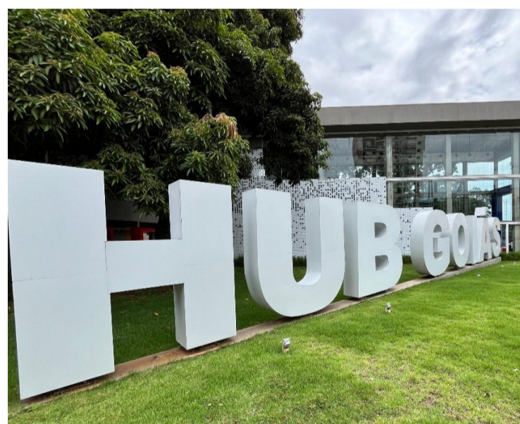
Hub Goiás, no setor Universitário: edital aberto para startups e empresas de todo país