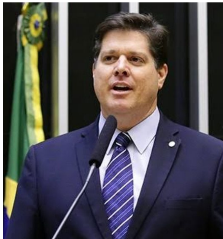
Deputado federal Baleia Rossi, presidente nacional do MDB: político pede investigação da emenda que encaminhou para Casa Branca (SP)

O monitoramento das emendas Pix em todo o país começou a partir de um ofício expedido pela 5ª CCR (Câmara