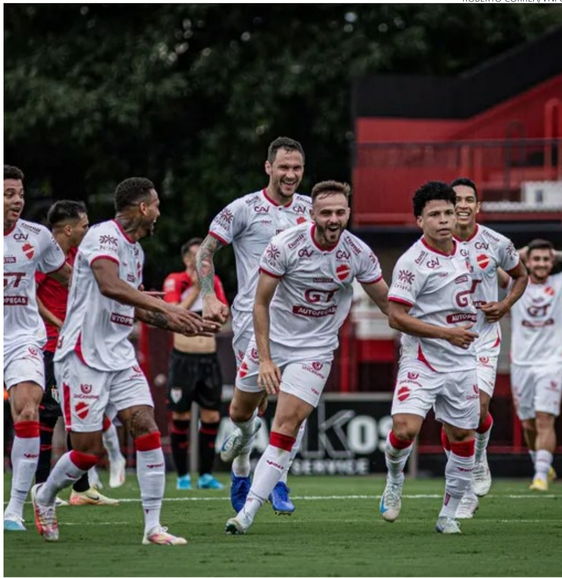
Jogadores do Vila Nova comemoram gol na vitória de 3 x 1 sobre o Atlético-GO no Accioly