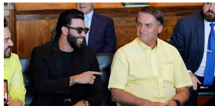
Gustavo Lima e Jair Bolsonaro: desencontros políticos