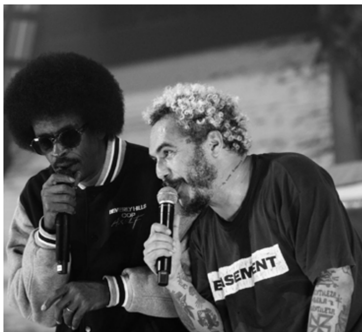
Seu Jorge (à esquerda) e D2 (à direita): reencontro nos palcos

volta pro terror dos fascistinhas de m...”, anuncia D2, em certa altura do clássico “Legalize Já”, lançado no ruidoso “Usuário”, de 1995. O palco, ladeado por luzes verdes, recebe artistas que reenergizaram a música brasileira. Dessa vez, ao vivaço, Planet ressurgue — e recicla — sua própria lenda.