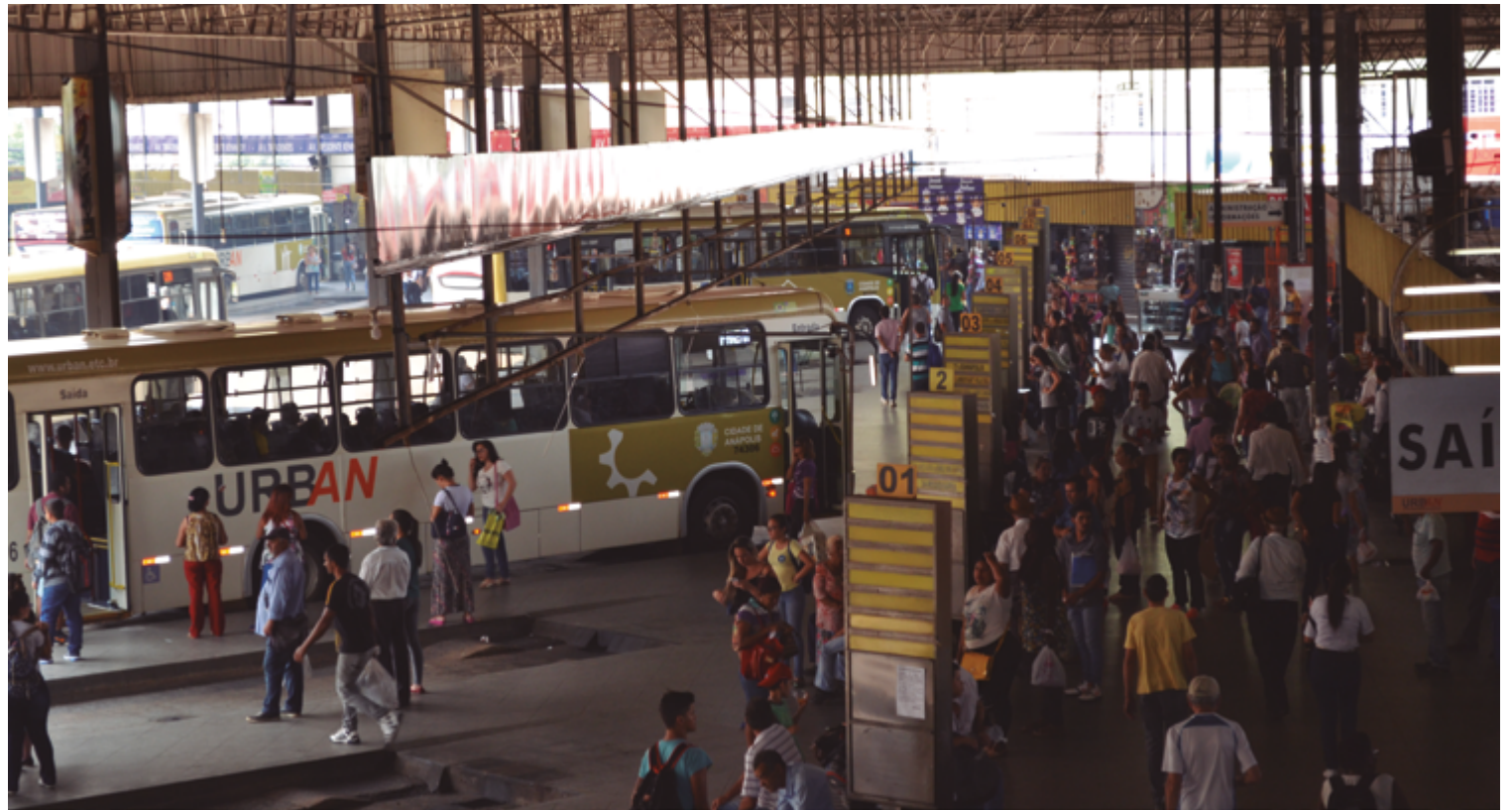
Entidade que representa os trabalhadores do transporte coletivo afirma que operadora do sistema não fez manifestação objetiva sobre o reajuste salarial

Ao final da nota, a diretoria do SITTRA reafirma a convocação dos profissionais que trabalham no sistema de transporte coletivo urbano para a Assembleia Geral do dia 10 de novembro, oportunidade em que a categoria deve deliberar pela realização ou não do movimento grevista. O docu-