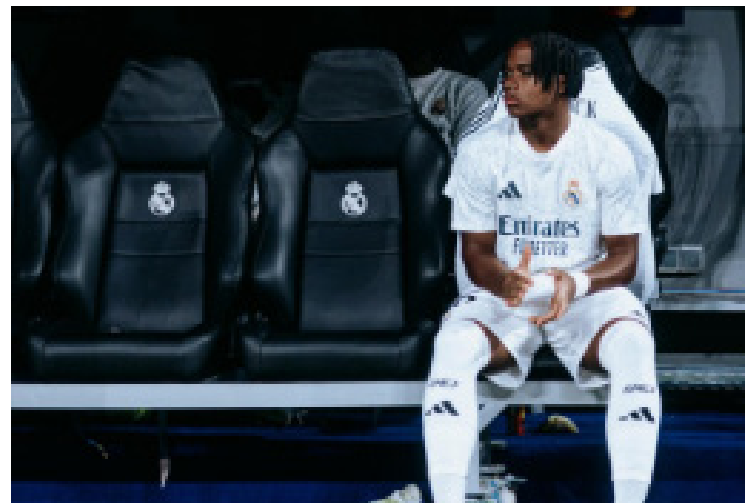
Endrick: jogador está há vários jogos na reserva