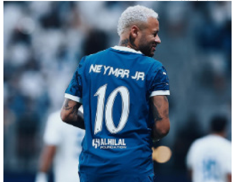
Neymar: lesão pode forçar rescisão de contrato