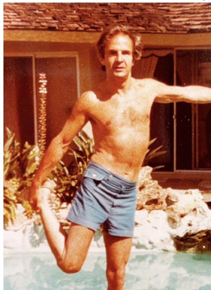
'O Roteiro da Minha Vida' lembra vida do cineasta François Truffaut