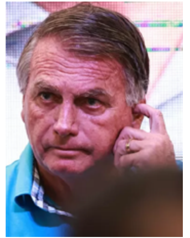
Jair Bolsonaro (PL)