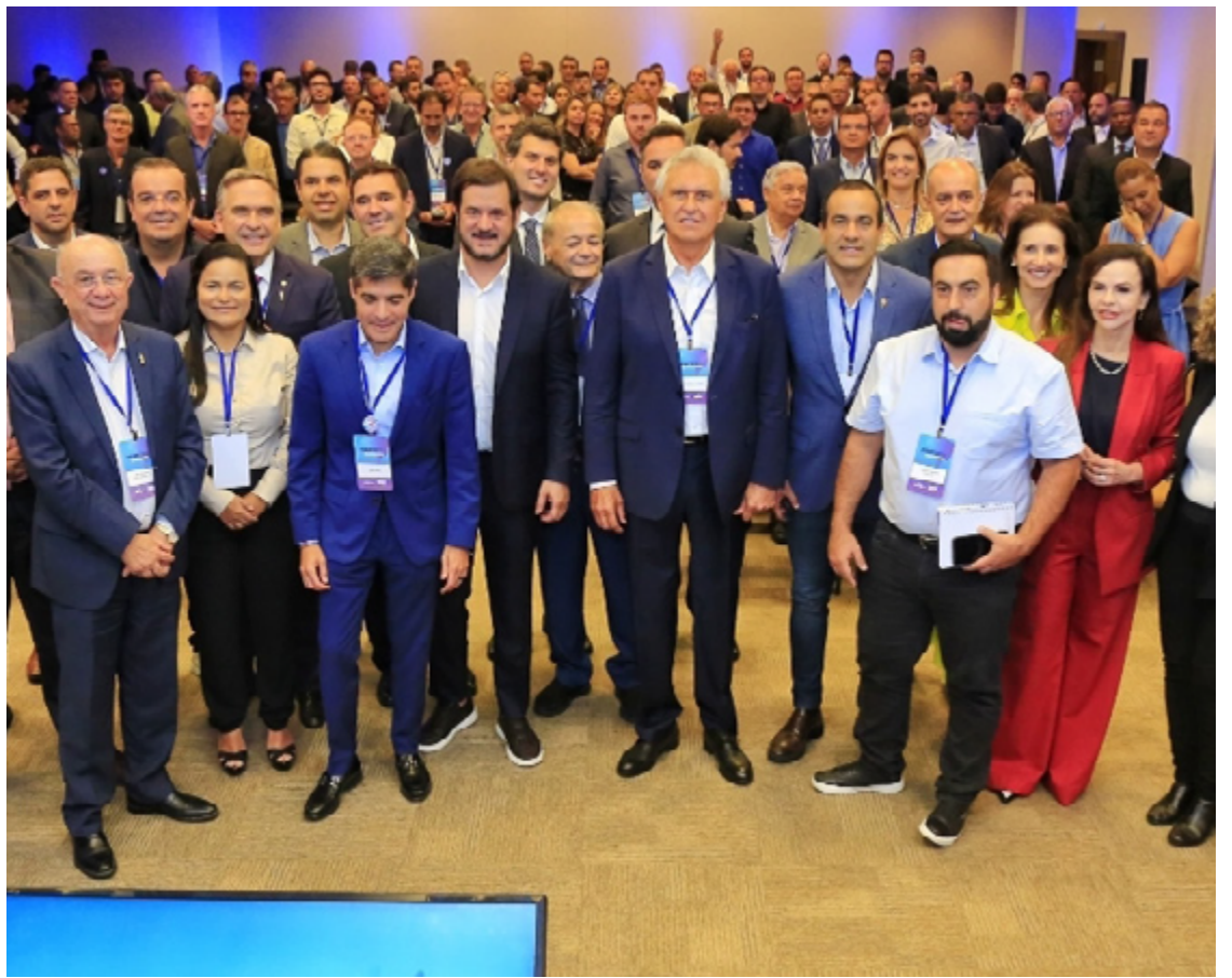
Governador Ronaldo Caiado alerta prefeitos eleitos: " [ é preciso ] voltar a atenção para a população"

O encontro, realizado nos dias 6 e 7 de novembro, reuniu especialistas e prefeitos para discutir transição de mandato e planejamento estratégico. Os gestores receberam um Guia de Transição e Planejamento Estratégico, com orientações sobre a Lei de Responsabilidade Fiscal e dicas práticas para o início da gestão.