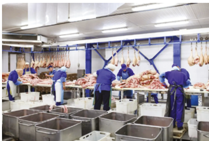
Setores como alimentos, biocombustíveis e veículos forçam recuperação

A fabricação de alimentos se destacou em Goiás, com