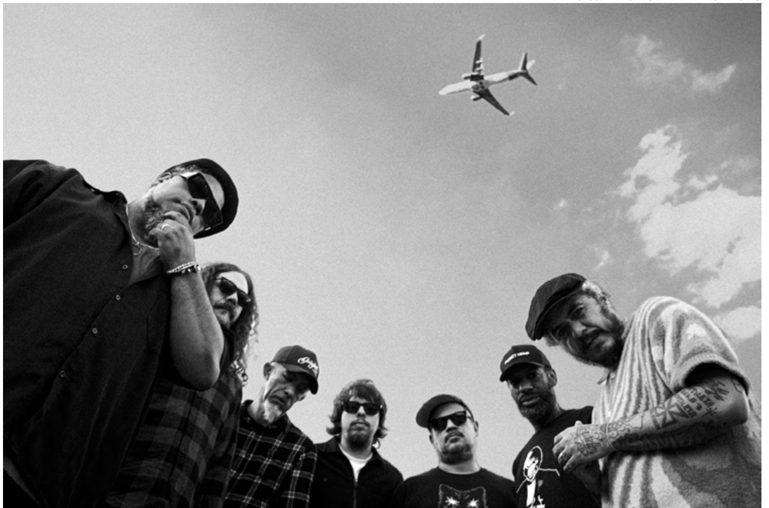
30 anos de fumaça: Planet retorna com disco que repassa trajetória fonográfica responsável por abalar música brasileira

“Avisa lá, avisa lá que a ex-quadrilha da fumaça está de