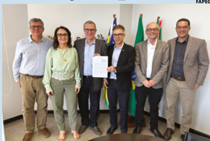
Projeto visa produzir pesquisas que mapeiem boas práticas e inovações na gestão de prefeituras, além de capacitar gestores