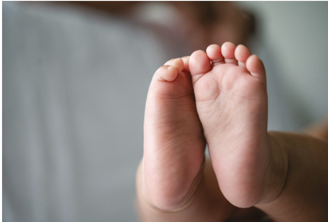
Brasil é o 10º no ranking com mais nascimentos prematuros; são 302 mil nascidos antes de 37 semanas de gestação

Ela também enfatiza a importância de um pré-natal eficiente. "O que mais chama a atenção com relação a reduzir o risco é ter um pré-natal eficiente, com a gestante dando o seu melhor e sempre bem orientada, menos estressada,