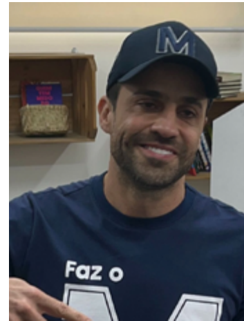
Pablo Marçal (PRTB)