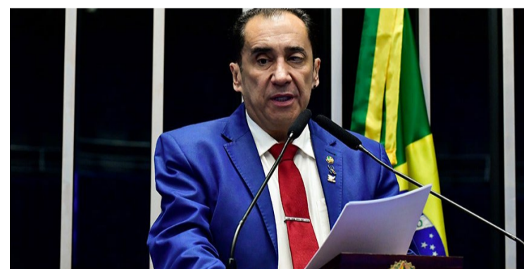
Jorge Kajuru: desmilitarização da política