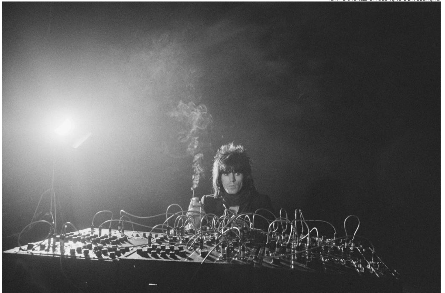
Keith Richards: guitarrista tem seus podres revelados por ex-fotógrafo dos Rolling Stones em livro que causou polêmica

“Uma biografia de Bob Dylan em Sete Canções” (Zain). A publicação é assinada pelo ensaísta Greil Marcus. Começa no início dos anos 1960 com “Blowin’ in the Wind”. “The Lonesome Death of Hattie Carroll”, “Ain’t Talkin’”, “The Ti-