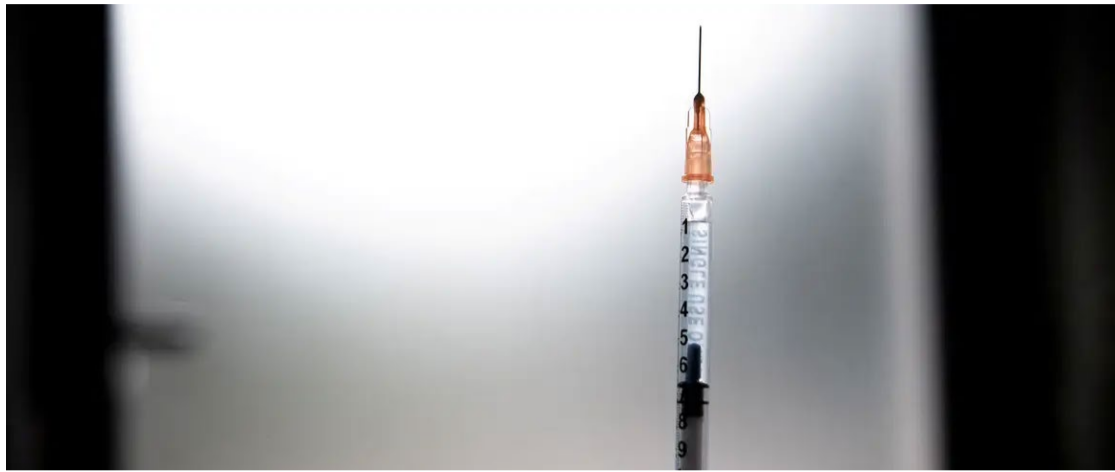
Vários países iniciaram neste ano vacinas personalizadas contra o câncer

O ano de 2024 foi marcado por significativas conquistas na ciência e na esfera internacional, refletindo um período de inovação e reestruturação global