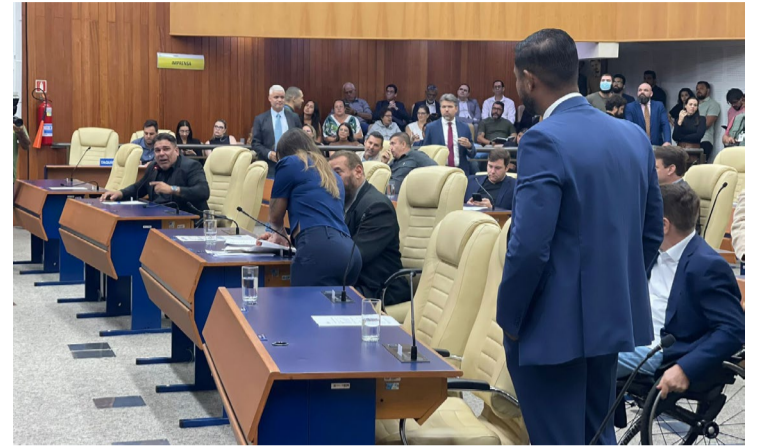
Vereadores encerram ano legislativo com sessão extra