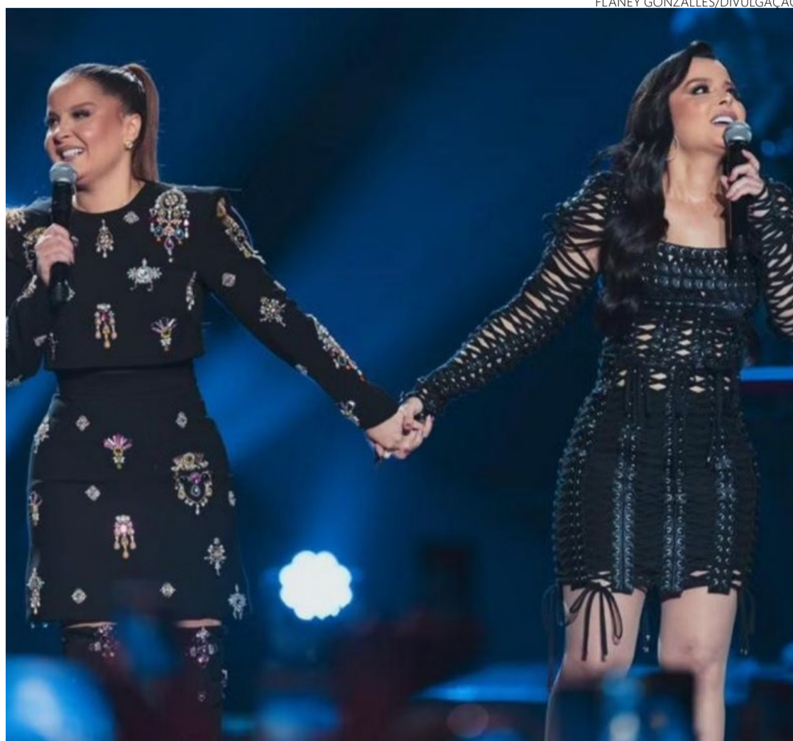
Maiara e Maraisa agitam réveillon na Arena Multiplace com hits sertanejos

Pub. Ainda no embalo das guitarras, o bar do Marista vai direto ao ponto: "réveillon digno de rei e rainha". Pois é, e os caras bolaram uma programação que se estenderá fácil, fácil até o sol dar boas-vindas à ressaca da virada.