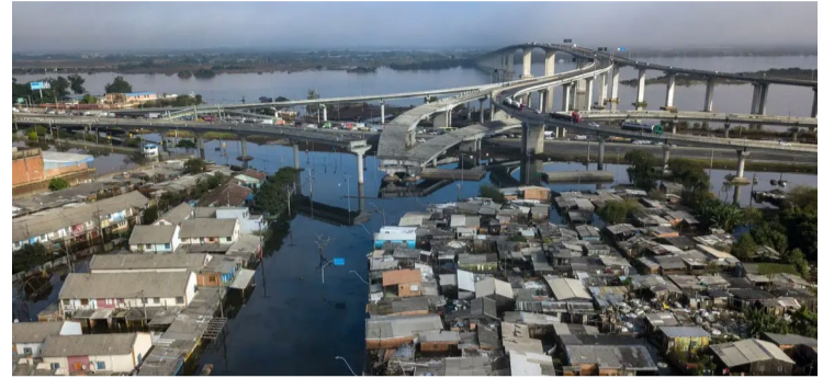
Nove em cada 10 desastres naturais estão relacionados com a água

Cerca de dois milhões de pessoas em todo o mundo não têm acesso a serviços de água potável geridos de forma segura