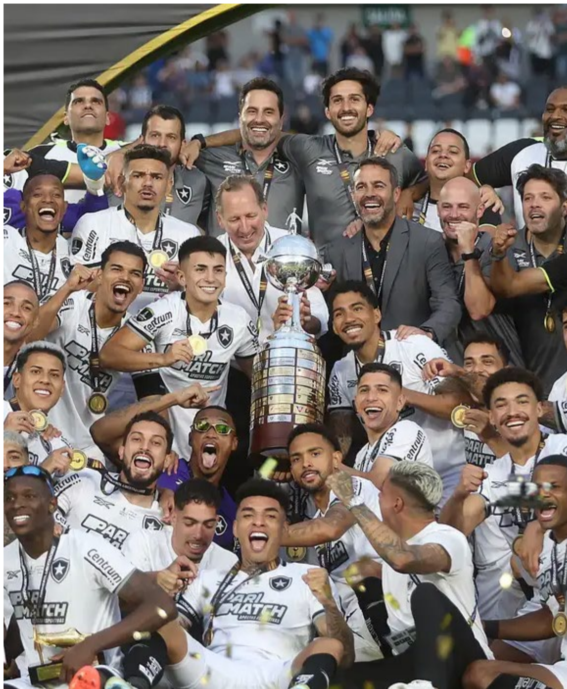
Com uma equipe muito forte tanto no aspecto físico como no técnico, o Alvinegro conquistou o Brasileirão e Libertadores

Quem também conseguiu comemorar um título nacional em 2024 foi o Flamengo. Em uma temporada conturbada, na qual o atacante Pedro foi um desfalque muito lamentado e o técnico Tite acabou demitido, o Rubro-Negro da Gávea deu provas de que pode ter um 2025 melhor ao conquistar a Copa do Brasil sob o comando do ex-jogador Filipe Luís.