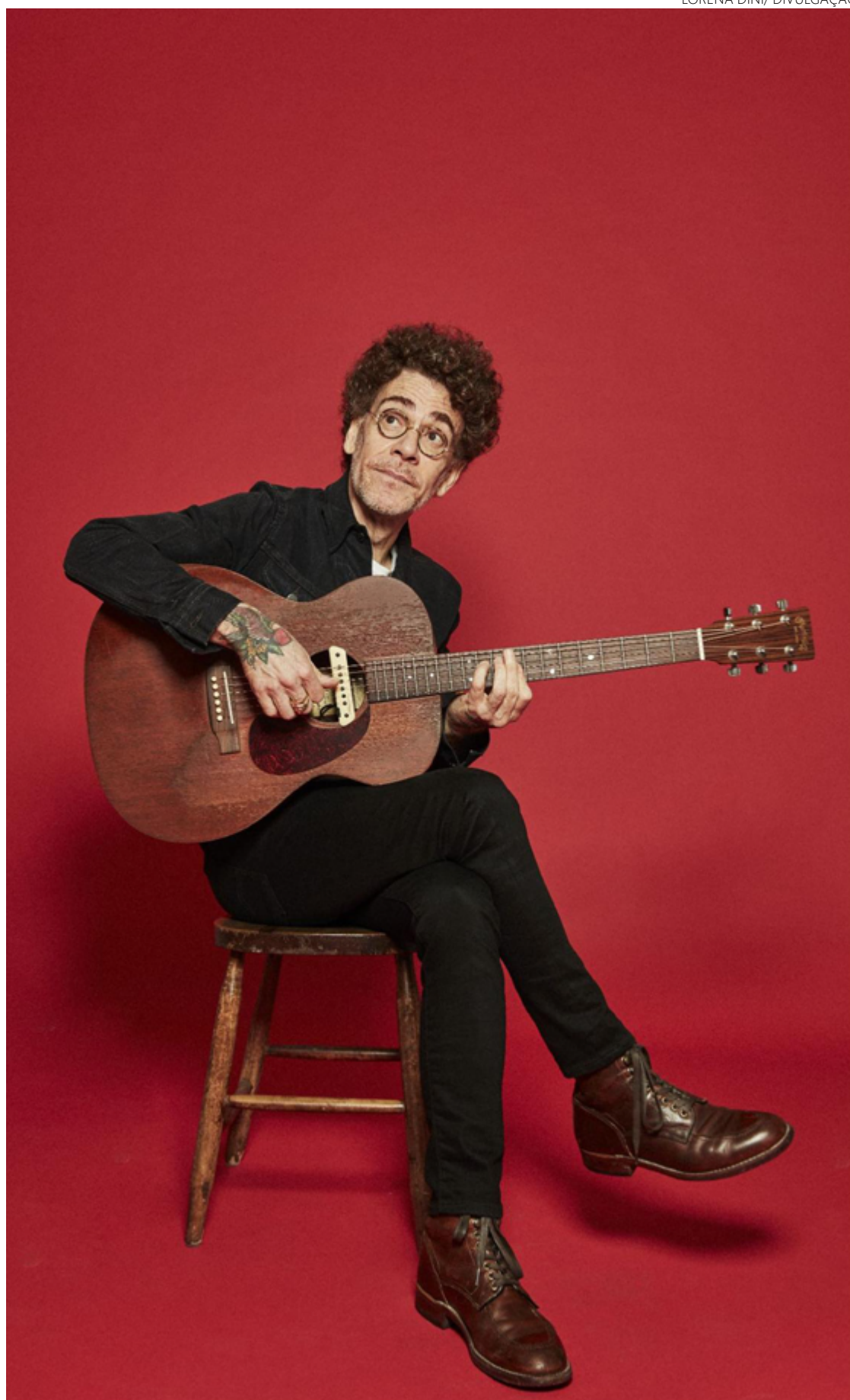
Superação: Nando Reis afirma que substâncias estavam prejudicando sua criatividade

Nando cerca-se dos bons: o guitarrista Peter Buck, co-fundador da banda norte-americana R.E.M., e o produtor dos álbuns e baterista Barrett Martin (da Screaming Trees) estão