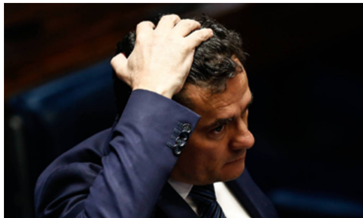
Sergio Moro: condenação indevida a Ronaldo Caiado

Ronaldo Caiado foi processado e condenado em menos de dois meses. Segmentos da sociedade questionam decisão e declaram apoio ao governador de Goiás