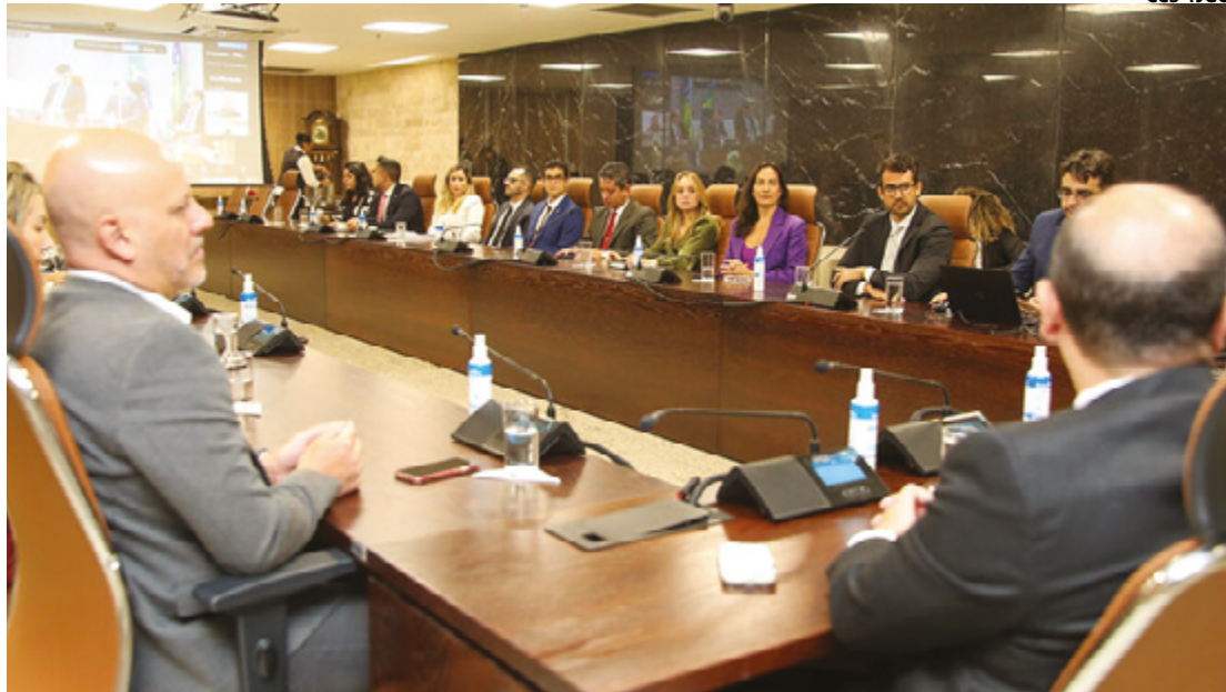
Evento de lançamento do 'Projeto Probidade', na sede do Tribunal de Justiça de Goiás (TJGO); pelo menos 2,5 mil ações correm risco de prescrição no segundo semestre do ano que vem, segundo informam autoridades

Na rodada anterior, divulgada pela Quaest em abril, Caiado também se destacava, com 86% de aprovação, 12% de desaprovção e 2% de pessoas que não responderam. A pesquisa mais recente confirma que o governador de Goiás segue com tendência de alta nos índices de aprovação, consolidando posição de destaque nacional. (Com informação Secom)