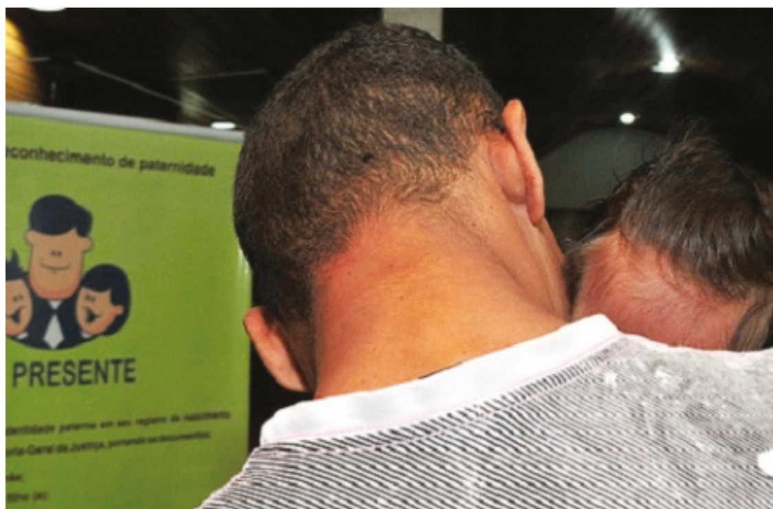
Equipe se desloca até locais designados, permitindo que pais reconheçam seus filhos de maneira espontânea

O Pai Presente está instalado em 100% das comarcas goianas e fornece testes de DNA gratuitamente. Para conhecer melhor o Programa Pai Presente é só acessar o Instagram oficial do TJGO e o Canal do Youtube da Diretoria de Planejamento e Programas da CGJGO por meio do Programa Corregedoria em Foco. Maiores informações podem ser obtidas pelos telefones (62) 3216-2442 e (62) 99145-2237 ou pelo e-mail: paipresente@tjgo.jus.br. (Com informações CGJGO)