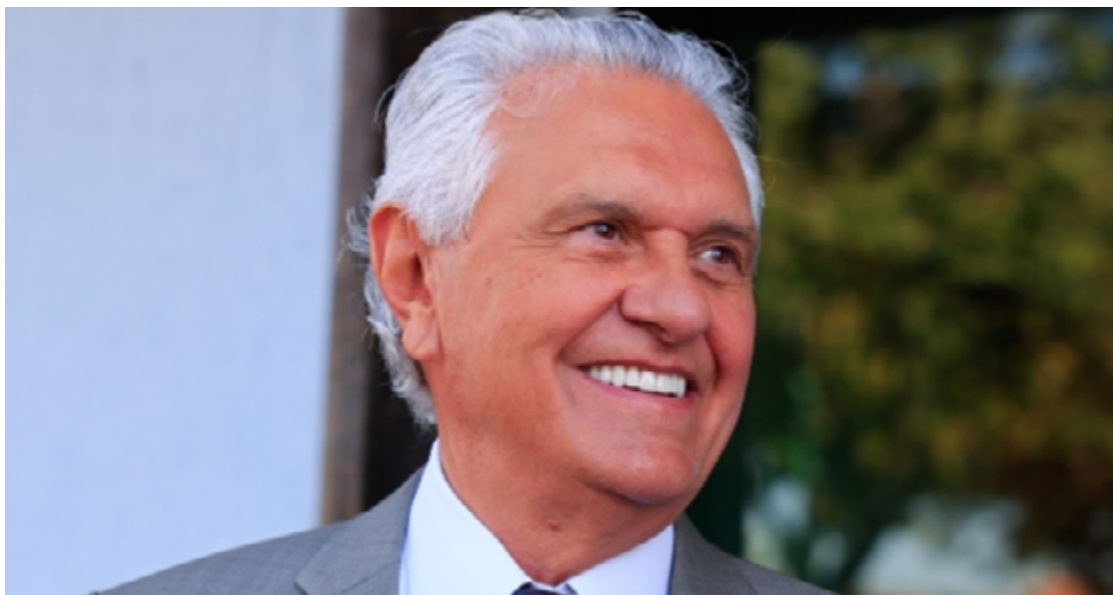
Ronaldo Caiado é o recordista em aprovação na maioria dos institutos: Quaest mostra o político goiano com 88% de aprovação

Chama atenção o baixíssimo número de pessoas que rejeitam a administração: apenas 9% dos entrevistados desaprovam a gestão de Caiado. Outros 4% não souberam ou não responderam, diz a avaliação. Em conjunto com outras pesquisas divulgadas, Caiado chega a um resultado histórico: jamais um governante goiano obteve tamanha aprovação mensurada por pesquisas.