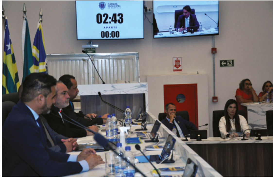
Sessão extraordinária teve debates intensos mas, ao final, suplementação foi aprovada por unanimidade

Para se chegar à votação em plenário, nesta quinta-feira, 12, foram realizadas pelo menos duas reuniões da comissão mista, nas quais ocorreram debates intensos, envolvendo vereadores contrários e favoráveis às alterações no projeto original. Ao final, ambos os lados decidiram por colocar em pauta o novo projeto, com as alterações propostas pelo grupo de 13 vereadores que assinaram o substitutivo.