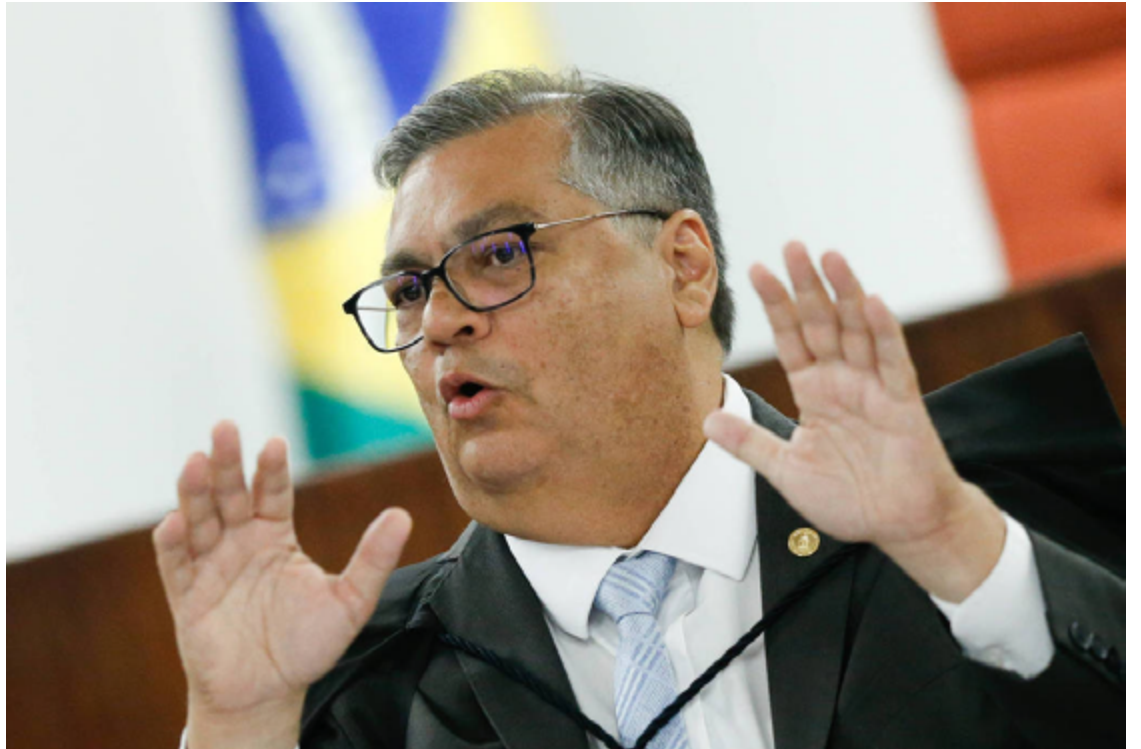
Flávio Dino: posições sobre emendas desagradam senadores e deputados federais

Mais cedo, em outro evento, o ministro havia dito que o Judiciário não é um poder político e que nenhum julgamento ocorre sem participação popular. "O Judiciário não é um Poder político, eleito, mas valoriza profundamente o poder popular, soberania popular, e a participação social. Por isso, promove sempre audiências públicas, sessões técnicas, há figura que todos conhecem das entidades que participam dos julgamentos", disse. "E nenhum julgamento relevante para o Brasil é feito no Supremo sem diálogo com a sociedade. Seja emendas, orçamento, bets, regulação de internet, meio ambiente", completou.