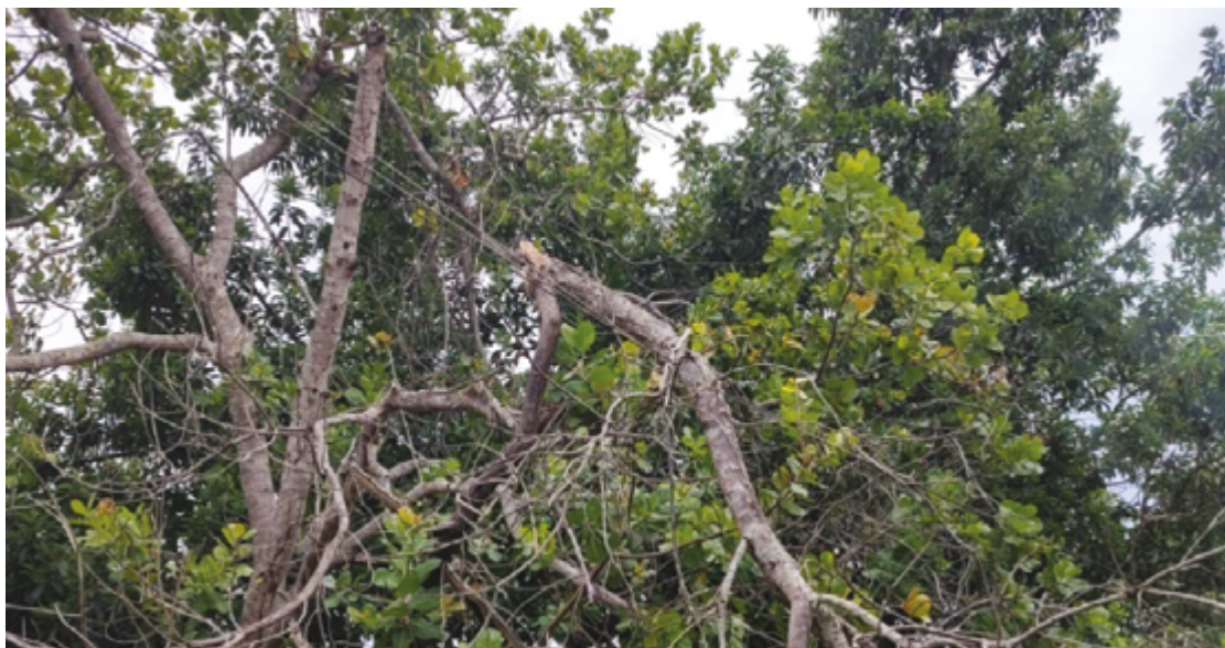
Quedas de árvores na rede é situação de risco; orientação é não fazer poda e informar a concessionária

Cerca elétrica: Aposte em eletrificador para as cercas. É uma espécie de caixa de controle da fonte de energia fundamental para o sistema de proteção com cercas elétricas. Siga as orientações do manual e instale placas de sinalização a cada 100 metros. Nunca conecte a cerca diretamente na tomada. (Com informações Equatorial Goiás)