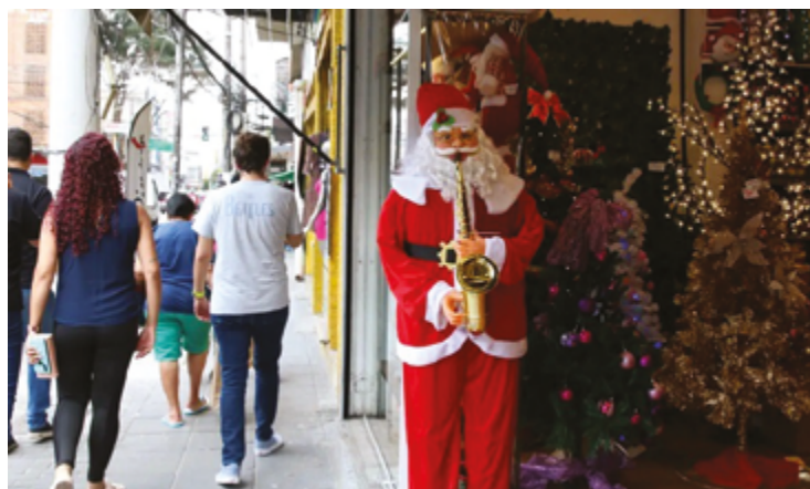
Goiás ocupa oitava posição no ranking nacional de vendas para o Natal

De acordo com o levantamento, os itens mais procurados neste Natal devem seguir a tendência nacional.