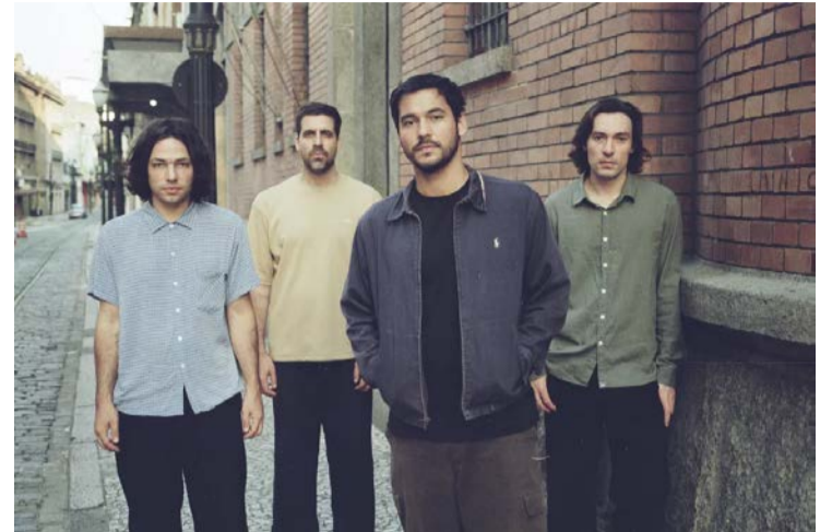
Banda Terno Rei faz show no Martim Cererê