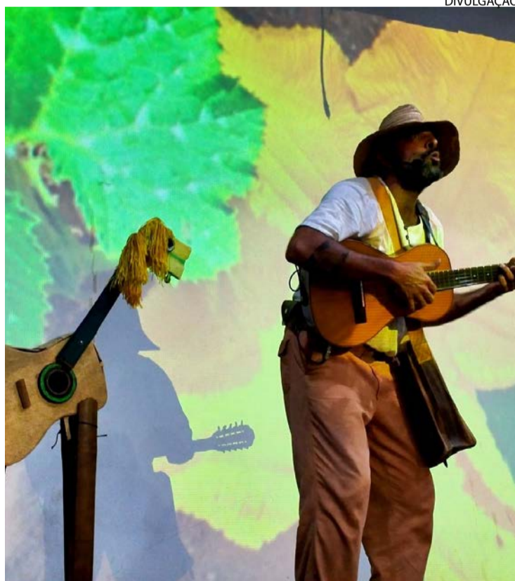
Narrativa acompanha violeiro que percorre Cerrado