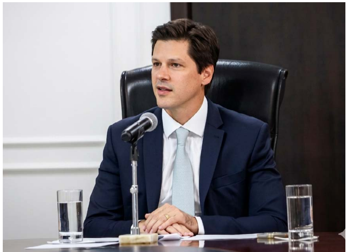
Governador Daniel Vilela lidera articulação no STF para evitar perdas na divisão dos royalties do petróleo

A proposta a ser apresentada, segundo ele, busca uma saída equilibrada: aplicar a lei a partir de maio de 2026, prever uma transição de sete anos para adaptação dos estados produtores, renúncia de valores retroativos e excluir da negociação a mar-