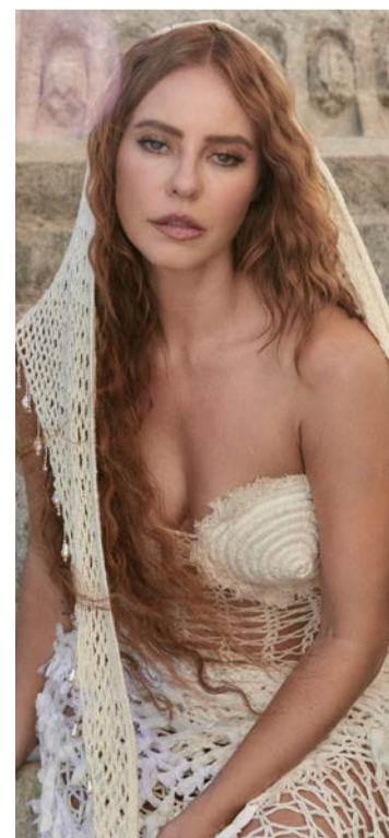
Imagens foram feitas em cenário arquitetônico clássico

Nos registros, a artista aparece com diferentes composições de figurino, marcadas pelo uso de crochê, rendas e acessórios em destaque. Nos comentários, seguidores reagiram com entusiasmo, com elogios à estética e à presença da atriz nas imagens.