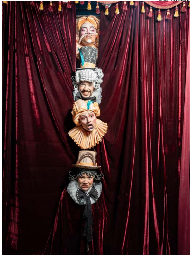
Enredo faz referências aos mitos do deus grego Dionísio

Com direção de Altair de Sousa, a encenação aposta na interação di-