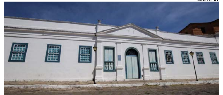
Palácio Conde dos Arcos, Cidade de Goiás: tradição e história