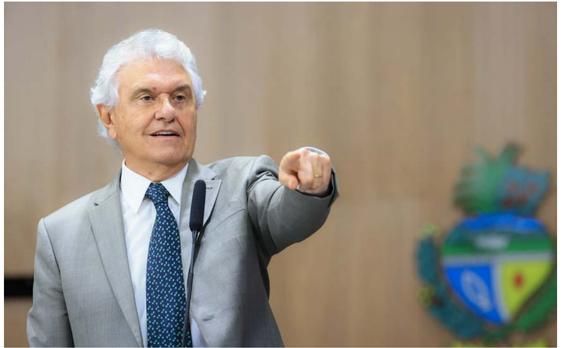
Ex-governador Ronaldo Caiado faz duras críticas ao presidente Lula

Como a Folha mostrou, o memorando de enten-