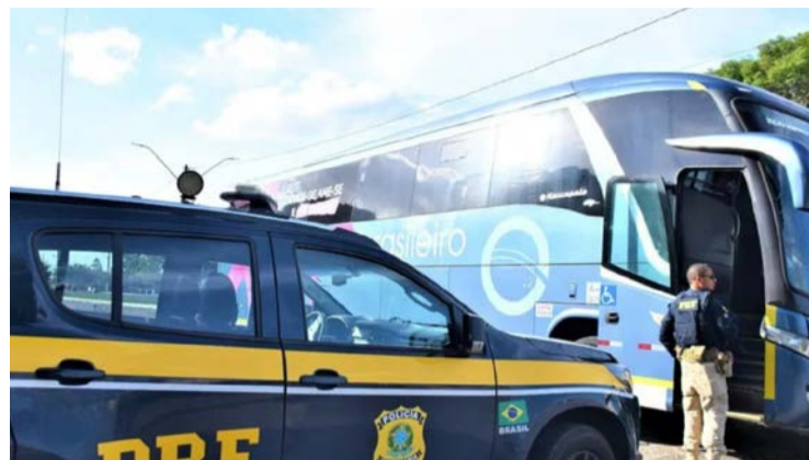
Vítima diz que marroquino tocou seios e tentou atingir partes íntimas

Uma passageira de 34 anos denunciou ter sido assediada sexualmente dentro de um ônibus