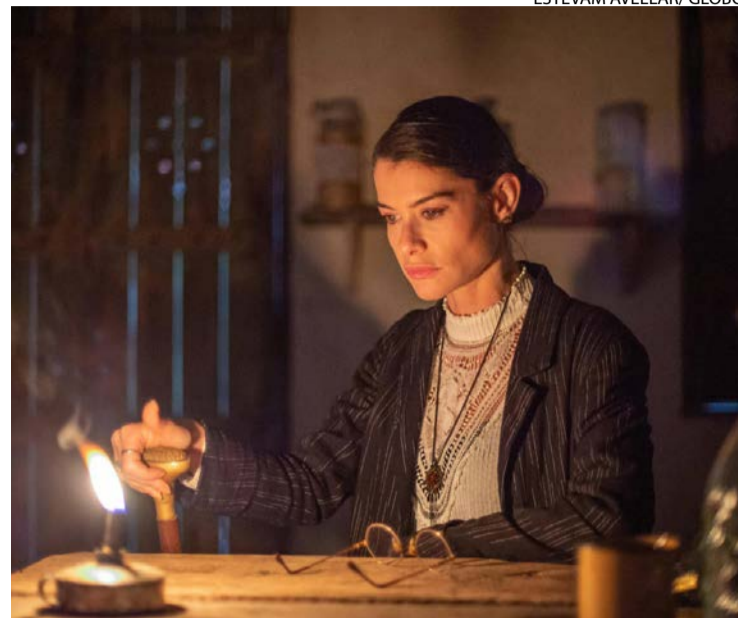
Alinne interpreta Jânia em folhetim da TV Globo