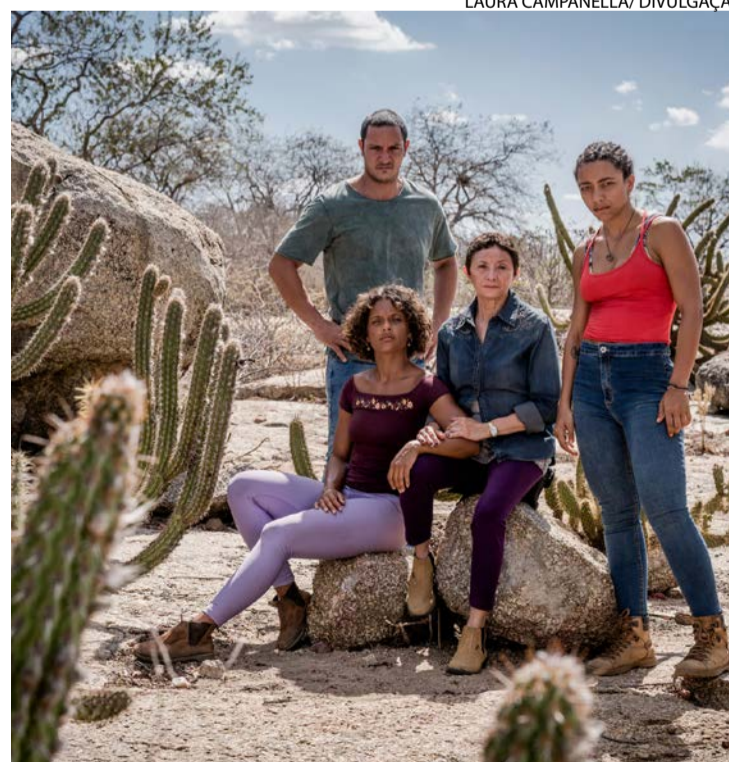
Amazon abriu os cofres para fazer divulgação ampla de "Cangaço Novo"

Para além de violenta, "Cangaço Novo" volta também mais política. Nesta temporada, há uma cena que gira em torno de uma eleição para prefeito, que parece dialogar com disputas reais — inclusive na estética, com o campo progressista, em cena, com camisetas e bandeiras vermelhas. O repórter viajou a convite da Amazon Prime. (Folhapress)