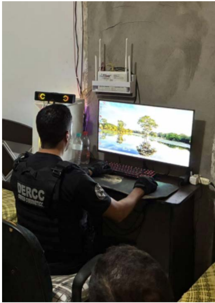
Apurações identificaram o envio de arquivos digitais com conteúdo de abuso sexual infantil

Durante o cumprimento da ordem judicial, os policiais civis apreenderam aparelhos celulares. Os equipamentos seguiram para perícia técnica, que deve contribuir com a análise