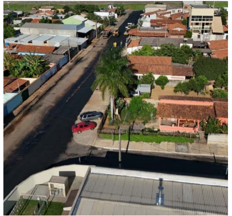
Ampliação de obras do programa Goiás em Movimento foi anunciado pelo governador Daniel Vilela

As obras são definidas pelas próprias prefeituras, que indicam os pontos mais críticos. Atualmente, 196 municípios já participam do programa, coordenado pela Agência Goiana de Infraestrutura e Transportes. A presidente do órgão, Eliane Simonini, afirmou que a meta é manter o programa ativo de forma contínua, com novos contratos e serviços ao longo de todo o ano.