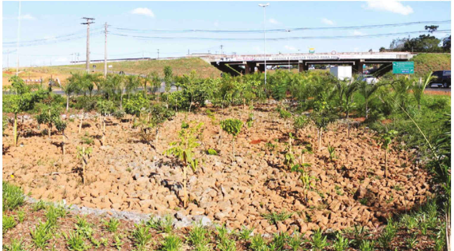
Entre as ações já realizadas dentro do plano, destacam-se a instalação de aproximadamente 10 jardins de chuva em pontos estratégicos da cidade

“Os jardins de chuva são uma ferramenta valiosa para minimizar alagamentos e promover a preservação das áreas verdes. Com essa iniciativa,