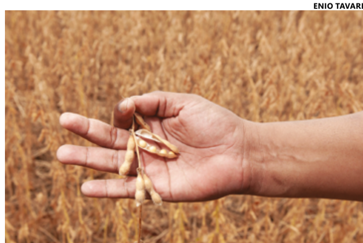
Estimativa de incremento na produção, e mais produtividade e área plantada

O 1º Levantamento da Safra de Grãos 2024/25 da Conab projeta ainda que a produção goiana de soja ultrapasse 18 milhões de toneladas, com aumento expressivo da produtividade da cultura, que deve chegar a 3,8 toneladas por hectare, número 9,1% superior ao da safra anterior. Outros destaques de produtividade são o girassol,