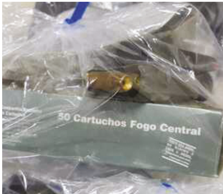
Materiais apreendidos na Operação Arapuca, realizada pelo MP e PC