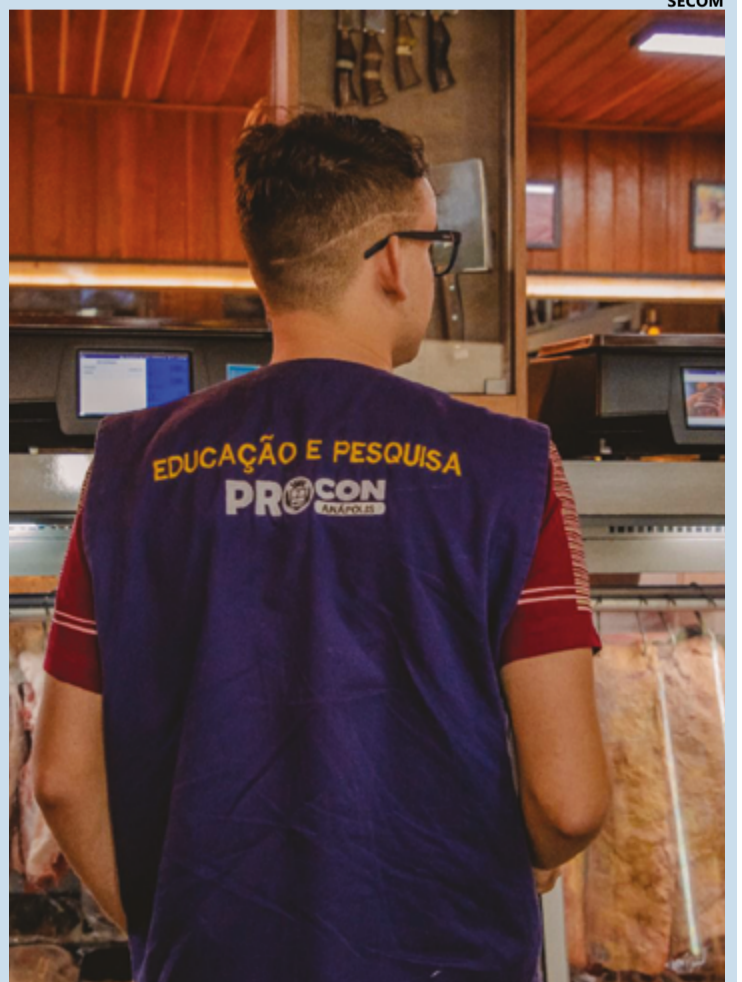
Fiscais do Procon realizaram levantamento comparativo de preços em açougues de supermercados e casas de carnes, entre 8 e 15 de outubro