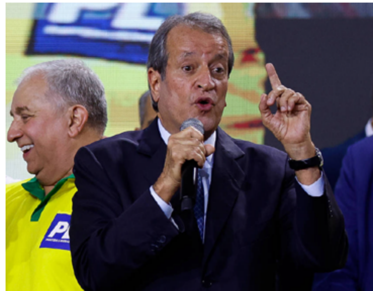
Valdemar Costa Neto: barrar a extrema direita