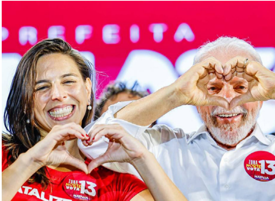
Lula participa de ato de Natália Bonavides (PT) em Natal (RN)

Em geral, o presidente tem feito dobradinhas entre agendas institucionais do governo durante o dia e comícios à noite. Esse formato foi utilizado