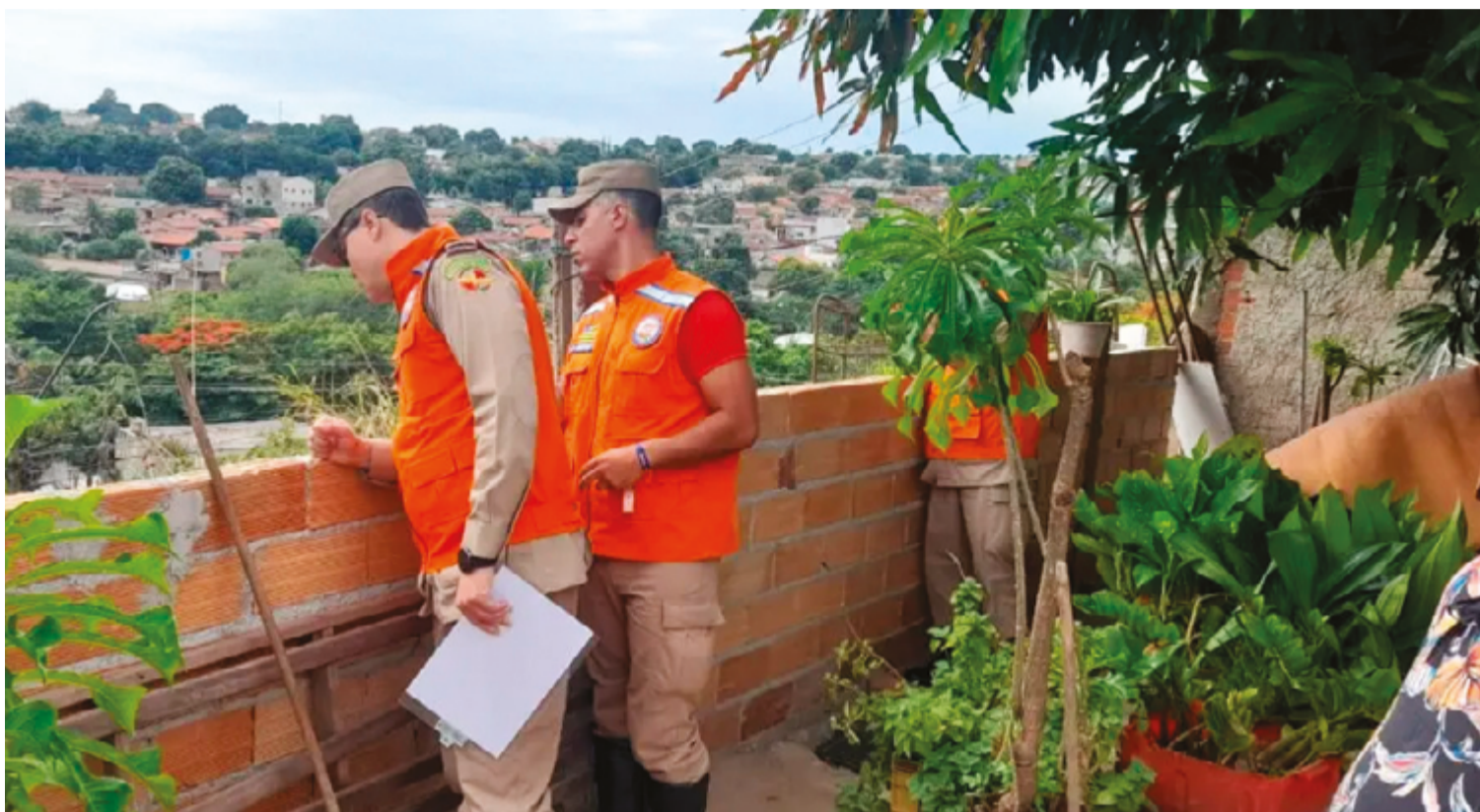
Estratégia envolve mapeamento de várias áreas de risco, manutenção de estradas e instalação de pelo menos onze postos da Defesa Civil

“É uma satisfação para a OVG fazer parte da Operação Goiás Alerta e Solidário. Nesta primeira etapa, entregare-