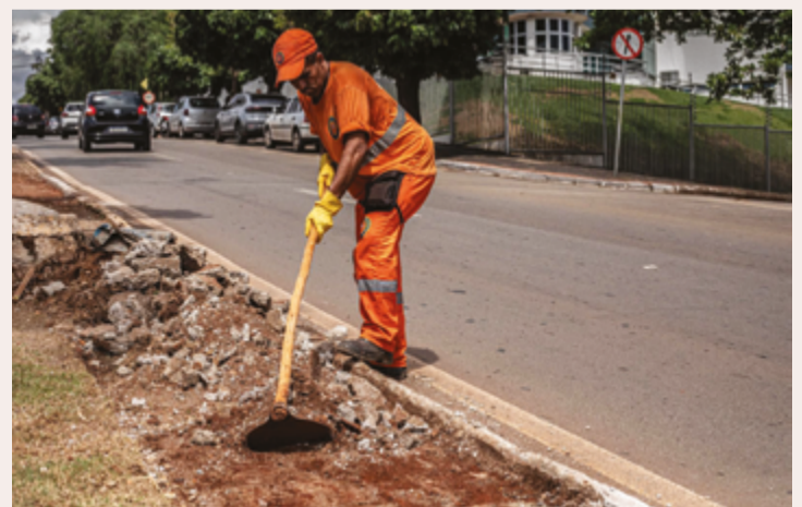
Trabalho está na Fayad Hanna, via que liga centro à região leste da cidade