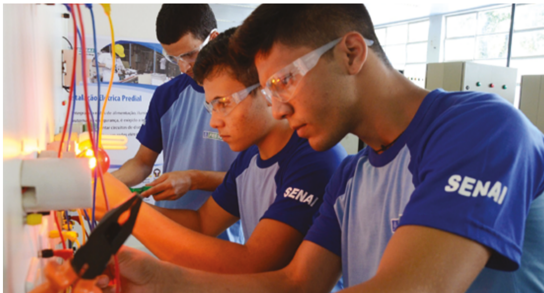
Qualificação é necessária para atender ritmo de criação de empregos e reposição de trabalhadores em 9,8%