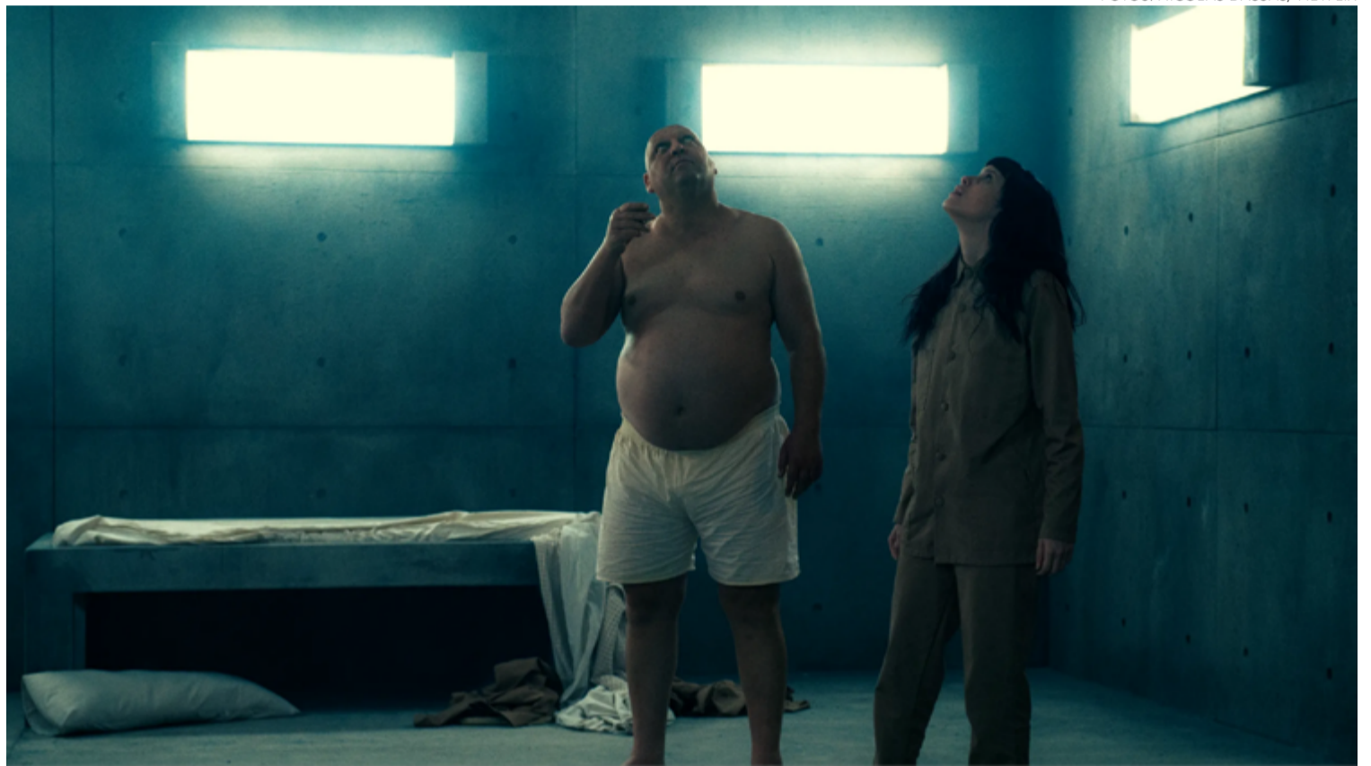
Ideias: 'El Hoyo 2', dirigido pelo cineasta espanhol Galder Gaztelu-Urrutia, faz crítica social bastante explícita

Com esta premissa fez-se um filme distópico absolutamente inovador se comparado à mesmice do cinema americano contemporâneo. E tão bom sendo, teve, por suposto, continuação. Em "El Hoyo 2" temos o mesmo cenário com diferentes