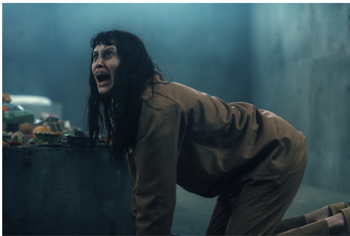
Vale tempo de tela: produção honra seu precedente e traz novas variáveis à equação

personagens. Não é possível, a princípio, saber a distância temporal entre o primeiro e o segundo, mas são perceptíveis algumas mudanças comportamentais na relação entre os níveis do poço. Há uma tentativa maior de civilidade, que parte, entre os níveis, de um "telefone-sem-fio" para que as refeições cheguem o mais profundo possível. Funciona? Resposta: mais-ou-menos. Um frágil elo nessa delicada organização instituída na confiança meramente apalavrada e desaba o castelo de cartas.