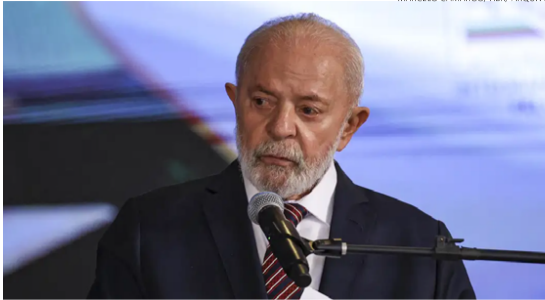
Só deve despachar a partir de hoje: Lula está em casa, mas segue em observação clínica

Ele agora está em casa, mas permanece em observação. Deve despachar normalmente na segunda, 21. Lula vai participar da reunião do Brics por videoconferência. Ele está reunido neste domingo com o chanceler Mauro Vieira para discutir a operacionalização e