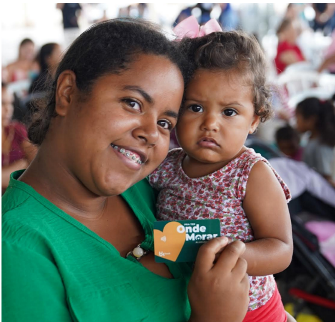
O Aluguel Social é um benefício de R$ 350 concedido por 18 meses para pagamento de aluguel

O Aluguel Social tem capacidade de beneficiar cerca de 40 mil famílias ao mesmo tempo. Depois que se inscreverem, interessados devem aguardar convocação para entregar a documentação. "O programa foca especialmente em famílias em situação de moradia improvisada, mulheres em situação de violência, idosos, pessoas com deficiência, família só com pai ou só com mãe (monoparental), bolsista do Probem ou estudante da UEG", pontua o secretário estadual da Infraestrutura, Pedro Sales.