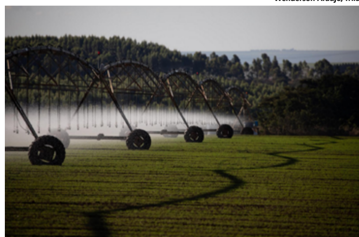
Abertas as inscrições para o Goiás Agritech Challenge: Israel Edition, evento que busca fomentar soluções tecnológicas inovadoras para o uso eficiente e reaproveitamento

A participação no desafio deve ser formalizada exclusivamente pelo site oficial https://www.growingil.org/goiasisraelagritechchallenge entre 22 de janeiro e 23 de fevereiro de 2025. Os interessados devem preencher o formulário de registro e anexar os documentos obrigatórios, como o relatório técnico, o portfólio da empresa e a apresentação do projeto em formato PDF.