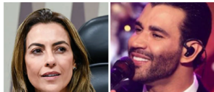
Soraya Thronicke e Gustavo Lima: CPI das Bets do Senado