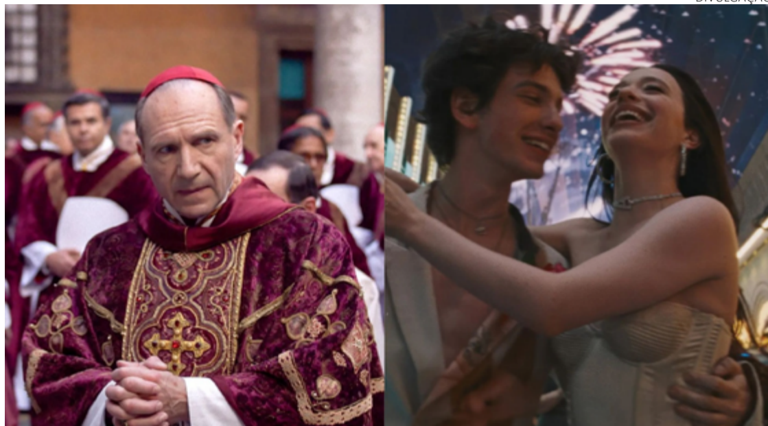
American Film Institute incluiu ambos os longas dentre os dez melhores do ano passado

"Anora" é escrito e dirigido por Sean Baker ('Projeto Flórida') e estrela Mikey Madison ('Pânico 5') como Ani, uma