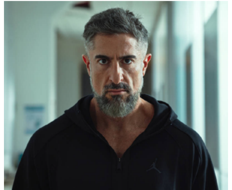
Marcos Mion interpreta lutador em 'MMA: Meu Melhor Amigo'