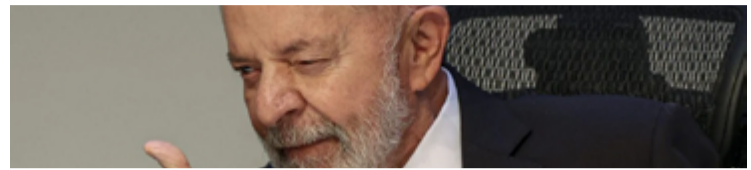
Lula da Silva: relação republicana com o governo dos Estados Unidos

Em nota, Palácio do Planalto diz que espera eu os norte-americanos continuem a ser parceiros históricos do Brasil