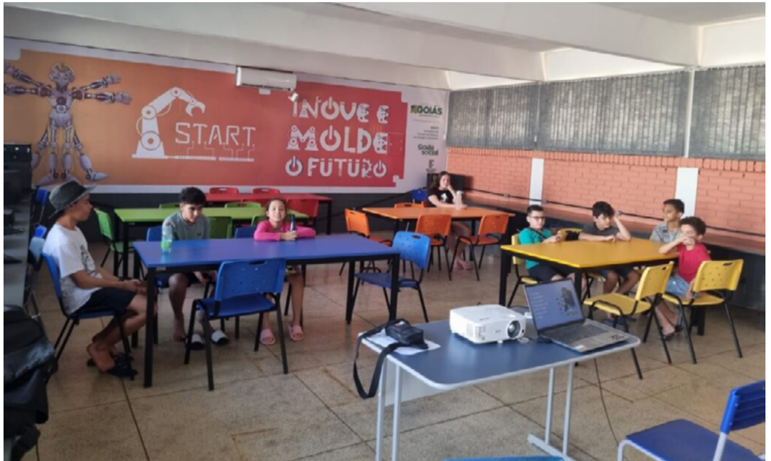
Governo de Goiás oferece curso de robótica gratuito em Cristalina, Luziânia, Pirenópolis, Santo Antônio do Descoberto e Valparaíso de Goiás

O curso oferece aulas de robótica, impressoras 3D, drones e outras tecnologias avançadas, e faz parte das ações do Goiás Social, programa do governo estadual liderado pela primeira-dama Gracinha Caiado, que visa combater a pobreza extrema e promover a inclusão social. Com laboratórios de última geração, o curso é realizado em três módulos de ensino – introdutório, intermediário e avançado – com foco no desenvolvimento de projetos tecnológicos e soluções inovadoras para