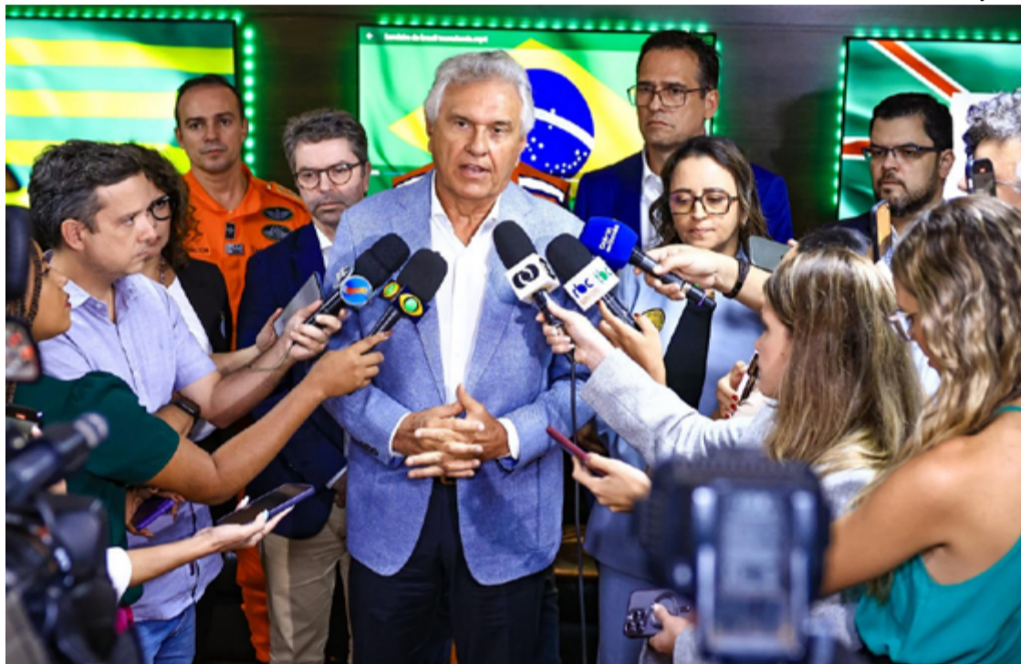
Governador Ronaldo Caiado durante reunião com prefeitos, autoridades e profissionais da área de saúde com o objetivo de intensificar o combate à dengue no estado

Para Gracinha Caiado, o manejo correto do lixo também é essencial. “Isso merece a atenção de todos. Precisamos ir além da recomposição das equipes de agentes e cobrir todo o município. O lixo