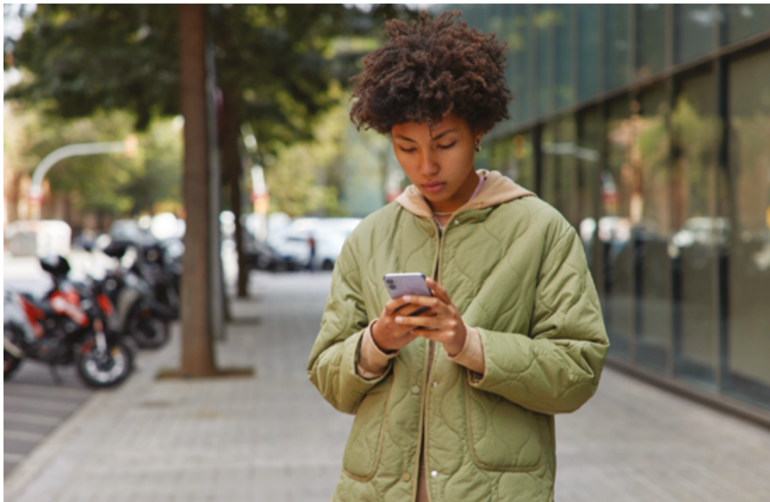
Consumo excessivo de notícias negativas traz efeitos psicológicos para as pessoas