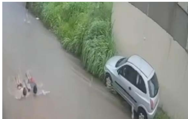
Imagens mostram os jovens se divertindo na enxurrada