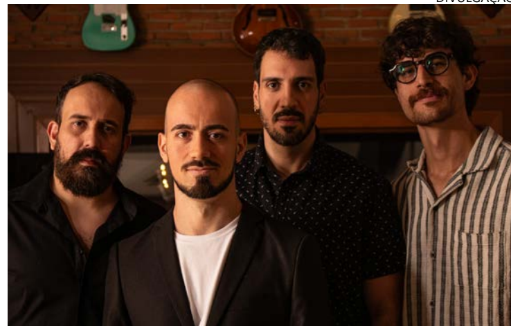
Grupo revisitará clássicos da música em apresentação