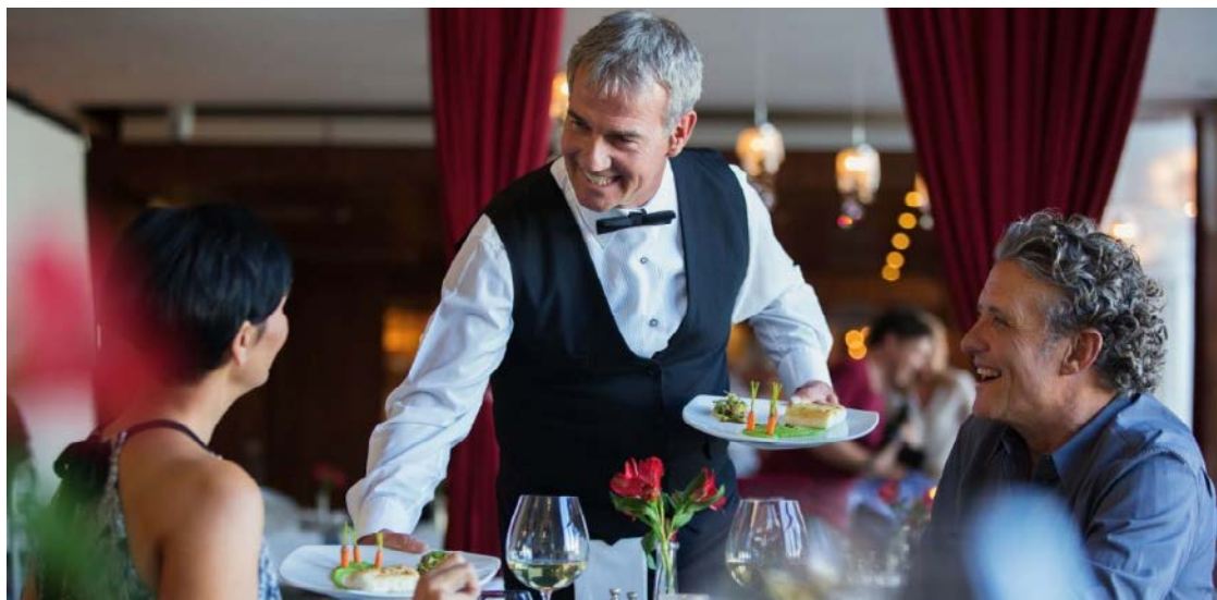
Forma como a comida é servida desempenha papel crucial: mesa torna-se obra de arte

Do requinte cerimonioso dos banquetes à descontração dos encontros familiares, desvendamos os segredos dos serviços formal e informal