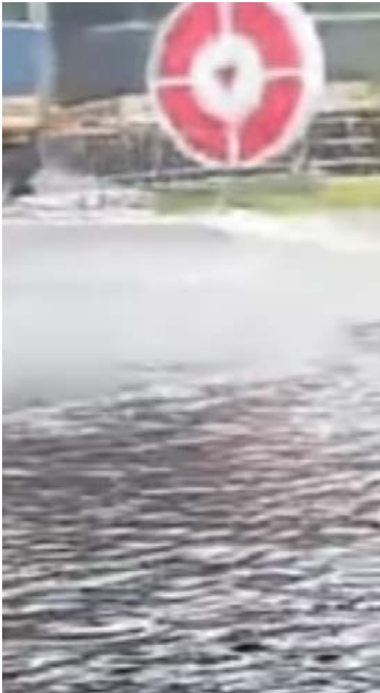
Chuva forte na segunda-feira provocou alagamento no Terminal da Praça da Bíblia

Em nota, a Secretaria Municipal de Infraestrutura Urbana informou que equipes técnicas acompanham a situação no Terminal Praça da Bíblia para identificar as causas dos alagamentos e definir soluções. Já a Secretaria Municipal de Saúde comunicou o envio de equipes de manutenção ao Centro de Saúde da Família São Judas Tadeu para realizar os reparos necessários após os transtornos causados pelas chuvas.