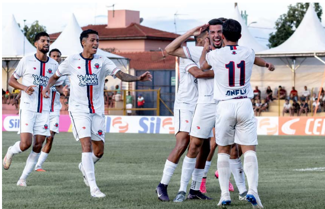
Guanabara City venceu o Vasco por 3 a 1, em Cravinhos-SP pela Copa São Paulo

Apesar do volume de jogo do time carioca, o sistema defensivo do Guanabara se manteve organizado. A equipe apostou em saídas rápidas e bolas paradas para equilibrar as