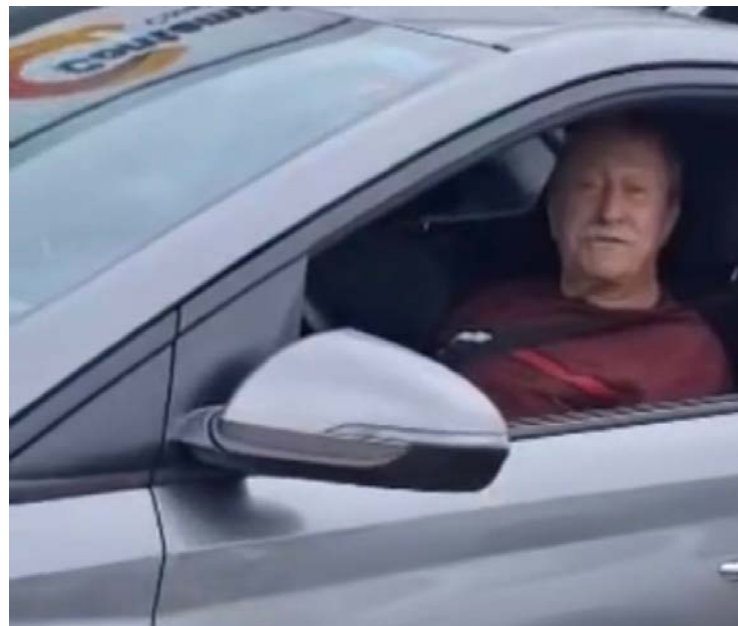
Senhor de idade ofende motociclista com insultos raciais

Um conflito entre um motorista e um motociclista nas proximidades do Senai, em Anápolis, terminou em um grave episódio de racismo