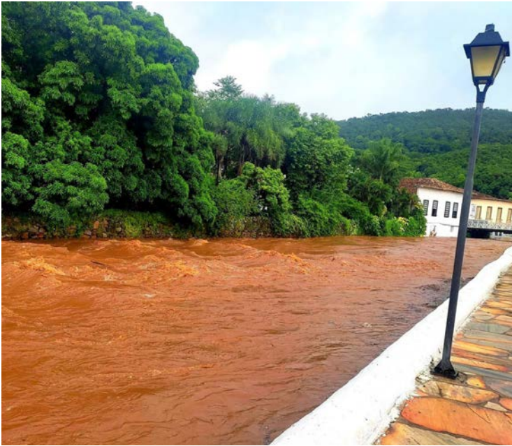
Vídeos divulgados nas redes sociais mostram a água avançando região.

O rio, que atravessa o centro histórico da cidade, provocou enxurradas e ameaça de alagamentos em caso de cheia repentina. Vídeos divulgados nas redes sociais mostram a água avançando e atingindo áreas próximas às ruas, o que reforçou o alerta para moradores e visitantes da