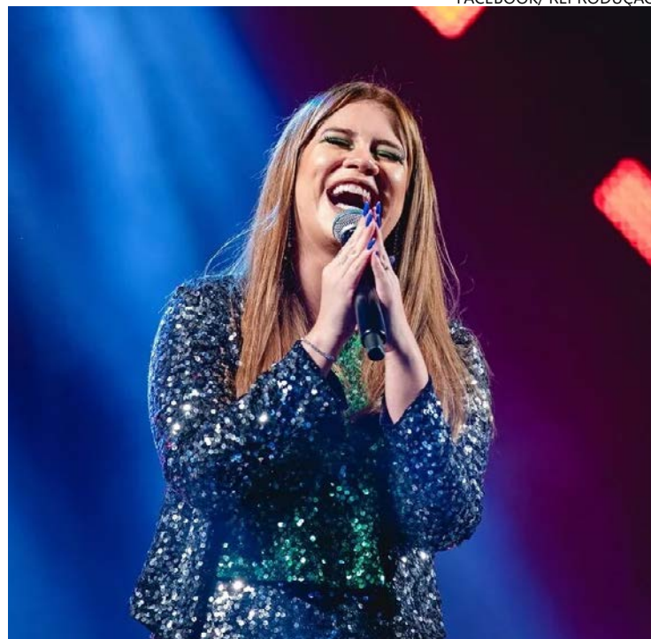
Lançamento: goiana mata a saudade dos fãs no próximo dia 15