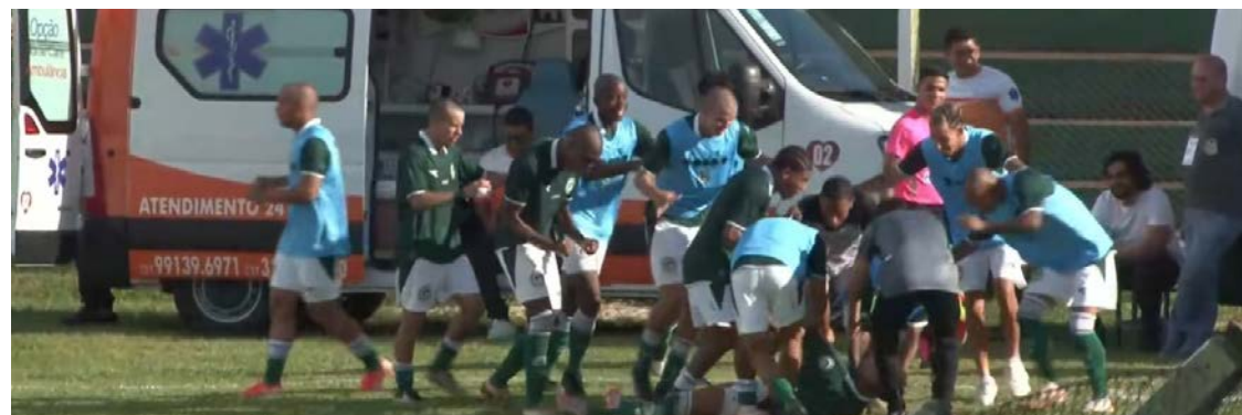
Duelo foi marcado por alternância de momentos e equilíbrio no meio-campo