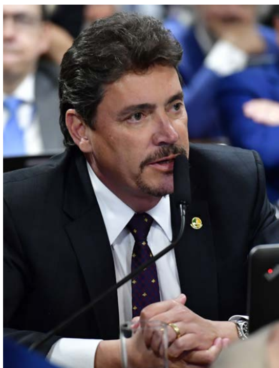
Senador Wilder Moraes (PL)