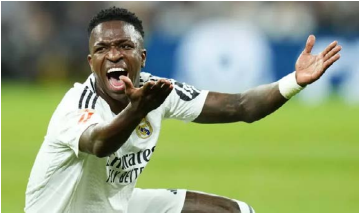
Vini Jr. teria feito críticas ao companheiro de ataque Gonzalo García