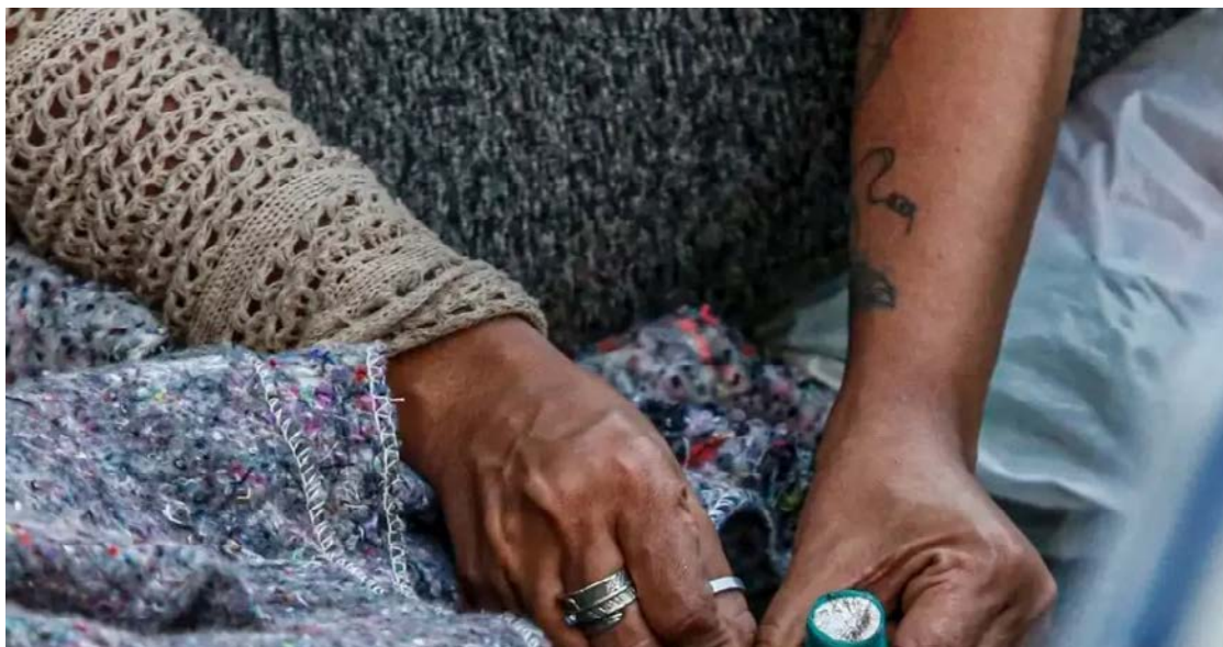
Uso de drogas segue como grave problema social no país: políticos querem penas maiores

Para a PEC, a previsão futura, ao menos neste ano, é a gaveta. Críticos veem o Congresso tentando evitar mais desgaste