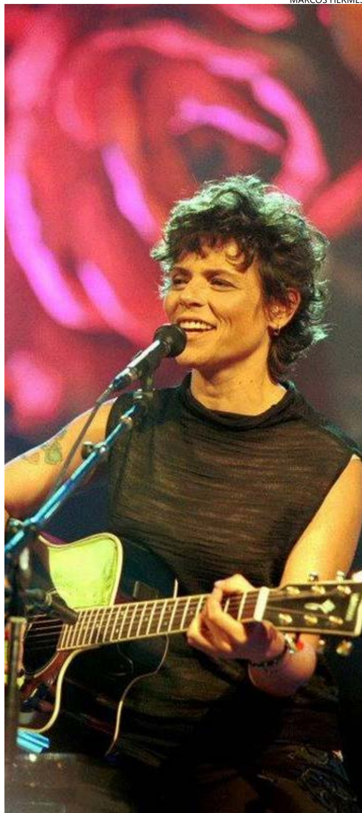
Por dentro de Cássia: cantora emerge em narrativa a partir de sua faceta de artista popular, talentosa e homoafetiva