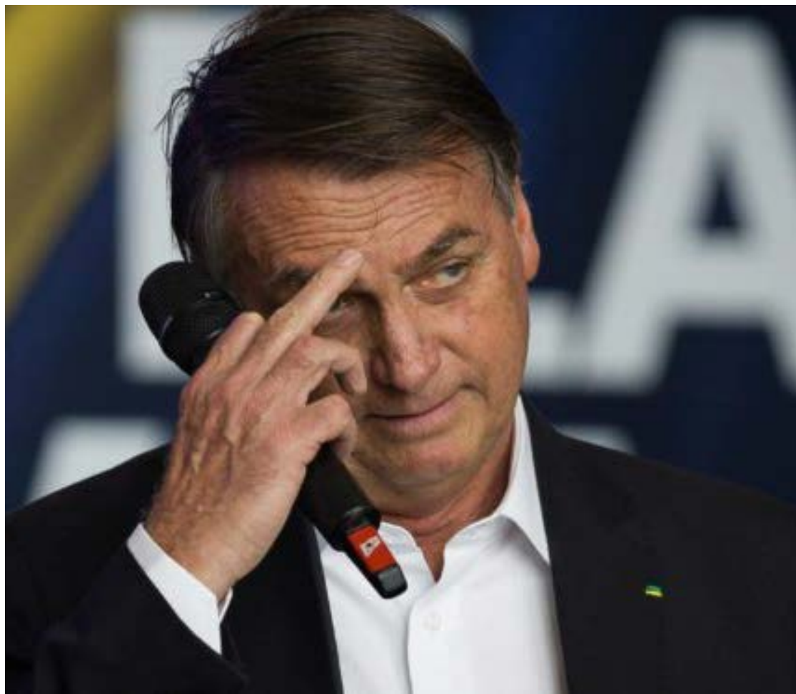
Bolsonaro sofreu queda e bateu com a cabeça, tendo apenas ferimentos leves

"Diante da urgência e gravidade do quadro, requer seja desde logo autorizada a imediata remoção do paciente ao