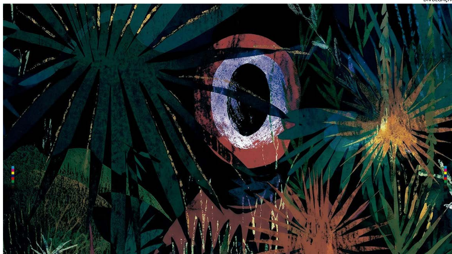
Filme acompanha irmãos Kala e Gauh, adolescentes que se veem em um cenário no qual a Humanidade é extinta após catástrofes

Curta acompanha dois adolescentes em um planeta devastado para discutir sustentabilidade e preservação ambiental com linguagem voltada ao público infantojuvenil. Produção estreia na sexta