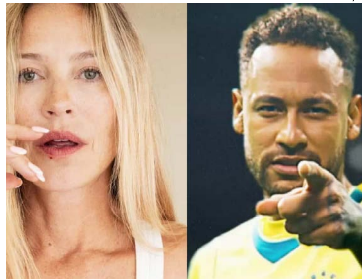
Artista questiona convocação do jogador brasileiro