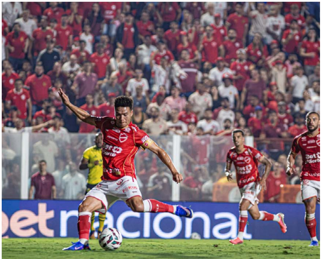
Vila Nova vence São Bernardo por 2 a 1 e reassume liderança da Série B