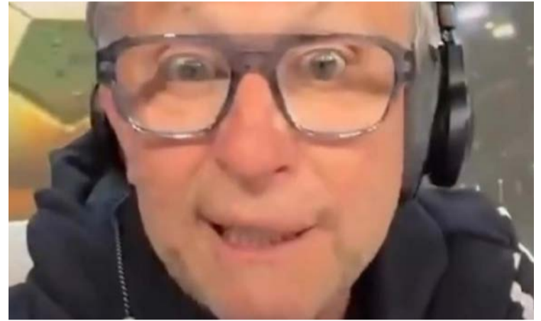
Neto: "cambada de Zé Ruela" e "jogadorzinho medíocre"