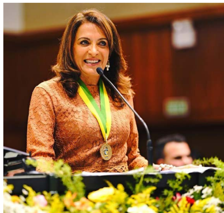
Gracinha Caiado tem liderança folgada na disputa ao Senado

Vanderlan aparece em segundo lugar com 25,8%, seguido por Gustavo Gayer e Zacharias Calil