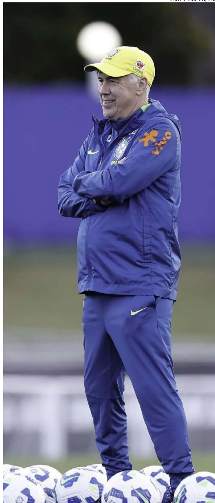
CBF reconhece erros de Carlo Ancelotti na Copa do Mundo

Apostamos no contra-ataque. Assim, a Seleção criou três ou quatro chances de gol. Todas desperdiçadas. O roteiro, um tanto trágico, começou a ser redigido cedo: Bruno Guimarães desperdiçou um pênalti. Igualou-se a Zico, o craque que errara contra a França em 1986.