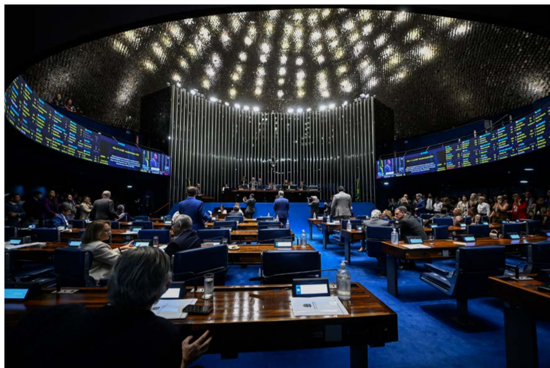
Plenário do Supremo Tribunal Federal: juízes não atendem decisões do STF

Parcelas extintas na decisão de março do STF foram