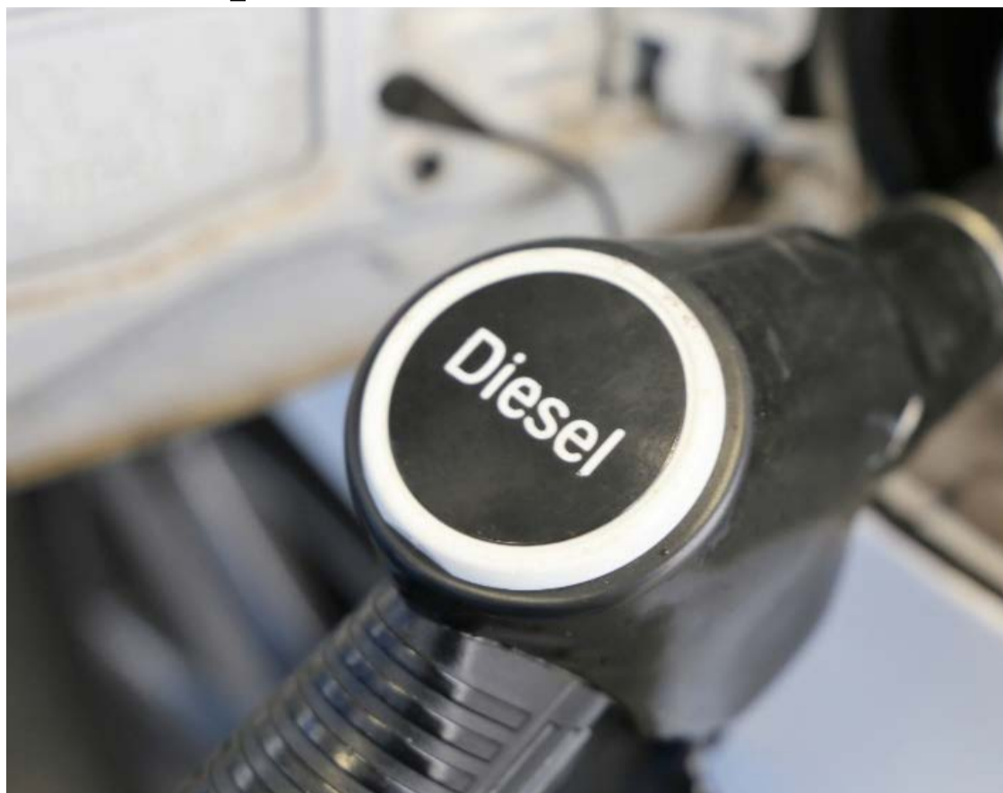
Regulamentação define critérios para a aplicação da isenção do ICMS sobre o diesel utilizado pela concessionária do transporte coletivo de Anápolis

O decreto determina que a isenção será aplicada apenas sobre a quantidade de diesel correspondente à quota mensal fixada pela Agência Goiana de Regulação, Controle e Fiscalização de Serviços Públicos (AGR), responsável por estabelecer o limite de consumo contemplado pelo benefício.