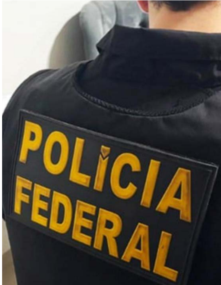
Operação Vêu de Meia apura esquema de lavagem de dinheiro ligado à exploração ilegal de apostas

Além da lavagem de dinheiro, a PF investiga a possível remessa irregular de valores ao exterior por meio de criptoativos. A investigação teve início após informações repassadas pela Secretaria de Prêmios e Apostas (SPA), do Ministério da Fazenda, que indicaram a atuação do grupo criminoso. Em Goiás, duas pessoas são alvo da investigação.