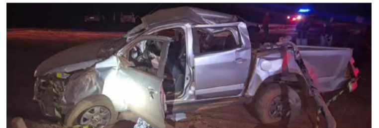
Agentes aplicaram 468 multas por diversas infrações de trânsito