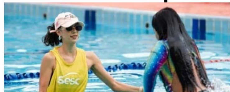
Projeto procura efetivar o lazer inclusivo e fortalecer os vínculos dos jovens