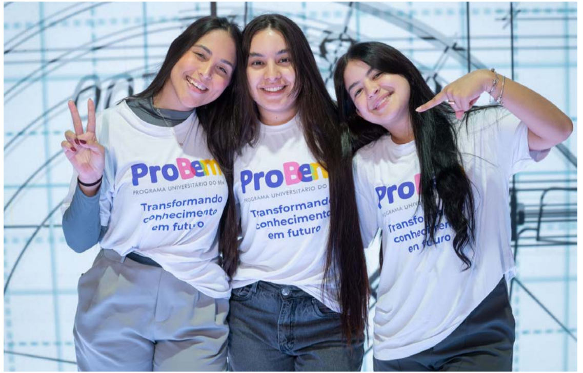
OVG presta 8,1 milhões de atendimentos em 2025 nos 246 municípios goianos

Em integração com o Goiás Social, a OVG realizou atendimento presencial em comunidades do estado, com 22 mil benefícios entregues em 29 ações, por meio da unidade itinerante OVG Perto de Você. Programas como Meninas de Luz, Centro da Juventude Tecendo o Futuro e unidades de atendimento à pessoa idosa (Centros de Idosos Vila Vida, Centro de Idosos Sagrada Família e Espaços