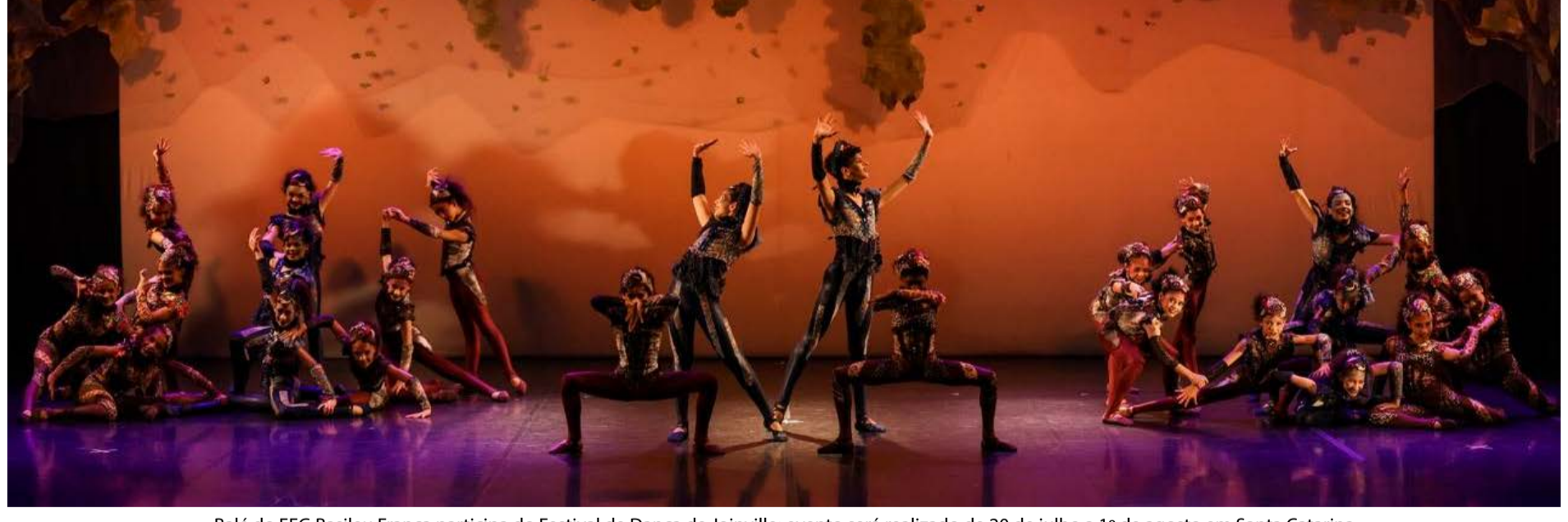
Balé do EFG Basileu França participa do Festival de Dança de Joinville: evento será realizado de 20 de julho a 1º de agosto em Santa Catarina

Ricardo Vinicius O balé da Escola do Futuro de Goiás em Artes Basileu França foi escolhido para abrir o Festival de Dança de Joinville, considerado o maior do mundo. A apresentação ocorre em 20 de julho, na noite inaugural do evento. O convite vem após uma sequência de resultados expressivos. O grupo conquistou quatro vezes a principal categoria da competição, de Melhor Grupo, incluindo o tricampeonato entre 2023 e