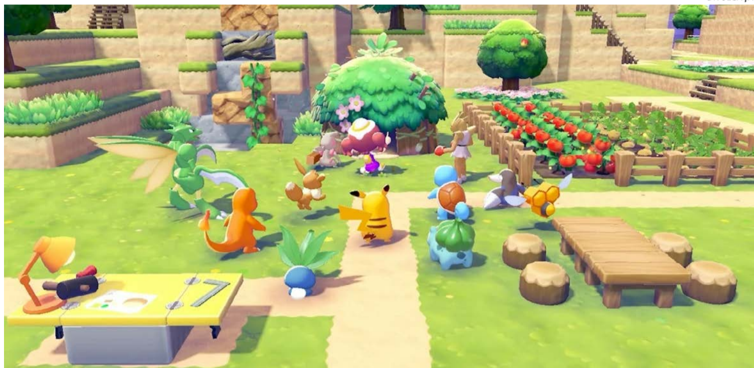
Mapa é construído por cubos de diferentes materiais, que podem ser destruídos e colocados em outro local

Mesmo sem inovar, jogo diverte, cativa e cumpre a sua principal proposta — fazer o jogador trocar agruras do mundo real pela vida de um pokémon selvagem. Ou seja, trata-se de um bom passatempo para qualquer idade