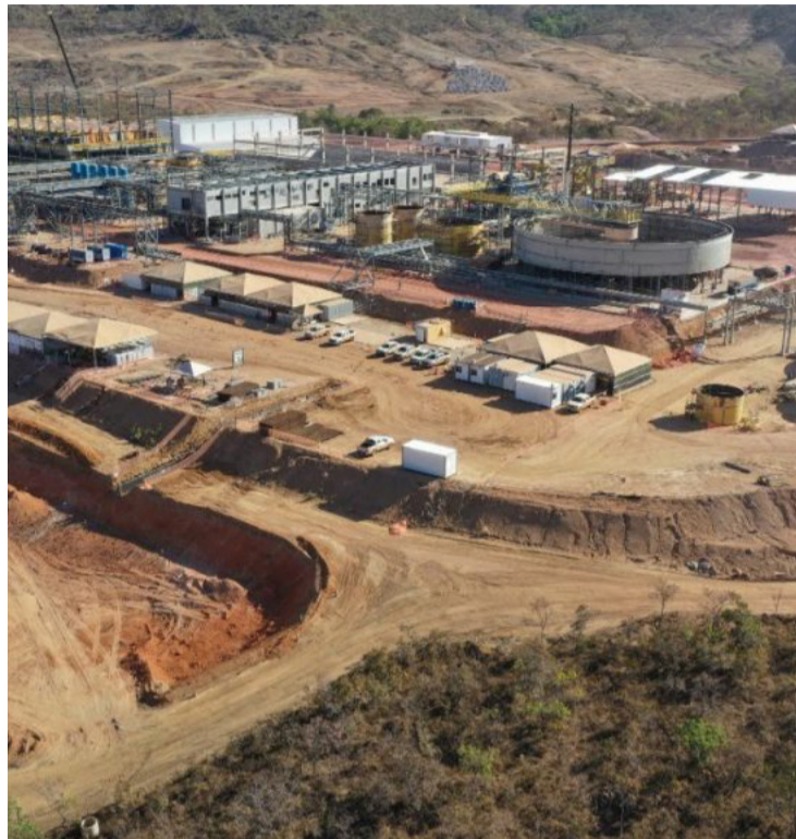
Mineradora Serra Verde, estabelecida em Minaçu, Goiás, atrai interesse dos EUA

A mina Pela Ema, da Serra Verde, tem atraído crescente interesse de governos e compradores em todo o mundo, por ser uma das únicas produtoras de terras raras pesadas fora da China. Entre os minerais produzidos, destacam-se disprósio e térbio, consi-