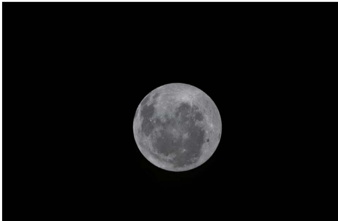
Registro mostra uma parte da bacia Oriental, algo nunca antes observado diretamente por seres humanos

A tripulação é composta pelos astronautas Reid