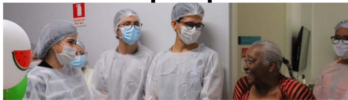
Paciente celebra um novo recomeço com um café da manhã após alta hospitalar