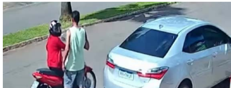
Motociclista e pedestre foram violentamente atingidos pelo veículo