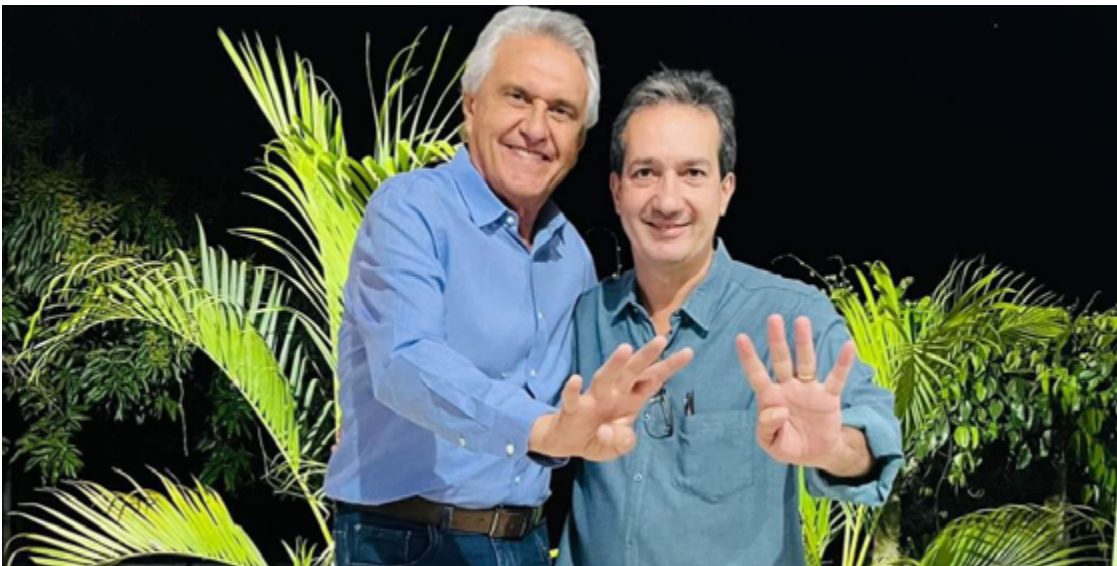
Ronaldo Caiado e Haroldo Naves: mobilização dos prefeitos em favor da campanha presidencial

Haroldo Naves aponta ainda os cinco mandatos de Ronaldo Caiado como deputado federal e um como senador da República como “exemplos de atuação política” em favor do País. E completa: “Caiado é líder político pronto, preparado para comandar o Brasil. Tem as melhores ideias para execução de plano de governo ousado, moderno, inovador”.