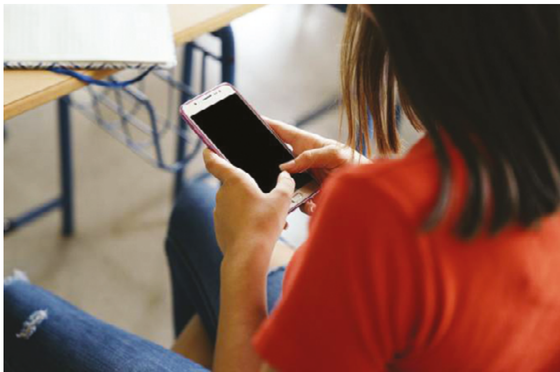
Unesco: evidências de que uso excessivo de telefones celulares está ligado a um desempenho educacional reduzido

“Foram eles que propuseram as regras, nada imposto pelo Juizado da Infância. Pelo contrário. Dentro dessa carta, uma das coisas que tem é a proibição do uso do celular na escola. Houve só uma permissão, que era quando os professores autorizassem para alguma pesquisa em sala de aula”, conclui o juiz.