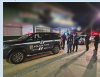
Operação contou com agentes especializados que, em dois dias, fiscalizaram pontos estratégicos

O motorista abordado nessa situação é preso em flagrante e encaminhado à polícia judiciária. As penalidades para o crime de "embriaguez" ao volante são de detenção, de seis meses a três anos, multa e suspensão ou proibição de se obter a permissão ou a habilitação para dirigir veículo automotor.