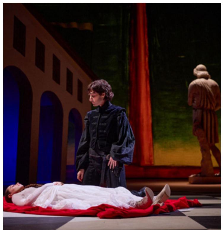
Jovem atriz assume identidade masculina para atuar em clássico de William Shakespeare

Romeu e Julieta. Uma jovem atriz é rejeitada para fazer o papel de Julieta em uma peça de teatro. Com ajuda de uma