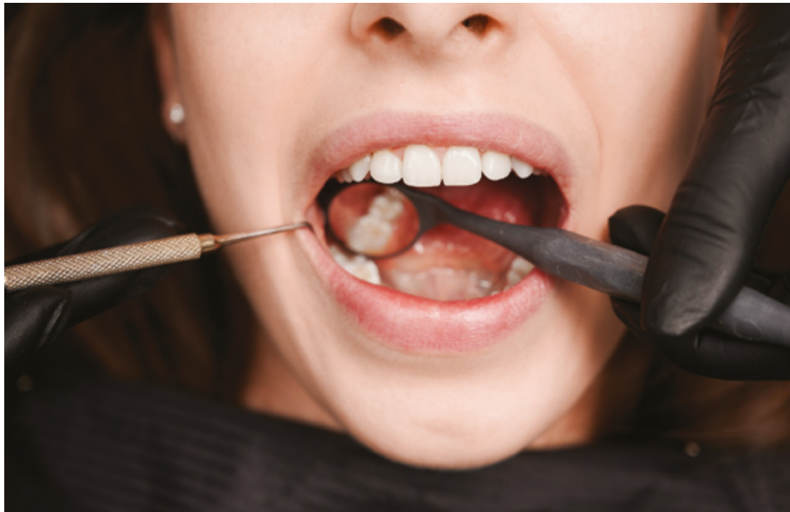
Medidas podem reduzir o risco de câncer: visitar o dentista regularmente, não fumar, evitar álcool, boa higiene bucal

A especialista explica também sobre os sinais da enfermidade, que no início não doem. "Uma das dificuldades no diagnóstico precoce do câncer bucal é que nos estágios iniciais não há sintomas de dor e quando vão ao dentista já está em estágio avançado. Porém, existem sinais de que