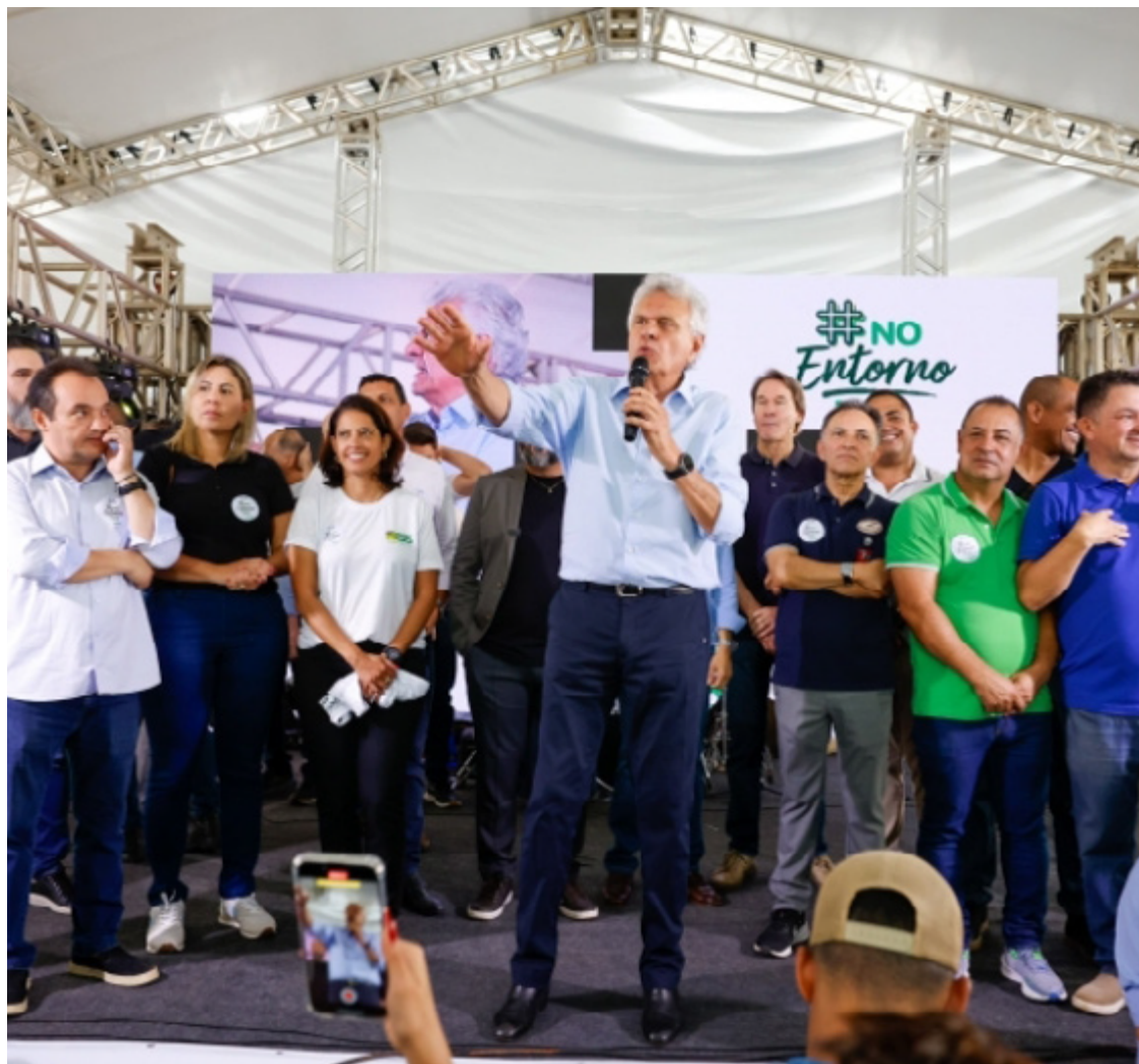
Ronaldo Caiado participa de 2ª Feira #NoEntornoTem, em Brasília: evento fortalece cultura e economia local

Com uma área de lazer para crianças e opções gastronômicas variadas, a feira reforça o potencial de desenvolvimento da região. “O Entorno é uma potência, um cinturão de desenvolvimento”, afirmou Caroline Fleury, secretária do Entorno do DF.