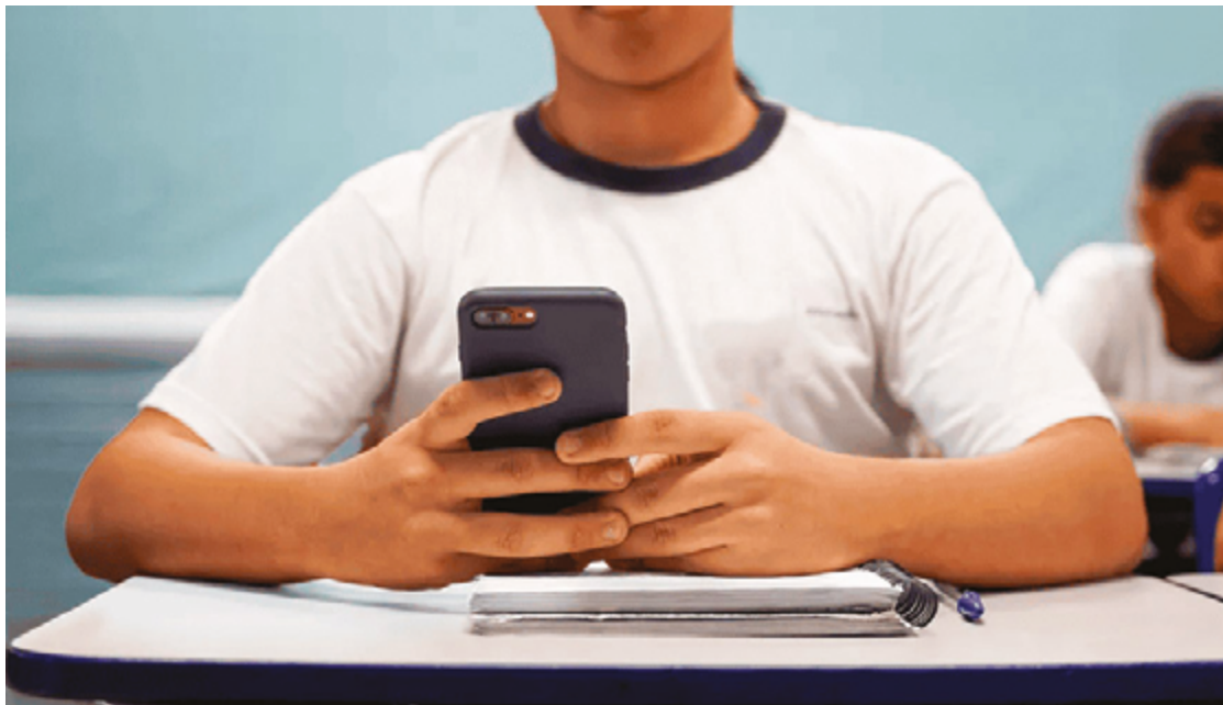
Oito em cada 10 alunos brasileiros de 15 anos disseram que se distraem com o uso de celulares nas aulas de matemática

O debate na Câmara trata de um substitutivo do relator da matéria, o deputado Diego Garcia (Republicanos-PR). Além de proibir o uso, o texto proíbe também o porte de celular por alunos da educação infantil e dos anos iniciais do