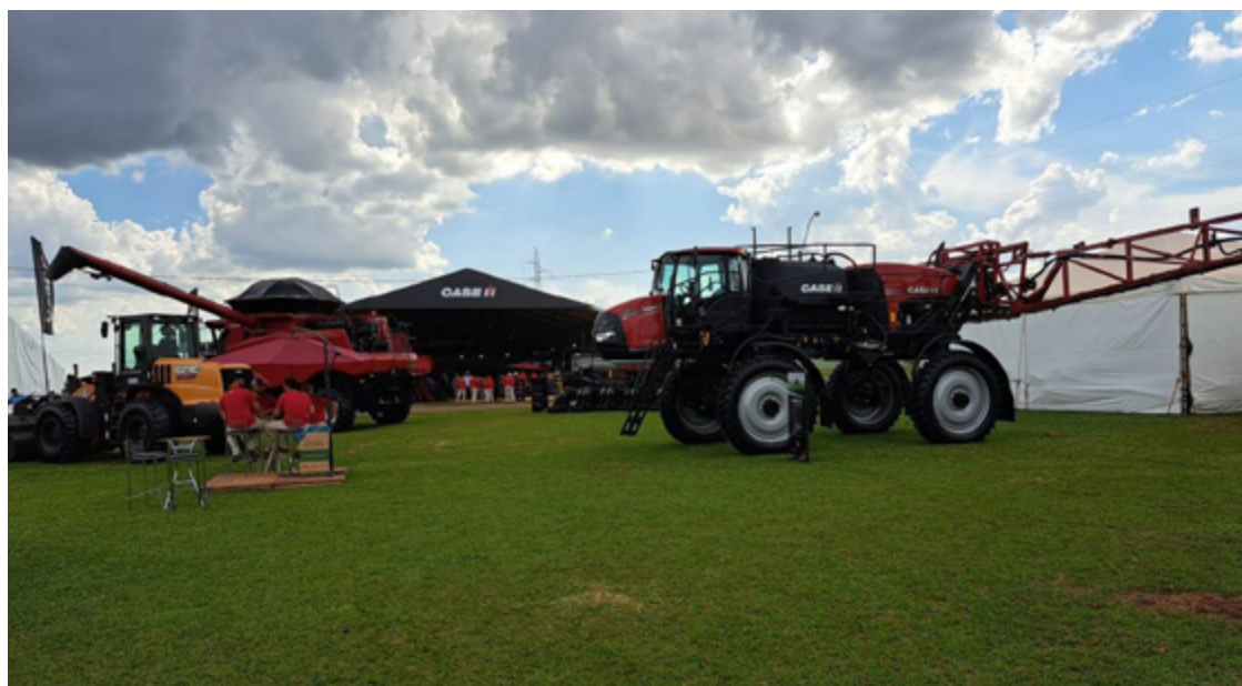
Escassez de gente especializada é sentida em diversos segmentos: cursos favorecem a análise dos dados

A carência de mão de obra qualificada é constatada em todo o País. Enquanto a produtividade americana é cinco vezes superior à brasileira, isso se deve, em parte, ao uso intensivo de equipamentos e máquinas na construção. No meio rural o problema é sentido não só em Goiás, mas na Bahia, São Paulo, Minas Gerais e Mato Grosso. No vale do São Francisco, onde o cultivo da uva prosperou, sente a di-