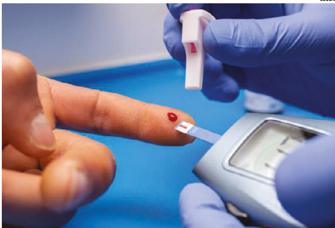
Em Anápolis, a campanha tem objetivo de reforçar a importância da prevenção e do controle do diabetes

Além disso, Larissa enfatiza que a falta de controle adequado pode levar a complicações