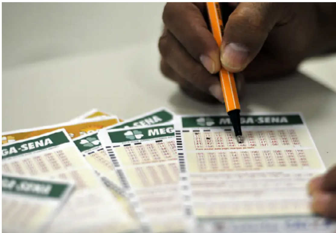
Milhares de jogadores devem tentar hoje a chance para vencer a Mega da Virada: prêmio pode ultrapassar R$ 600 milhões

Histórias trágicas e curiosas circundam a Virada. Em 2020, por exemplo, o prêmio de R$