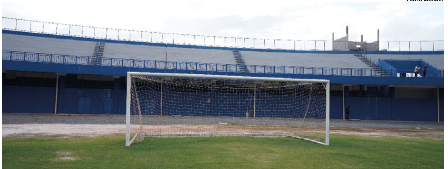
Acima, obras da arquibancada do JD, retomada e entregue pela atual gestão; abaixo, a 21ª Estação do Esporte entregue nesta gestão, no Laranjeiras

Ademais, os novos vestiários e banheiros proporcionarão mais conforto tanto para os jogadores quanto para a arbitragem, enquanto a área administrativa con-