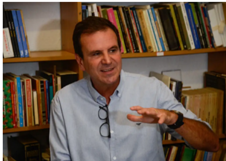
Eduardo Paes (Rio de Janeiro)