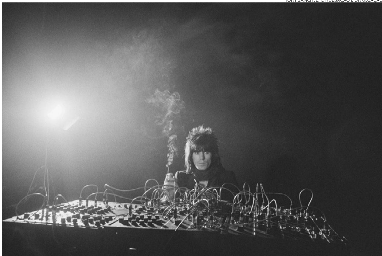
Keith Richards: guitarrista tem seus podres revelados por ex-fotógrafo dos Rolling Stones em livro que causou polêmica

“Uma biografia de Bob Dylan em Sete Canções” (Zain). A publicação é assinada pelo ensaísta Greil Marcus. Começa no início dos anos 1960 com “Blowin’ in the Wind”. “The Lonesome Death of Hattie Carroll”, “Ain’t Talkin’”, “The Ti-