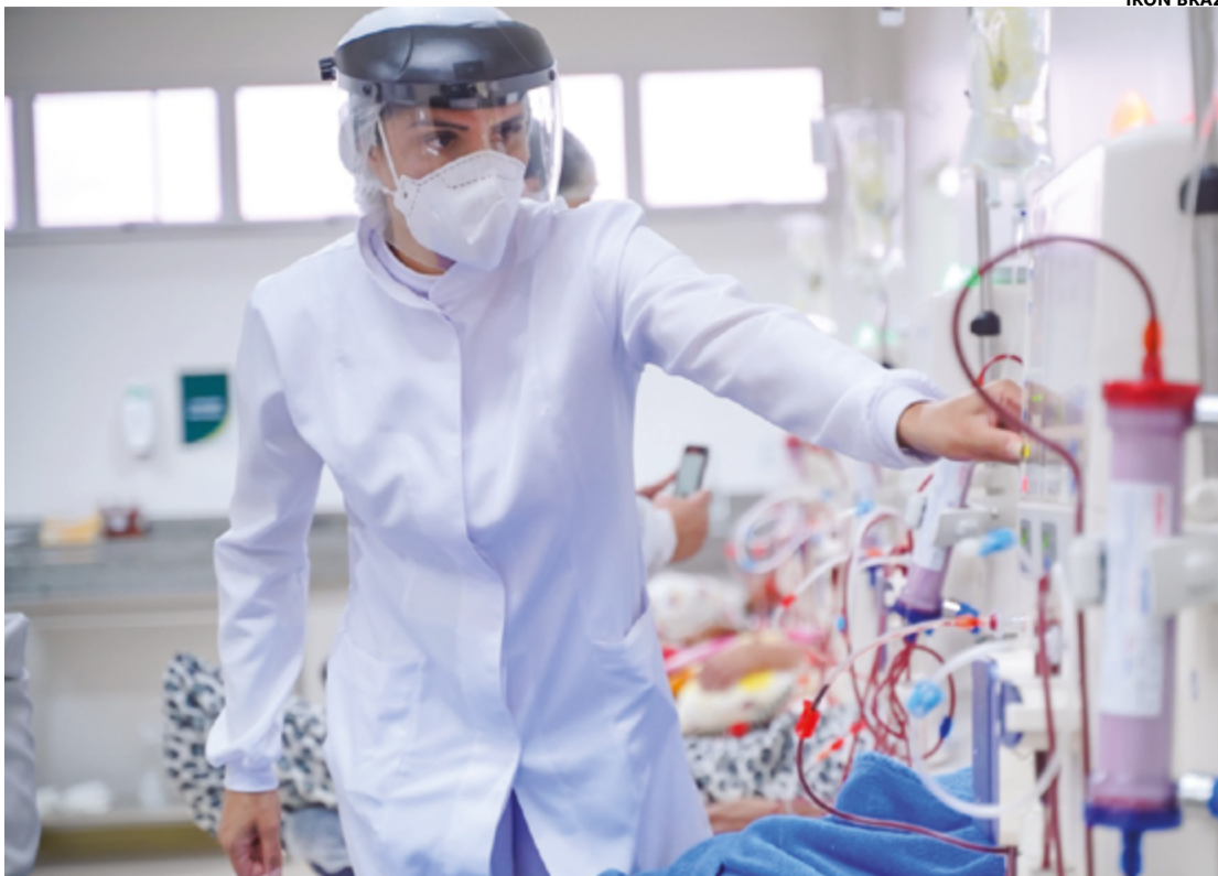
Implantadas no estado em 2020, as policlínicas oferecem consultas médicas especializadas e com equipe multiprofissional