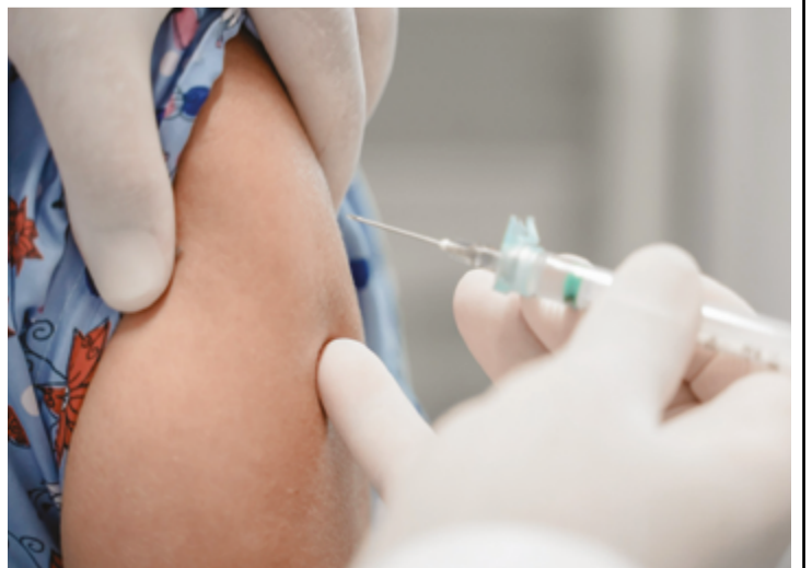
Dados preliminares das coberturas vacinais apontam que este ano a vacina Meningo C, por exemplo, chegou a 99,11% de cobertura em Goiás