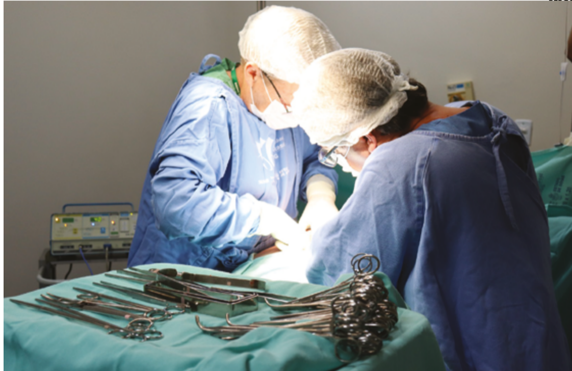
Hospitais do Governo de Goiás foram responsáveis por 40% dos procedimentos realizados durante o ano que termina

Apesar dos avanços, a recusa familiar continua sendo um dos principais entraves à ampliação das doações. Em 2024, o índice de recusa subiu