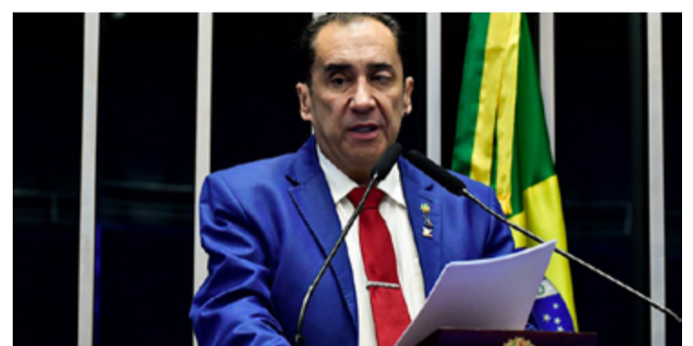
Jorge Kajuru: desmilitarização da política