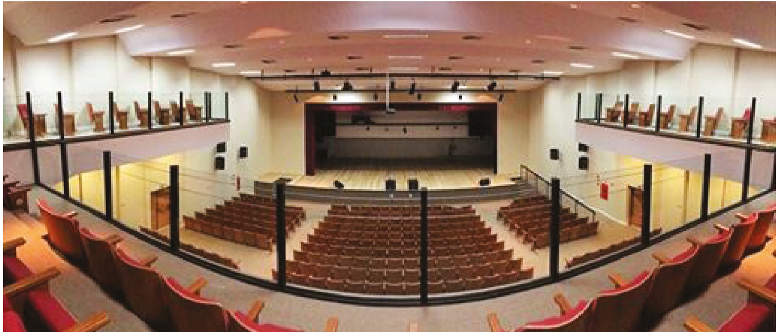
Atos serão realizados no Teatro São Francisco de Assis, a partir das 9 horas, com transmissão pela Manchester FM e Canal da TV Câmara no Youtube

Após a abertura e a execução dos hinos Nacional e de Anápolis, os vereadores eleitos entregam à secretaria da Mesa seus diplomas e declaração de bens. Em seguida, todos os vereadores ficam em pé e, com a mão estendida, fazem o termo de compromisso: "Prometo manter, defender e cumprir a Constituição Federal e a Constituição Estadual. Observar as leis, particularmente a Lei Orgânica do Município de Anápolis. Promover o bem coletivo e exercer com patriotismo, honestidade e espírito público o mandato que