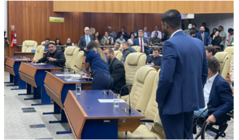
Vereadores encerram ano legislativo com sessão extra