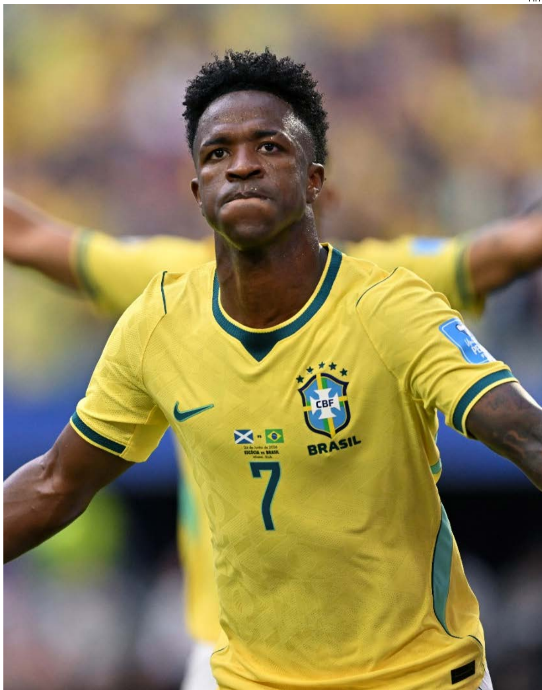
Como “O Homem Vitruviano”, do artista plástico Leonardo da Vinci: polímata do futebol

No filme, o cineasta Andrucha Waddington registra a insatisfação do atacante após o revés na Copa de 2022. Conversa com amigos e, de repente, fala sobre as escolhas do técnico Tite na partida contra a Croácia, pelas quartas de