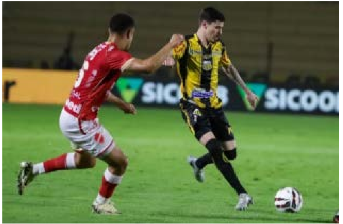
Vila Nova desperdiça chance de manter vantagem na ponta da Série B, sofre gol nos acréscimos e deixa liderança ameaçada