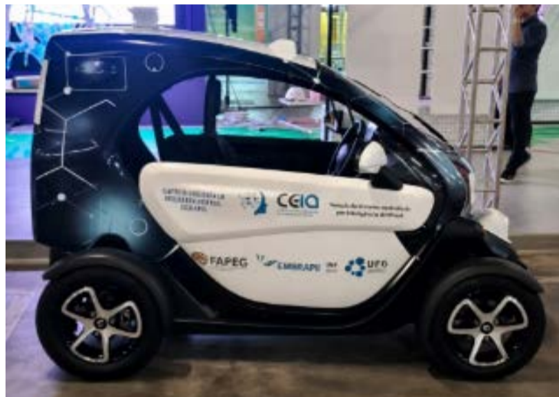
Renault Twizy de dois lugares da Ceia-UFG controlado por computador

Entidade reforça Goiás como polo nacional de inteligência artificial. Com apoio do Governo de Goiás, centro de excelência da UFG reúne 100 empresas parceiras. Novo investimento estadual de R$ 78 milhões ampliará pesquisas e infraestrutura. "Goiás está bem na frente de todos os Estados", afirma o governador Daniel Vilela. Dos R$ 78 milhões, R$ 40 milhões serão destinados à implantação de Data Center e laboratório de veículos autônomos. Unidade já realiza pesquisas com carros controlados totalmente por computadores. Página 08