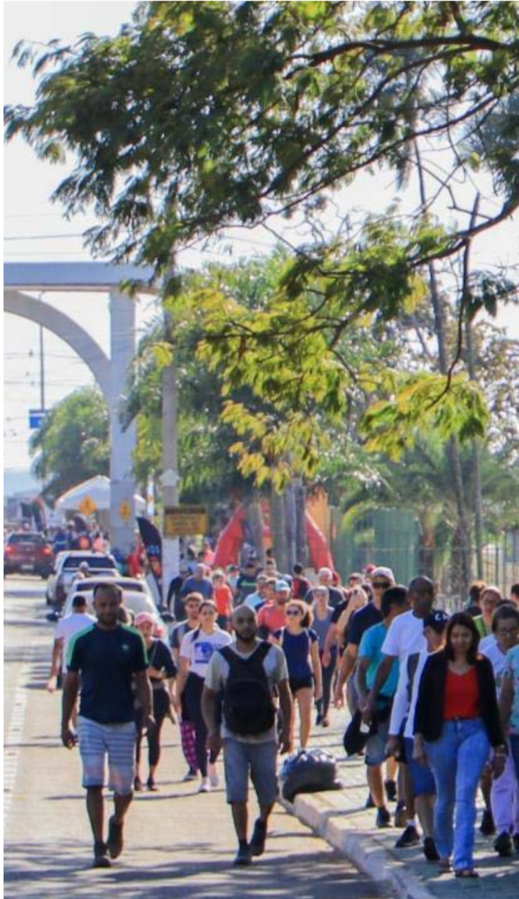
Evento religioso segue até 5 de julho e deve atrair cerca de 4 milhões de romeiros

A programação musical conta com Ana Castela e CountryBeat no dia 3 de julho, e Daniel com Rayane & Rafaela no dia 4. A retirada dos ingressos ocorre em três pontos: Setor Central (Secretaria Municipal