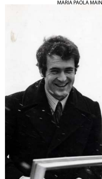
Bernardo Bertolucci dispensava conhecimento sobre o popular esporte

A maioria teria caído na gargalhada, mas Pasolini não —nem teria molhado os lábios numa gota daquele champanhe. A história é que ele se manteve em silêncio, desanimado com a derrota. Ainda assim, aquela partida conseguiu reconciliar os dois diretores novamente.