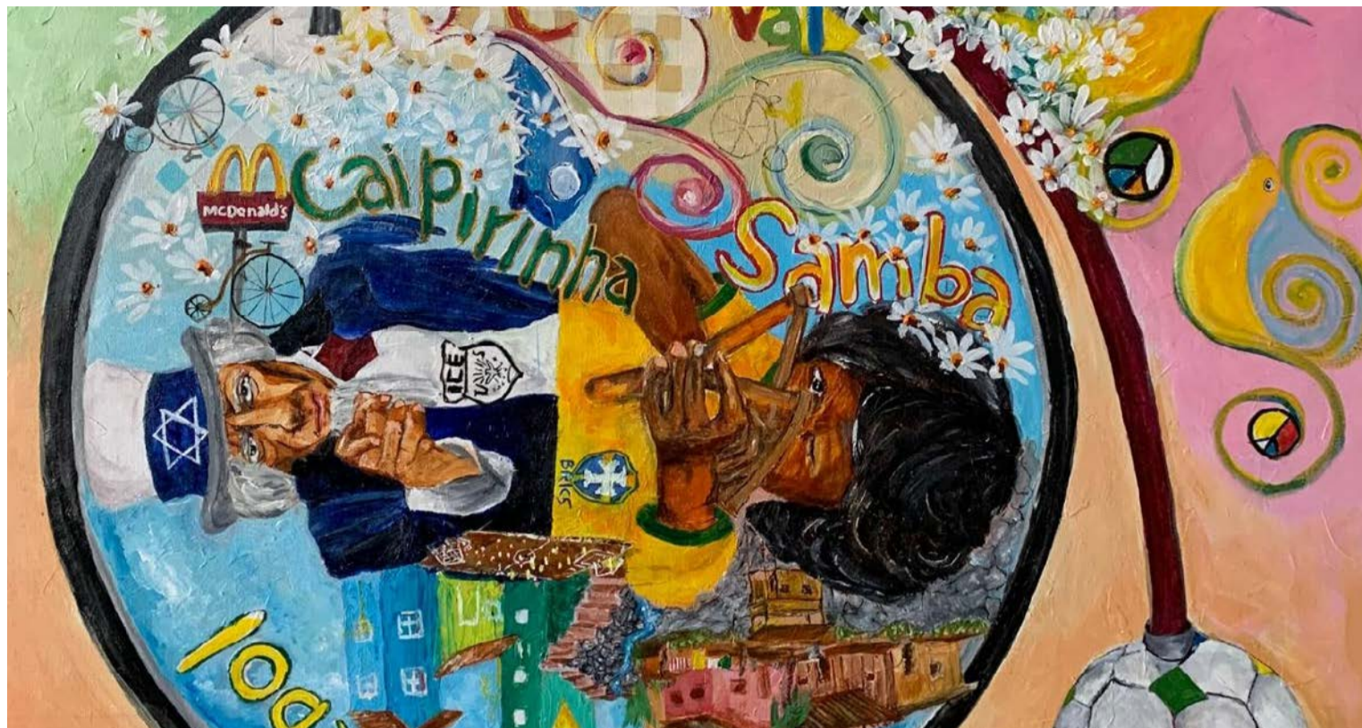
Cores e formas do jogo: obra do artista visual Pedro Galvão enfatiza sentimento coletivo durante Mundial