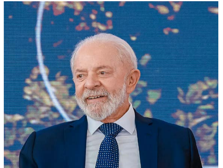
Presidente Lula construiu programa que reduz abandono escolar

Esse é o menor índice na redução desde 2007: Comparado com 2023, a redução total foi de 34%