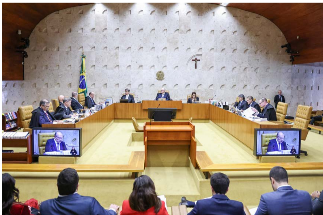
Ministros do STF durante sessão no plenário do Supremo: privilégios validados

mantida uma gratificação por exercício cumulativo de jurisdição, quando o juiz ou desembargador atua em mais de uma comarca. Essa verba já havia sido autorizada pela tese de março do STF.