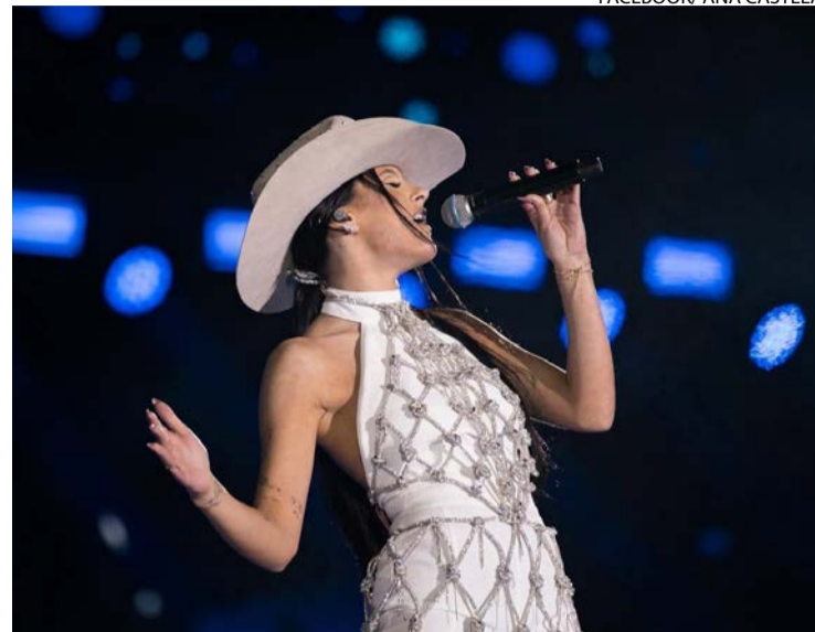
Boiadeira solta a voz na sexta-feira (3/7) em Trindade