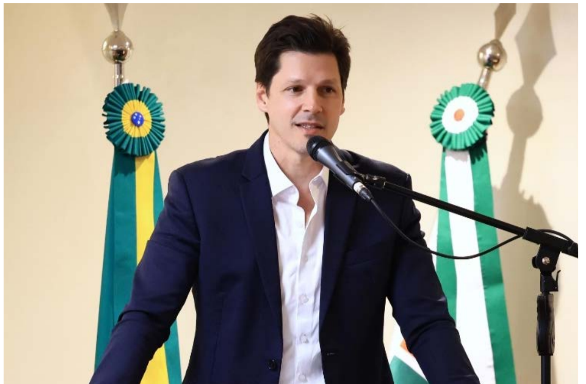
Daniel Vilela anuncia novo ciclo de investimentos no Ceia-UFG: fortalecimento de Goiás como referência em inteligência artificial

"Goiás está bem na frente de todos os Estados porque temos buscado trazer para cá parceiros estratégicos", afirmou o governador Daniel Vilela. Segundo ele, os novos investimentos vão ampliar a capacidade de pesquisa do centro, fortalecer o desenvolvimento de soluções para o governo e aumentar a projeção internacional da instituição. "Estamos muito otimistas de continuar fazendo de Goiás o Estado vanguardista na IA. Em breve, lançaremos o Distrito de Inovação de Inteligência Artificial", acrescentou.