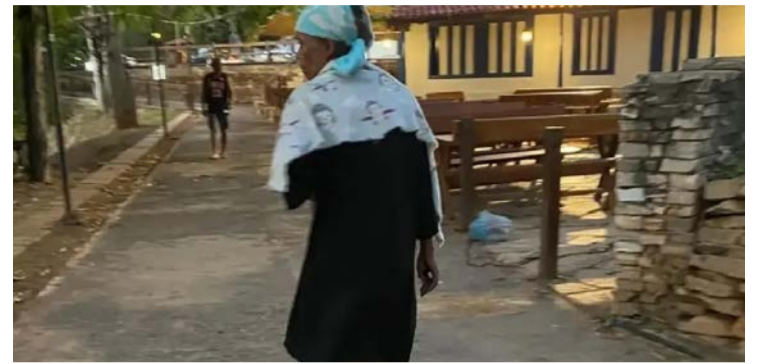
Empresário é preso por espancar mulher em situação de rua

Dono de restaurante teve a prisão mantida pela Justiça após passar por audiência de custódia