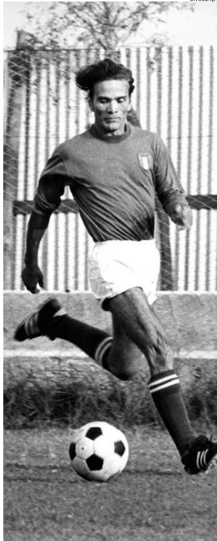
Diretor italiano Pier Paolo Pasolini via poesia e estética no jogo

Nos bastidores, na verdade, parte da equipe de Bernardo Bertolucci não estava animada com o jogo. Robert De Niro e Gérard Depardieu, protagonistas de "1900", e outros, não quiseram participar. Diante da falta dos atores e da inabilidade futebolística dos outros, a equipe de Bertolucci elaborou um plano —chamariam dois jovens jogadores da base do Parma e os disfarçariam como ferramenteiros do set.