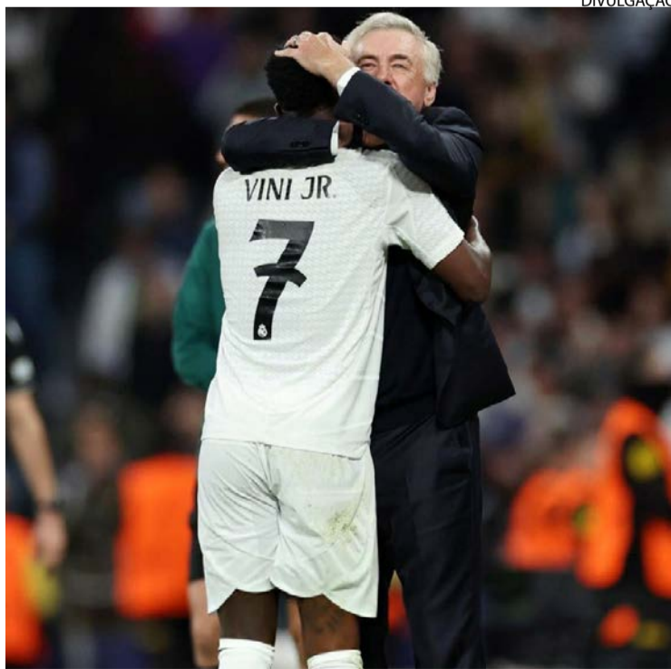
Craque saúda ‘mister’ italiano em confronto com a camisa do Real Madrid