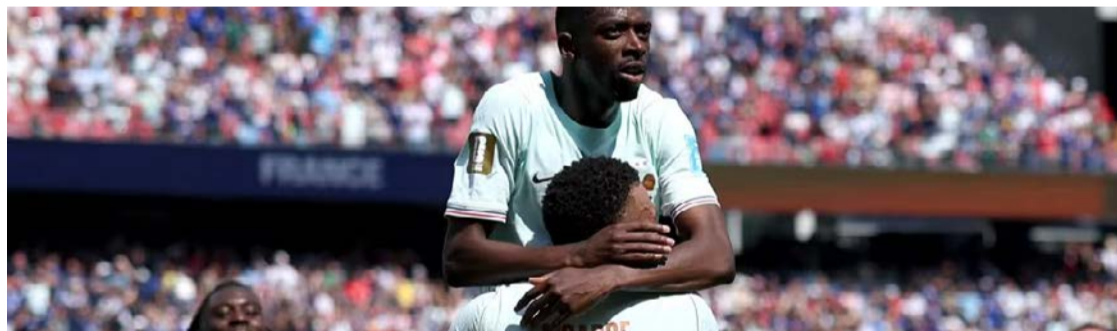
Dembélé dá show em vitória da França por 4 a 1 contra a Noruega