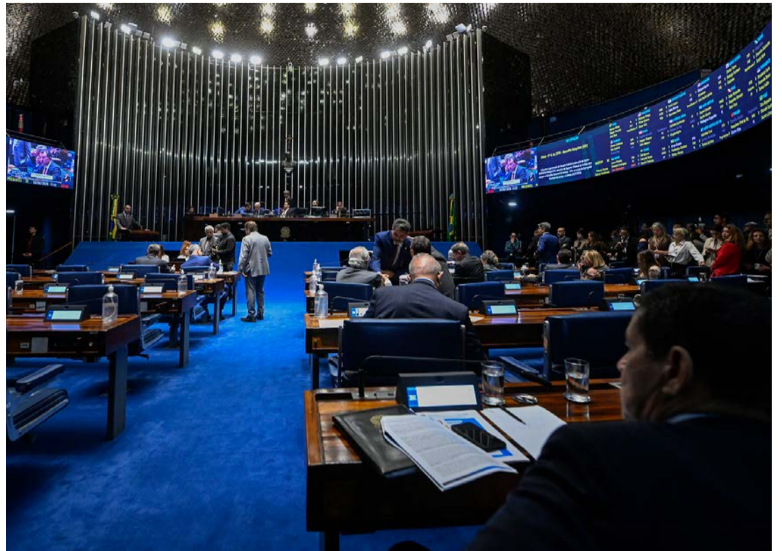
Senado é objeto de desejo de 45 deputados federais espalhados no país

A eleição para o Senado ganhou importância estratégica tanto para o governo quanto para a oposição. Aliados do ex-presidente Jair Bolsonaro trabalham para ampliar a bancada conservadora na Casa a partir de 2027, com o objetivo de influenciar votações de projetos, instalação de CPIs, escolha da Mesa Diretora e até eventuais processos de impeachment contra ministros do Supremo Tribunal Federal (STF). Como são necessárias maiorias