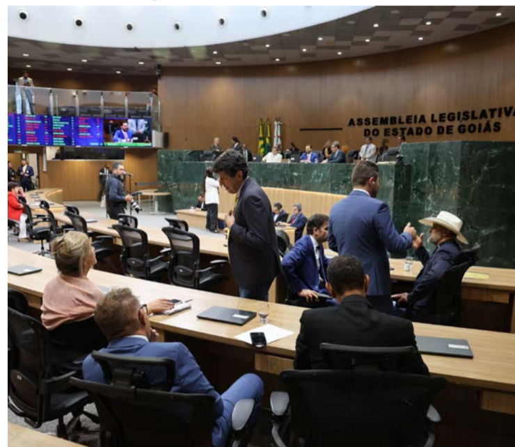
Deputados durante sessão na Alego: pacote de bondades aprovado

Projeto reformula a carreira de delegado e atualiza subsídios de agentes, escrivães e papiloscopistas