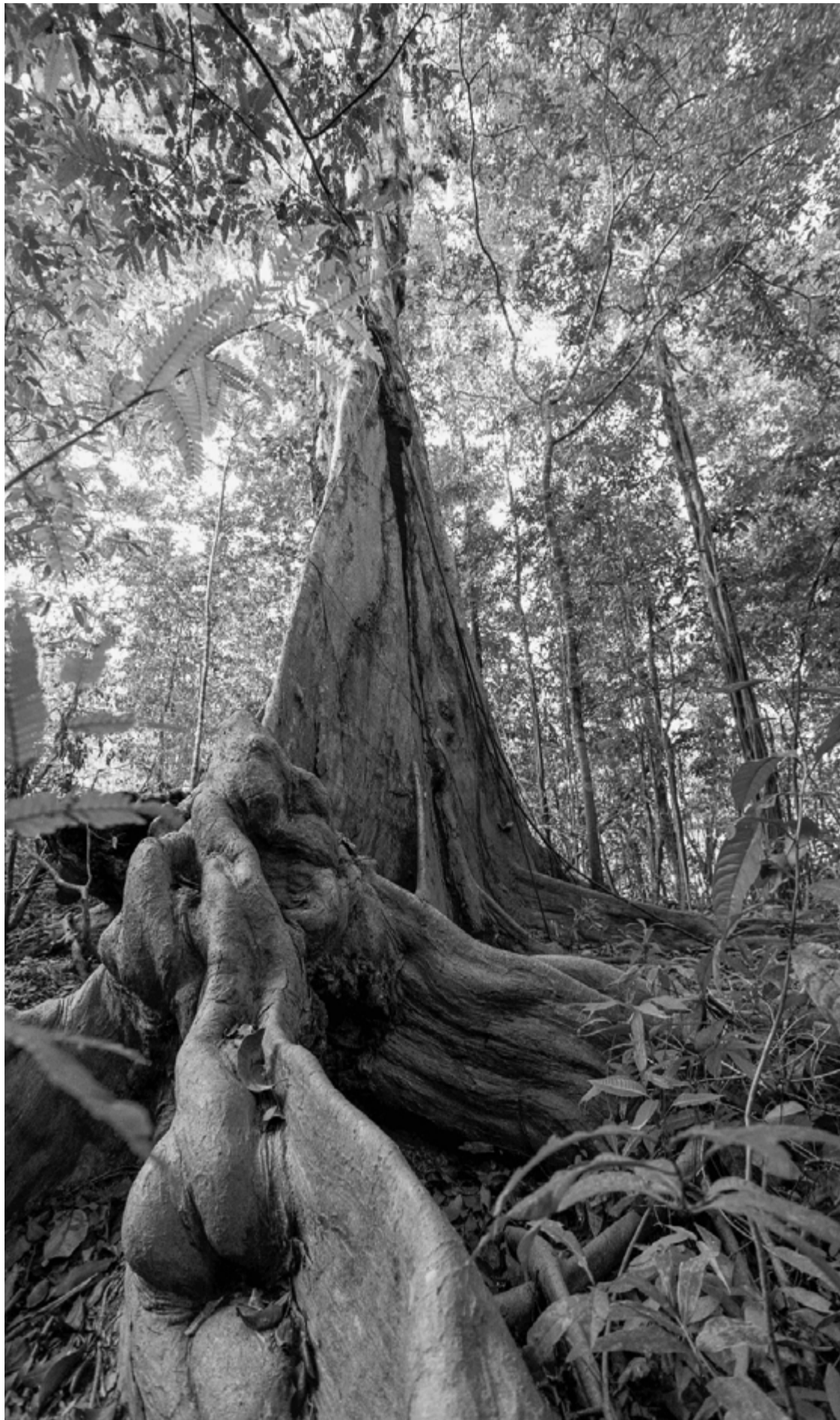
Goiana registrou fauna, flora e habitantes do Cerrado, Pantanal e Amazônia