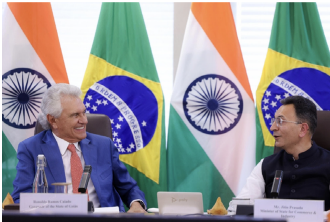
Governador Ronaldo Caiado e ministro Jitin Prasada (Índia e Comércio): possibilidades de negócios com Goiás

A Missão Índia segue até o dia 21 de fevereiro, com o objetivo de estreitar laços comerciais e atrair investimentos para