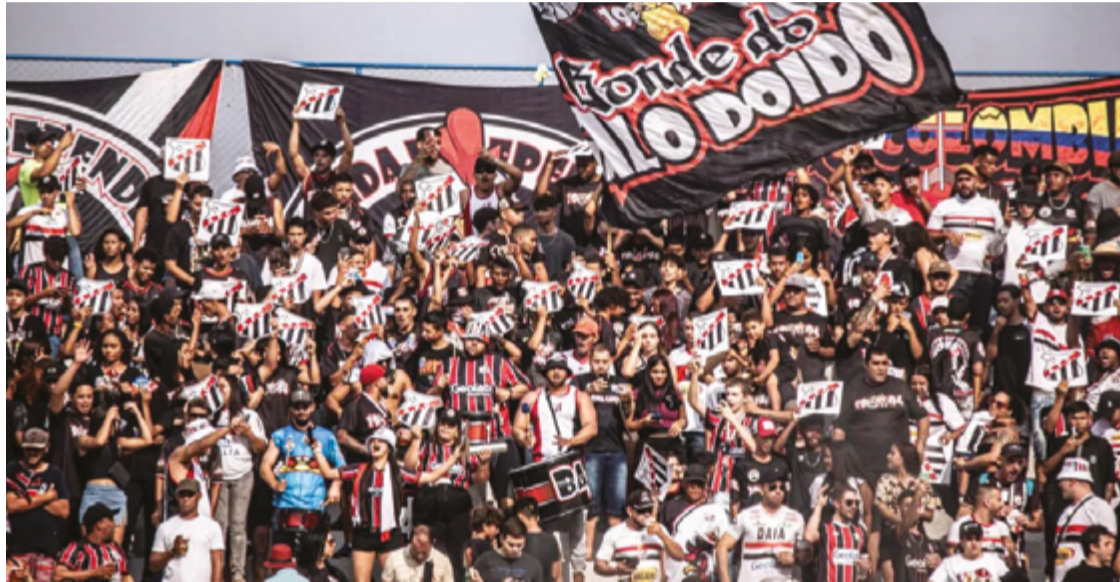
Torcida do Anápolis em jogo da equipe no estádio Jonas Duarte. Tricolores estão empolgados

A melhora do time no cenário do futebol começou a ser desenhada em 2019, quando disputou sua última edição da Divisão de Acesso. A partir desse momento, o Galo da Comarca iniciou uma ascensão que culminou no acesso histórico à Série C do Campeonato Brasileiro em 2024, após 16 anos afastado da terceira divisão nacional. A conquista, em uma disputa dramática contra o Iguatu-CE nos