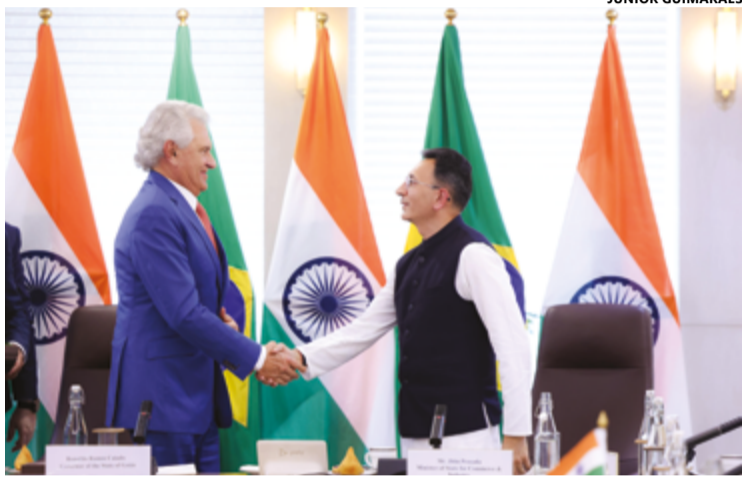
Governador de Goiás, Ronaldo Caiado, é recebido pelo ministro indiano de Comércio e Indústria, Jitin Prasada, em Nova Delhi

Programação inclui apresentações, painéis temáticos e rodadas de negócios durante a permanência da comitiva