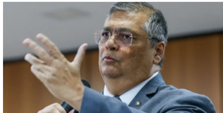
Ministro Flávio Dino do Supremo Tribunal Federal (STF)