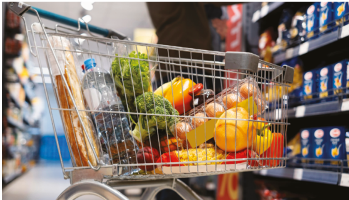
Produtos da cesta básica consomem mais de um terço da renda dos anapolinos, mostra Procon

Apesar de estar dentro da média, o valor da cesta básica tem um peso significativo no orçamento do trabalhador que recebe um salário mínimo. "Esse gasto impacta de forma relevante e negativa a renda, visto que existem outras despesas essenciais como moradia, saúde, educação e lazer. Muitas