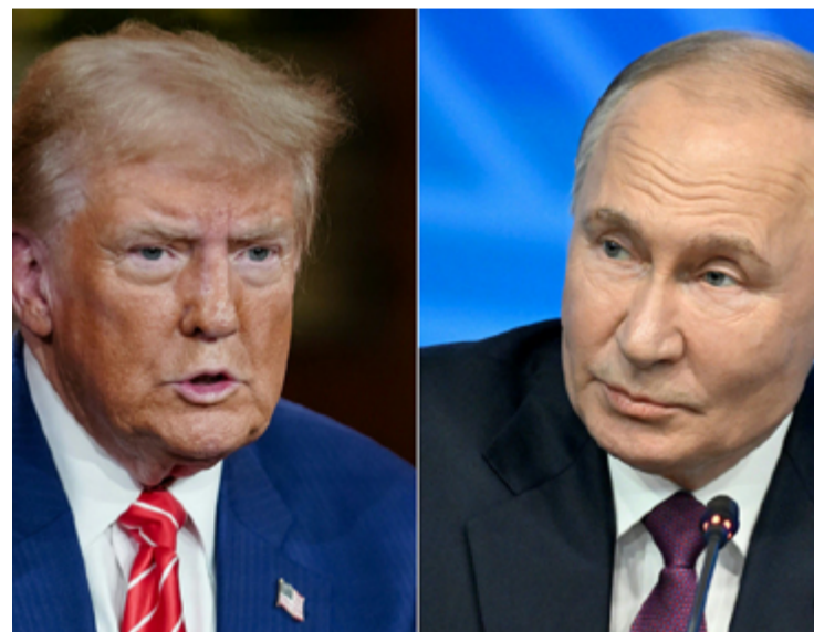
Trump revelou ter conversado por telefone com o presidente russo Vladimir Putin

A principal preocupação de Zelensky é garantir que a Ucrânia não seja excluída das discussões sobre seu próprio futuro. O líder ucraniano busca ativamente o diálogo com Trump para evitar um acordo que não leve em conta os interesses de seu país.