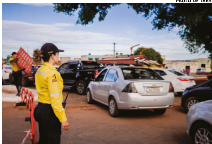
Modificação que permite acesso a partir da Rua Dona Andreolina trouxe mais problemas aos motoristas

"Esqueceram de ficar na BR 153, para quem vem do Lírios do Campo/trevo, muito perigoso. Formou uma fila dupla na BR 153 (no acostamento e na via direita da BR)", comentou um motorista sobre a situação, evidenciando o risco e o caos que a alteração causou no tráfego da região. Outro internauta