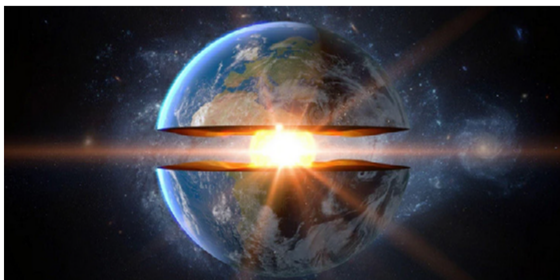
Pesquisadores descobrem transformações surpreendentes no coração do planeta

Esta descoberta representa um avanço significativo na compreensão da dinâmica interna do nosso planeta. Xiaodong Song, sismólogo da Universidade de Pequim não envolvido no estudo,