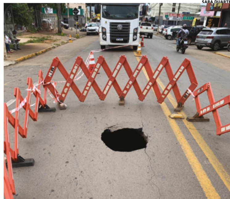
Cratera aberta na Avenida São Francisco, no Bairro Jundiá, é mais uma que mostra infraestrutura comprometida

Reis também destacou a necessidade de uma ação coordenada entre a Prefeitura e as empresas responsáveis pela infraestrutura da cidade, como a Saneago, para resolver o problema de drenagem de forma