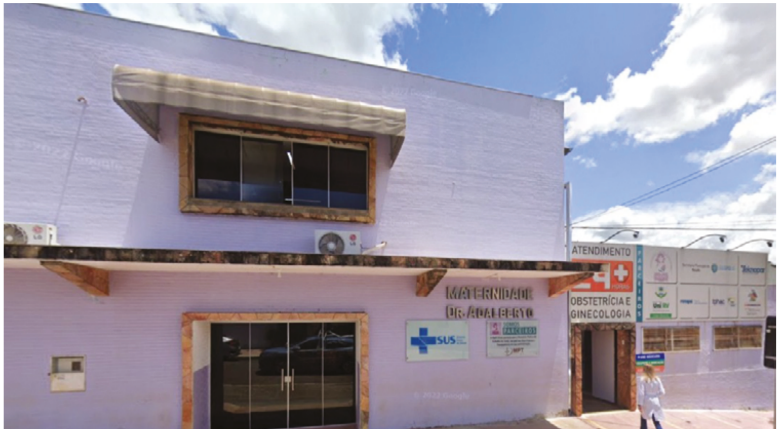
Maternidade Doutor Adalberto é responsável por 25% dos partos realizados na cidade