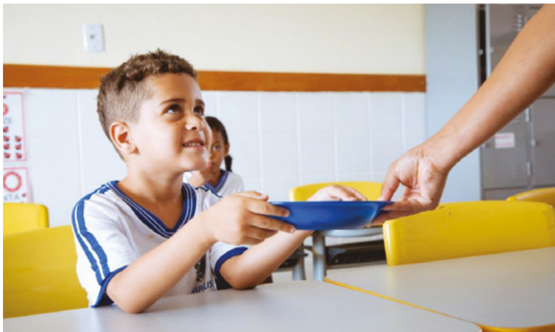
Famílias de estudantes reclamam da qualidade da merenda em diversas unidades

Os problemas ocorrem em meio a uma série de anúncios de mudanças no cardápio por parte da Prefeitura. No últi-