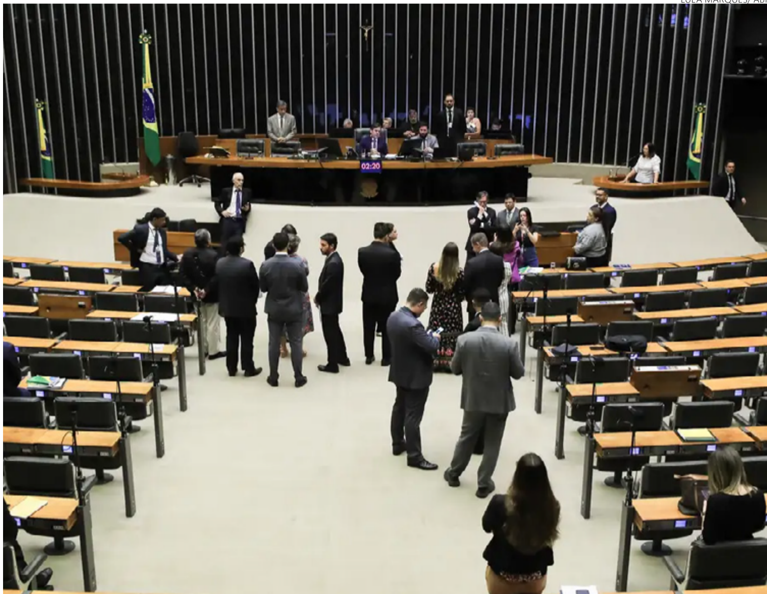
Bancada evangélica: nome surgiu durante promulgação da Constituição de 1988 com crescimento de grupo na política

De acordo com André Ítalo, a bancada tem crescido de maneira mais lenta, diferente do que ocorreu no final dos anos 1990 e em 2010. "É natural por-