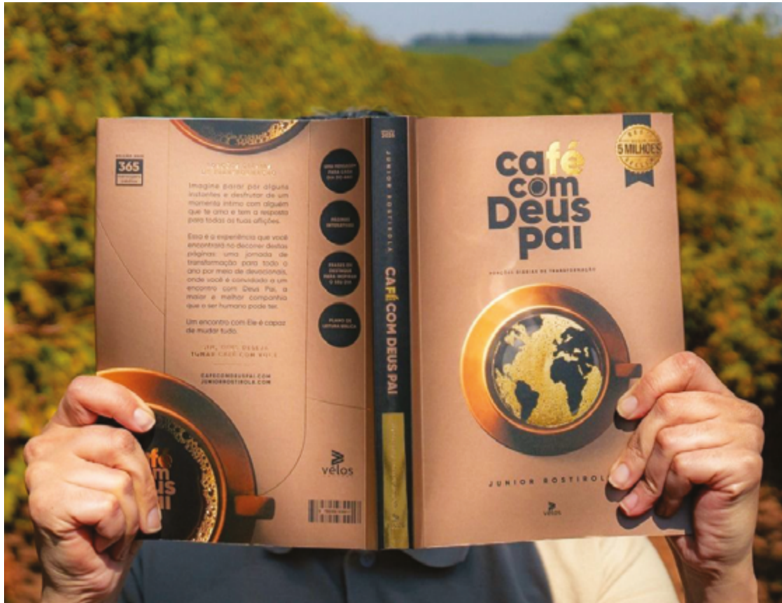
Obra tornou-se best seller e conquistou adeptos mesmo fora das igrejas cristãs

O livreiro destaca ainda que os devocionais atraem um público muito diversificado. "Não é só o público cristão que consome esse tipo de literatura. Muita gente que tem interesse por espiritualidade, reflexões diárias e mensagens de motivação também se identifica com esse formato. Além disso, existe um devocional para cada público: crianças, adolescentes, empresários, forças armadas, segurança pública, profissionais da saúde... O mer-