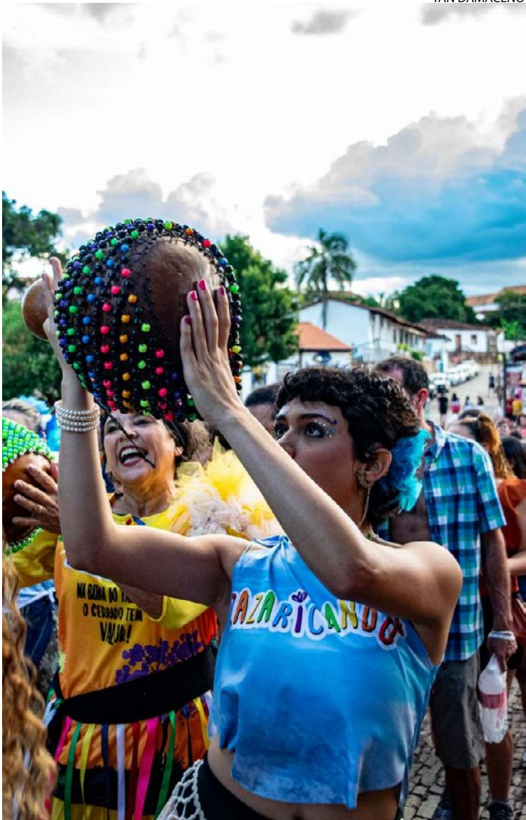
Zazaricando ocupa ruas históricas de Pirenópolis

Em Trindade, o Grito do Carnaval abre a programação noturna, seguido pelo Bloco das Virgens. Anhanguera e Inhumas mantêm programação contínua em seus circuitos.