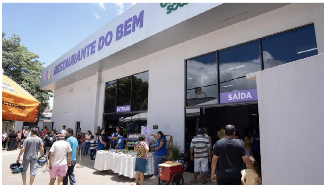
Nova unidade em Inhumas, na avenida Bernardo Sayão, oferecerá 550 refeições diárias a R$ 2