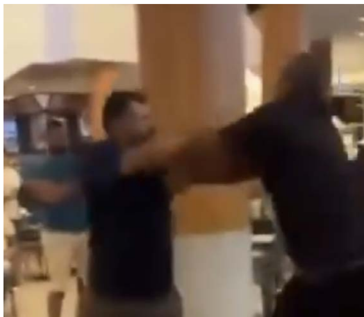
Conflito teve início após um dos homens questionar o outro no shopping

Equipe de segurança foi chamada para separar agressores. Eles se olharam e rolaram no chão