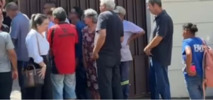
Moradores compareceram à casa do prefeito para prestar solidariedade e oferecer suporte à família do gestor