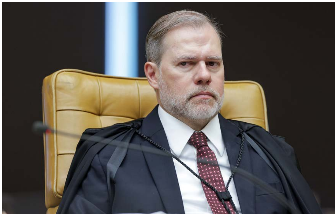
Ministro Dias Toffoli teria recebido recursos de investigados no caso Master

Fachin deve decidir primeiro sobre a eventual suspeição antes de redistribuir os demais pedidos de investigação. Embora a PF não tenha formalizado