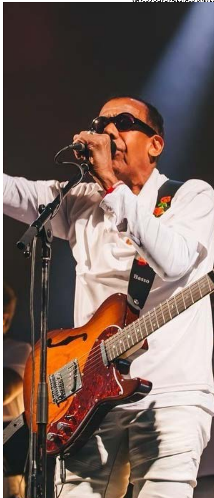
Compositor criou trilha sonora do orgulho nacional em discos clássicos

Ainda que seguisse para sempre como solitário homem-movimento — para usar expressão do crítico Pedro Alexandre Sanches —, tudo se transformaria em 1967. Foi quando enfiou-se na ala militante da MPB por apreciar o iê-iê-iê e miscigenar samba e música afro-americana.