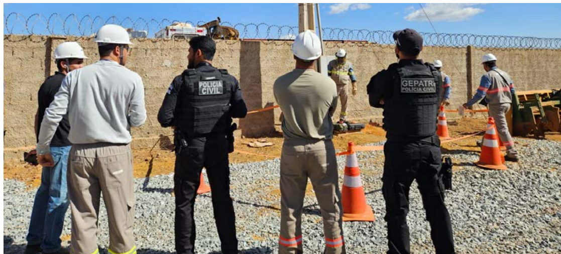
Luziânia é o município com o maior número de casos registrados em 2025