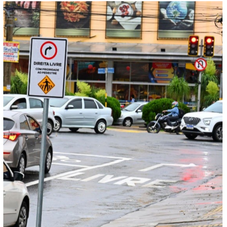
Estados Unidos utiliza a sinalização desde anos 1980: a Direita Livre ajuda a melhorar a fluidez do tráfego