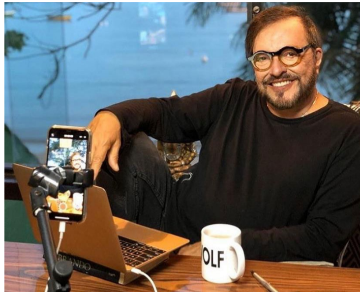
Goiano dirigiu mais de 30 novelas e minisséries na TV Globo