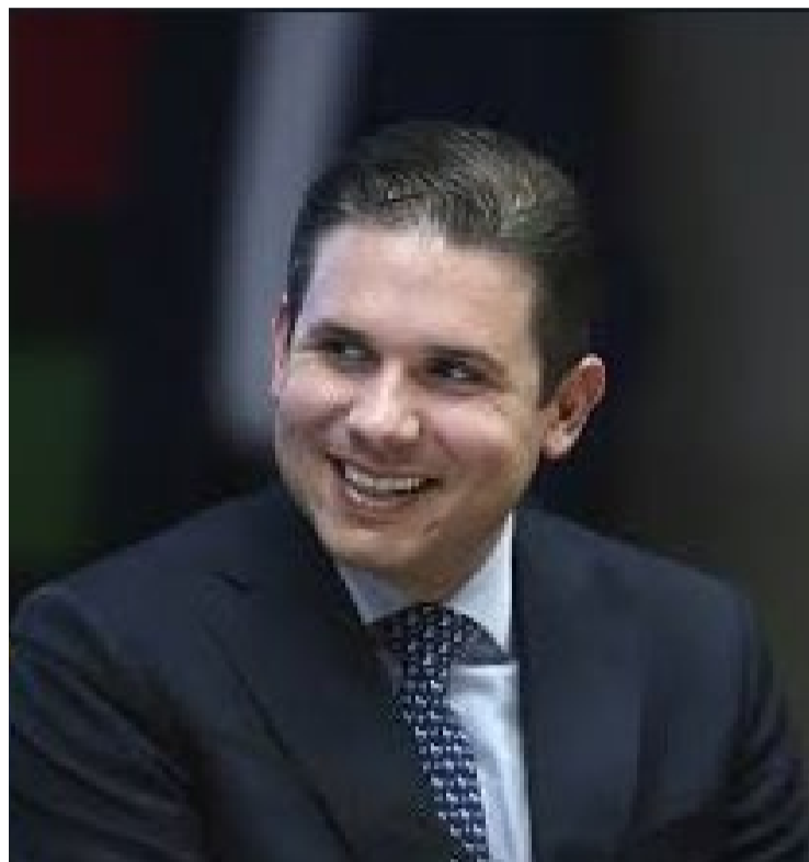
Hugo Motta, presidente da Câmara dos Deputados

Matéria já foi aprovada no Senado e na Comissão de Constituição e Justiça (CCJ) da Câmara, mas ainda depende de análise para ir a plenário