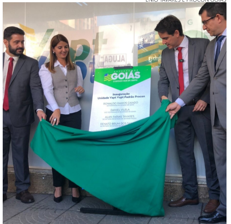
Inauguração da unidade Vapt Vupt - Padrão Procon: aumento na capacidade de atendimentos presenciais

No Vapt Vupt Padrão Procon serão disponibilizados serviços como consulta, denúncia e reclamação relacionadas ao Direito do Consumidor, além de guichês de atendimento das empresas Equatorial Energia e Claro, que já prestavam serviços na unidade e continuarão a fazê-lo. Para ser atendido na agência, exclusiva para serviços do Procon, é necessário realizar o agendamento prévio, por meio do Portal Expresso (go.gov.br). O horário de atendimento será das 8h às 17h.