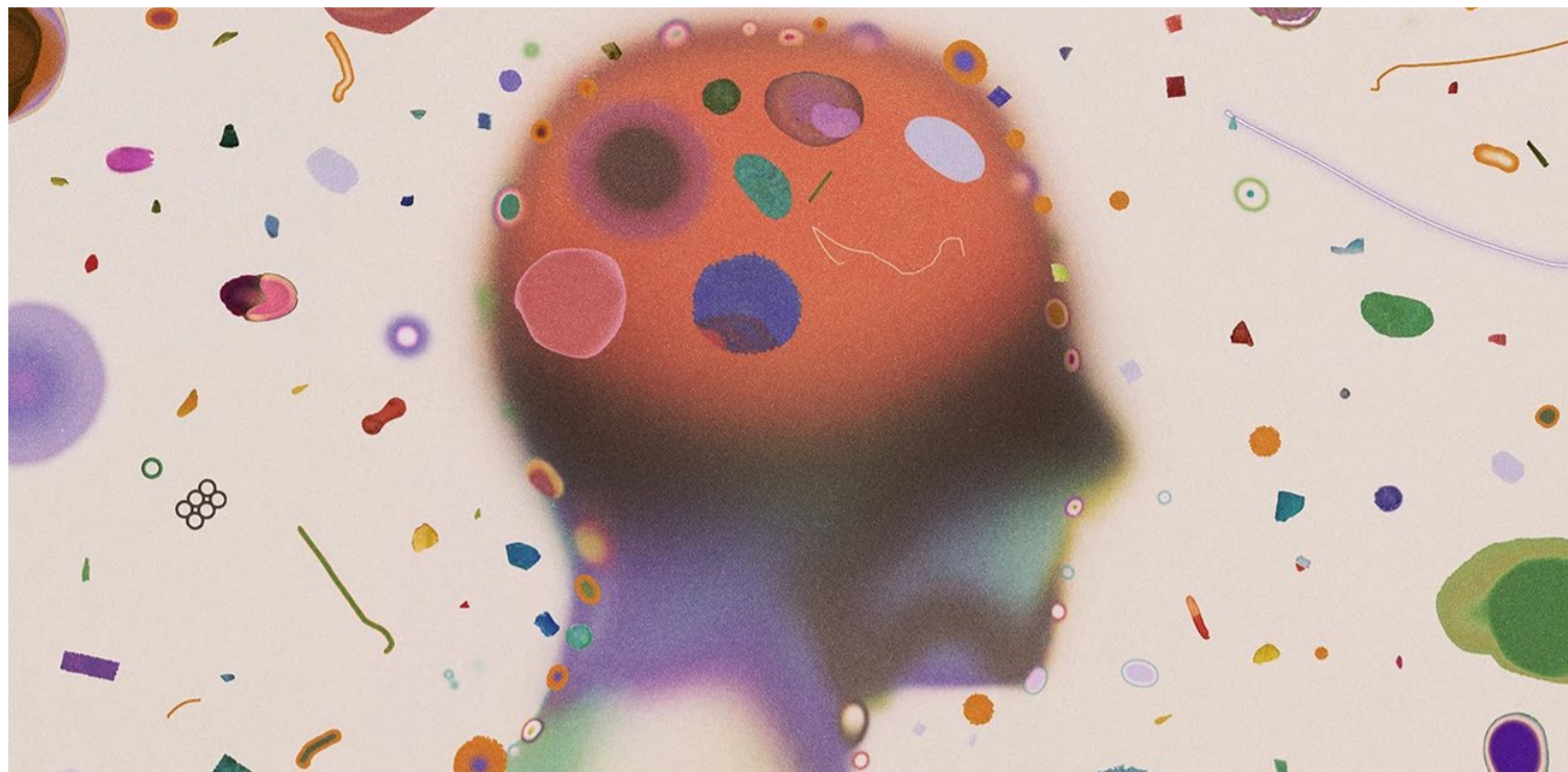
Presença de microplásticos no corpo humano tem se tornado uma preocupação crescente na comunidade científica