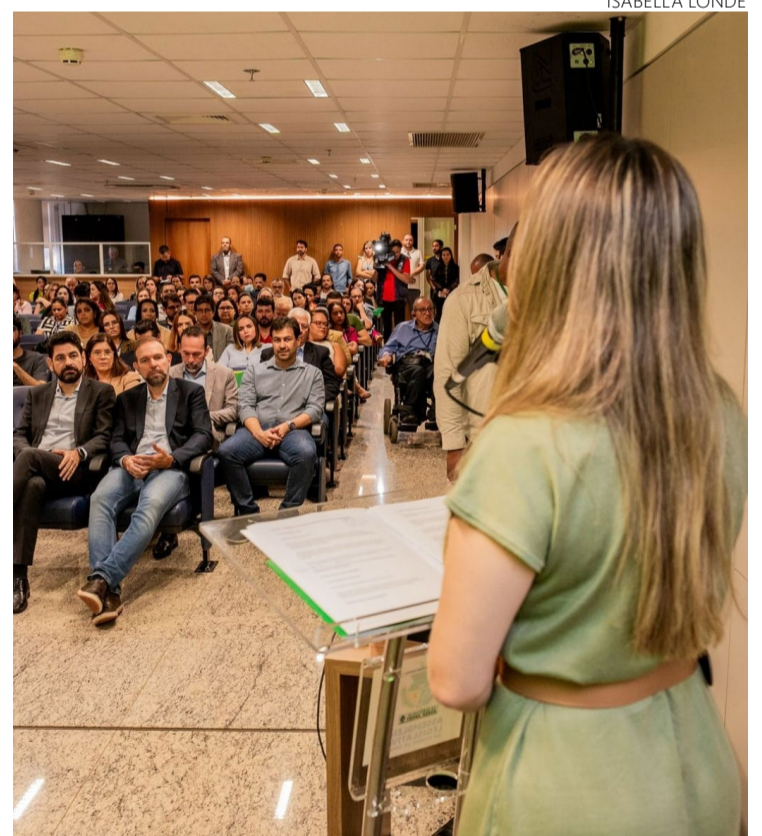
Lançamento do EmendasGo reuniu deputados estaduais, assessores parlamentares, autoridades e servidores públicos

Durante o evento, realizado na Assembleia Legislativa de Goiás, parlamentares e assessores receberam orientações detalhadas para a utilização do sistema, garantindo que estejam capacitados para explorar todo o potencial da ferramenta. O EmendasGO já está em operação e representa mais um compromisso do Governo de Goiás com a modernização da gestão pública, assegurando que cada indicação feita por meio das emendas parlamentares, gere impacto positivo na vida dos goianos.