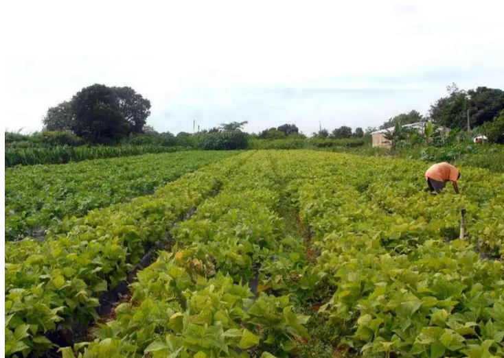
Goiás foi o segundo com o maior número de pedidos de recuperação judicial

Segundo levantamento realizado pela Serasa Experian, os pedidos de recuperação judicial por parte de produtores rurais cresceram 523.53% em 2024