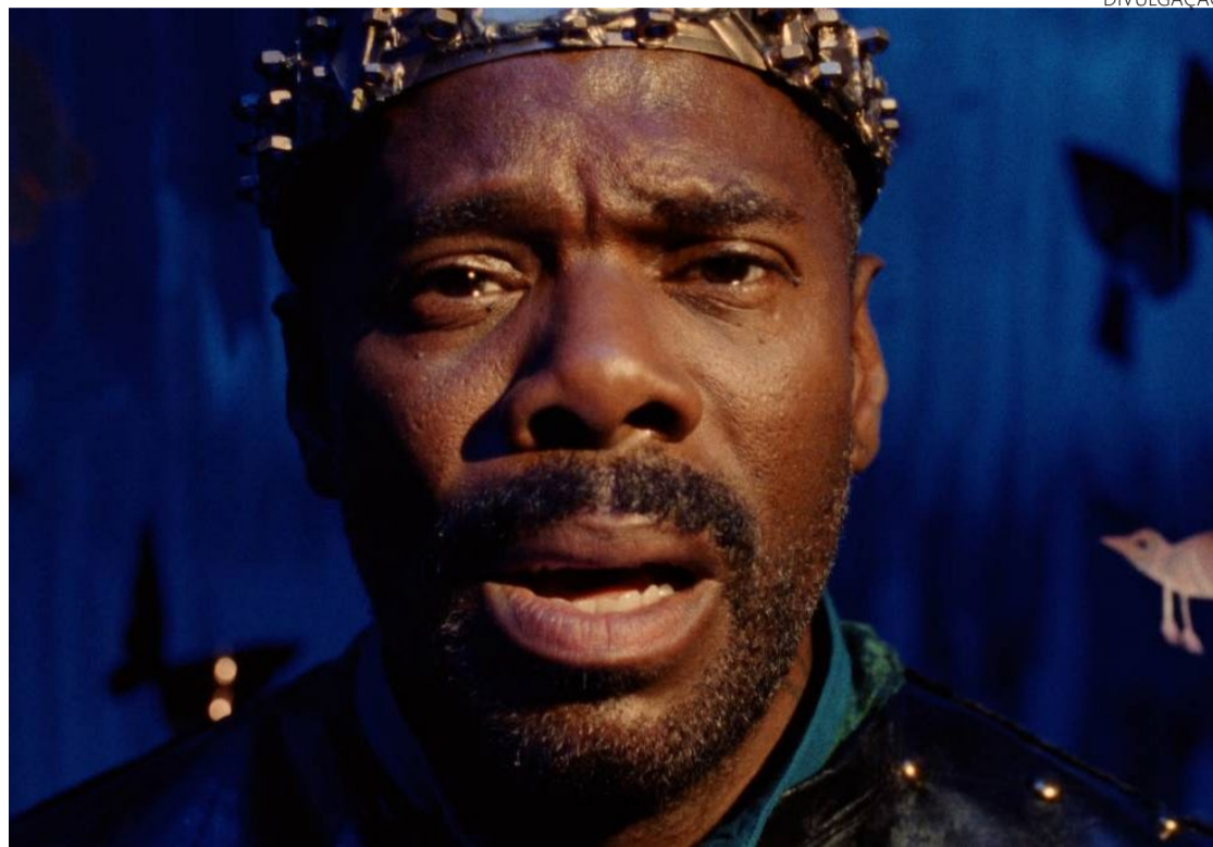
Ator Colman Domingo interpreta personagem Divine G em cena do longa-metragem

E alguns deles, como "Um Sonho de Liberdade", de Frank Darabont, de 1994, tocam tão profundamente as plateias que se tornam cults instantâneos. "Sing Sing" nunca chega a ter o nível de adesão do público como o longa de Darabont, mas segue a mesma linha, tentando apresentar o presídio como um local terrível, mas também capaz de propiciar momentos construtivos na vida dos internos. Proporcionado sobretudo