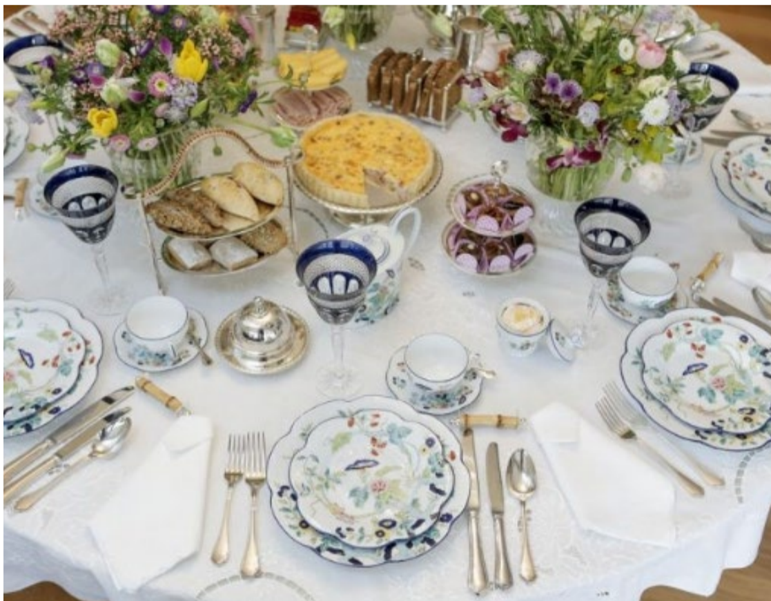
Espaço de convivência: mesa é local em que fazemos trocas culturais e sociais

Desde cedo, em nossas cozinhas, aprendemos a importância enriquecedora de cada detalhe à mesa. Conheça alimentos e bebidas que enriquecem gastronomia