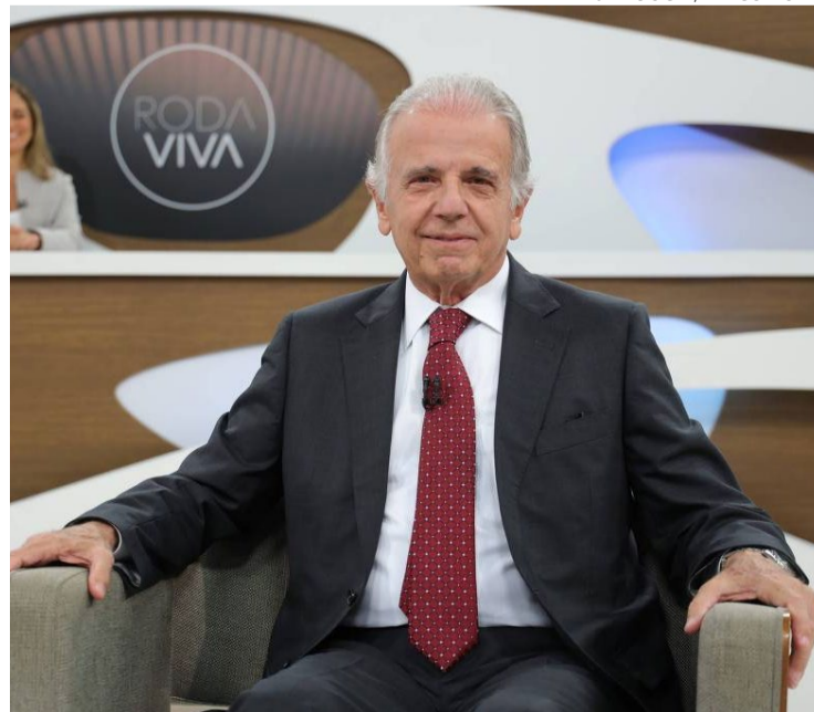
José Múcio Monteiro, ministro da Defesa: "deveria ter uma dosimetria"

"Ali tinha gente de todo o tipo, tinha os inocentes, tinha os baderneiros, tinha os baderneiros profissionais que foram só para quebrar, mas quebrar derrubava o governo? Quebrar? Havia algum movimento? As figuras que organizaram aquilo, que idealizaram, no dia não apareceram."