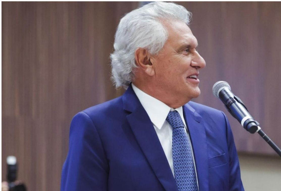
Ronaldo Caiado passa a ser nome viável da direita na disputa eleitoral contra Lula: terceiro na pesquisa

Em dois cenários testados, Caiado aparece como o segundo nome mais forte da direita, atrás apenas de Eduardo Bolsonaro (PL) - com a inelegibilidade, Jair Bolsonaro tentará emplacar um dos familiares em seu lugar. Mas no decorrer de uma campanha, com melhor