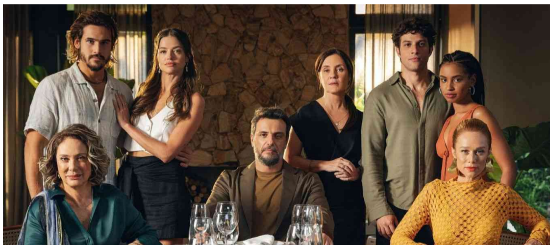
Enredo da elite: trama não convence com peripécias mirabolantes e trama sem veracidade

são elementos narrativos - muito drama, linguagem popular e uma história contada em capítulos. Já Mauro de Alencar, autor de “A Hollywood Brasileira”, diz que nenhuma obra com menos de 20 capítulos é uma novela.