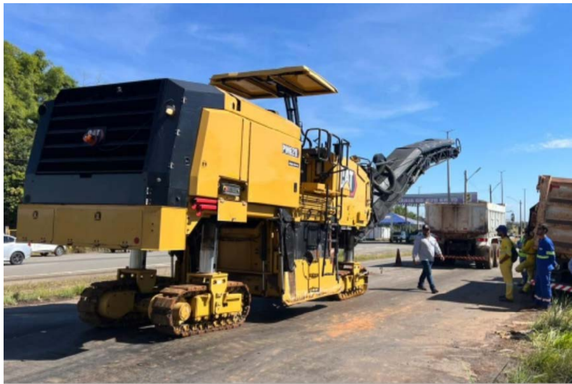
Primeira etapa dos serviços ocorre entre o posto da Polícia Rodoviária Estadual e a indústria Cielt

Com investimento de R$ 62,5 milhões, a restauração deve beneficiar diretamente moradores de Goiânia, Aparecida de Goiânia, Senador Canedo, Bela Vista de Goiás e Cristianópolis. Paralelamente, a Goinfra também