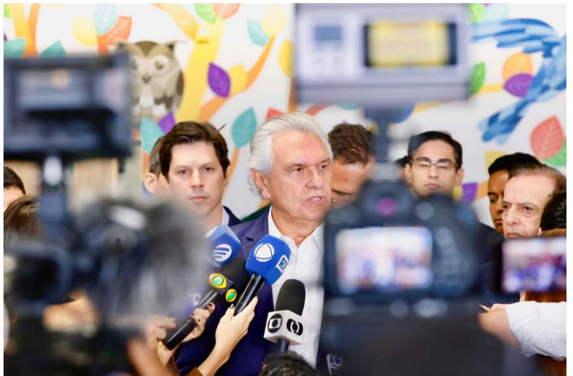
Ex-governador Ronaldo Caiado diz que Flávio perdeu força junto ao eleitorado

Nos últimos meses, Caiado também intensificou críticas ao governo federal, especialmente na