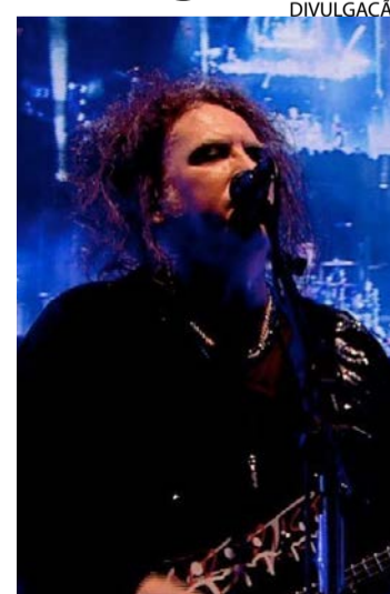
Smith solta a voz na faixa 'What's Wrong with Me'