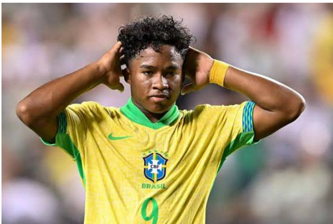
Expressão "Endrick titular" foi um dos temas mais debatidos pelos torcedores nas redes sociais

Em abril de 2025, Ancelotti chegou a fazer uma cobrança pública ao atacante após uma partida do Campeonato Espanhol. Na ocasião, criticou uma decisão tomada pelo brasileiro durante uma jogada ofensiva e afirmou que, em determinadas situações, o atleta precisava atuar de forma mais objetiva. A declaração repercutiu na imprensa espanhola e gerou questionamentos sobre o grau de confiança do trei-