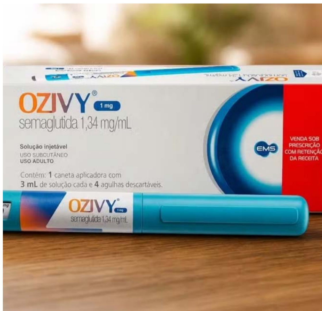
Farmacêutica produziu 500 mil canetas de semaglutida para mercado brasileiro

Esse caminho abreviado é permitido quando o princípio ativo já é amplamente conhecido, estudado e utilizado — como é o caso da semaglutida. Assim, a empresa pode aproveitar dados