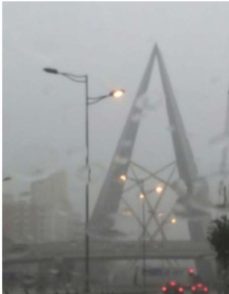
Forte tempestade com raios, trovões, ventos e chuva intensa atingiu também Goiânia

Entre os municípios incluídos no alerta estavam Goiânia, Aparecida de Goiânia, Anápolis, Rio Verde, Jataí, Luziânia, Catalão, Formosa, Senador