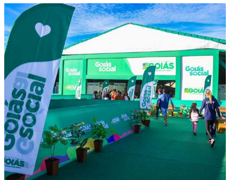
Goiás Social faz atendimentos no Entorno

Atualmente, o programa está presente em diversas cidades goianas e já serviu mais de 25 milhões de refeições desde sua criação, consolidando-se como uma das principais ações sociais do governo estadual.