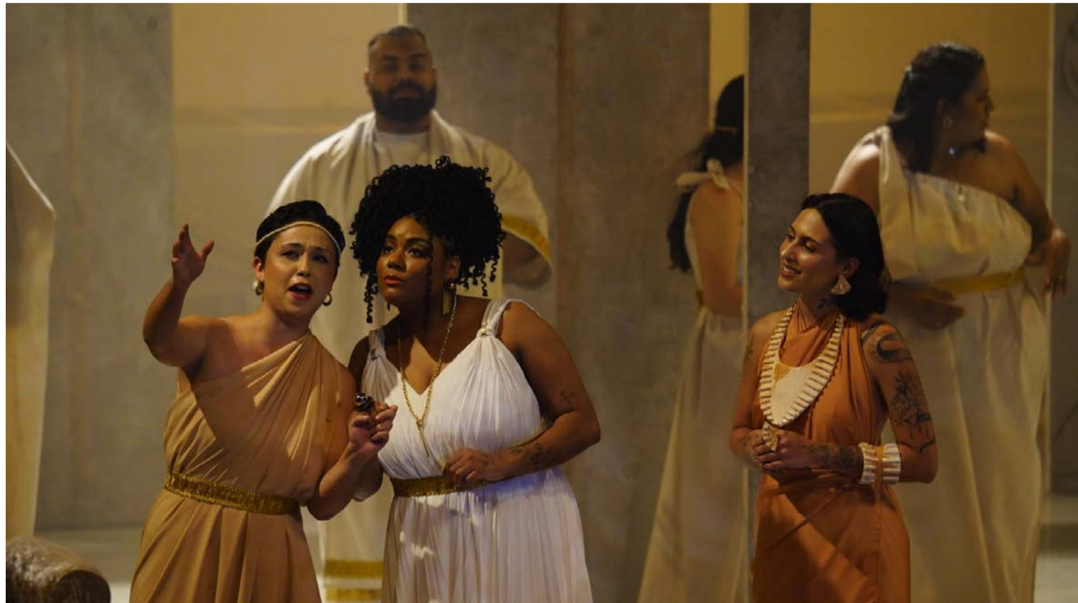
'La Traviata' se baseia no romance 'A Dama das Camélias', do escritor francês Alexandre Dumas Filho (1824-1895)