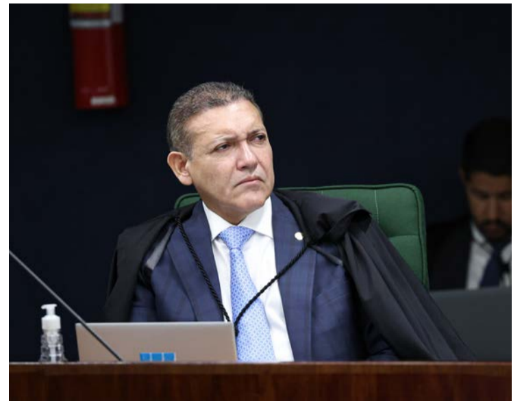
Ministro Kassio Nunes deu ganho de causa ao Estado de Goiás

Ministro Kassio Nunes determina discussão sobre repasses a média e alta complexidade da saúde